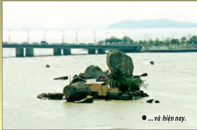
● ... và hiện nay.