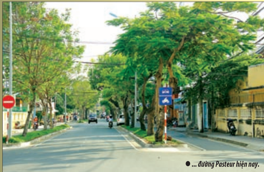
● ... đường Pasteur hiện nay.