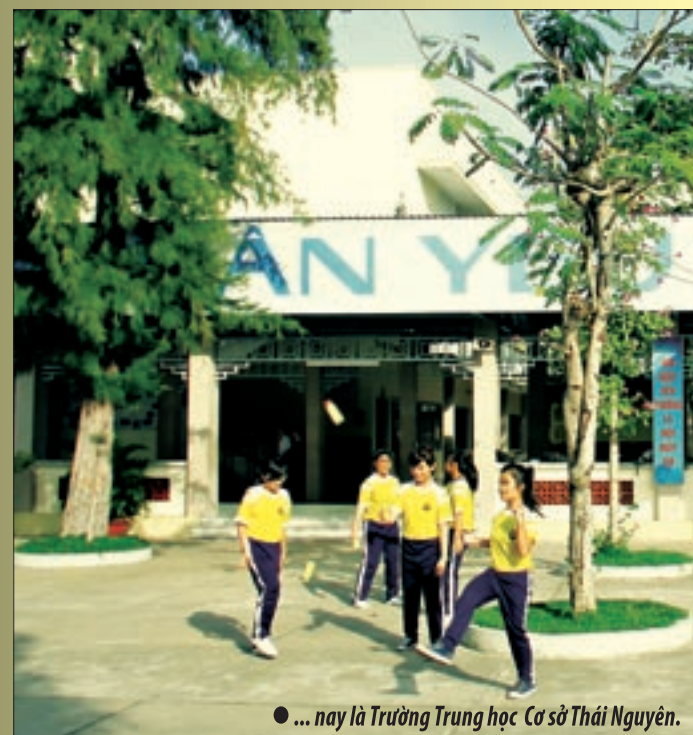
● ... nay là Trường Trung học Cơ sở Thái Nguyên.