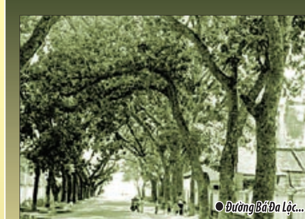
● Đường Bá Đa Lộc...