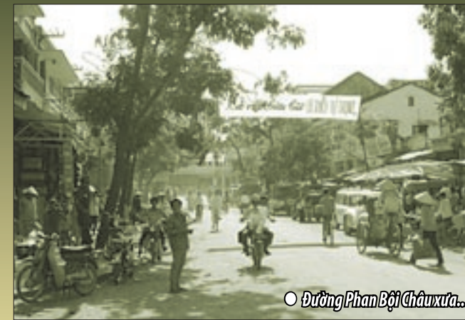
● Đường Phan Bội Châu xưa...