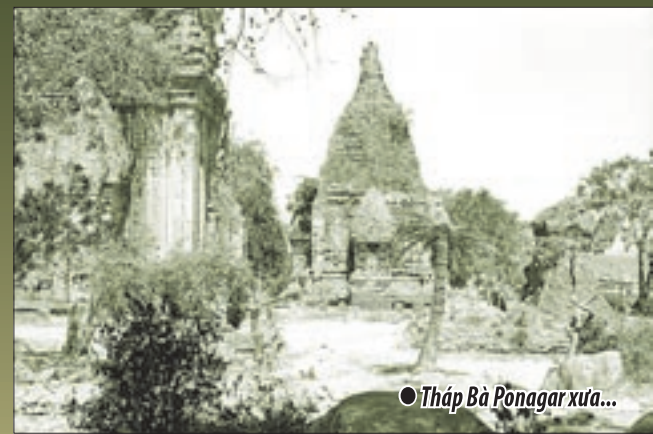
● Tháp Bà Ponagar xưa...