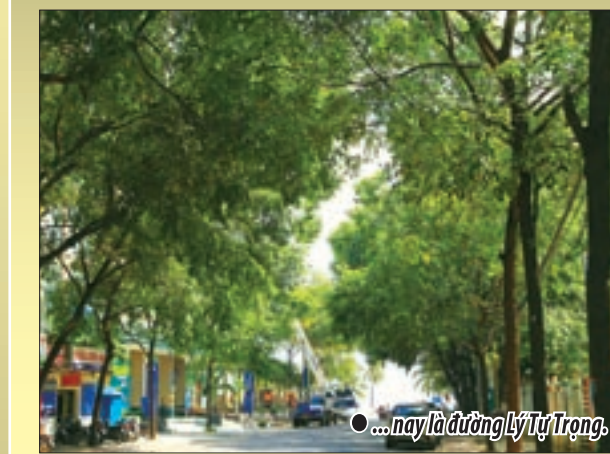
● ... nay là Đường Lý Tự Trọng.