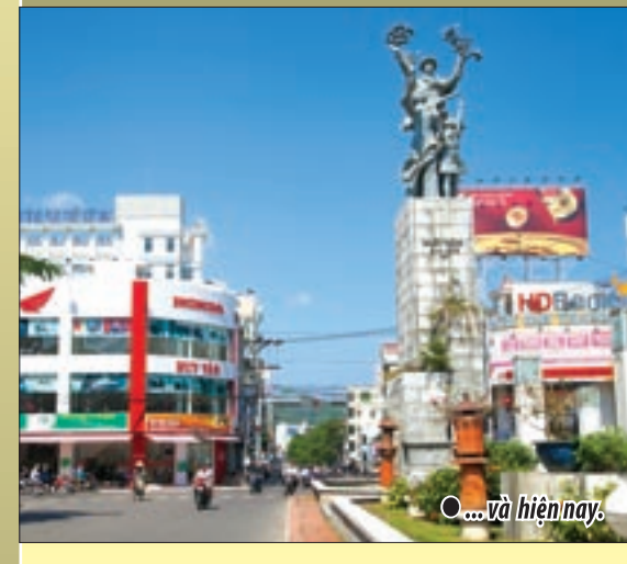
● ... và hiện nay.