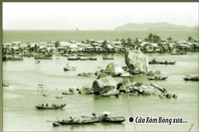
● Cửa Xóm Bóng xưa...