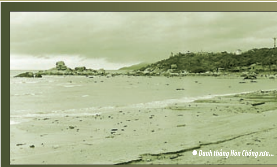
● Danh thắng Hòn Chông xưa...