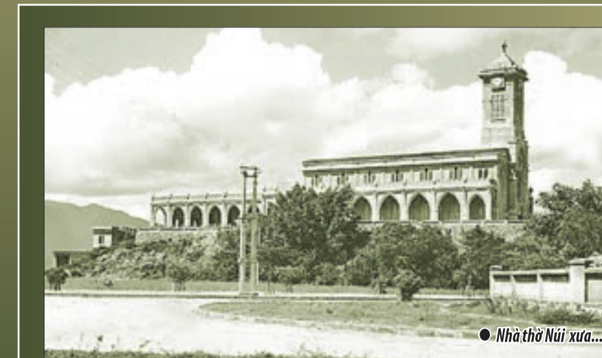
● Nhà thờ Núi xưa...