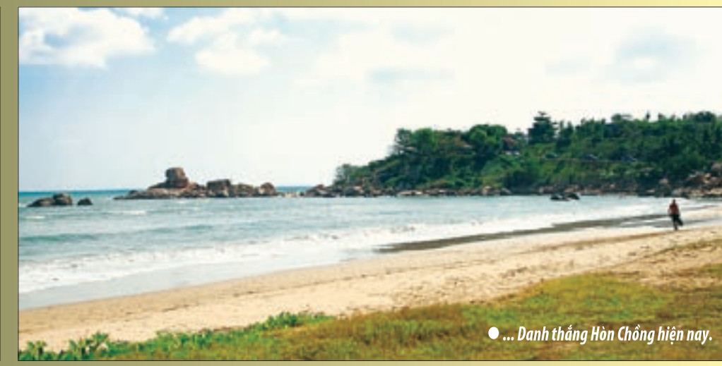
● ... Danh thắng Hòn Chông hiện nay.