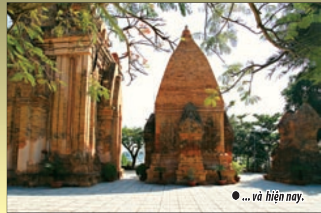
● ... và hiện nay.