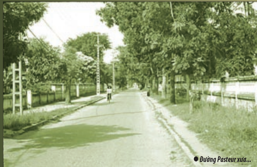
● Đường Pasteur xưa...