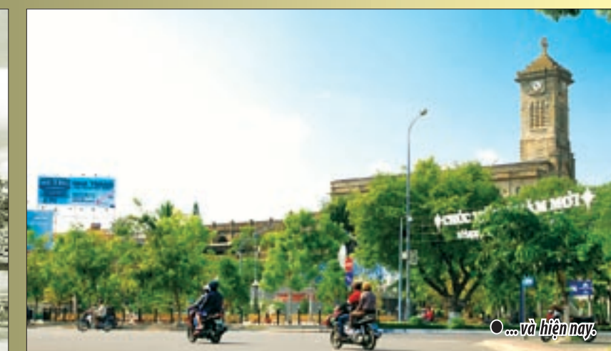
● ... và hiện nay.