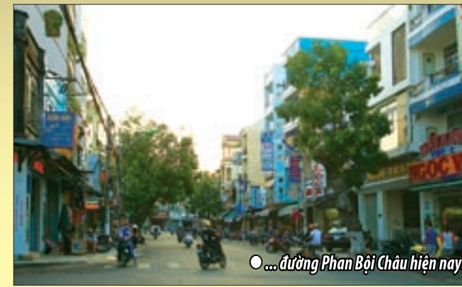
● ... đường Phan Bội Châu hiện nay.