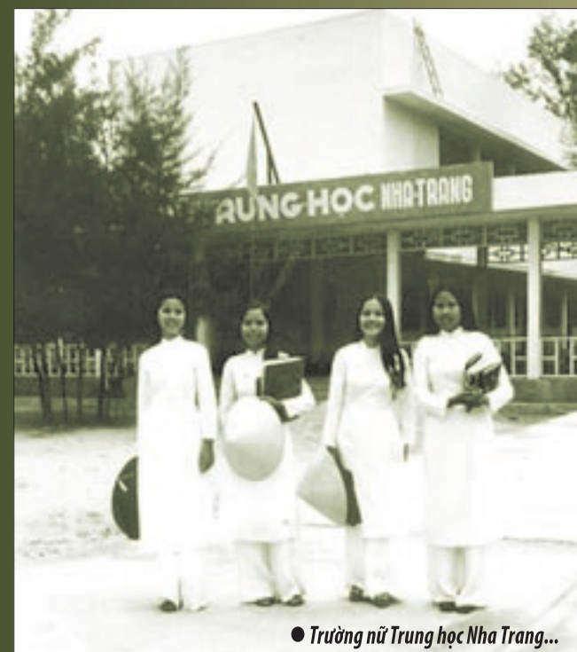
● Trường nữ Trung học Nha Trang...