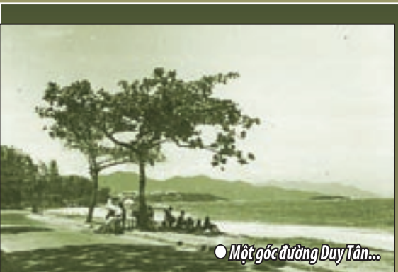
● Một góc đường Duy Tân...