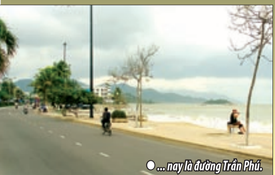
● ... nay là đường Trần Phú.