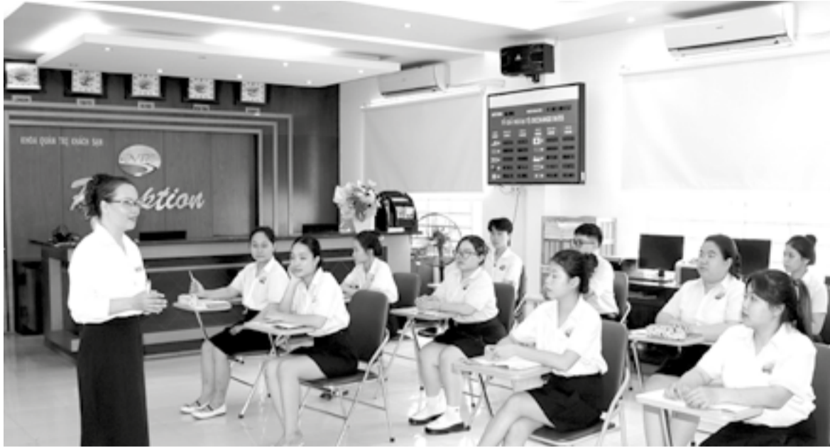
● Một giờ học của học sinh trung cấp nghề Trường Cao đẳng Du lịch Nha Trang.

Một lựa chọn khác dành cho HS hoàn thành chương trình THCS là tiếp tục học trình độ trung cấp tại các trường cao đẳng, trung cấp trên địa bàn tỉnh. Nếu có nhu cầu, HS có thể đăng ký vừa học trung cấp vừa học chương trình GDTX cấp THPT ngay tại các trường cao đẳng và trung cấp có chức năng GDTX. Hiện nay, trên địa bàn tỉnh có 3 trường cao đẳng và 7 trường