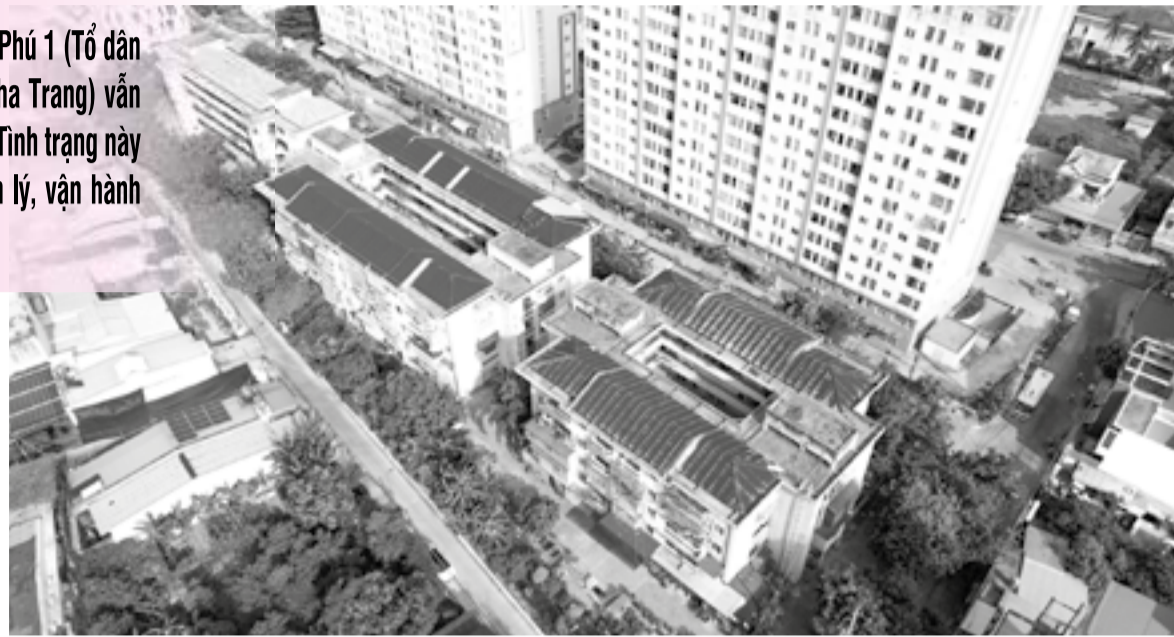
● Chung cư Bình Phú 1 gồm 3 khối nhà với 150 căn hộ.

Ông Võ Văn Hiếu - Tổ trưởng Tổ dân phố 11 Hòa Trung cho biết, hiện có khoảng 120 hộ dân thường