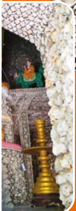
● Các bức tường trong tháp được trang trí công phu bằng san hô, vỏ ốc và vỏ sò.

không dùng cốt thép để tránh hiện tượng ăn mòn do muối trong san hô; còn vỏ ốc, vỏ sò được ốp bên ngoài nhằm tạo điểm nhấn thẩm mỹ. Vào các dịp lễ, Tết, lượng khách đến tham quan có thể đạt khoảng 50.000 lượt mỗi ngày. Nhiều người tìm đến không chỉ để chiêm bái mà còn để tận mắt ngắm nhìn công trình kiến trúc độc đáo hiếm có.