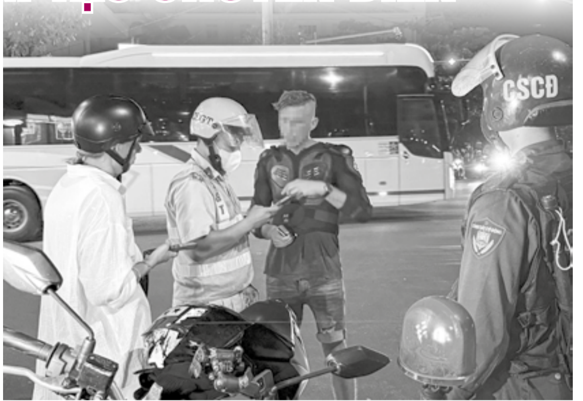
● Lực lượng Cảnh sát giao thông dùng kiểm tra phương tiện do người nước ngoài điều khiển trên đường Phạm Văn Đồng.

Theo báo cáo của Phòng Cảnh sát giao thông, ngày 18-5, đơn