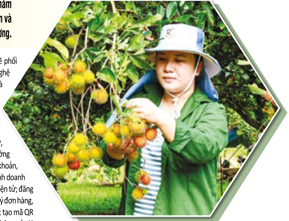
● Nông dân chăm chút nông sản để chuẩn bị tham gia Tuần lễ Nông sản và sản phẩm OCOP tỉnh Khánh Hòa năm 2026.

Tuần lễ sẽ có khoảng 50 gian hàng, tạo nên một không gian trưng bày đa sắc màu, đậm hương vị các vùng miền. Trong đó, sản phẩm của hội viên nông dân đến từ 48 xã sẽ được trưng bày tại 10 gian hàng; số còn lại là gian hàng của các doanh nghiệp, hợp tác xã trong và ngoài tỉnh. Đặc biệt, sự góp mặt của các gian hàng đến từ Hội Nông dân các tỉnh như: Lâm Đồng, Lào Cai, Đắk Lắk với những đặc sản vùng cao sẽ góp phần làm phong phú thêm không gian trưng bày, thể hiện tinh thần liên kết vùng ngày càng chặt chẽ.