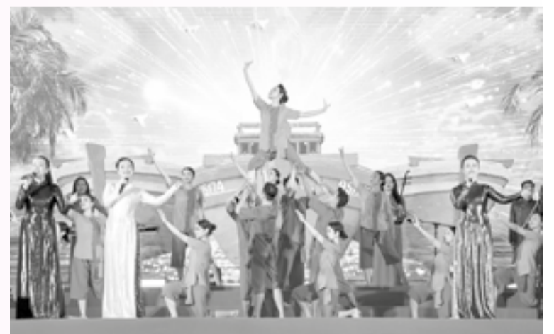
● Các ca sĩ của Nhà hát Nghệ thuật truyền thống tỉnh thể hiện ca khúc về quê hương Khánh Hòa trong một chương trình nghệ thuật.

Đối tượng tham gia cuộc thi là công dân Việt Nam, người có quốc tịch nước ngoài đang sinh sống, học tập, làm việc tại Việt Nam. Mỗi tác giả, nhóm tác giả có thể tham gia nhiều tác phẩm dự thi, nhưng chỉ được nhận tiền thưởng cho 1 giải thưởng có giá trị cao nhất. Các tác phẩm tham gia cuộc thi là sáng tác chưa đạt giải bất kỳ cuộc thi hoặc cuộc vận động nào và thỏa mãn các điều kiện theo thể lệ cuộc thi do Ban tổ chức ban hành.