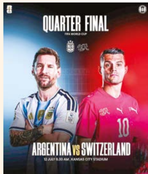
● Trận tứ kết giữa Argentina gặp Thụy Sĩ.

Trong khi đó, đội tuyển Thụy Sĩ cũng đang viết nên câu chuyện cổ tích của riêng mình. Lần đầu tiên kể từ năm 1954, Thụy Sĩ lọt vào tứ kết World Cup và 2 chiến thắng liên tiếp ở vòng knock-out