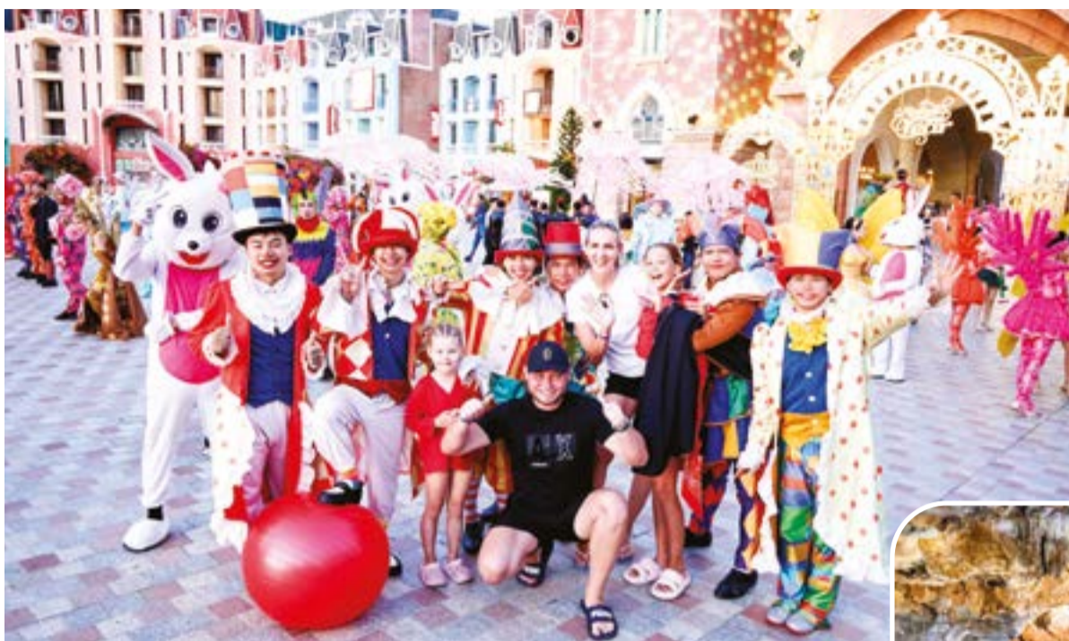
● VinWonders Nha Trang - điểm đến yêu thích của khách du lịch.

cận các thị trường khách du lịch chi tiêu cao từ các tỉnh phía nam, đặc biệt là khách quốc tế. Bên cạnh đó, việc mở liên tiếp 2 đường bay trong cùng 1 ngày làm gia tăng hiệu quả kết nối khép kín chuỗi đường bay Hà Nội - Đồng Hới - Cam Ranh của Sun PhuQuoc Airways. Từ đây tạo thuận lợi cho việc đưa khách du lịch quốc tế từ Thủ đô Hà Nội đến với Quảng Trị, các tỉnh miền Trung kết nối với tỉnh Khánh Hòa để hình thành sản phẩm du lịch đặc trưng khám phá con đường di sản miền Trung - một hành trình đa trải nghiệm. Đường bay mới Đồng Hới - Cam Ranh cũng sẽ tạo động lực cho các hãng hàng không khác nghiên cứu, mở thêm các đường bay mới đến Cảng hàng không Đồng Hới trong thời gian tới. Đây là bước chuẩn bị các hoạt động đầu tiên của chuỗi hoạt động Năm Du lịch quốc gia - Quảng Trị 2027, hướng tới mục tiêu đưa tỉnh Quảng Trị trở thành trung tâm du lịch của Việt Nam trong thời gian tới.