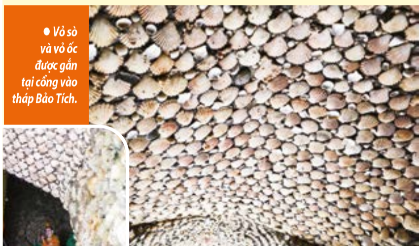
● Vỏ sò và vỏ ốc được gắn tại cổng vào tháp Bảo Tích.

Ở chiều ngược lại, du khách từ Quảng Trị đến Khánh Hòa là bước chân tới "Thiên đường du lịch biển đảo" với những khu du lịch, resort, khách sạn cao cấp ở các vịnh: Vân Phong, Nha Trang, Cam Ranh, Vĩnh Hy; cùng những di sản văn hóa đặc sắc bao gồm văn hóa biển đảo, văn hóa núi rừng,