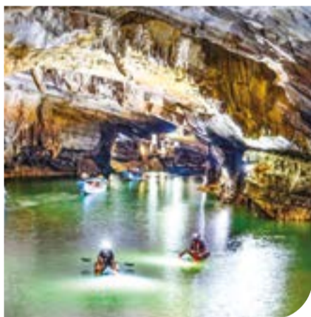
● Vẻ đẹp các hang động ở tỉnh Quảng Trị.

Ở chiều ngược lại, du khách từ Quảng Trị đến Khánh Hòa là bước chân tới "Thiên đường du lịch biển đảo" với những khu du lịch, resort, khách sạn cao cấp ở các vịnh: Vân Phong, Nha Trang, Cam Ranh, Vĩnh Hy; cùng những di sản văn hóa đặc sắc bao gồm văn hóa biển đảo, văn hóa núi rừng,