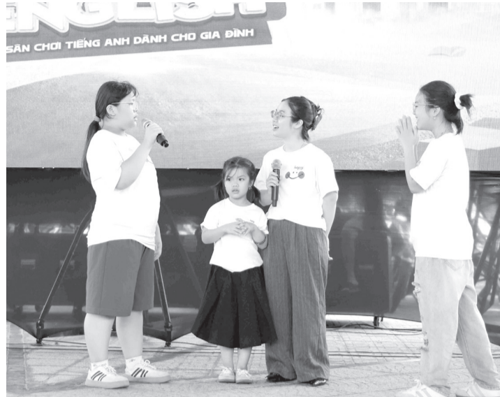
● Các bạn trẻ hào hứng tham gia cuộc thi Gia đình nói tiếng Anh tại Ngày hội tiếng Anh Khánh Hòa năm 2026.

Một trong những kết quả nổi bật trong giai đoạn 4 là việc thành lập thêm nhiều CLB tiếng