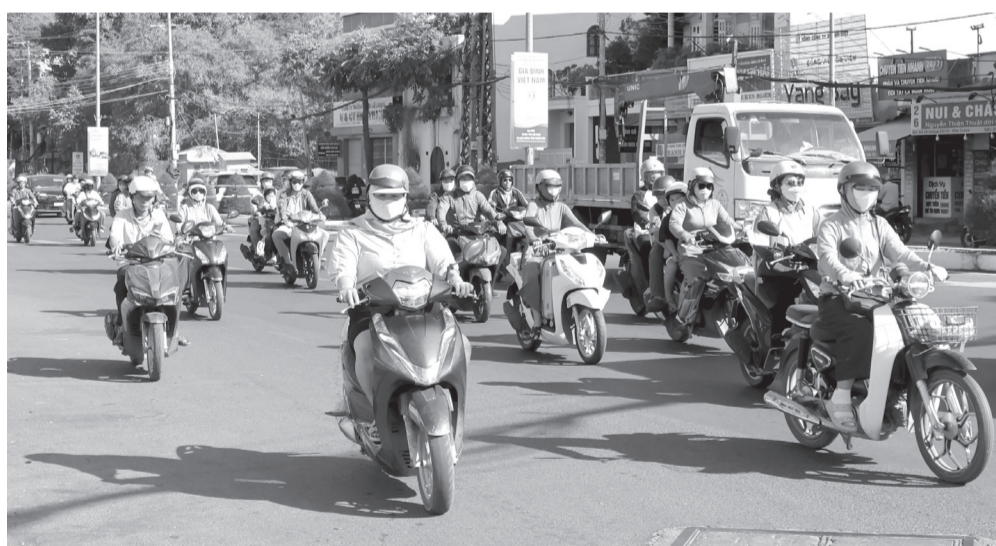
● Xe mô tô, xe gắn máy lưu thông khu vực đường 23 tháng 10 (phường Tây Nha Trang).