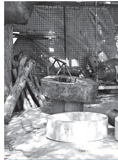
● Nghệ nhân Phú Bình Đôn

Ngay từ khi còn nhỏ, ông Phú Bình Đôn đã theo cha lên rừng tìm gỗ, chọn da, học cách chế tác và biểu diễn các loại nhạc cụ truyền thống của người Chăm. Từ những bài học đầu đời ấy, tình yêu với âm nhạc dân gian đã gắn bó với ông suốt cuộc đời. Ở tuổi ngoài 80, khi nhiều người đã nghỉ ngơi bên con cháu, ông vẫn đều đặn chế tác trống, làm kèn và tham gia biểu diễn trong các nghi lễ của cộng đồng. Với ông, đó không chỉ là công việc mà còn là