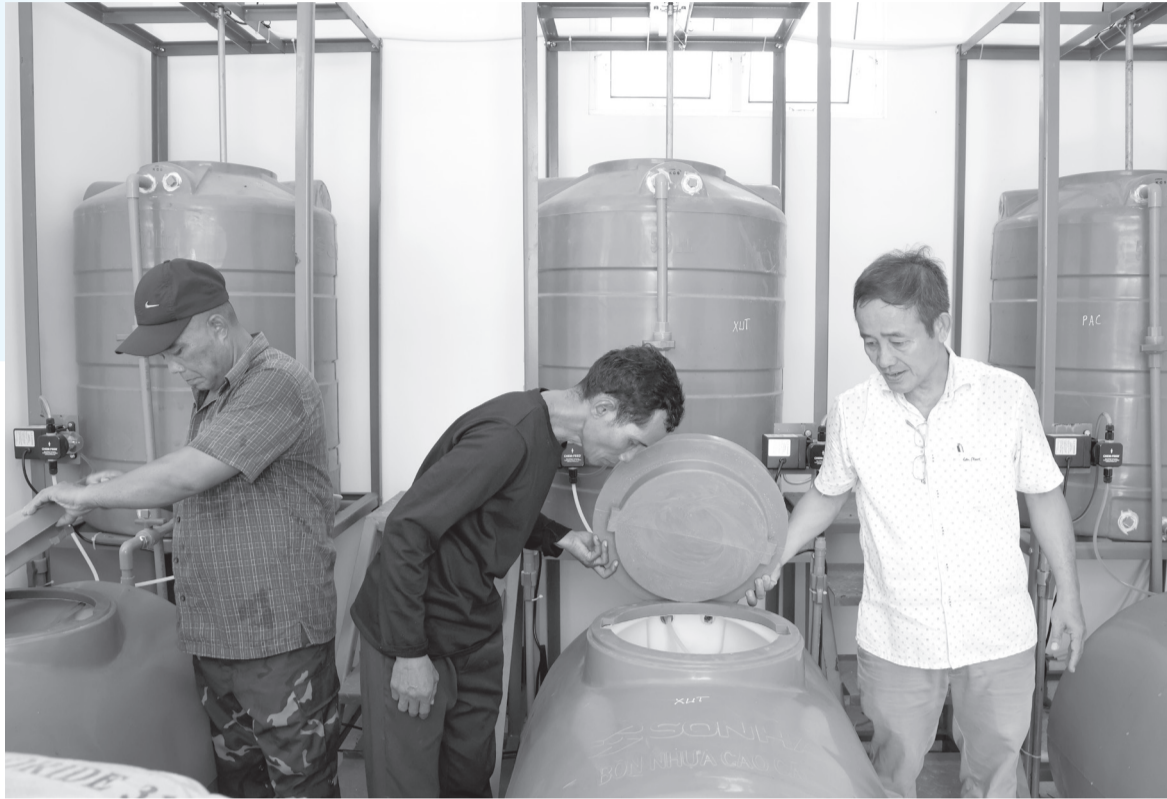
● Kiểm tra hệ thống xử lý nước tại thôn Tà Gộc, xã Tây Khánh Vinh.

sau đợt lũ năm 2025, một số tuyến ống của hệ thống bị hư hỏng, làm gián đoạn việc cấp nước cho một số hộ dân. Đơn vị đang khẩn trương sửa chữa, khắc phục để bảo đảm hệ thống vận hành ổn định. Sau khi hoàn thiện, công trình sẽ thực hiện thu tiền sử dụng nước theo phương án đã được cấp có thẩm quyền phê duyệt, với mức giá hơn 2.900 đồng/m 3 . Nguồn kinh phí này sẽ phục vụ công tác quản lý, duy tu, bảo dưỡng công trình, góp phần duy trì hoạt động bền vững, đồng thời nâng cao ý thức sử dụng nước sạch tiết kiệm, hiệu quả của người dân.