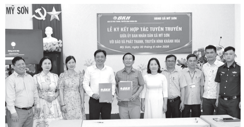
● Báo và Phát thanh, Truyền hình Khánh Hòa và UBND xã Mỹ Sơn ký kết biên bản ghi nhớ phối hợp tuyên truyền.

Bên cạnh đó, Báo và Phát thanh, Truyền hình Khánh Hòa sẽ ưu tiên đăng tải, phát sóng các tin, bài, phóng sự của đội ngũ cộng tác viên địa phương khi bảo đảm chất lượng; hỗ trợ bồi dưỡng nghiệp vụ báo chí, kỹ năng viết tin, chụp ảnh, quay phim và sản xuất các sản phẩm truyền thông cho cán bộ Phòng Văn hóa - Xã hội, Trung tâm Dịch vụ, sự nghiệp công của xã. 2 đơn vị cũng sẽ thường xuyên