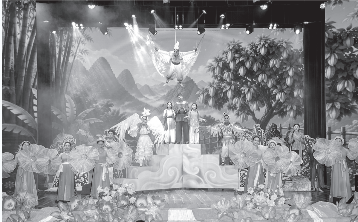
● Vở diễn được đầu tư cảnh trí, trang phục, đạo cụ sinh động, đẹp mắt.

Đầu tư và làm mới từ nội dung đến hình thức vở diễn theo hướng nhẹ nhàng, hài hước, sôi nổi để phù hợp với thị hiếu của khán giả nhỏ tuổi nhưng các em vẫn cảm nhận được nội dung câu chuyện, ý tưởng nghệ thuật là những kết quả tích cực bước đầu của vở diễn “ Ăn khế trả vàng ”. Vở diễn nằm trong chương trình sân khấu thiếu nhi “ Dung dăng dung dè ” do Nhà hát Nghệ thuật truyền thống (NTTT) tỉnh thực hiện.