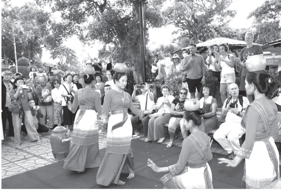
● Du khách xem tiết mục múa Chăm tại Di tích quốc gia đặc biệt Tháp Bà Pô Nagar.