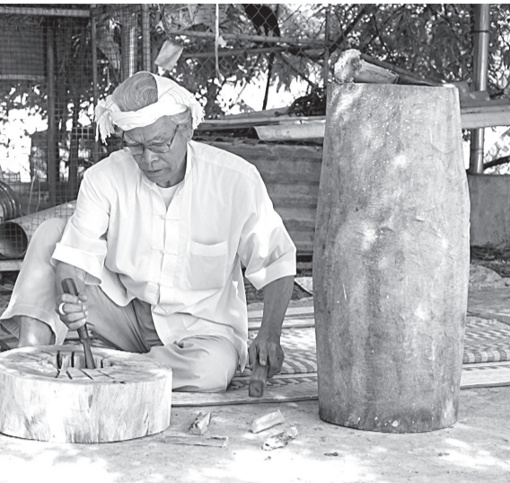
Chế tác trống paranung.