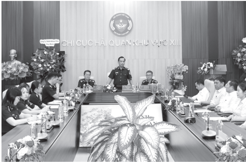
● Quang cảnh hội nghị.

Kết luận hội nghị, lãnh đạo Chi cục Hải quan khu vực XIII khẳng định cơ quan Hải quan luôn sẵn sàng lắng nghe, trực tiếp tháo gỡ các vướng mắc phát sinh trong quá trình làm thủ tục, đồng thời cam kết tiếp tục cắt giảm thời gian thông quan; nâng cao hiệu quả quản lý nhằm xây dựng môi trường đầu tư kinh doanh thông thoáng, lành mạnh cho DN. Bên cạnh đó, lãnh đạo chi cục cũng mong muốn trong thời gian tới, DN cần bố trí nhân lực để nghiên cứu các quy định mới trong lĩnh vực hải quan; tham