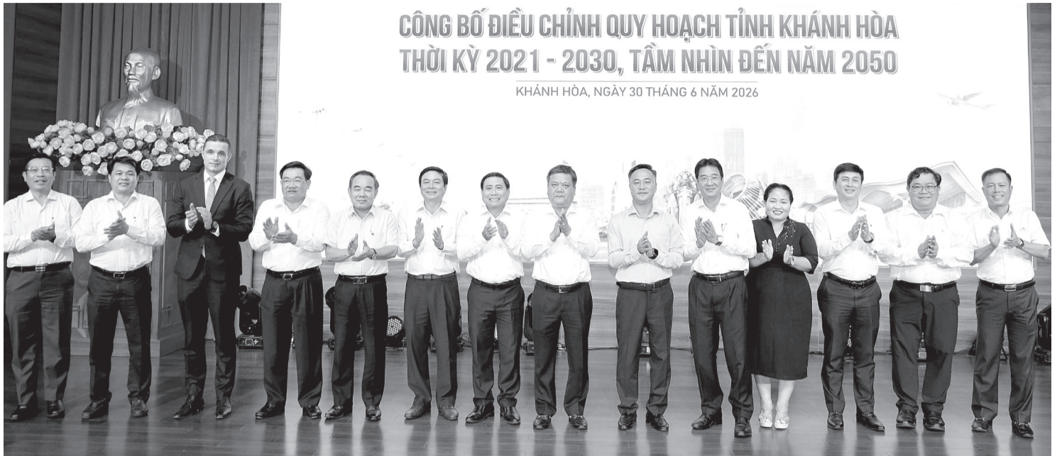
● Các đại biểu chúc mừng thành công của hội nghị.