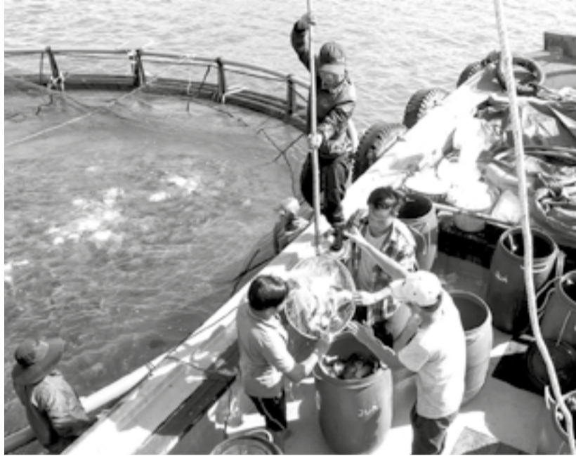
● Người dân thu hoạch cá chim vây vàng nuôi tại khu vực Hòn Nội.

Để phát triển nuôi trồng thủy sản (NTTS) bền vững, thời gian qua, tỉnh khuyến khích người dân nuôi biển chuyển đổi từ lồng gỗ truyền thống sang nuôi biển bằng lồng HDPE ứng dụng công nghệ cao. Nhiều hợp tác xã (HTX) NTTS trên biển đã được thành lập với nhiều thành viên tích cực chuyển đổi lồng nuôi để nuôi tôm hùm, cá biển quy mô lớn hơn. Tuy nhiên, vẫn còn nhiều hộ chưa mạnh dạn đầu tư vì lo ngại đầu ra thủy sản.