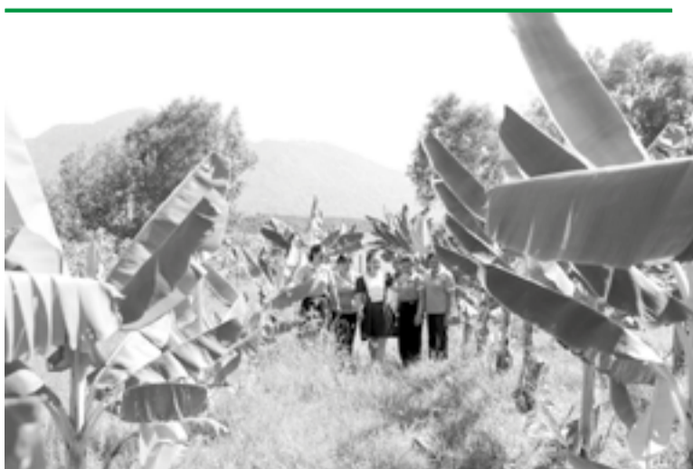
● Các loại cây ăn quả trồng theo hướng hữu cơ.