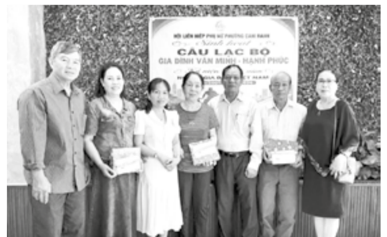
● Các gia đình tiêu biểu được biểu dương.