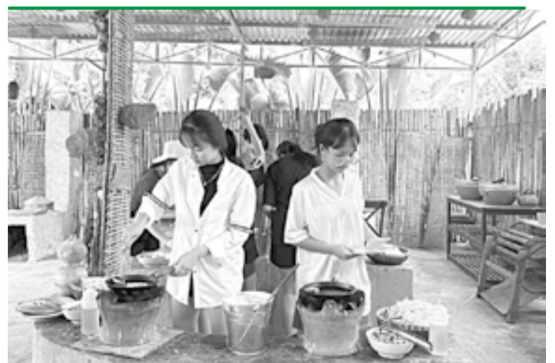
● Học sinh trải nghiệm làm bánh.