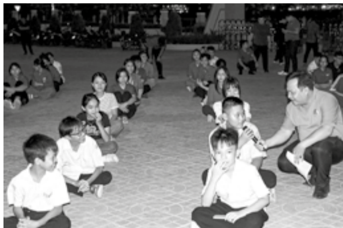
● Các em thiếu niên tham gia sinh hoạt tiếng Anh tại buổi sinh hoạt hè ở xã Diên Khánh.

Sức hút của các hoạt động sinh hoạt hè không chỉ nhờ nội dung phong phú mà còn nhờ sự chủ động của các cơ sở Đoàn trong công tác tổ chức và kết nối với thanh thiếu niên. Để thông tin kịp thời đến các em và phụ huynh, nhiều địa phương đã tăng cường tuyên truyền bằng các hình thức như: Phổ biến tại trường