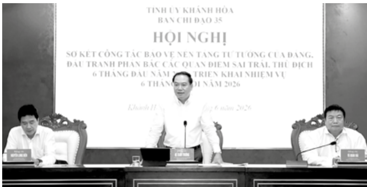
● Phó Bí thư Thường trực Tỉnh ủy Hồ Xuân Trường phát biểu tại hội nghị.

6 tháng đầu năm, tình hình tư tưởng, dư luận xã hội trên địa bàn tỉnh cơ bản ổn định; cán bộ, đảng viên và Nhân dân tin tưởng vào sự lãnh đạo của Đảng, sự điều hành của Nhà nước và những kết quả phát triển kinh tế - xã hội của địa phương. Ban Chỉ đạo 35 tỉnh và các địa phương, đơn vị đã tập trung triển khai đồng bộ các nhiệm vụ bảo vệ nền tảng tư tưởng của Đảng; chủ động nắm bắt tình hình, định hướng dư luận xã hội, tăng cường tuyên truyền thông tin tích cực, đấu tranh