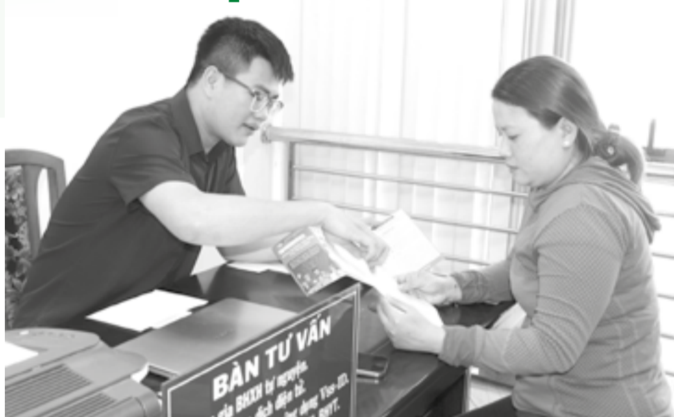
● Tư vấn chính sách bảo hiểm xã hội tự nguyện cho người dân.

Không chỉ các chế độ BHXH được nâng lên, quyền lợi của người tham gia BHYT cũng được mở rộng theo hướng có lợi hơn. Người tham gia BHYT sẽ được quỹ BHYT thanh toán 100% chi phí khám, chữa bệnh nếu tổng chi phí cho một lần khám, chữa bệnh thấp hơn 15% mức lương cơ sở. Với mức lương cơ sở mới là 2,53 triệu đồng/tháng, ngưỡng chi phí được thanh toán toàn bộ tăng lên 379.500 đồng. Điều này giúp người dân giảm bớt gánh nặng tài chính đối với những lần khám, chữa bệnh có chi phí thấp. Đặc biệt, những người tham gia BHYT đủ 5 năm liên tục trở lên được quỹ BHYT thanh toán 100% chi phí khám, chữa bệnh trong phạm vi được hưởng khi số tiền cùng chi trả trong năm vượt quá 6 tháng lương cơ sở. Nếu trước đây mức giới hạn cùng chi trả là 14,04 triệu đồng thì từ ngày 1-7-2026 sẽ tăng lên 15,18 triệu đồng. Việc điều chỉnh này phù hợp với mức lương cơ sở mới, đồng thời tiếp tục bảo đảm quyền