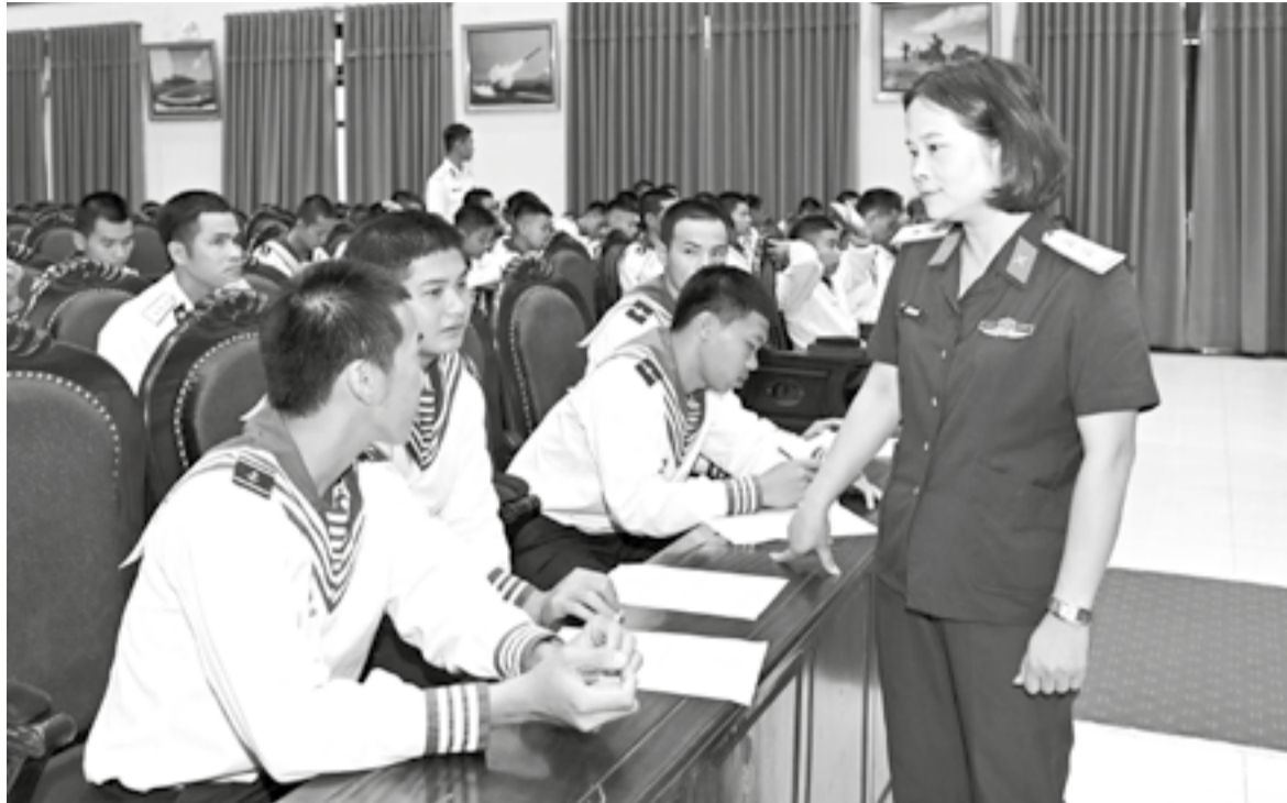
● Vùng 4 Hải quân phối hợp khảo sát nguyện vọng việc làm của chiến sĩ, phục vụ xây dựng Đề án Hỗ trợ giải quyết việc làm cho thanh niên hoàn thành nghĩa vụ quân sự.