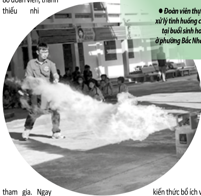
● Đoàn viên thực hành xử lý tình huống cháy gas tại buổi sinh hoạt hè ở phường Bắc Nha Trang.

Có mặt tại buổi sinh hoạt hè do Đoàn phường Bắc Nha Trang phối hợp với Chi đoàn Đội Chữa cháy và cứu nạn, cứu hộ khu vực 9 (thuộc Phòng Cảnh sát phòng cháy, chữa cháy và cứu nạn, cứu hộ, Công an tỉnh) tổ chức, chúng tôi cảm nhận rõ không khí sôi nổi, hào hứng của hơn 80 đoàn viên, thanh thiếu niên