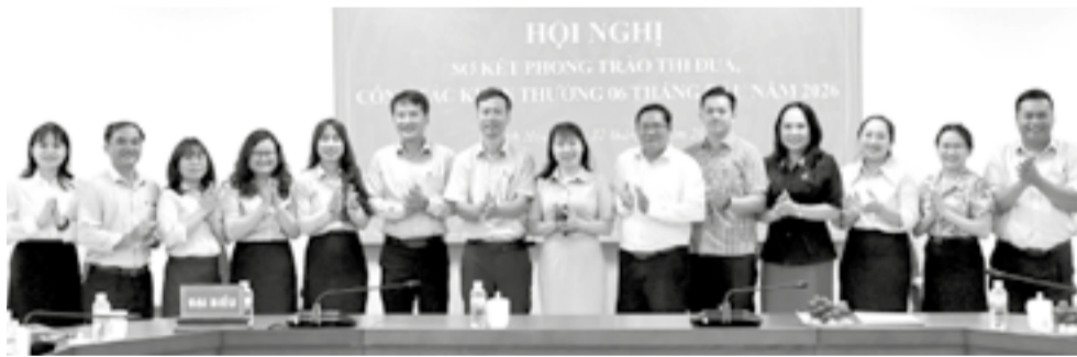
● Các thành viên Khởi thi đua các cơ quan tham mưu, tổng hợp tỉnh tham dự hội nghị.

Sáng 22-6, Khởi thi đua các cơ quan tham mưu, tổng hợp tỉnh gồm các đơn vị: Văn phòng UBND tỉnh, Văn phòng Đoàn Đại biểu Quốc hội và HĐND tỉnh, Sở Nội vụ, Thống kê tỉnh, Ban Quản lý Khu kinh tế và Khu công nghiệp tỉnh tổ chức Hội nghị sơ kết phong trào thi đua, công tác khen thưởng 6 tháng đầu năm.