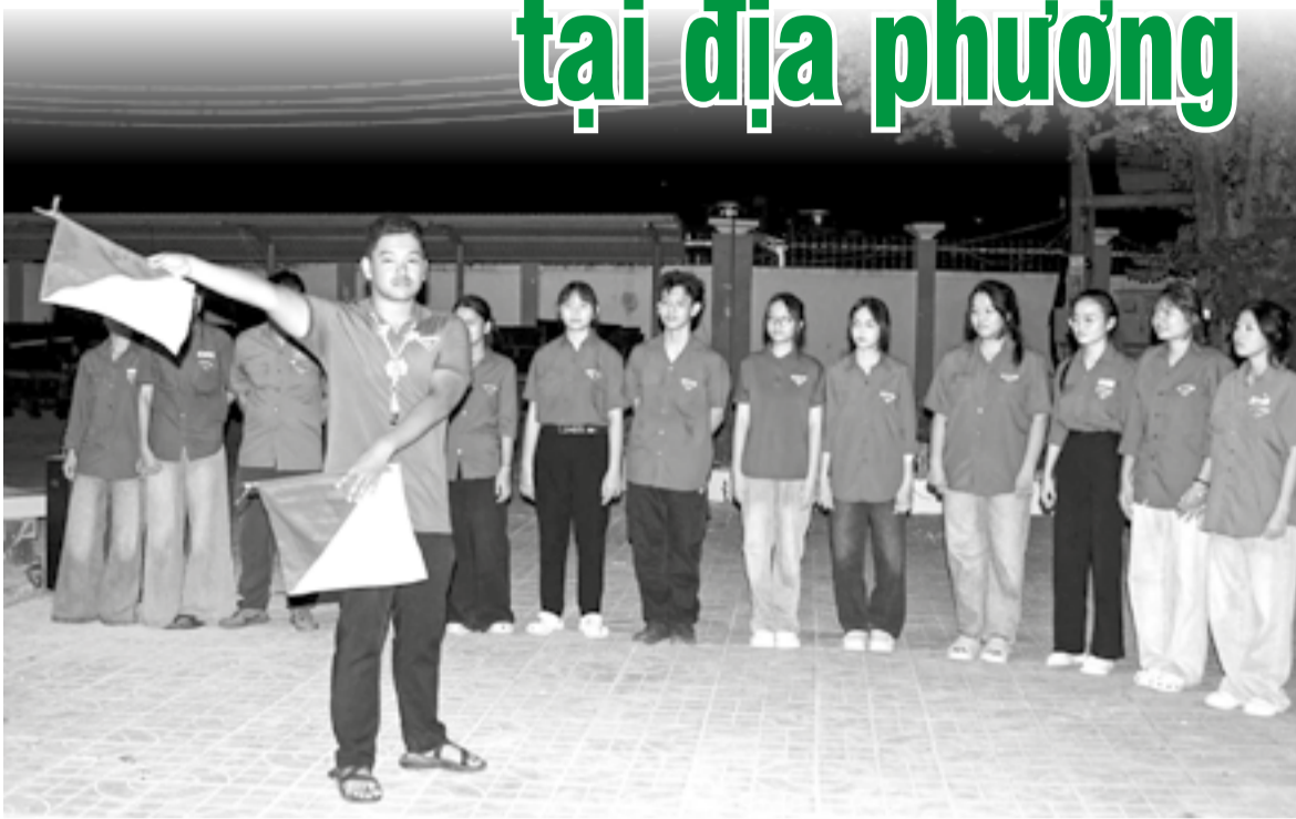
● Hướng dẫn đoàn viên thực hành truyền tin bằng cờ Semaphore trong chương trình sinh hoạt hè tại xã Diên Khánh.

Tại xã Diên Khánh, ngay sau khi tiếp nhận đoàn viên, thanh thiếu niên về sinh hoạt hè tại nơi cư trú, Đoàn xã đã xây dựng kế hoạch hoạt động với nhiều nội dung đa dạng, phù hợp với từng độ tuổi. Các em được tham gia trò chơi dân gian, học kỹ năng truyền tin bằng cờ Semaphore và cờ Morse, sinh hoạt tập thể, múa hát cộng đồng, đồng thời được tuyên truyền về phòng, chống đuối nước. Các em