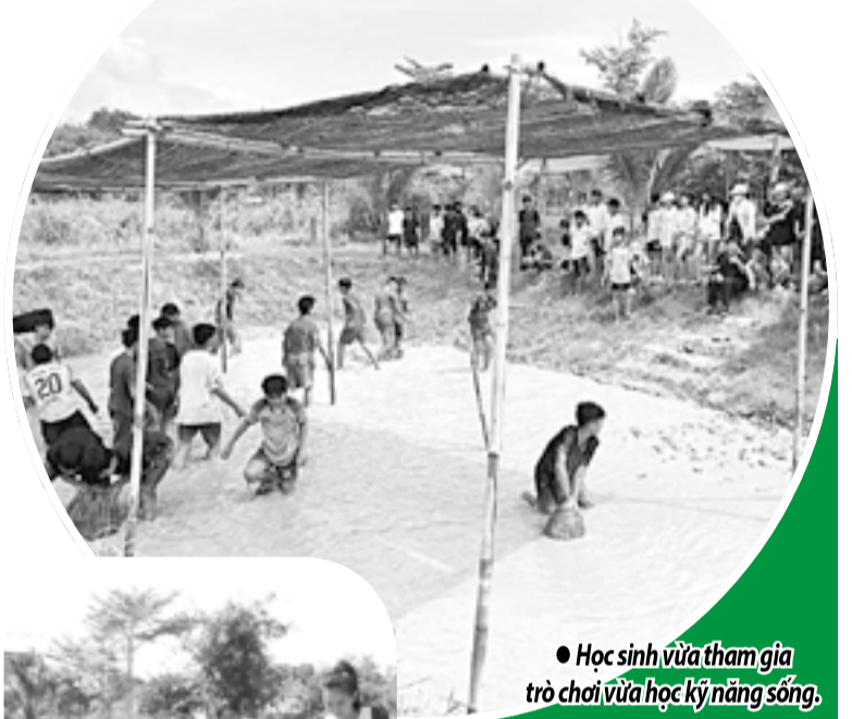
● Học sinh vừa tham gia trò chơi vừa học kỹ năng sống.

Bằng việc kết hợp nông nghiệp hữu cơ và du lịch đồng quê, Hợp tác xã (HTX) Du lịch nông nghiệp Nông Trại Vui (thôn Thượng, xã Diên Lâm) không chỉ mang đến sản phẩm trải nghiệm cho du khách mà còn hướng tới liên kết tiêu thụ nông sản góp phần phát triển kinh tế cộng đồng. Đây là HTX do phụ nữ tham gia quản lý, điều hành, góp phần tạo việc làm cho lao động địa phương.