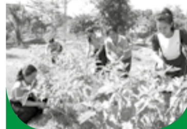
● Những cây trái tại đây vừa cung cấp thực phẩm vừa giúp du khách tìm hiểu về nông nghiệp.

workshop vào phục vụ du khách; bổ sung các sản phẩm dành cho khách lẻ... HTX cũng định hướng mở rộng liên kết với các trang trại lân cận nhằm phát triển chuỗi dịch vụ du lịch đồng quê, từng bước hình thành hệ sinh thái du lịch nông nghiệp bền vững.