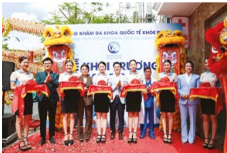
● Khai trương Khỏe Plus - Thêm lựa chọn chất lượng cao, hiện đại tại Khánh Hòa.

đối tượng yếu thế trước mắt, mà còn góp phần nâng cao ý thức chủ động phòng bệnh, chăm sóc sức khỏe cho cộng đồng.