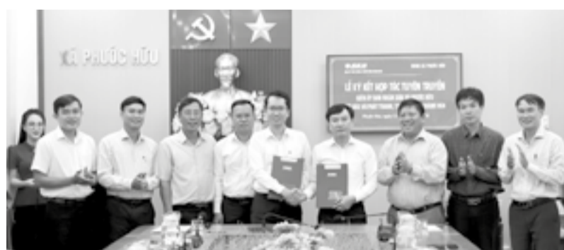
● Lãnh đạo Báo và Phát thanh, Truyền hình Khánh Hòa và xã Phước Hữu ký kết hợp tác.

Theo nội dung ký kết, các bên thống nhất tuyên truyền việc thực hiện Nghị quyết Đại hội đại biểu Đảng bộ xã Ninh Hải lần thứ I, Nghị quyết Đại hội đại biểu Đảng bộ xã Phước Hữu lần thứ I, nhiệm kỳ 2025 - 2030; tuyên truyền công tác xây dựng Đảng, các mục tiêu, nhiệm vụ, giải pháp, kết quả phát triển kinh tế - xã hội... trên địa bàn 2 xã. Báo và Phát thanh, Truyền hình Khánh Hòa ưu tiên xuất bản, phát sóng các tin, bài do phóng viên, kỹ thuật viên của Phòng Văn hóa - Xã hội, Trung tâm Dịch vụ, sự nghiệp công xã Ninh Hải và xã Phước Hữu cộng tác; hỗ trợ bồi dưỡng nghiệp vụ cho đội ngũ phóng viên, kỹ thuật viên của 2 địa phương. Thời gian hợp tác tuyên truyền từ ngày ký kết đến ngày 31-12-2026.