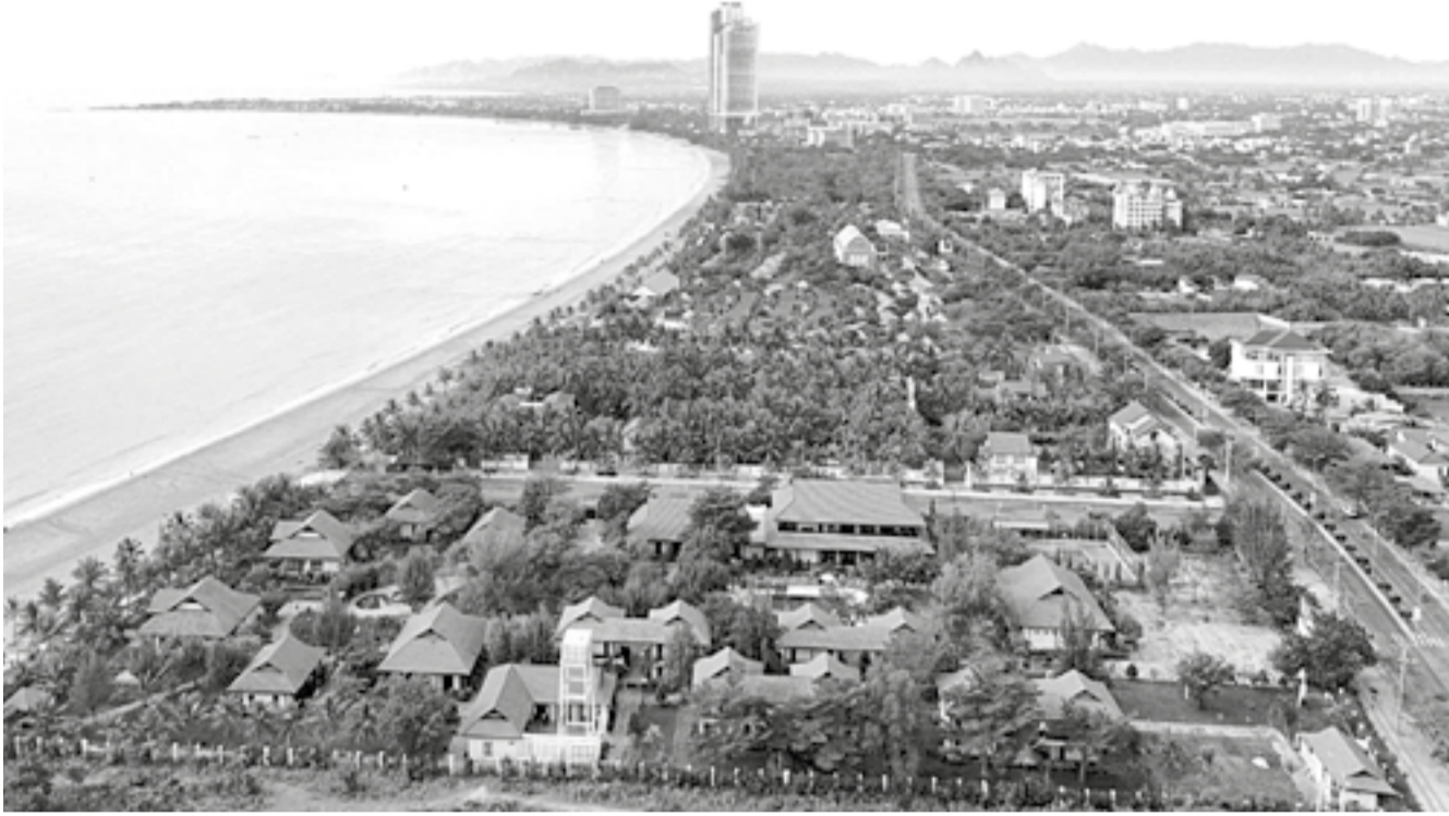
● Bãi biển Bình Sơn - Ninh Chữ tạo nên cực tăng trưởng phía nam tỉnh.

đoạn 2025 - 2030 đề ra mục tiêu tăng trưởng từ 11 đến 12%. Vì vậy, việc điều chỉnh quy hoạch tỉnh có ý nghĩa chiến lược, tháo gỡ những “nút thắt” cũ và mở đường cho những dòng vốn đầu tư mới.