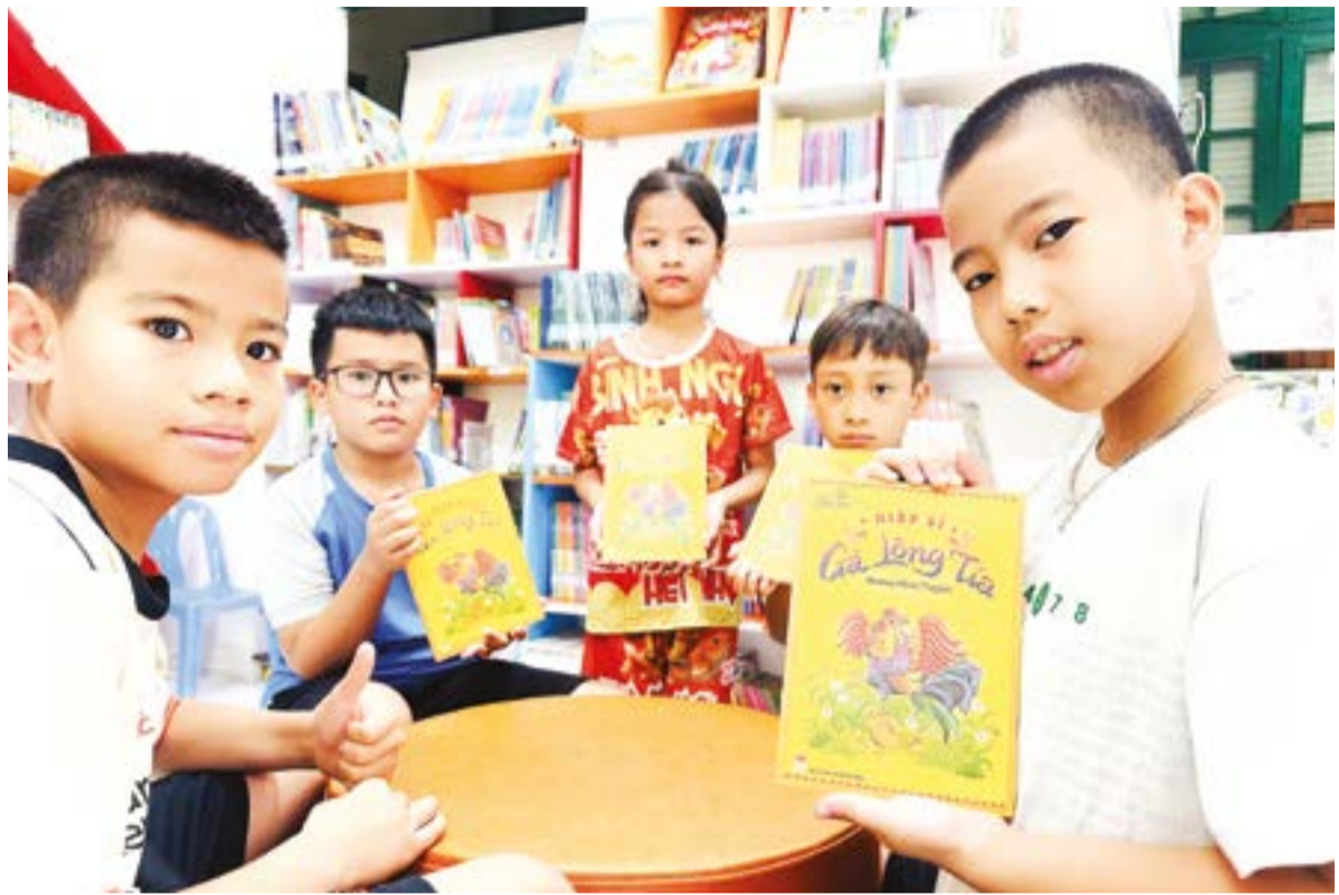
● Truyện dài "Hiệp sĩ Gà Lông tía" được nhiều bạn nhỏ đón nhận.

Mùa hè cũng là mùa của những giấc mơ và trí tưởng tượng bay xa. Bộ sách "Truyện nhỏ đong đầy