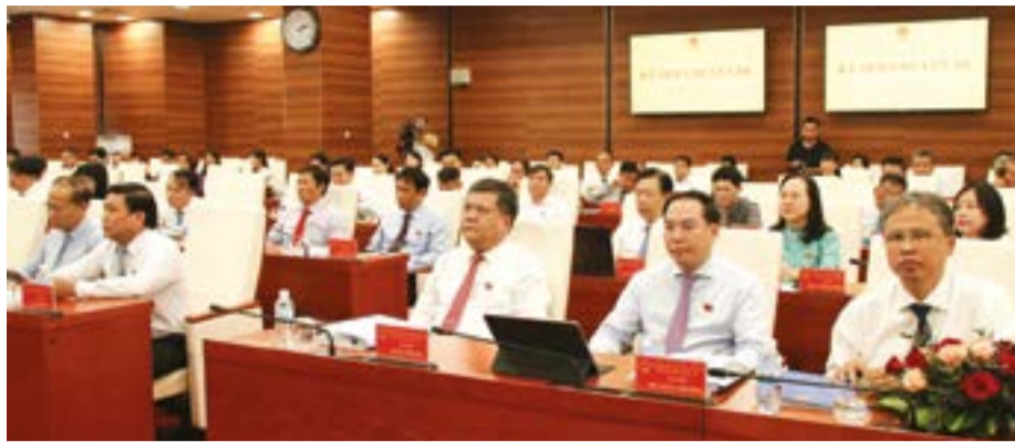
● Các đồng chí lãnh đạo tỉnh, đại biểu tham dự kỳ họp.