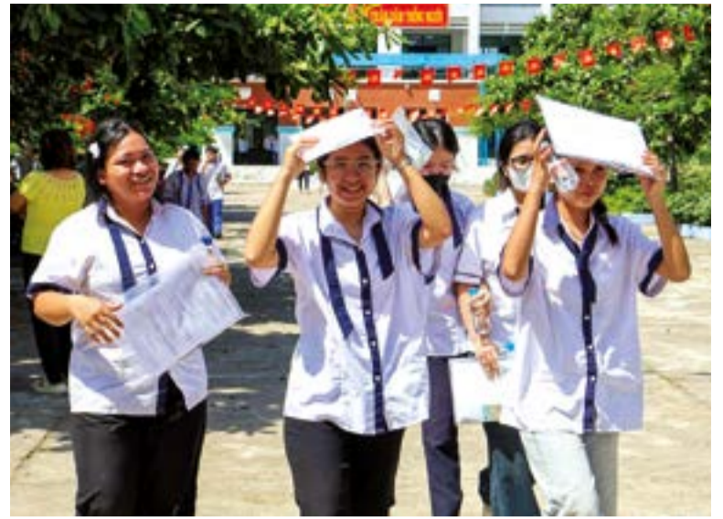
● Các thí sinh phấn khởi khi hoàn thành Kỳ thi tốt nghiệp THPT năm 2026 tại điểm thi Trường THCS và THPT Trần Hưng Đạo (phường Đông Hải).