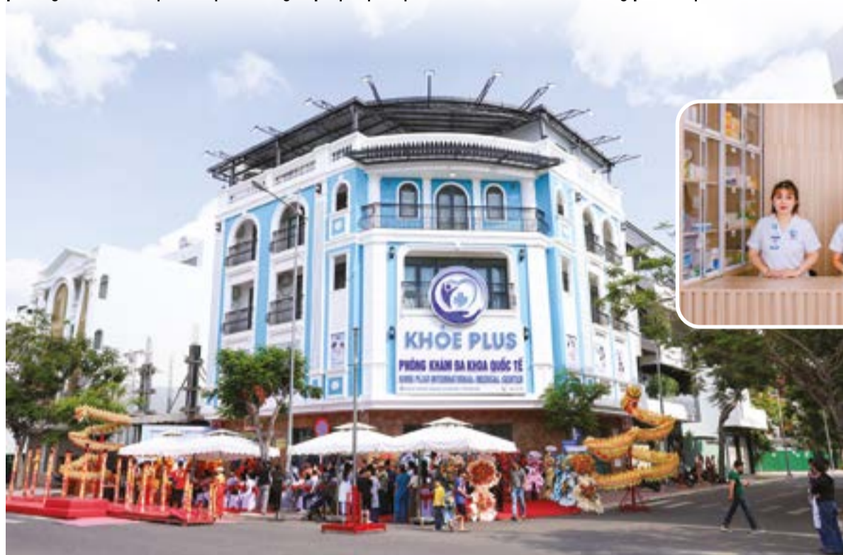
● Khỏe Plus khai trương ngày 10-5-2026.

Ngày 10-5-2026, Phòng khám Đa khoa Quốc tế Khỏe Plus chính thức khai trương và đi vào hoạt động tại Lô 23A.04, góc đường số 7 - đường số 2, Khu đô thị Hà Quang II, phường Nam Nha Trang, tỉnh Khánh Hòa. Sự xuất hiện của một cơ sở y tế được đầu tư bài bản ngay tại khu đô thị mới đang mở ra thêm một lựa chọn chất lượng, giúp người dân địa phương và các khu vực lân cận dễ dàng tiếp cận dịch vụ chăm sóc sức khỏe mà không phải đi lại xa xôi.