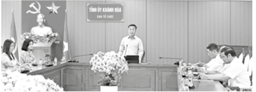
● Quang cảnh hội thảo tại điểm cầu Khánh Hòa.