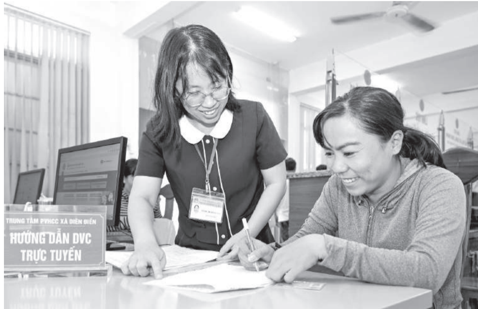
● Cán bộ Trung tâm Phục vụ hành chính công xã Diên Điền hướng dẫn người dân khai biểu mẫu.

Từ đầu tháng 3, Trung tâm còn thực hiện mô hình "Hỗ trợ người yếu thể tiếp cận TTHC". Tại Trung tâm có bố trí khu vực ưu tiên hỗ