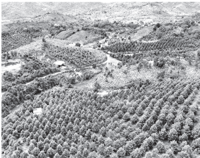
● Những vườn sầu riêng bên tuyến đường liên thôn.

Từ thành công của những hộ tiên phong như bà Năm, phong trào chuyển đổi cây trồng kém hiệu quả sang trồng sầu riêng lan rộng tại các thôn Va Ly và Suối Cốc. Trước đây, hơn 5ha đất sản xuất của gia đình ông Đỗ Nhật Nghĩa (thôn Va Ly) chủ yếu trồng điều nhưng năng suất thấp, giá cả bấp bênh nên hiệu quả kinh tế không cao. Năm 2017,