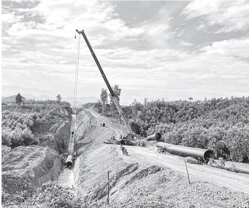
● Lắp đặt đường ống đoạn qua xã Trung Khánh Vĩnh.

Lãnh đạo Ban 7 cho biết, theo tiến độ, việc bàn giao mặt bằng phải được thực hiện xong trong năm 2025, nhưng đến nay mới chỉ bàn giao được gần 50% mặt bằng. Đoạn qua khu vực các