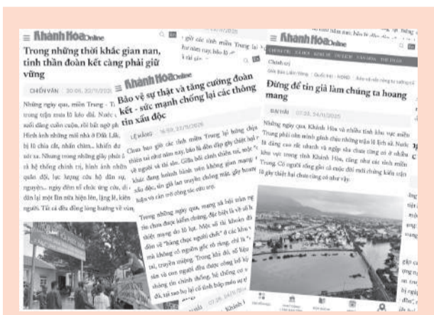
● Những bài viết của Báo và Phát thanh, Truyền hình Khánh Hòa đã kịp thời ngăn chặn tin giả, thông tin xấu độc về đợt mưa lũ lịch sử tháng 11-2025.