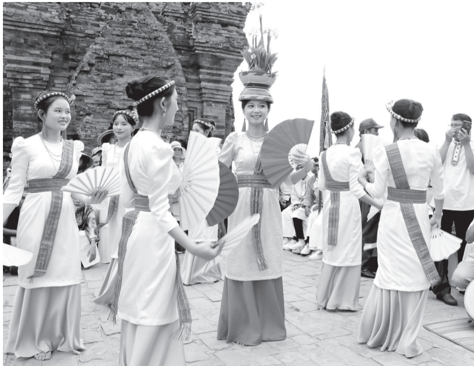
● Các thiếu nữ Chăm biểu diễn điệu múa truyền thống.

Nhắc đến di sản văn hóa Chăm còn có kho tàng truyện kể dân gian, phong tục tập quán, tín ngưỡng, văn hóa ẩm thực... đang được cộng đồng lưu giữ, trao truyền qua nhiều thế hệ. Trong đó, Lễ hội Ramurwan là sự kiện quan trọng nhất trong năm, là dịp để mọi nhà sum vầy, tưởng nhớ đến tổ tiên, ông bà và cầu nguyện cho