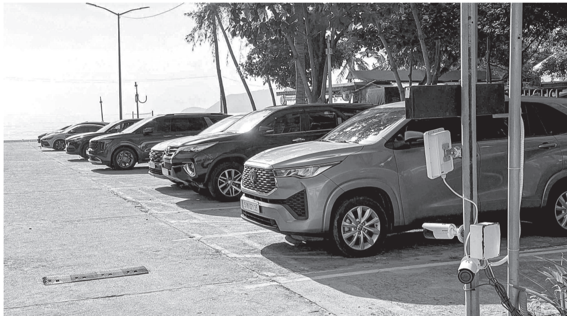
● Bãi giữ xe số 8 (đường Trần Phú, phường Nha Trang) do Trung tâm Dịch vụ, sự nghiệp công phường Nha Trang quản lý đã áp dụng thu phí không dùng tiền mặt.

Để giải quyết tình trạng thiếu bãi đậu xe ở khu vực Nha Trang, từ năm 2024, UBND tỉnh đã cho phép sử dụng tạm thời các khu đất trống chưa sử dụng để làm bãi đậu xe. Mới đây, UBND tỉnh có văn bản chỉ đạo các sở, ngành, địa phương, cơ quan chức năng rà soát, phân loại hệ thống bãi đậu xe hiện nay, đồng thời chuẩn bị các điều kiện cần thiết để thu hút đầu tư xây dựng bãi đậu xe đạt chuẩn, bãi đậu xe thông minh.