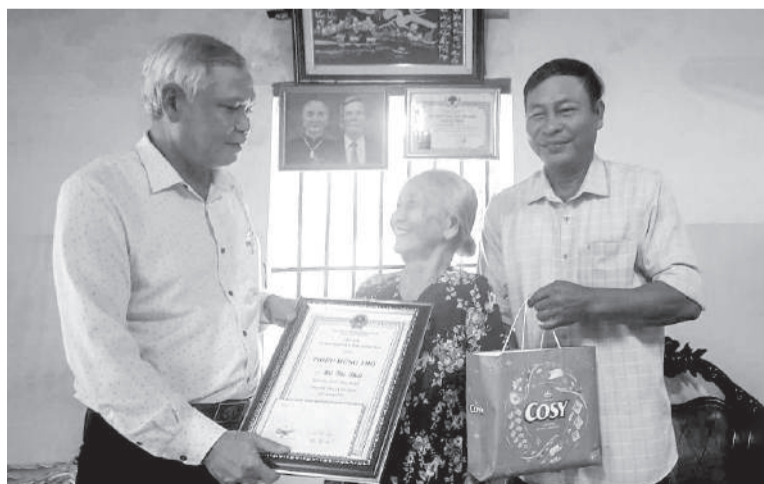
● Hội Người cao tuổi xã phối hợp với địa phương chúc thọ, mừng thọ người cao tuổi.

Cùng với đó, Hội NCT xã đã đưa vào hoạt động 10 câu lạc bộ (CLB) dưỡng sinh, ca nhạc, thể dục, thể thao... giúp NCT có sân chơi bổ ích, nâng cao sức khỏe, đời sống tinh thần. Trong đó, CLB Dưỡng sinh Liên thể hệ của xã được thành lập từ năm 2018 với 8 thành viên, đến nay đã phát triển lên 30 thành viên. Từ 5 đến 6 giờ sáng mỗi ngày, các thành viên cùng nhau tập luyện 10 bài dưỡng sinh, dân vũ, yoga. Mỗi năm, CLB tập thêm 3 bài mới để nâng cao sức khỏe và tạo sự hứng khởi cho hội viên. Ngoài ra, mỗi thành viên còn đóng góp 20.000 đồng/tháng để mua đồng