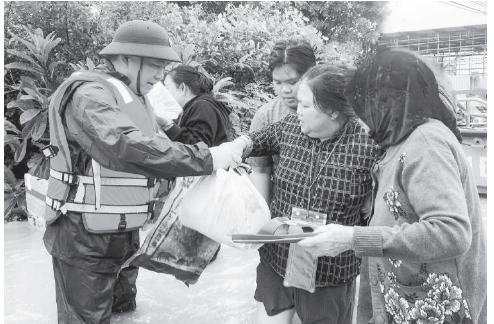
● Đồng chí Hồ Xuân Trường vào tâm lũ chỉ đạo công tác cứu hộ, cứu nạn, trao hỗ trợ nhu yếu phẩm cho người dân trong đợt mưa lũ lịch sử tháng 11-2025.

phát huy trên không gian mạng. Qua gần 1 năm hoạt động, đến nay, fanpage đã có hơn 2,2 triệu lượt tương tác, theo dõi; đăng tải hơn 1.500 tin, bài nhằm phổ biến, lan tỏa các chủ trương, đường lối của Đảng, chính sách, pháp luật của Nhà nước; thông tin về những định hướng, kết quả phát triển kinh tế - xã hội của tỉnh, địa phương; tuyên truyền những tấm gương người tốt, việc tốt, mô hình hay, cách làm sáng tạo. Bên cạnh đó, xã Hòa Trí còn phát huy hiệu quả của Trang Thông tin điện tử UBND xã, 12 fanpage của Mặt trận và các tổ chức chính trị - xã hội, cơ quan, đơn vị và website của các trường học trên địa bàn trong việc lan tỏa các thông tin tích cực, góp phần đẩy lùi các thông tin xấu độc.