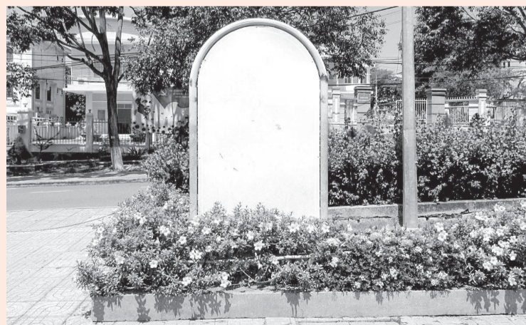
● Ảnh chụp ngày 9-6-2026.

Tại Công viên 18 tháng 10, đường Phạm Hùng (phường Cam Ranh) có bảng nội quy bị phai mờ, không thấy chữ (ảnh). Rất mong ngành chức năng kiểm tra, thay mới bảng nội quy này để người dân được biết, góp phần xây dựng công viên luôn xanh, sạch, đẹp.