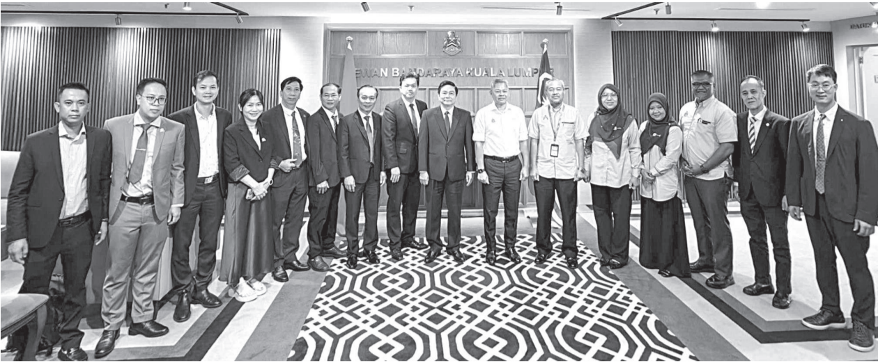
● Đoàn công tác tỉnh Khánh Hòa chụp hình lưu niệm cùng lãnh đạo và đại diện các cơ quan chức năng chính quyền TP. Kuala Lumpur.