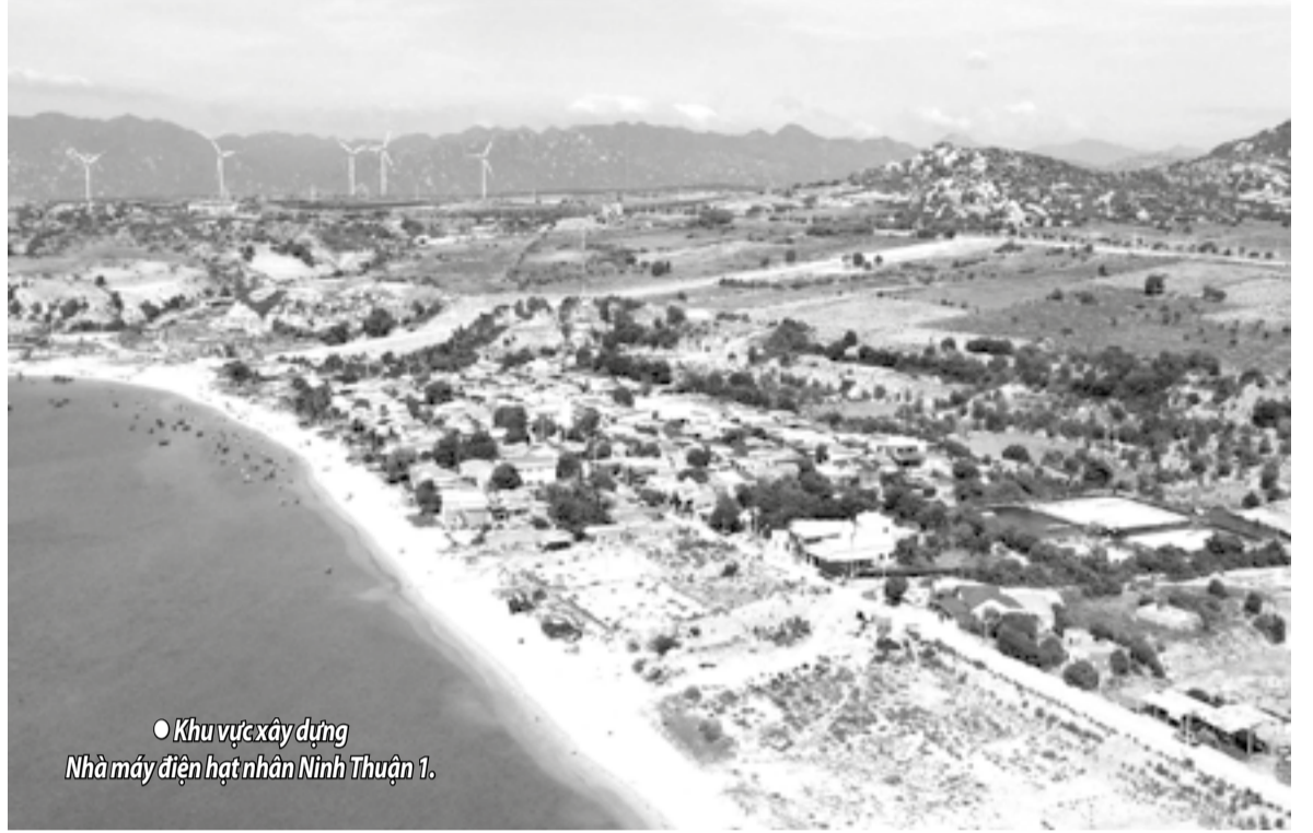
● Khu vực xây dựng Nhà máy điện hạt nhân Ninh Thuận 1.

Ngày 30-6 là mốc thời gian phải hoàn thành mục tiêu giải phóng mặt bằng (GPMB) cho 2 Dự án Nhà máy điện hạt nhân Ninh Thuận 1 và Ninh Thuận 2. Đây là áp lực rất lớn đối với các địa phương khi hàng nghìn hồ sơ bồi thường vẫn còn vướng những nút thắt về thủ tục và hạ tầng tái định cư.