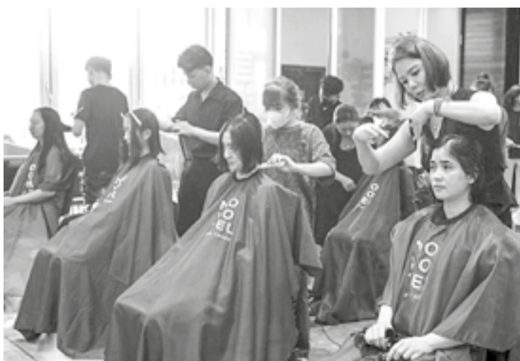
● Các tình nguyện viên tại Ngày hội hiến tóc.

Sáng 7-6, tại Khách sạn Novotel Nha Trang (phường Nha Trang) diễn ra chương trình "Ngày hội hiến tóc 2026 - Sharing Love Through Hair Donation" với gần 200 tình nguyện viên thuộc nhiều lứa tuổi trên địa bàn tỉnh tham gia. Đây là