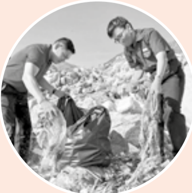
● Đoàn viên, thanh niên phường Nam Nha Trang thu gom rác thải ven biển.

Tại lễ phát động, lãnh đạo tỉnh nhấn mạnh, bảo vệ môi trường là vấn đề có ý nghĩa sống còn đối với sự phát triển của địa phương cũng như đất nước. Bảo vệ môi trường không còn là lựa chọn, mà là trách nhiệm hành động của mỗi cơ quan, tổ chức, doanh nghiệp, gia đình và từng người dân. Đồng thời, phát đi thông điệp "Mỗi người dân là một công dân xanh - Mỗi gia đình là một không gian xanh - Mỗi khu dân cư, cơ quan, đơn vị là một cộng đồng xanh".