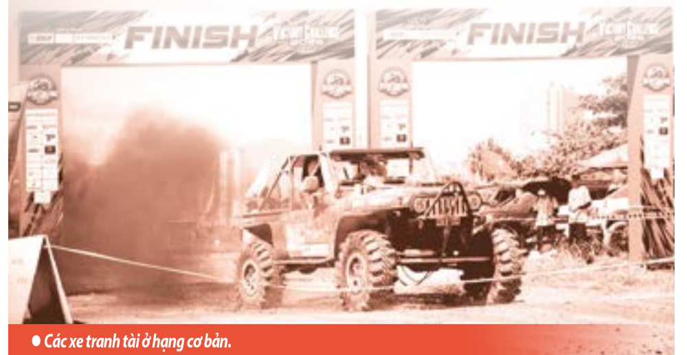
● Các xe tranh tài ở hạng cơ bản.

Ngoài ra, Ban tổ chức trao 14 giải phụ cho các cá nhân, tập thể có thành tích xuất sắc ở các hạng mục thi đấu cũng như có đóng góp tích cực cho thành công chung của giải.