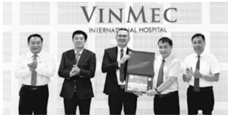
● Lãnh đạo Bệnh viện Trung ương Huế tặng quà cho Bệnh viện Đa khoa Quốc tế Vinmec Nha Trang.

Phát biểu tại lễ ký kết, lãnh đạo Sở Y tế yêu cầu Bệnh viện Đa khoa