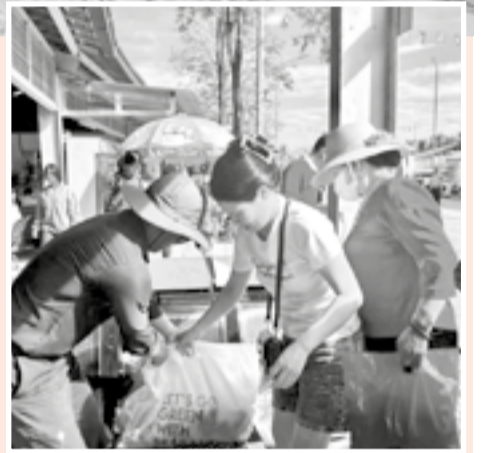
● Nhân viên Ban Quản lý vịnh Nha Trang phát túi tự phân hủy cho du khách tham quan vịnh Nha Trang.