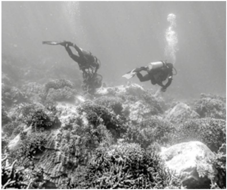
● Các thợ lặn vớt rác thải khu vực rạn san hô ở Hòn Mun (vịnh Nha Trang).

đề nghị tỉnh cần xây dựng việc bảo tồn và khai thác hợp lý rạn san hô thành một chiến lược trọng điểm. Đây không chỉ là vấn đề của riêng địa phương mà còn mang tầm vóc quốc gia và xuyên biên giới, bởi rạn san hô Khánh Hòa là cầu nối quan trọng với các khu vực đa dạng sinh học bậc nhất thế giới.