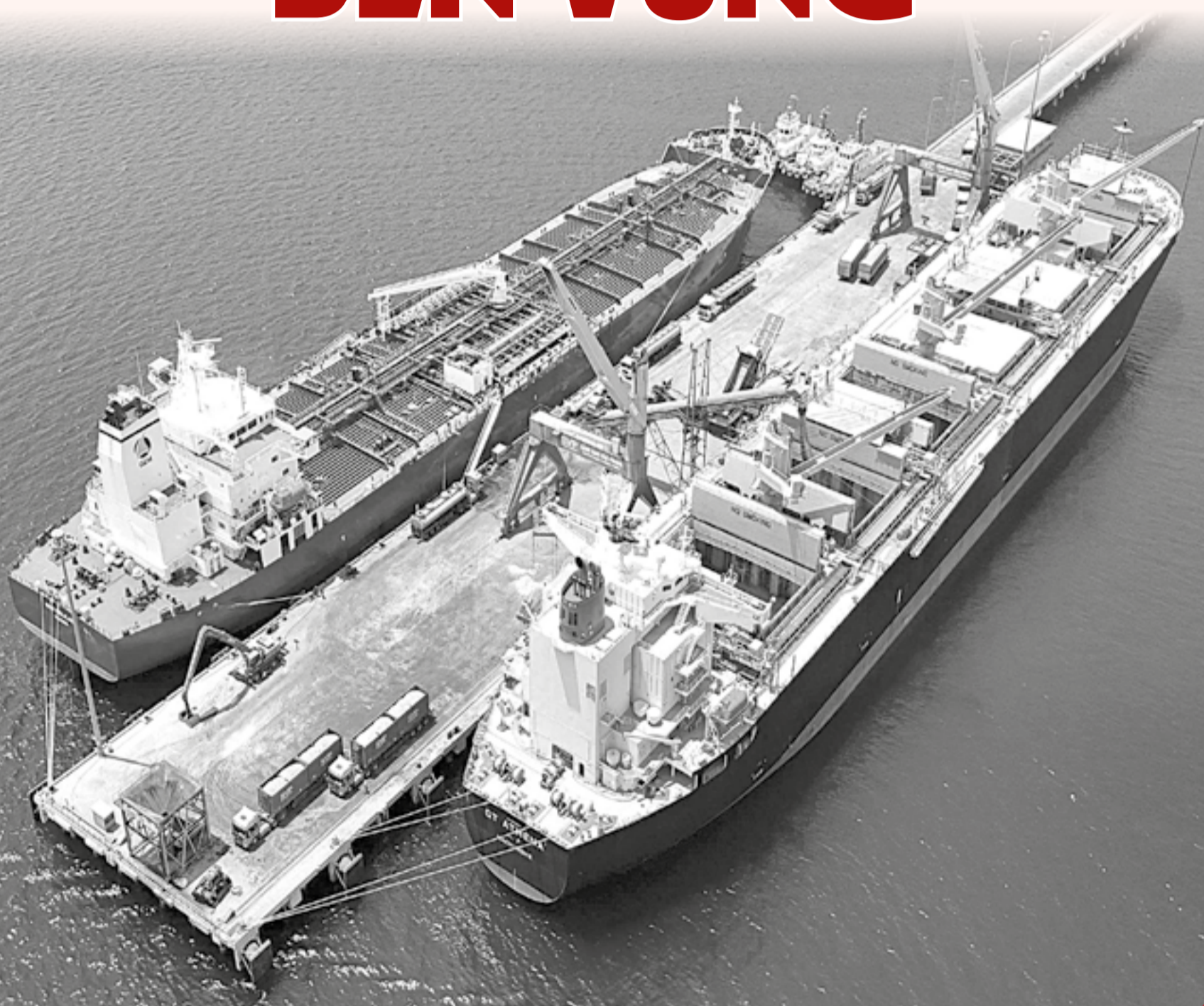
• Bến cảng tổng hợp Nam Vân Phong (phường Đông Ninh Hòa).