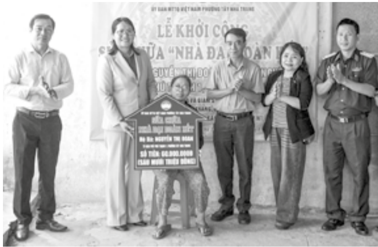
● Lãnh đạo phường Tây Nha Trang trao kinh phí hỗ trợ sửa chữa nhà ở cho hộ có hoàn cảnh khó khăn.

bền vững của các hộ, đòi hỏi phải có sự lãnh đạo, chỉ đạo tập trung, đồng bộ, huy động hiệu quả các nguồn lực để hỗ trợ, cải thiện và bảo đảm khả