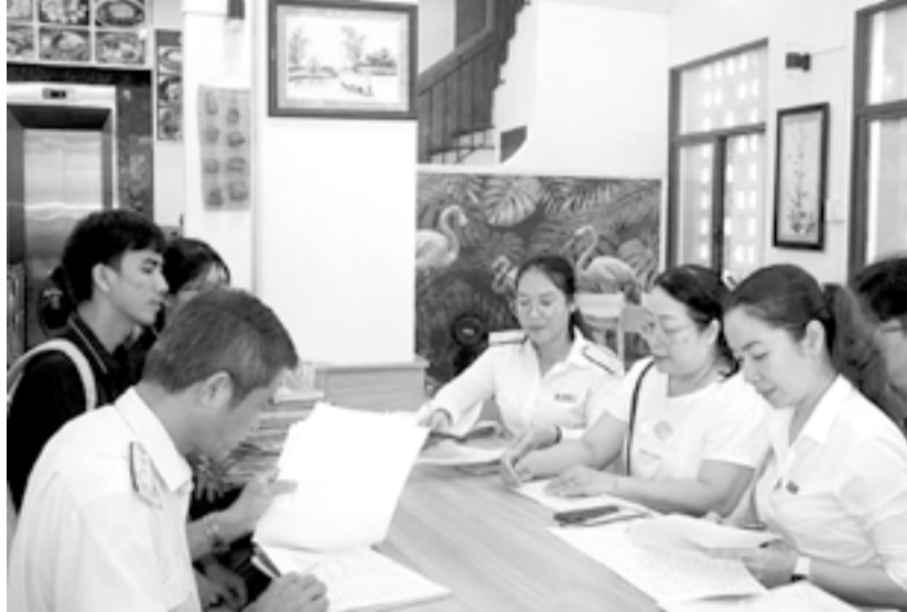
● Cán bộ Thuế cơ sở 2 tuyên truyền, hỗ trợ hộ kinh doanh thực hiện chính sách thuế mới.

Hiện nay, Thuế cơ sở 2 quản lý 28.606 hộ, cá nhân kinh doanh trên địa bàn các phường khu vực Nha Trang và các xã Cam Lâm, Suối Dầu. Việc Chính phủ ban hành Nghị định số 141/2026 sửa đổi, bổ sung một số điều của Nghị định số 68/2026 về chính sách thuế đối với hộ, cá nhân kinh doanh và Nghị định số 320/2025 quy định chi tiết một số điều của Luật Thuế thu nhập doanh nghiệp đã tạo điều kiện thuận lợi cho người nộp thuế, đồng thời góp phần hiện đại hóa công tác quản lý thuế. Đáng chú ý, Nghị định số 141 (có hiệu lực từ ngày 29-4-2026) đã sửa đổi quy định về HĐĐT. Theo đó, hộ, cá nhân