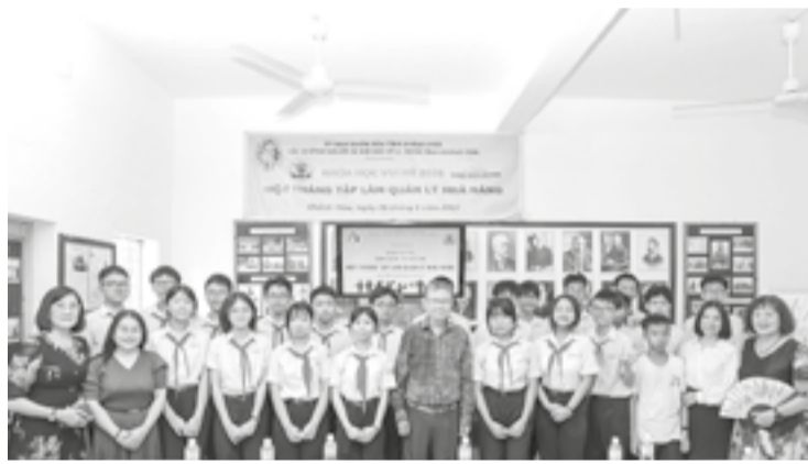
● Các em học sinh tham gia lớp học vui hè do Hội Những người ái mộ bác sĩ A. Yersin tỉnh Khánh Hòa tổ chức.

Khóa học hoàn toàn miễn phí, diễn ra trong khoảng 1 tháng. Các học sinh được những thầy, cô của Trung tâm Giáo dục nghề nghiệp du lịch khách sạn quốc tế Yasaka Sài Gòn Nha Trang truyền đạt kiến thức, hướng dẫn kỹ năng cơ bản về lĩnh vực nhà hàng như: Quy trình phục vụ, tổ chức hoạt động tại nhà hàng; giao tiếp, làm việc nhóm và xử lý tình huống trong môi trường dịch vụ. Ngoài ra, các em còn được