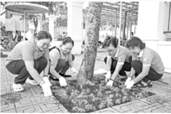
● Trồng hoa trước cơ quan Ủy ban MTTQ Việt Nam phường Nha Trang.