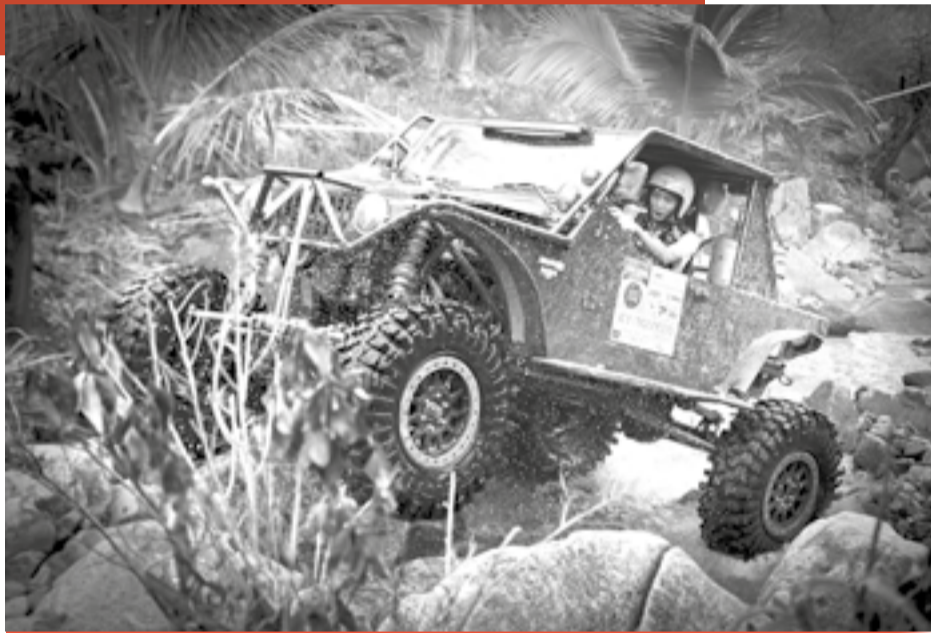
● Xe hạng chuyên nghiệp đang cố gắng vượt qua con suối cạn đầy đá trong bài thi tại hồ Đắc Lộc.