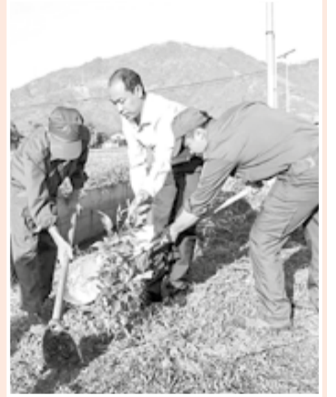
● Ra quân trồng cây xanh bảo vệ môi trường tại xã Suối Dầu.