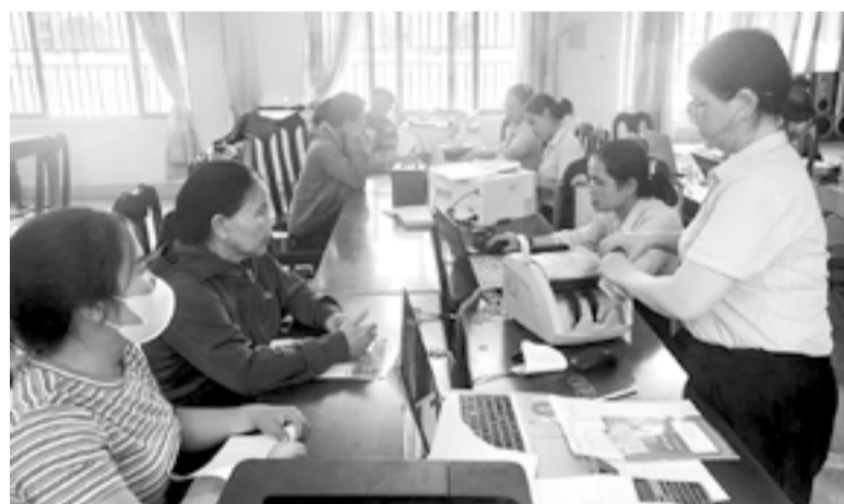
● Hoạt động giao dịch tín dụng chính sách tại xã Ninh Phước.