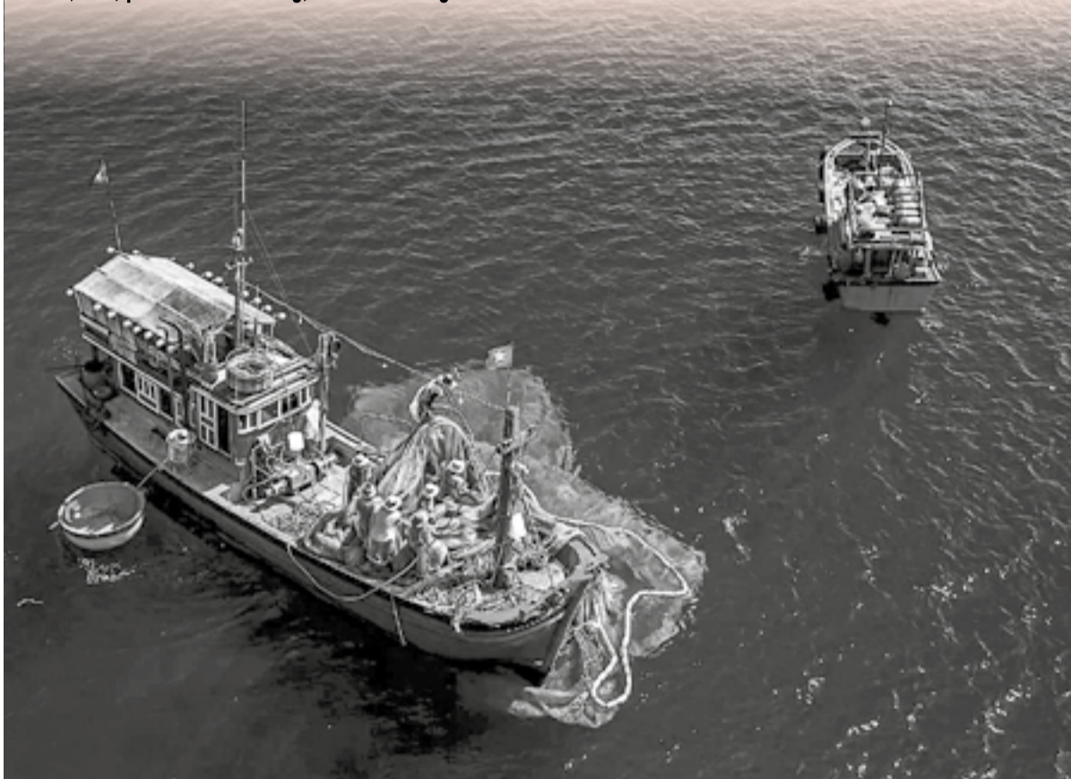
● Ngư dân Khánh Hòa khai thác hải sản trên biển.

Qua 8 năm thực hiện Nghị quyết số 36 ngày 22-10-2018 của Ban Chấp hành Trung ương Đảng khóa XII về Chiến lược phát triển bền vững kinh tế biển Việt Nam đến năm 2030, tầm nhìn đến năm 2045, tỉnh Khánh Hòa đã có nhiều hành động quyết liệt mang lại hiệu quả to lớn. Thời gian tới, tỉnh tiếp tục phát huy tối đa tiềm năng biển, đảo, phát triển bền vững, trở thành trung tâm kinh tế biển lớn của cả nước.