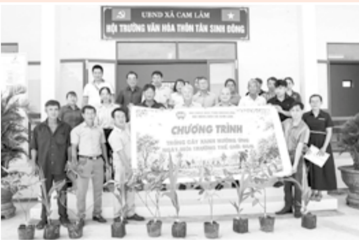
● Xã Cam Lâm tổ chức hoạt động trồng cây xanh bảo vệ môi trường.