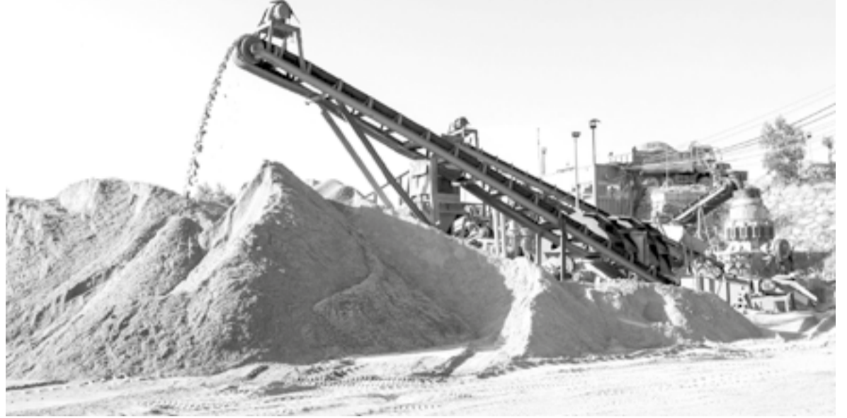
● Khu vực sản xuất cát nghiền công nghiệp tại Nhà máy sản xuất công bê tông và cát nghiền nhân tạo của Công ty TNHH GVB (xã Mỹ Sơn).

Lãnh đạo Sở NN-MT cho biết, việc quản lý, khai thác, sử dụng hiệu quả tài nguyên, khoáng sản không chỉ là yêu cầu trước mắt, mà còn là chiến lược lâu dài. Vừa qua, UBND tỉnh đã có văn bản yêu cầu tăng cường quản lý khai thác khoáng sản trên địa bàn. Theo đó, Sở NN-MT chủ trì, phối hợp tăng cường kiểm tra việc chấp hành pháp luật về địa chất, khoáng sản và pháp luật liên quan trên địa bàn tỉnh. Trong đó, tập trung kiểm tra khu vực vùng sâu, vùng xa, ít dân cư, địa hình hiểm trở; kiểm tra, đôn đốc trách nhiệm người đứng đầu cơ quan, tổ chức, địa phương trong phòng ngừa, ngăn chặn vi phạm về hoạt động khoáng sản; kịp thời báo