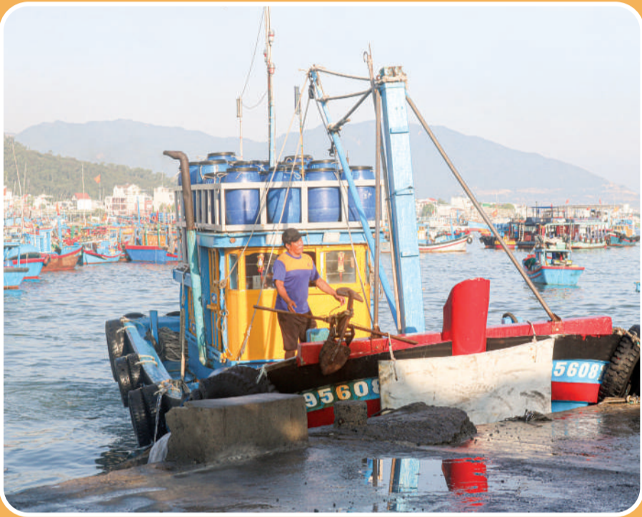
● Tàu thuyền cập bến.