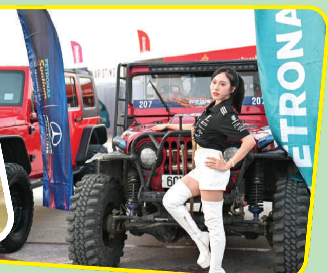
● Dàn xe được trưng bày tại Quảng trường 2 tháng 4 phục vụ du khách và người dân tham quan.