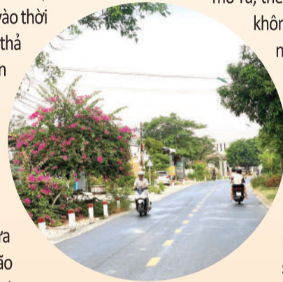
● Con đường rực rỡ những hàng hoa giấy.

Mai sau, con đường này có thể sẽ được mở rộng; hai bên đường sẽ hiện lên thêm nhiều vườn cây, thêm những ao sen đẹp. Rồi sẽ có nhiều khách du lịch tìm đến ngắm hoa, ngắm những cánh đồng lúa và thưởng thức nhiều loại cây ăn trái mới được trồng. Cuộc sống nơi đây rồi sẽ no ấm hơn, vui vẻ hơn. Đó không chỉ là một giấc mơ, mà đang dần trở thành định hướng phát triển cho những vùng đất mà con đường đi qua.