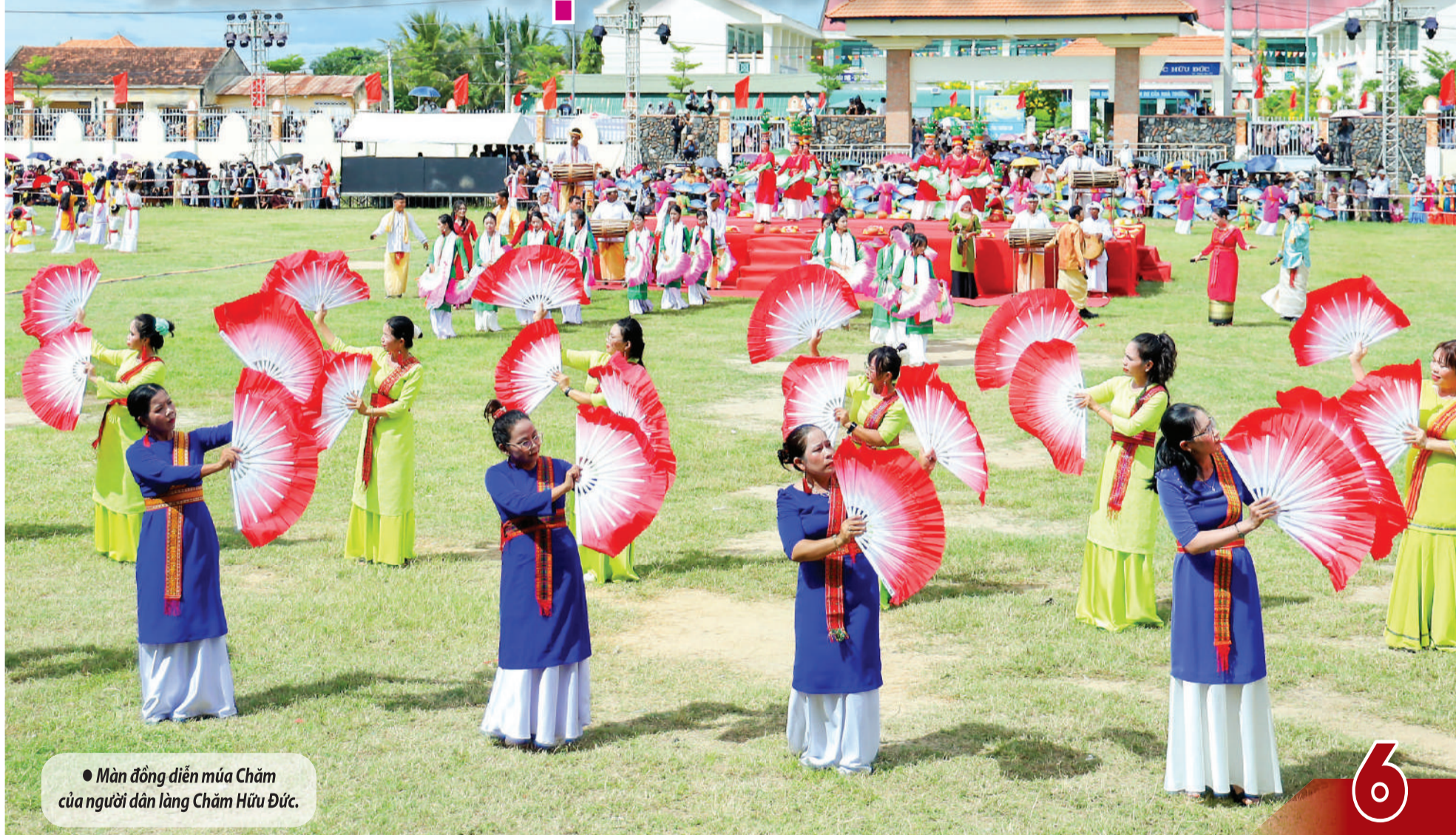
● Màn đồng diễn múa Chăm của người dân làng Chăm Hữu Đức.