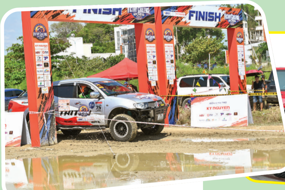
● Các đội xe đua xuất phát bắt đầu bài thi.