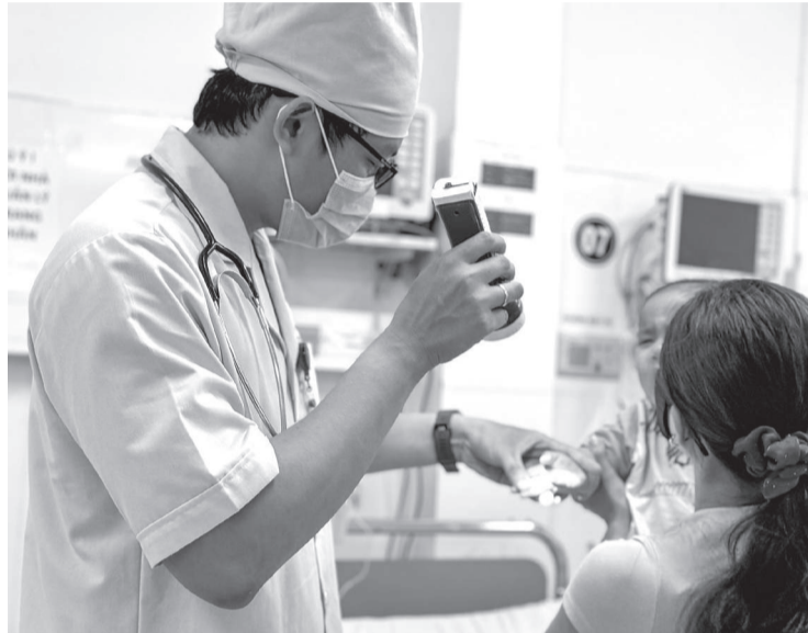
● Bác sĩ Bệnh viện Bệnh nhiệt đới Khánh Hòa kiểm tra sức khỏe cho bệnh nhi điều trị tại bệnh viện.

Mặc dù số ca mắc sốt xuất huyết và tay chân miệng trên địa bàn tỉnh đang có xu hướng giảm song các cơ sở y tế lại ghi nhận nhiều trẻ em nhập viện trong tình trạng mắc đồng thời từ 2 bệnh truyền nhiễm trở lên. Tình trạng đồng nhiễm không chỉ làm gia tăng nguy cơ biến chứng mà còn gây khó khăn cho công tác chẩn đoán, điều trị, đòi hỏi đội ngũ y, bác sĩ phải theo dõi chặt chẽ và xử lý kịp thời.