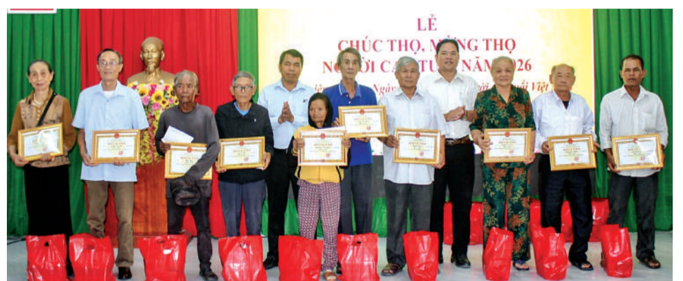
● Lãnh đạo xã Công Hải trao quà cho người cao tuổi.

Tại buổi họp mặt, các đại biểu cùng ôn lại quá trình hình thành, phát triển của Hội NCT Việt Nam và vai trò quan trọng của NCT trong đời sống xã hội. Dịp này, Hội NCT phường tặng