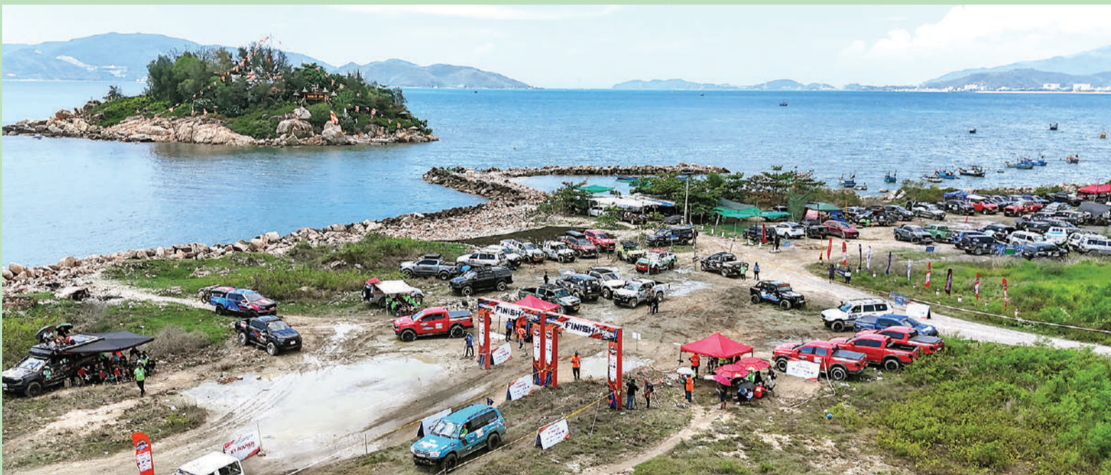
● Quang cảnh điểm thi hạng cơ bản tại Hòn Đò.

Trong đời sống văn hóa truyền thống của đồng bào Chăm, các loại hình nghệ thuật trình diễn dân gian như: Dân vũ, dân ca, dân nhạc như là hơi thở và được hình thành, phát triển từ hoạt động sinh hoạt, tín ngưỡng truyền thống. Người Chăm đặc biệt yêu thích nghệ thuật múa với các vũ điệu vừa mang nét đặc trưng, vừa đa dạng, thường được biểu diễn sinh động trong các dịp lễ hội, sinh hoạt cộng đồng trên nền nhạc cụ truyền thống như: Trống paranung, trống ghinăng và kèn saranai. Nghệ thuật múa dân gian Chăm phổ biến với 2 nhóm chính: Múa thiêng và múa sinh hoạt. Múa thiêng thường diễn tả, mô phỏng cảnh dâng lễ hương vọng thần linh ở những ngôi đền, tháp. Những thiếu nữ Chăm vừa đội trên đầu cây nến, bình nước, hoa trái, trầu cau... vừa múa để dâng mừng lên các vị thần. Còn múa sinh hoạt (múa quạt, múa dao, múa roi, múa chèo thuyền, múa âm dương, múa lu nước) lại thể hiện tâm tư, tình cảm hoặc tái hiện những