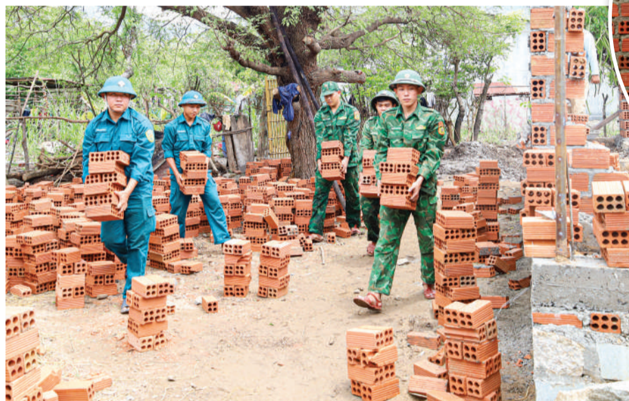
• Những người lính biên phòng và các chiến sĩ dân quân cùng nỗ lực để người dân sớm có căn nhà mới.

độc hóa học là chủ trương mang ý nghĩa nhân văn sâu sắc, thể hiện sự quan tâm, tri ân của Đảng, Nhà nước đối với người có công với cách mạng và thân nhân người có công với cách mạng nhằm bảo đảm 100% người có công và gia đình người có công với cách mạng được chăm lo tốt về nhà ở.