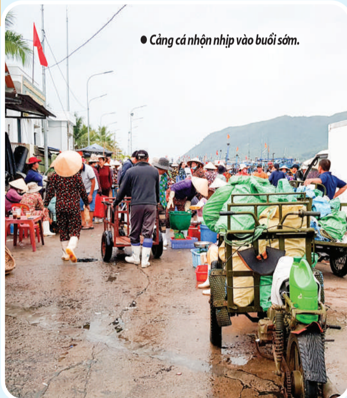
● Cảng cá nhộn nhịp vào buổi sớm.

Sinh ra ở làng chài Cửa Bé (thuộc phường Nam Nha Trang), tuổi thơ của tôi gắn liền với hình ảnh tàu, thuyền chen chúc cập bến, kẻ mua người bán nhộn nhịp và cả ký ức lẻo đẹo theo sau mẹ đi xuống cảng cá buổi sớm. Đặt chân đến nơi ấy như bước vào một miền ký ức thân thuộc.