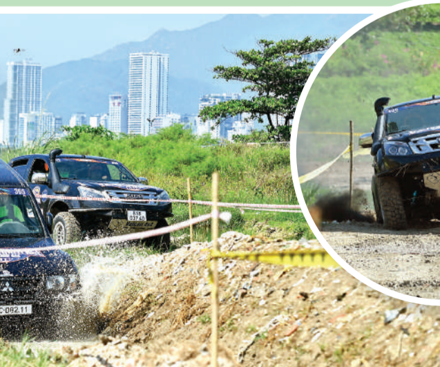
● Các chương ngại vật khiến xe của các đội đua gặp nhiều khó khăn.