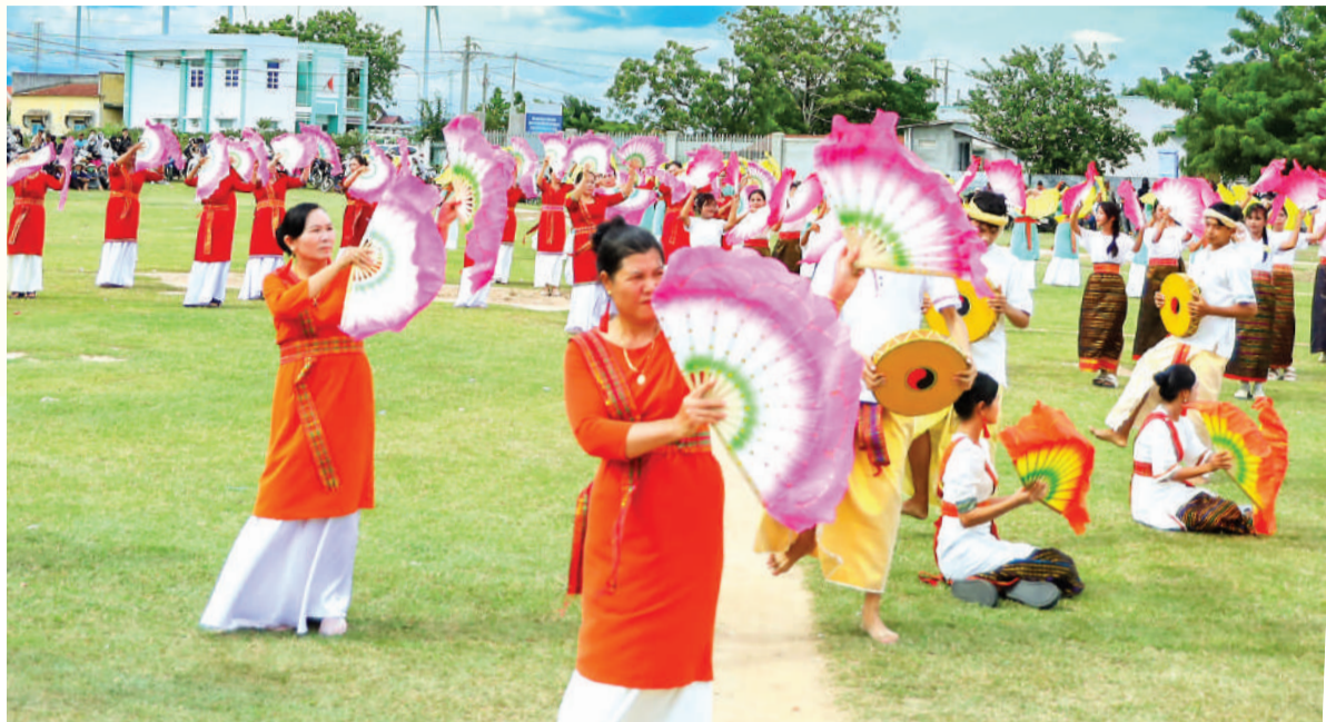
● Màn đồng diễn múa Chăm của người dân làng Chăm Hậu Sanh.

Một lần đến làng Chăm Hữu Đức đúng vào dịp Lễ hội Katê, chúng tôi rất ấn tượng với những màn đồng diễn dân vũ do chính người dân địa phương biểu diễn. Giữa không gian