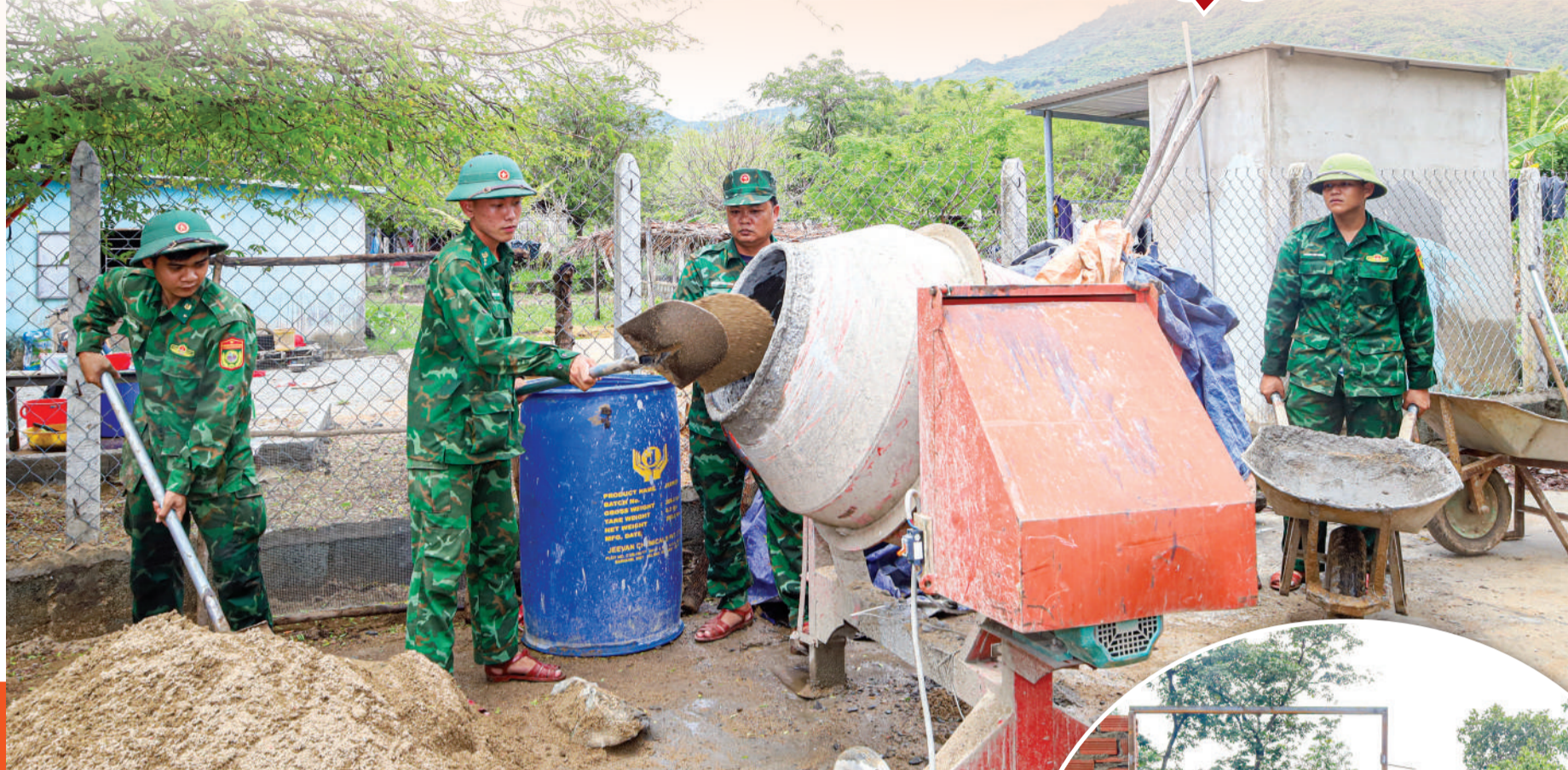
• Dù đã quá trưa, tranh thủ lúc tanh mưa, cán bộ, chiến sĩ Đồn Biên phòng Vinh Hải và Đồn Biên phòng Thanh Hải vẫn tranh thủ làm việc ngay.