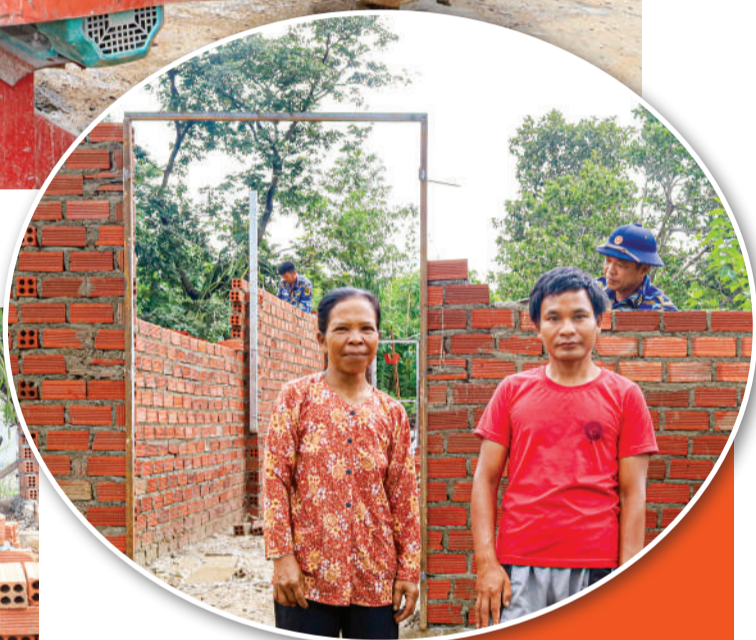
• Ông Cadá Dê và chị gái vui mừng trước căn nhà mới đang dần thành hình bởi bàn tay cần mẫn của các cán bộ, chiến sĩ.