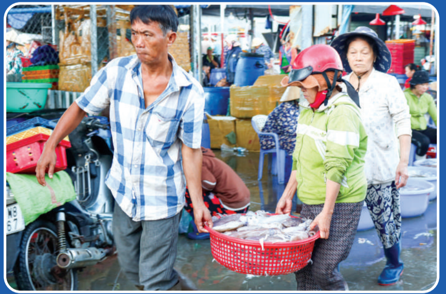
● Rộn ràng bến cảng.