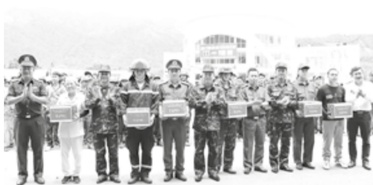
● Các đồng chí lãnh đạo tỉnh và phường Nam Nha Trang tặng quà cho các lực lượng tham gia diễn tập thực binh.