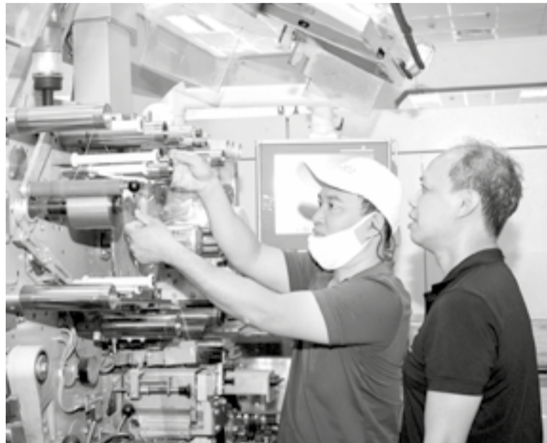
● Công nhân Nhà máy Thuốc lá Khatoco Khánh Hòa có nhiều sáng kiến, cải tiến trong lao động.