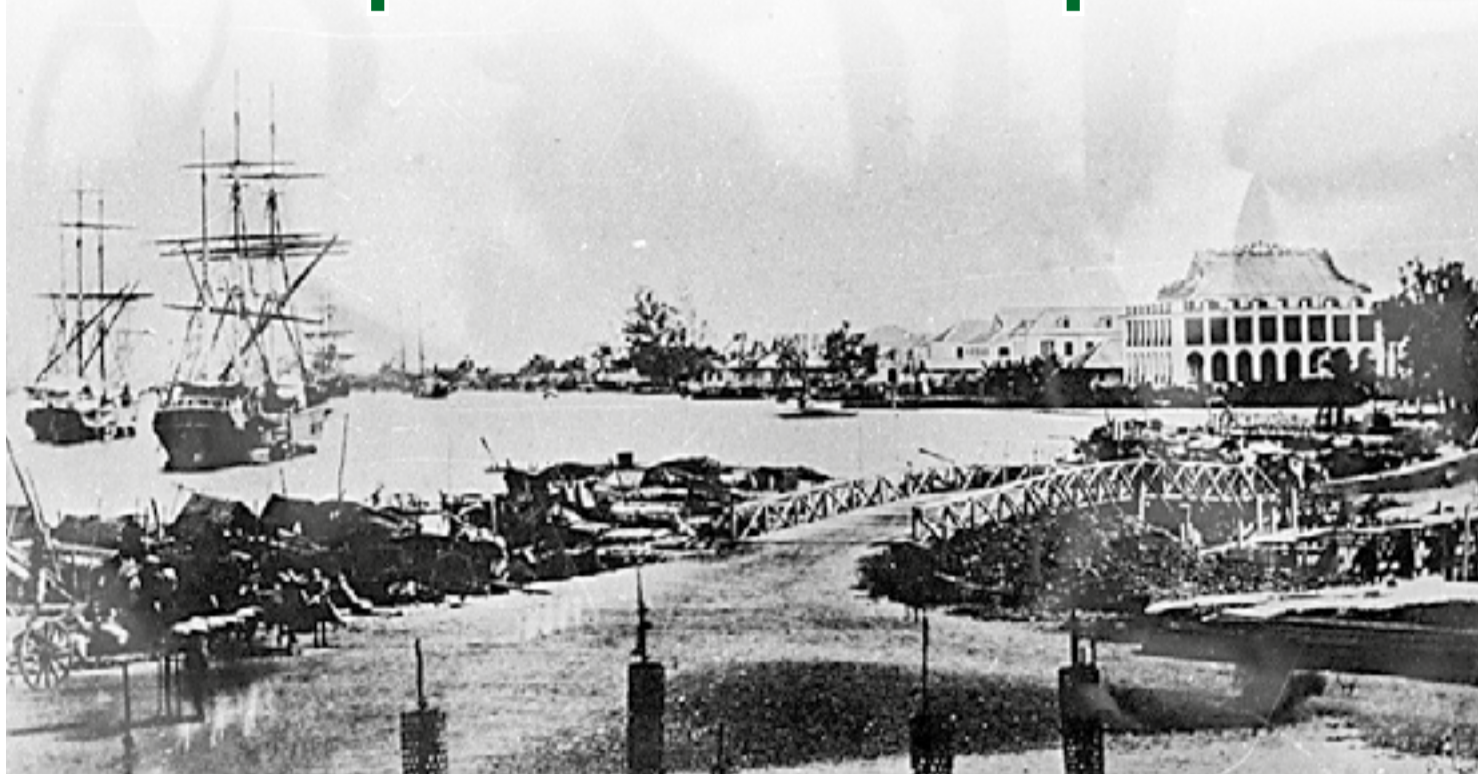
● Bến Nhà Rồng, nơi người thanh niên yêu nước Nguyễn Tất Thành ra đi tìm đường cứu nước năm 1911.

Trong quá trình tìm đường cứu nước, Nguyễn Ái Quốc đã đi qua các châu lục, khảo sát nhiều nước thuộc địa và những nước tư bản tiên tiến điển hình thời bấy giờ như: Mỹ, Anh, Pháp, đã tiếp xúc nhiều người, nhiều nhà tư tưởng nhưng tất cả chưa mang lại lời giải cho cách mạng Việt Nam; chỉ có học thuyết Mác - Lênin và Quốc tế III là ủng hộ phong trào giải phóng dân tộc, giải phóng thuộc địa. Trong tác phẩm “Đường cách mệnh”, Người chỉ rõ: Bây giờ học thuyết nhiều, chủ nghĩa nhiều nhưng chủ nghĩa chân chính nhất, cách mạng nhất là chủ nghĩa Mác - Lênin.