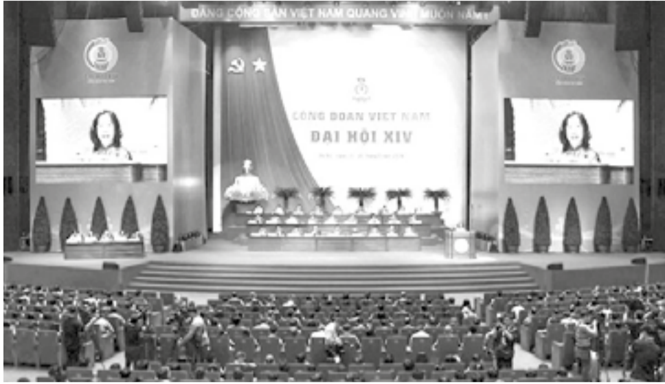
● Toàn cảnh đại hội.