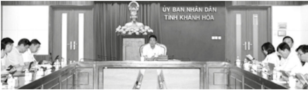
● Quang cảnh cuộc họp.