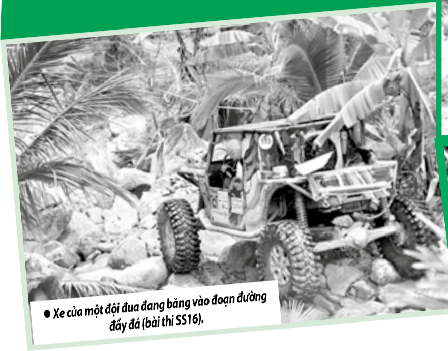
● Xe của một đội đua đang băng vào đoạn đường đầy đá (bài thi SS16).