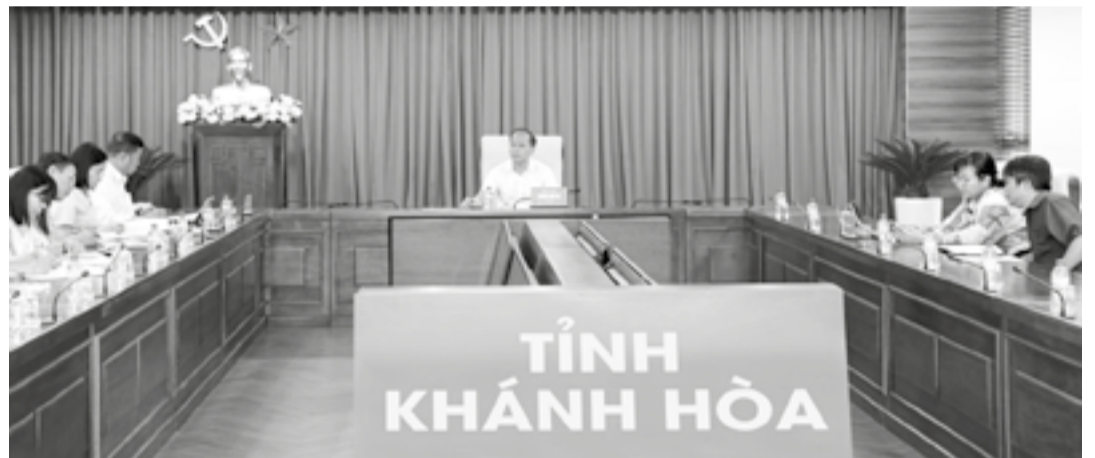
● Quang cảnh buổi làm việc.