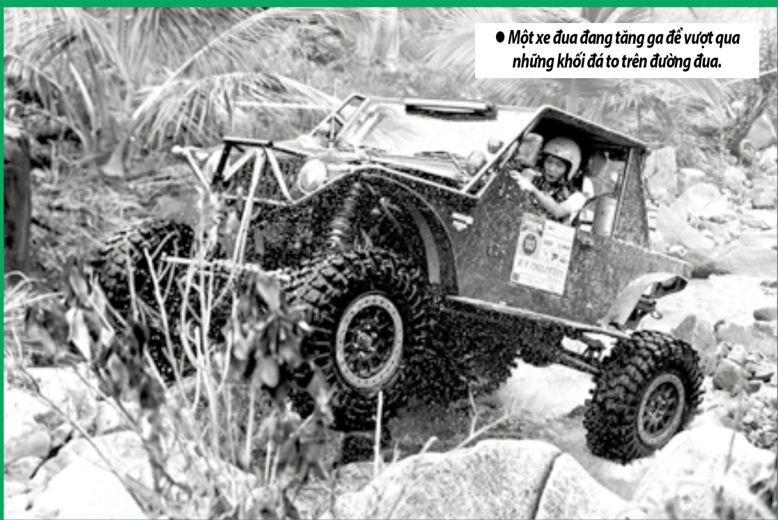
● Một xe đua đang tăng ga để vượt qua những khối đá to trên đường đua.