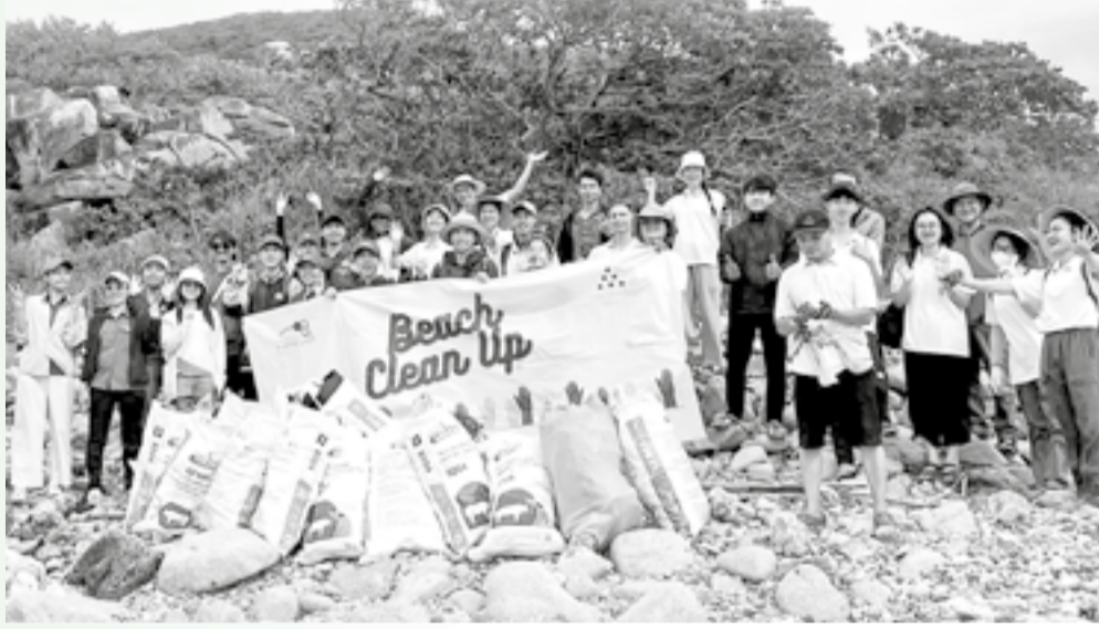
● Các bạn trẻ tham gia thu gom rác thải ven vịnh Nha Trang.

Hướng tới mục tiêu trở thành thành phố trực thuộc Trung ương, tỉnh luôn xác định công tác bảo vệ môi trường (BVMT) là nhiệm vụ trọng tâm, nền tảng cho sự phát triển bền vững; đồng thời huy động sự vào cuộc của cả hệ thống chính trị, cộng đồng doanh nghiệp và các tầng lớp Nhân dân trong công tác BVMT.