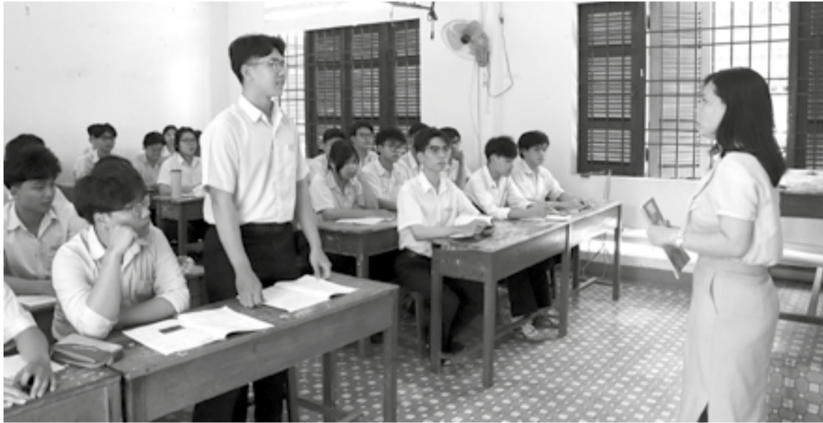
● Một tiết ôn tập của học sinh lớp 12 Trường THPT Hoàng Văn Thụ (phường Bắc Nha Trang).

Đối với công tác bảo mật đề thi, Sở GD-ĐT phối hợp chặt chẽ với Công an tỉnh xây dựng phương án in sao, vận chuyển và bàn giao đề thi theo quy trình nghiêm ngặt, bảo đảm an toàn, bí mật tuyệt đối và đúng quy chế. Bên cạnh đó, các phương án dự phòng về điện, nước, phòng cháy, chữa cháy, ứng phó với thời tiết bất thường cũng được xây dựng và rà soát kỹ lưỡng, bảo đảm mọi hoạt động diễn ra thông suốt trong quá trình tổ chức thi.