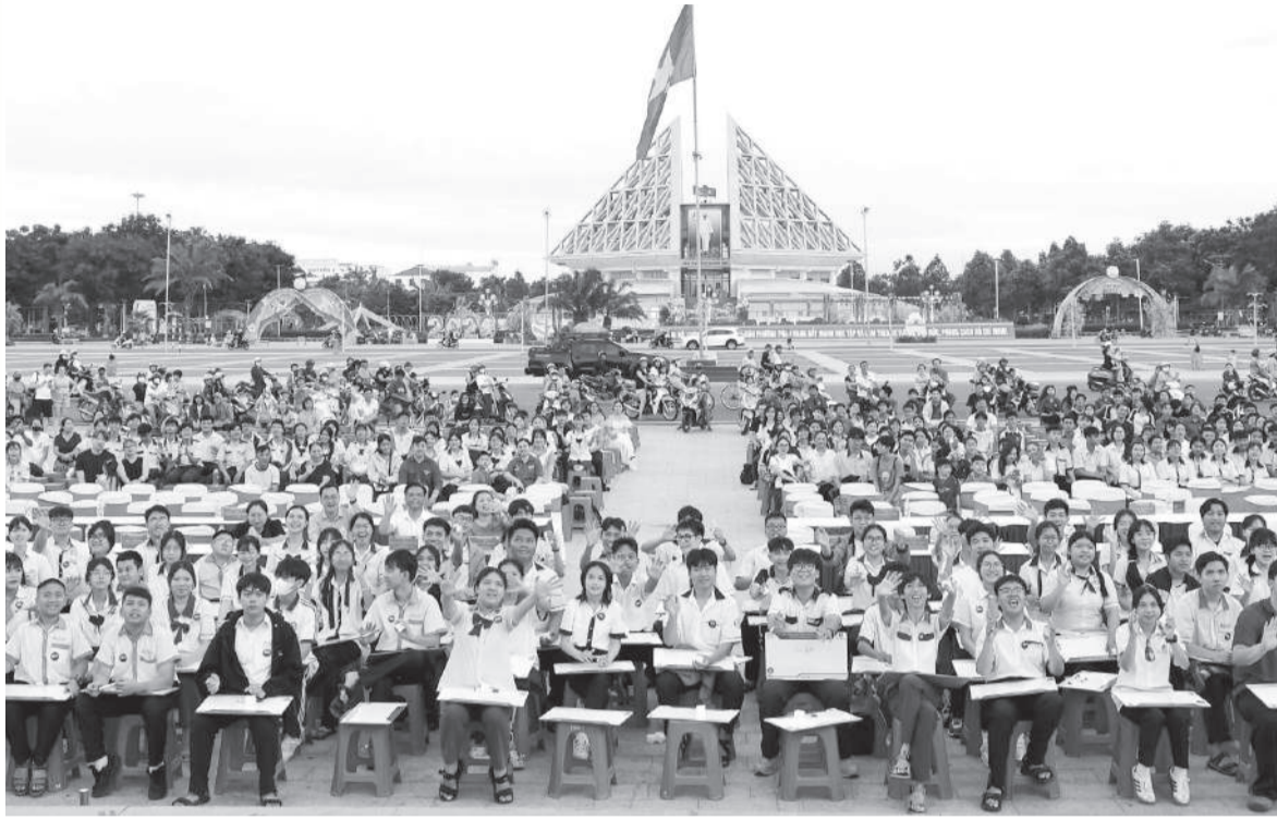
● Các học sinh khu vực phía nam của tỉnh thi "Rung chuông vàng" với các câu hỏi kiến thức bằng tiếng Anh.

Nổi bật nhất, chương trình đã xây dựng, phát triển mô hình CLB tiếng Anh và thiết kế các khóa học tiếng Anh giao tiếp cơ bản, chuyên ngành đặc thù cho từng nhóm nghề như: Tiếng Anh cho tài xế taxi và xích lô; nhà hàng, khách sạn; tiểu thương; hướng dẫn viên du lịch... Hơn 82.000 lượt người đã tiếp cận các nội dung