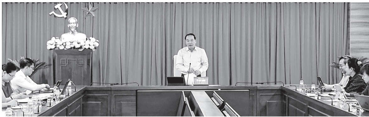
● Quang cảnh tại hội nghị.