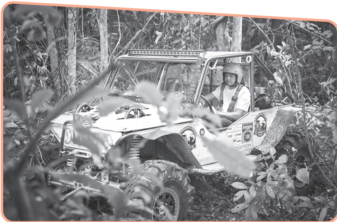
● Xe đua băng qua đoạn rừng cây um tùm.