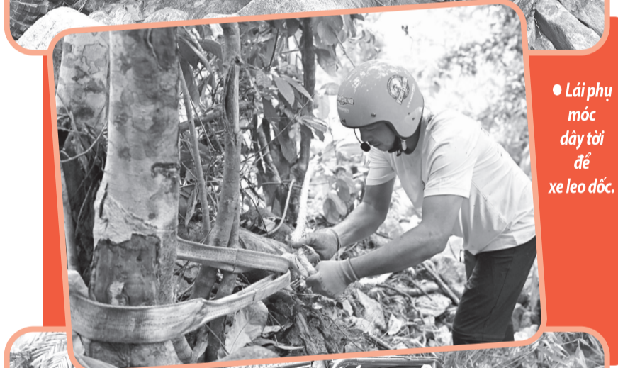
● Lái phụ móc dây tời để xe leo dốc.