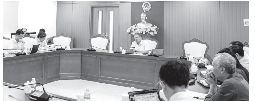
● Quang cảnh cuộc họp.