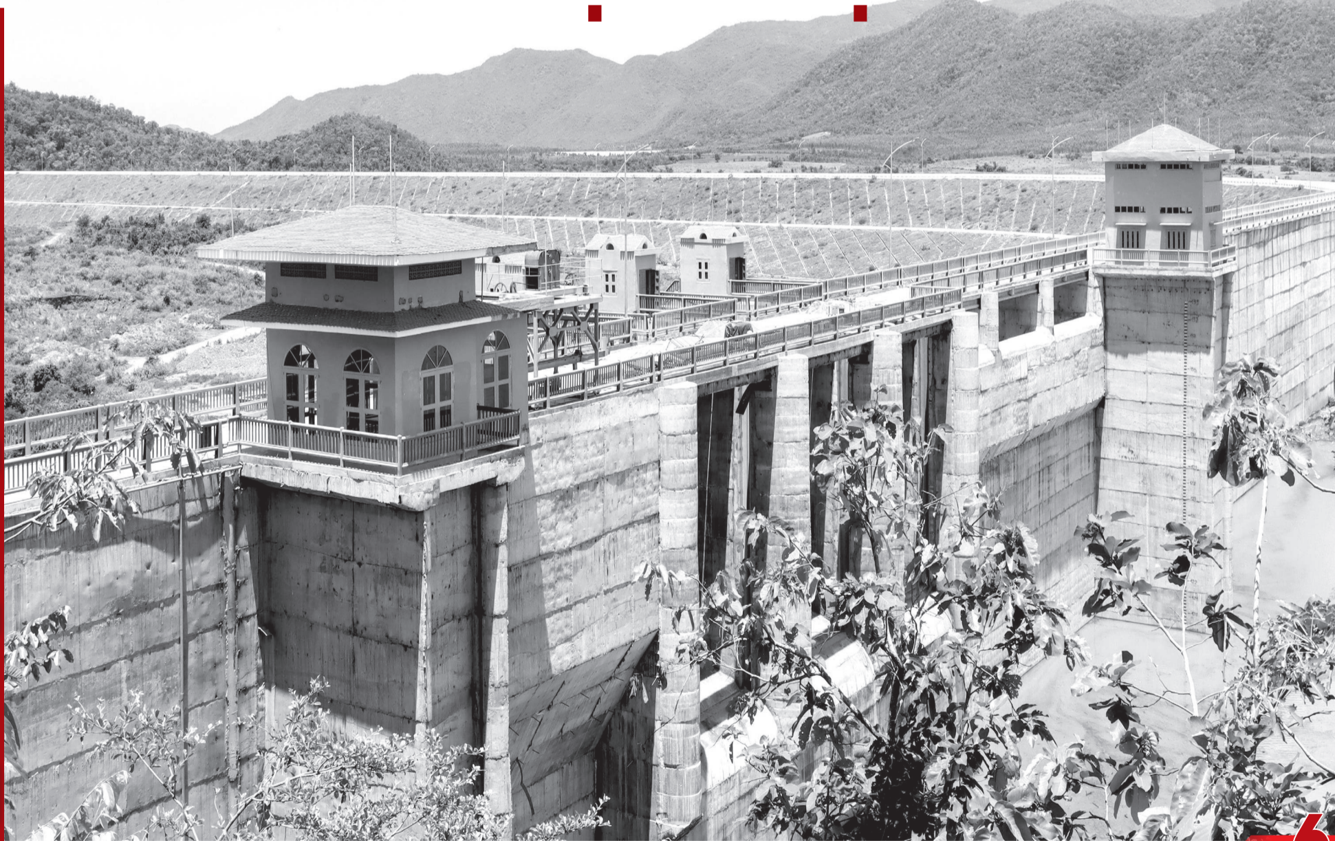
• Một góc hồ Sông Than.