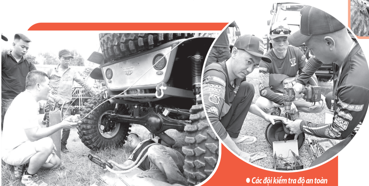
● Các đội đua kiểm tra xe.