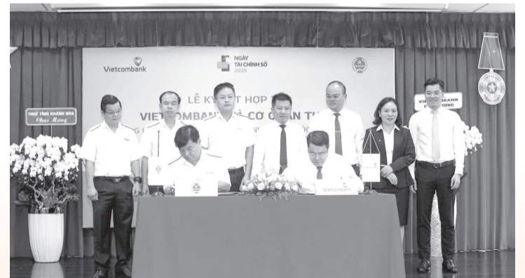
● Vietcombank Chi nhánh Khánh Hòa ký kết thỏa thuận hợp tác với Thuế tỉnh.

Bên cạnh đó, các bên sẽ thiết lập kênh tiếp nhận thông tin, hỗ trợ kỹ thuật, giải đáp vướng mắc nhanh chóng cho hộ kinh doanh, cá nhân kinh doanh trong suốt thời gian phối