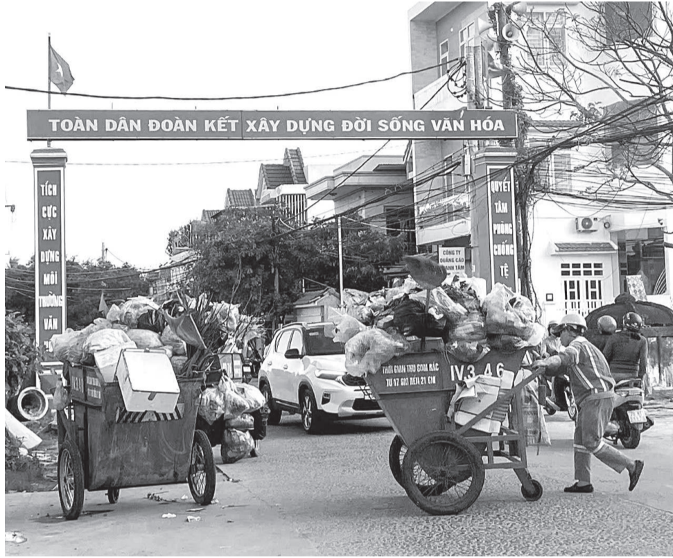
● Điểm tập kết rác trước cổng chào Tổ dân phố Xuân Lạc 2 ngổn ngang rác thải.

Nhiều năm nay, dọc các tuyến đường: Trần Hữu Duyệt, Sông Cái, Cầu Dứa - Phú Nông... (phường Tây Nha Trang) xuất hiện nhiều điểm tập kết rác tự phát làm mất mỹ quan đô thị, ô nhiễm môi trường, ảnh hưởng nghiêm trọng đến đời sống người dân. Đáng lo ngại hơn, những bãi rác tự phát này nằm cạnh công trạm y tế, khu dân cư, trường học khiến Nhân dân bức xúc.