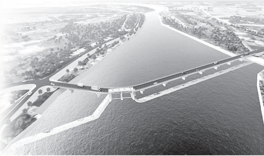
● Phối cảnh phương án đầu tư đập Nha Trinh - Lâm Cẩm.

Việc đề xuất chủ trương đầu tư hàng loạt dự án thủy lợi, phòng, chống thiên tai và hạ tầng nông nghiệp tại khu vực phía nam tỉnh đang cho thấy quyết tâm lớn của tỉnh trong việc từng bước hoàn thiện hệ thống hạ tầng thích ứng với biến đổi khí hậu, bảo đảm an ninh nguồn nước và tạo dư địa phát triển kinh tế - xã hội cho khu vực còn nhiều khó khăn. Tuy nhiên, cùng với yêu cầu cấp bách về đầu tư, lãnh đạo tỉnh cũng đặt ra yêu cầu rất cao về tính khả thi, hiệu quả và sự phù hợp quy hoạch đối với từng dự án trước khi trình cấp có thẩm quyền xem xét.