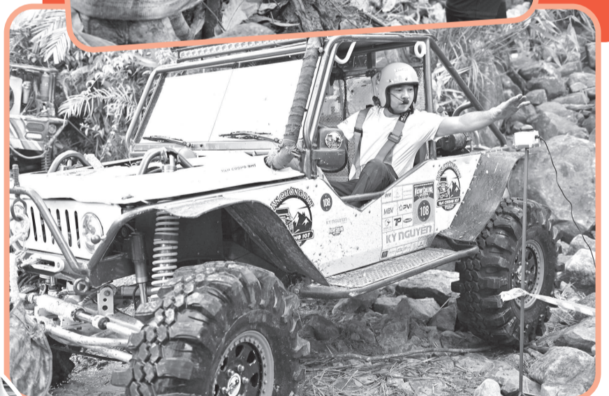
● Vận động viên bấm giờ hoàn thành bài thi.