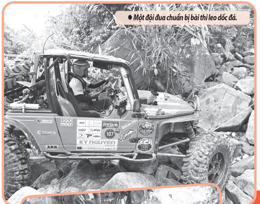
● Một đội đua chuẩn bị bài thi leo dốc đá.