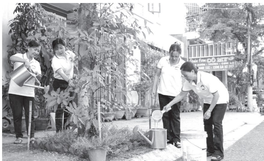
● Mặt trận phường Nam Nha Trang ra quân chăm sóc cây xanh và vệ sinh môi trường.