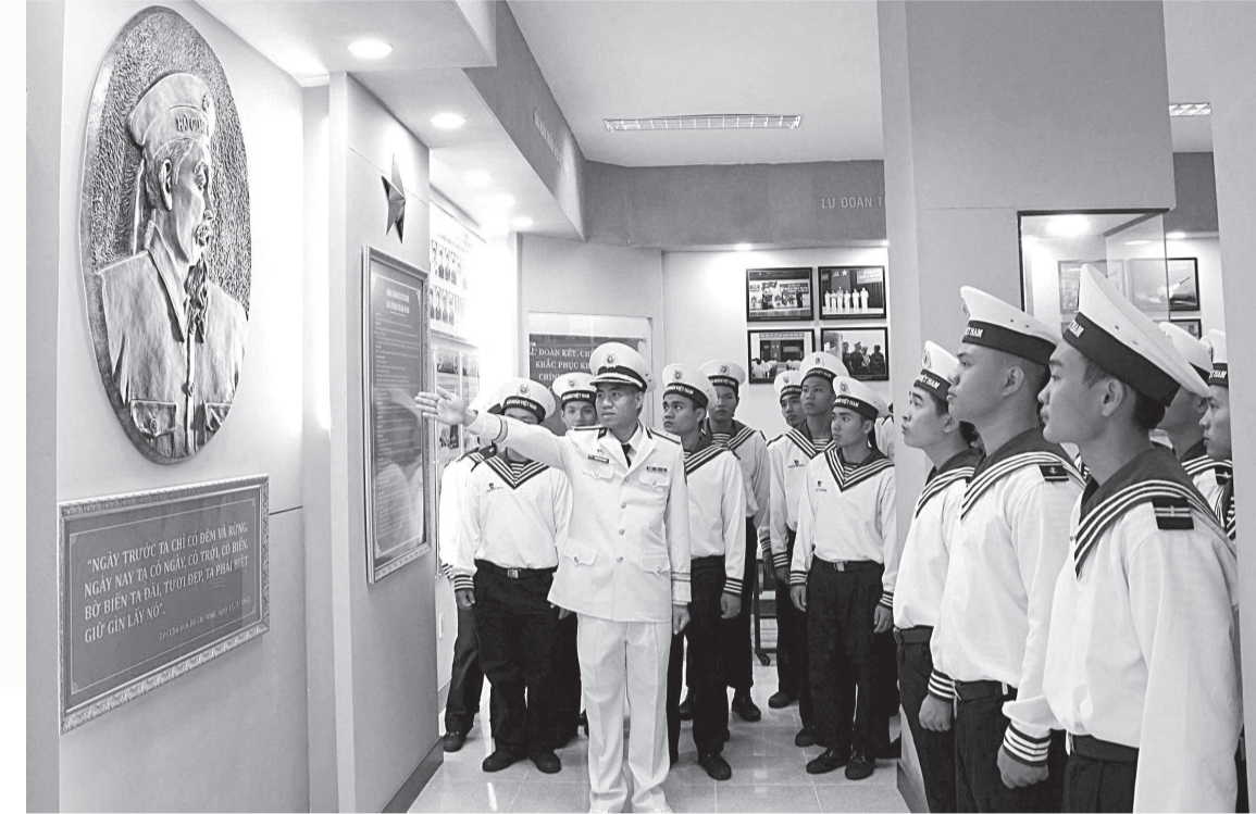
● Giáo dục truyền thống, thân thế sự nghiệp của Chủ tịch Hồ Chí Minh tại Phòng Truyền thống Lữ đoàn.

Nổi bật là thời gian qua, Lữ đoàn 685 luôn đổi mới, bút phá trong huấn luyện và công tác chuyên môn. Hằng năm, cán bộ, chiến sĩ tích cực nghiên cứu, ứng dụng sáng kiến, cải tiến mô hình học cụ, xây dựng phim huấn luyện sinh động,