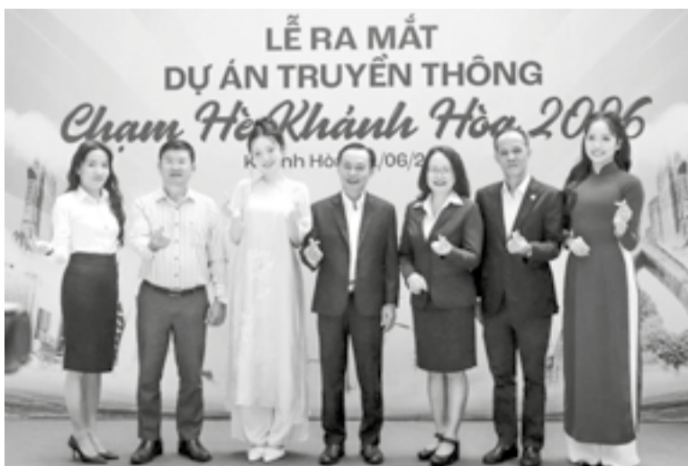
● Các đại biểu dự lễ ra mắt dự án.

“Chạm hè Khánh Hòa 2026” là dự án mang tính chiến lược, có sự phối