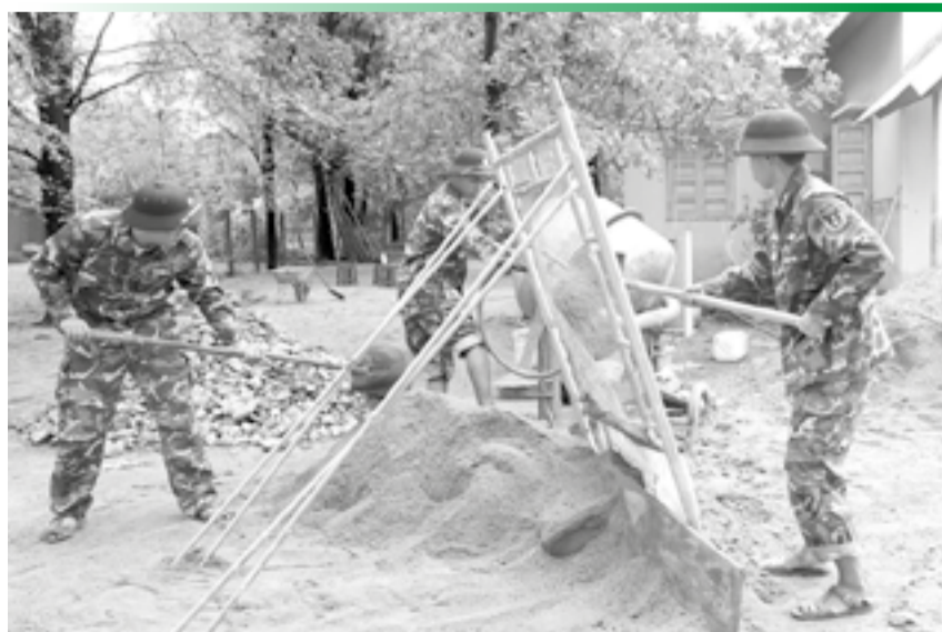
● Cán bộ, chiến sĩ tranh thủ từng khoảng thời gian để đẩy nhanh tiến độ thi công.

Thực hiện chủ trương của Thủ tướng Chính phủ về hỗ trợ xóa nhà tạm, nhà dột nát cho con em của người hoạt động kháng chiến bị nhiễm chất độc hóa học, tỉnh đang khẩn trương triển khai xây dựng và sửa chữa 52 căn nhà cho các hộ gia đình thuộc diện thụ hưởng. Đây không chỉ là hoạt động an sinh xã hội mang ý nghĩa nhân văn sâu sắc, mà còn thể hiện trách nhiệm, sự tri ân đối với những gia đình đã chịu nhiều mất mát, thiệt thòi do hậu quả chiến tranh để lại.