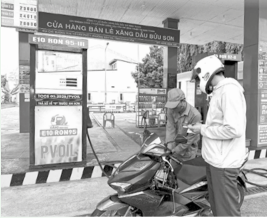
● Nhiều người dân yên tâm đổ xăng sinh học do đã tìm hiểu trước đó.

Sáng 1-6, cùng với các địa phương trong cả nước, các cửa hàng xăng, dầu trên địa bàn tỉnh chính thức triển khai kinh doanh xăng sinh học E10. Tại các cửa hàng xăng, dầu của Công ty TNHH Một thành viên Petrolimex Khánh Hòa và các doanh nghiệp đầu mối, hoạt động bán hàng diễn ra bình thường, nguồn cung được bảo đảm, người dân đồng thuận đón nhận chủ trương mới.