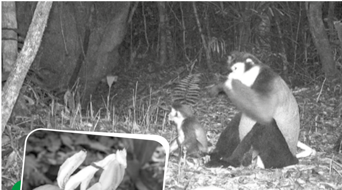
● 2 cá thể voọc chà và chân đen tại Khu Bảo tồn thiên nhiên Hòn Bà được bẫy ảnh ghi lại.

Thời gian gần đây, KBTTN Hòn Bà ghi nhận sự xuất hiện của 1 loài động vật đẹp, độc đáo là bọ ngựa phong lan. Đây là loài bọ ngựa có kích thước nhỏ, màu sắc và hình dáng cuốn hút như một đóa hoa phong lan rừng. Bên cạnh đó, thông qua hoạt động khảo sát và đặt bẫy ảnh của đơn vị quản lý cùng các nhà khoa học, khu bảo tồn còn ghi nhận sự hiện diện của nhiều loài động vật quý hiếm như: Voọc chà và chân đen, vượn đen má vàng, cu li nhỏ, khỉ đuôi vàng, khỉ đuôi lợn, kỳ đà vân, kỳ đà hoa, rùa núi vàng, rùa núi đồi, rắn hổ chúa, cóc đốm, cóc mây mắt trắng... Không chỉ phong phú về động vật, khu bảo tồn còn có nhiều loài thực vật quý hiếm như: Pơ mu, thông lá dẹt, trắc, giáng hương, sến mật, gỗ đỏ, tuế lá xẻ, tuế lược, vù hương, lan hài, lan kim tuyến... góp phần tạo nên giá trị đa dạng sinh học đặc sắc của khu vực.