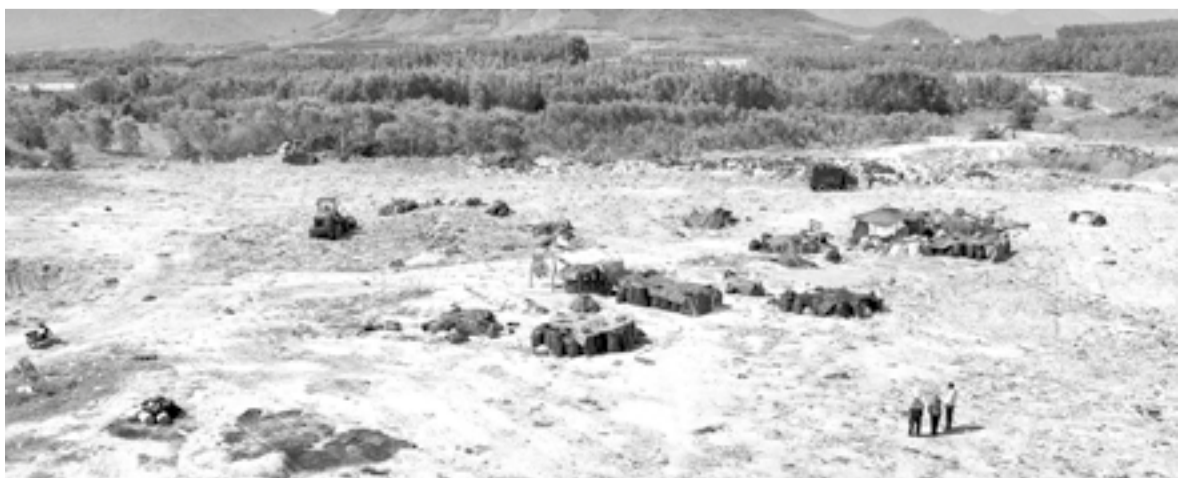
Sau phân ánh của người dân, đơn vị vận hành bãi rác đang tiến hành khắc phục.