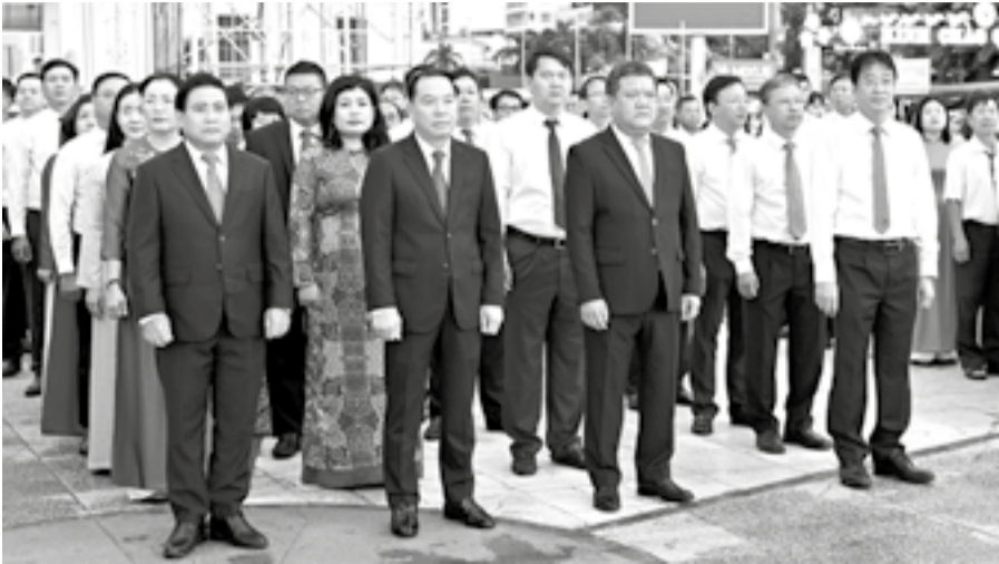
● Các đồng chí lãnh đạo tỉnh tham dự lễ chào cờ.

Sáng 1-6, tại Quảng trường 2 tháng 4 (phường Nha Trang), Tỉnh đoàn phối hợp với Sở Y tế tổ chức Lễ chào cờ tháng 6, gắn với phát động hoạt động hè và Tháng hành động vì trẻ em năm 2026 với chủ đề "Trẻ em hạnh phúc, an toàn, vững bước trong kỷ nguyên số". Dự lễ có các đồng chí: Trần Phong - Ủy viên Trung ương Đảng, Bí thư Tỉnh ủy; Hồ Xuân Trường - Ủy viên dự khuyết Trung ương Đảng, Phó Bí thư Thường trực Tỉnh ủy; Lâm Đông - Phó Bí thư Tỉnh ủy, Chủ tịch HĐND tỉnh. Cùng dự lễ có các đồng chí Ủy viên Ban Thường vụ Tỉnh ủy, Thường trực HĐND tỉnh; lãnh đạo UBND, Ủy ban MTTQ Việt Nam tỉnh, Đoàn Đại biểu Quốc hội tỉnh, các sở, ban, ngành, lực lượng vũ trang, đoàn thể; lãnh đạo các phường: Nha Trang, Bắc Nha Trang, Nam Nha Trang, Tây Nha Trang và hơn 1.000 cán bộ đoàn, phụ trách đội, đoàn viên, đội viên, thanh thiếu nhi trong toàn tỉnh.