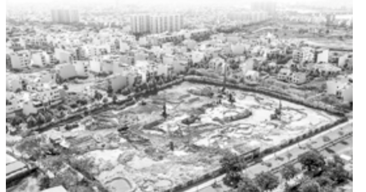
● Thi công tại Dự án Nhà ở xã hội CT-02 Khu đô thị An Bình Tân.

Sở Xây dựng vừa ban hành kế hoạch kiểm tra thực tế các dự án nhà ở xã hội đang triển khai trên địa bàn tỉnh nhằm đẩy nhanh tiến độ thi công, sớm hoàn thành các chỉ tiêu phát triển nhà ở xã hội giai đoạn 2026 - 2030 được Chính phủ giao.