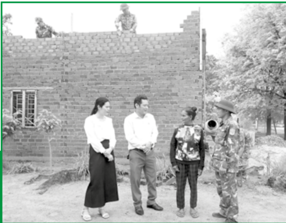
● Lãnh đạo xã Bác Ái động viên người dân và lực lượng thi công xây dựng công trình.