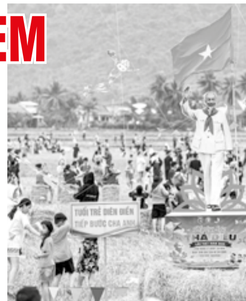
● Ngày hội thả điều dành cho trẻ em

hơn 1.000 trẻ mồ côi được hỗ trợ từ chương trình "Mẹ đỡ đầu" với mức từ 400.000 đồng đến 1 triệu đồng/tháng/trẻ; 3.585 trẻ em khuyết tật được thăm khám định kỳ, can thiệp sớm, phục hồi chức năng và kết nối điều trị chuyên sâu khi cần thiết. Các cơ sở trợ giúp xã hội đang nuôi dưỡng 370 trẻ em mồ côi, bị bỏ rơi, đảm bảo 100% trẻ được hưởng trợ cấp hằng tháng. Hoạt động chăm sóc sức khỏe trẻ em tiếp tục đạt nhiều kết quả tích cực. Các mô hình câu lạc bộ quyền trẻ em, đối thoại, sân chơi sáng tạo, STEM và robotics ngày càng phát huy hiệu quả, góp phần tạo môi trường để trẻ em phát triển toàn diện.