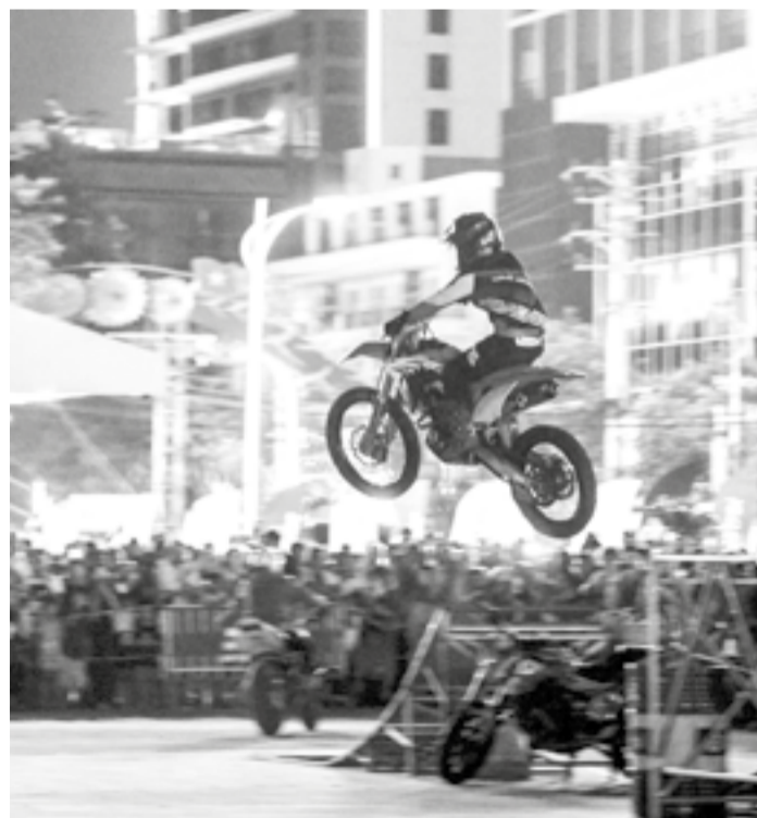
● Một pha bay xe đẹp mắt của biker chuyên nghiệp.

Theo thống kê của Sở Văn hóa, Thể thao và Du lịch, trong 3 ngày diễn ra lễ hội, địa phương đã thu hút khoảng 90.000 lượt khách, trong đó có 35.000 lượt khách quốc tế và 55.000 lượt khách nội địa. Đây là con số ấn tượng, cho thấy hiệu quả rõ nét của việc kết hợp tổ chức các sự kiện quy mô lớn với hoạt động quảng bá du lịch, góp phần gia tăng lượng khách đến Khánh Hòa.