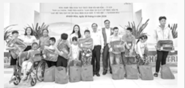
● Tặng quà cho các trẻ em khám bệnh tại chương trình.

● Ngày 30-5, tại Bệnh viện Đa khoa Yersin Nha Trang, Hội Bảo trợ người khuyết tật, bệnh nhân nghèo và quyền trẻ em tỉnh phối hợp với Câu lạc bộ Thầy thuốc họ Ngô, Câu lạc bộ Doanh nhân Khánh Hòa - Sài Gòn và đoàn y, bác sĩ Bệnh viện Nhi đồng 1 TP. Hồ Chí Minh tổ chức khám bệnh, cấp phát thuốc miễn phí cho 500 trẻ em khuyết tật, có hoàn cảnh khó khăn. Các em tham gia chương trình được nhận quà gồm ba lô, đồ dùng học tập và các sản phẩm dinh dưỡng trị giá hơn 500.000 đồng. Ban tổ chức còn tặng 20 suất học bổng, mỗi suất trị giá 1 triệu đồng cho học sinh có hoàn cảnh khó khăn vươn lên trong học tập tại 3 xã, phường: Nam Nha Trang, Tây Nha Trang và Diên Khánh. Tổng kinh phí thực hiện chương trình 330 triệu đồng, từ nguồn vận động các mạnh thường quân và nhà tài trợ. (C.ĐAN)