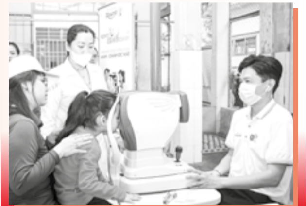
● Khám các bệnh về mắt cho trẻ em.