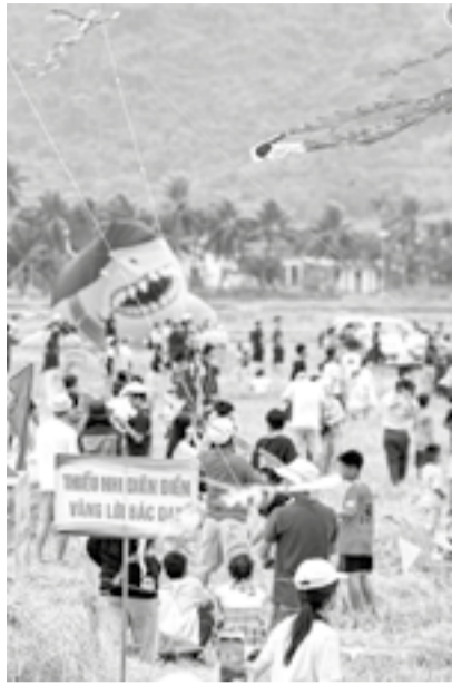
● Trẻ em tại xã Diên Điện. g Diên Khánh

Trẻ em là hạnh phúc của mỗi gia đình, là tương lai của đất nước. Với mục tiêu tạo dựng môi trường sống an toàn, lành mạnh và điều kiện phát triển toàn diện cả về thể chất lẫn tinh thần cho trẻ em, thời gian qua, các cấp, ngành, địa phương, tổ chức và cộng đồng xã hội đã triển khai nhiều hoạt động thiết thực. Qua đó, lan tỏa thông điệp chung tay vì trẻ em, tạo điều kiện để mọi trẻ em đều được sống trong yêu thương, được học tập, vui chơi và phát triển toàn diện.