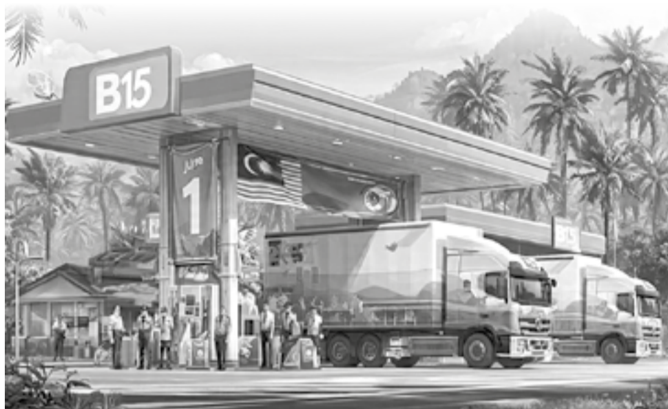
● Từ ngày 1-6, Malaysia sẽ nâng tỷ lệ pha trộn diesel sinh học lên mức B15.

Theo thông viên TTXVN tại Kuala Lumpur, từ ngày 1-6, Malaysia sẽ nâng tỷ lệ pha trộn diesel sinh học tại bán đảo Malaysia lên mức B15, nhằm tăng cường an ninh năng lượng, giảm phụ thuộc vào nguồn diesel hóa thạch nhập khẩu và thúc đẩy tiêu thụ dầu cò trong nước.