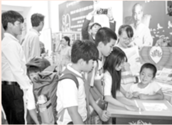
● Trẻ em đọc sách qua ứng dụng công nghệ tại Thư viện tỉnh.