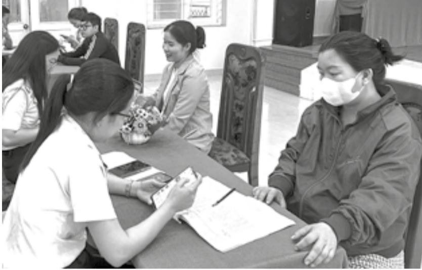
● Cán bộ Thuế cơ sở 4 hướng dẫn hộ, cá nhân kinh doanh cài đặt ứng dụng eTax Mobile trên điện thoại.

Sau 6 tháng thực hiện chuyển đổi từ thuế khoán sang kê khai, nhiều hộ, cá nhân kinh doanh do Thuế cơ sở 4 (Thuế tỉnh Khánh Hòa) quản lý đã từng bước thích ứng với phương thức quản lý mới. Việc ghi chép, quản lý doanh thu thực tế ngày càng đi vào nề nếp, góp phần nâng cao tính minh bạch và ý thức chấp hành nghĩa vụ thuế.