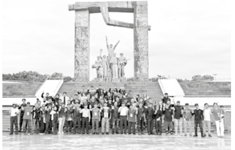
● Các biker chụp ảnh lưu lại khoảnh khắc đáng nhớ của lễ hội tại Tượng đài chiến thắng 16-4.