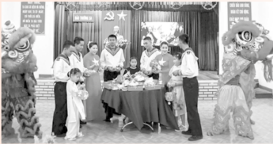
● Cán bộ, chiến sĩ và người dân chăm lo Tết Trung thu cho thiếu nhi đảo Trường Sa.