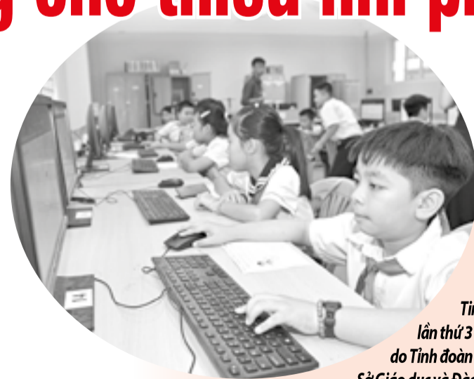
● Thiếu nhi tham gia Hội thi Tin học trẻ tỉnh lần thứ 31 - năm 2026 do Tỉnh đoàn phối hợp với Sở Giáo dục và Đào tạo tổ chức.

khai đa dạng các hoạt động phát triển năng lực tư duy sáng tạo, kỹ năng giải quyết vấn đề và học tập thích ứng thông qua các hoạt động trải nghiệm STEM, ứng dụng công nghệ số trong học tập và sinh hoạt đội như: "Hành trình khám phá công nghệ", ngày hội trải nghiệm số, các sân chơi tìm hiểu về AI, robotics, thiết kế sản phẩm sáng tạo với công nghệ mới... Mô hình "Lớp dạy bơi miễn phí" đã được triển khai rộng rãi, thu hút đông đảo đoàn viên, thanh thiếu nhi tham gia. Tỉnh đoàn, đơn vị trực thuộc và các cơ sở đoàn đã tổ chức hơn 120 lớp dạy bơi miễn phí cho hơn 3.230 thiếu nhi tham gia trực tiếp. Tỷ lệ trẻ em biết bơi sau mỗi khóa đạt 75 - 90% tùy địa bàn. Bên cạnh các sân chơi rèn luyện, nhiều mô hình thiết thực đã