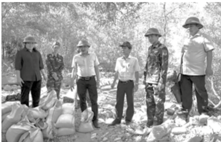
● Lãnh đạo địa phương kiểm tra, chỉ đạo sát sao quá trình xây dựng căn cứ chiến đấu mô phỏng phục vụ diễn tập.

tục gần 1 tháng nay. Với sự chỉ đạo sát sao của cấp trên và tinh thần trách nhiệm của cán bộ, chiến sĩ, đến nay các nội dung chuẩn bị tại thực địa đã cơ bản hoàn thành, bảo đảm yêu cầu về tiến độ, chất lượng phục vụ diễn tập.