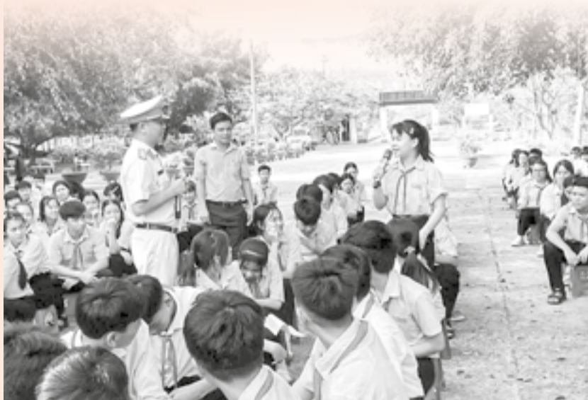
● Tuyên truyền nâng cao nhận thức về an toàn giao thông cho học sinh xã Tân Định.