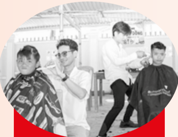
● Cắt tóc miễn phí cho trẻ em vùng đồng bào dân tộc thiểu số khu vực Ninh Hòa.