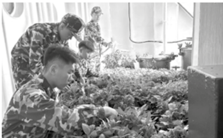
● Cán bộ, chiến sĩ chăm sóc "vườn rau" trên tàu.