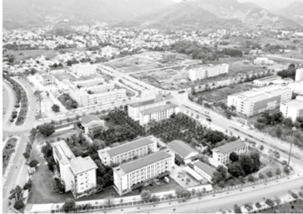
● Khu vực triển khai dự án.

án còn mở ra không gian phát triển mới cho khu vực Nam Nha Trang, góp phần hình thành trung tâm đào tạo nguồn nhân lực chất lượng cao trong tương lai.