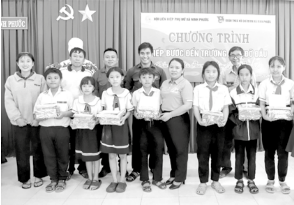
● Hội Liên hiệp Phụ nữ xã Ninh Phước phối hợp với Đoàn xã trao học bổng cho trẻ em mồ côi và các em thuộc hộ nghèo, cận nghèo.

Thời gian qua, các cấp hội phụ nữ trên địa bàn tỉnh đã triển khai nhiều hoạt động thiết thực chăm lo, hỗ trợ trẻ em có hoàn cảnh khó khăn. Qua đó, tiếp thêm động lực giúp các em vượt khó, vươn lên trong cuộc sống.