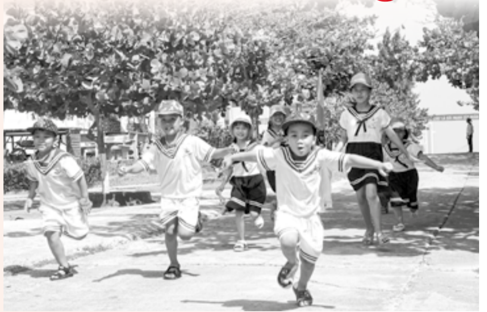
● Trẻ em trên đảo Song Tử Tây (đặc khu Trường Sa) hồn nhiên nô đùa.