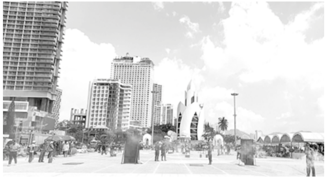
● Các đội tham gia Hội thi Nghiệp vụ chữa cháy và cứu nạn, cứu hộ năm 2024 tại Quảng trường 2 tháng 4.

UBND tỉnh vừa ban hành Kế hoạch số 6707 về tổ chức Hội thi Nghiệp vụ chữa cháy và cứu nạn, cứu hộ "Tổ liên gia an toàn phòng cháy, chữa cháy (PCCC)" năm 2026.