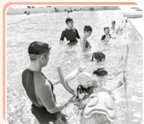
● Đoàn viên Phòng Cảnh sát phòng cháy, chữa cháy và cứu hộ, cứu nạn, Công an tỉnh dạy bơi miễn phí cho trẻ em.