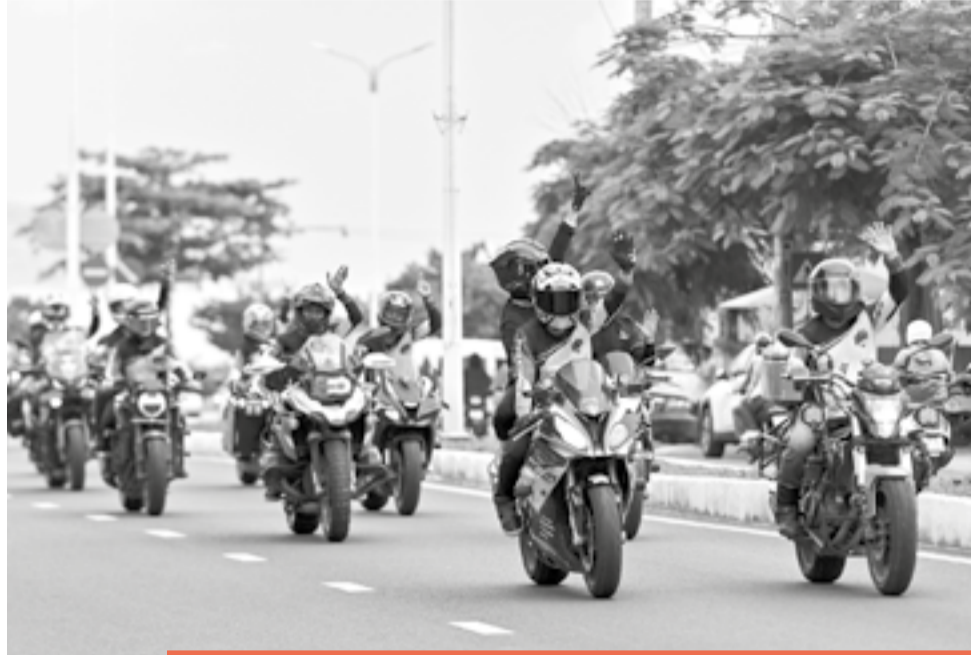
● Các biker diễu hành đẹp mắt trên tuyến đường biển Phạm Văn Đồng.

Hoành tráng, ấn tượng, đẹp mắt là những gì cộng đồng biker, người dân cùng du khách trong nước và quốc tế nói về hành trình 3 ngày (từ 29 đến 31-5) với những trải nghiệm đáng nhớ qua chuỗi hoạt động, sự kiện trong khuôn khổ Lễ hội Mô tô phân khối lớn châu Á - Thái Bình Dương (Castrol Superbike Fest 2026) lần đầu tiên xuất hiện tại Nha Trang - Khánh Hòa.