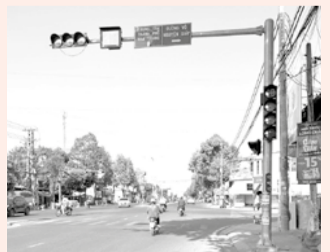
● Ảnh chụp ngày 30-5-2026.

Hiện nay, tại nút giao đường 23 tháng 10 với đường D30 (phường Tây Nha Trang) có 3 trụ đèn tín hiệu giao thông không hoạt động kể từ đợt mưa lũ cuối năm 2025 (ảnh). Người dân cho biết đã xảy ra nhiều vụ va quệt giữa các phương tiện tham gia giao thông do không có đèn tín hiệu. Rất mong cơ quan chức năng sớm khắc phục để đảm bảo an toàn giao thông tại khu vực này.