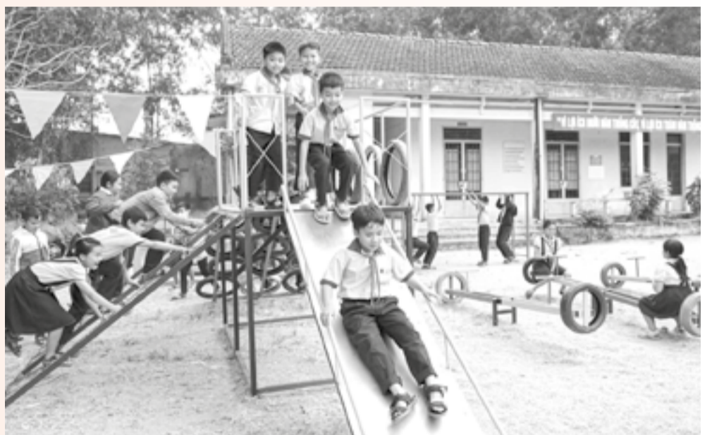
● Trẻ em xã Trung Khánh Vĩnh vui chơi tại khu vui chơi do đoàn viên, thanh niên thực hiện.