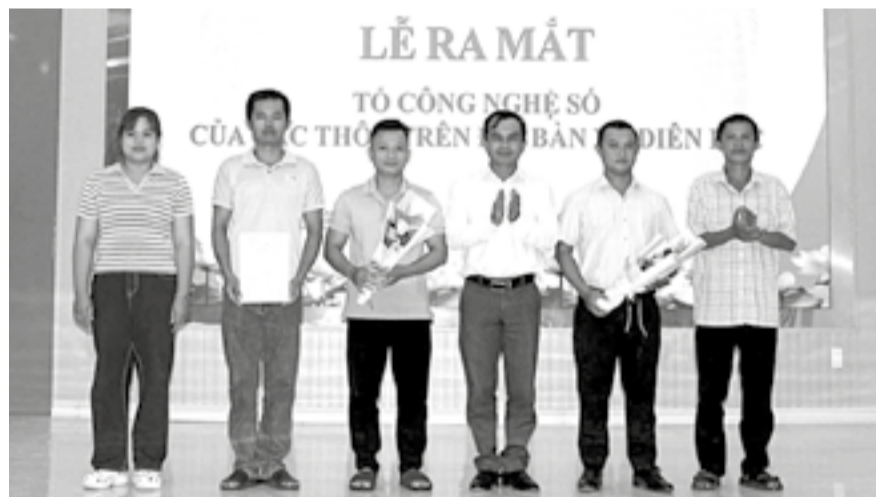
● Lãnh đạo Ủy ban MTTQ Việt Nam xã Diên Lạc trao quyết định thành lập các mô hình Tổ công nghệ số ở các thôn.

Ngày 30-5, Ủy ban MTTQ Việt Nam xã Diên Lạc phối hợp với các tổ chức chính trị - xã hội của xã tổ chức lễ ra mắt mô hình Tổ công nghệ số, Chi hội số.