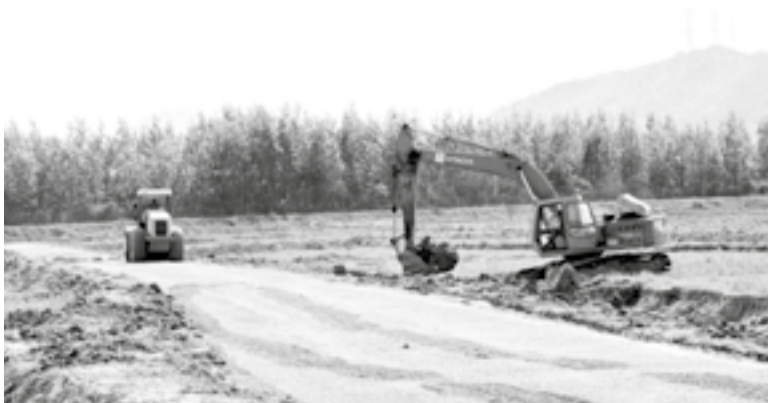
● Công trường thi công Dự án Đường giao thông liên vùng Diên Khánh.