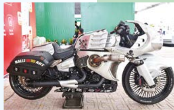
● Những chiếc xe phân khối lớn trưng bày với các chi tiết được độ lại có phần lạ mắt, độc đáo.