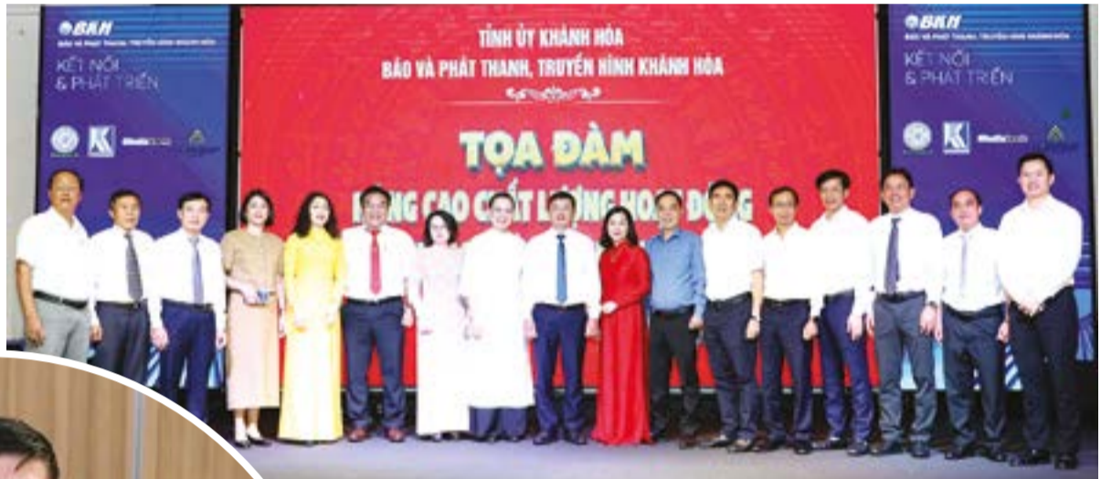
● Các đại biểu tại tọa đàm.

môi trường truyền thông hiện đại. "Báo và PTTH Khánh Hòa mong muốn nhận được sự quan tâm, định hướng của Ban Tuyên giáo và Dân