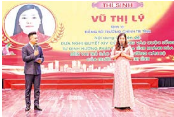
● Một thí sinh thể hiện phần thi.