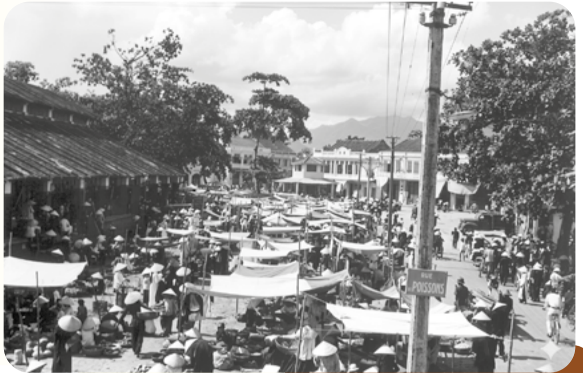
● Chợ Đầm xưa.

Con đường đó giờ đây bị chìm lấp trong cái ồn ào tấp nập của chợ, có khi thành vành đai của chợ Đầm làm cho cái tên của nó như bị quên lãng: Đường Bến Chợ - một trong những con đường đã có từ rất lâu ở Nha Trang, được hình thành cùng mảnh đất Xương Huân (Nha Trang cũ). Ban đầu nó chỉ là con đường đất nhỏ chạy ven theo đầm Én (hay còn gọi là Cù Đầm). Đây thực ra là cái phá nhỏ ăn thông với cửa sông Cái (Cù Huân), gần nơi sinh sống, làm việc của nhà bác học A.Yersin. Ông làm việc trong ngôi nhà trắng ở mỏm nhìn ra cửa sông Cái, dân làng chài gọi là Lầu ông Tư. Người Pháp đặt tên con đường là Quai du Marché - nghĩa là Bến Chợ, vì sát ven đầm, nơi tàu bè buôn, dân bản địa xa gần từ biển vào, từ Thành (Diên Khánh) xuống tạo thành các bến đậu chở hàng hóa: Cá, lò ô, gỗ, cỏ, dưa, mía, gôm, than, củi, chiếu... Đường Bến Chợ giao thương như một bến cảng, chợ nối với phố là đường Phan Bội Châu cho tới đường Phan Đình Phùng; giao nối với đường Hai Bà Trưng, Lê Lợi, Nguyễn Công Trứ, Nguyễn Thái Học (tên gọi mới sau này). Nơi đây là khu phố buôn bán sầm uất của người Hoa sang đây ngụ cư làm ăn nên rất tấp nập.