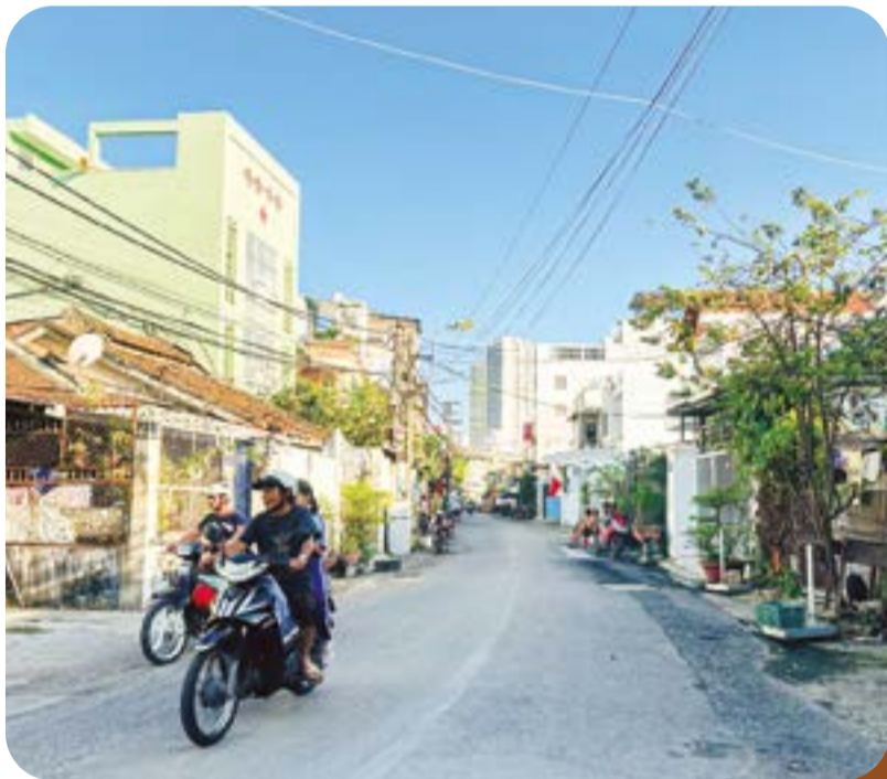
● Đường Bến Chợ hôm nay.