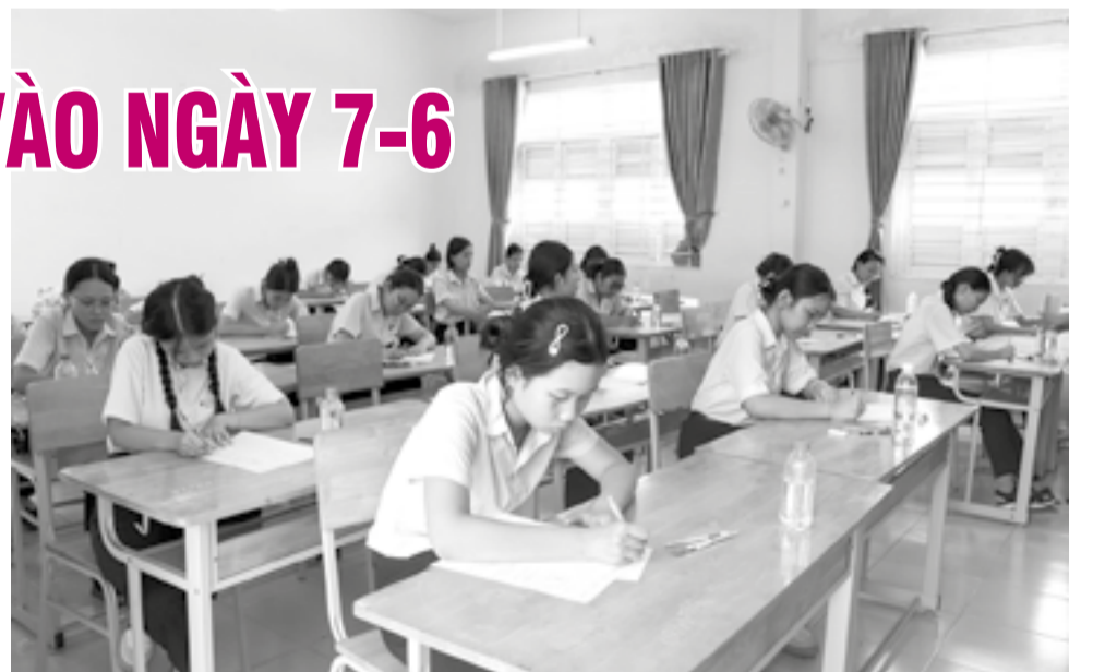
● Các thí sinh thi môn chuyên Ngữ văn tại điểm thi Trường THPT Chuyên Lê Quý Đôn - Nam Nha Trang.