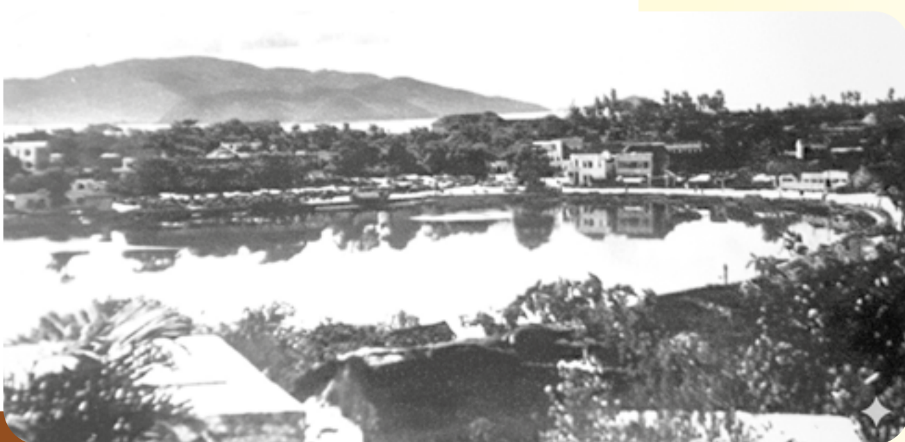
● Đường Bến Chợ xưa chạy ven đầm Cù.