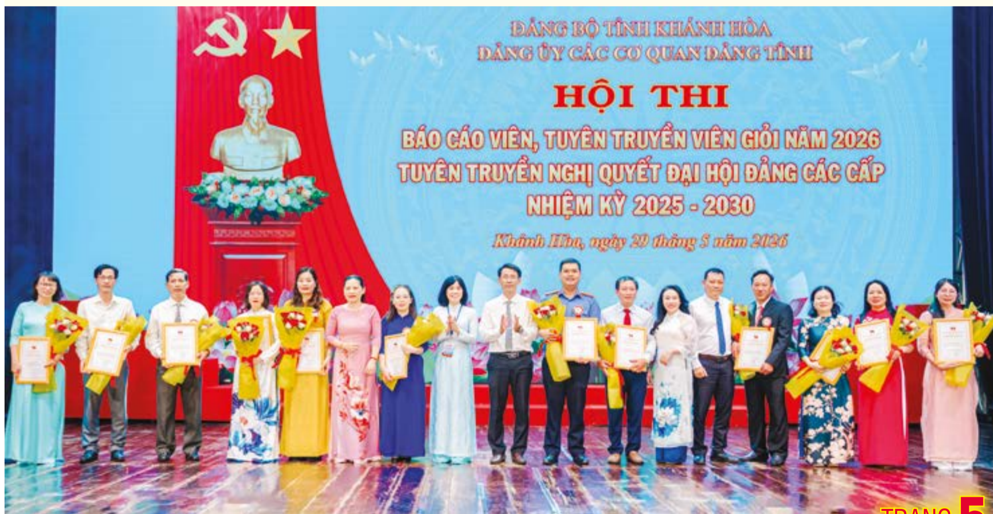
● Các thí sinh chụp hình lưu niệm với Ban Giám khảo và đại biểu.