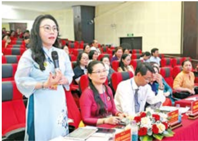
● Ban giám khảo đặt câu hỏi với thí sinh.