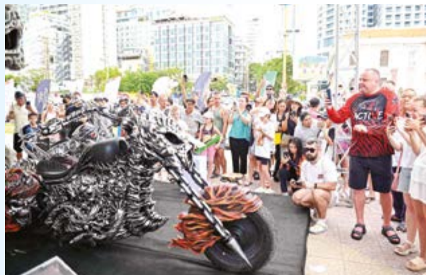
● Khu vực trưng bày xe thu hút đông đảo người dân, du khách thích thú đến chiêm ngưỡng những chiếc xe độc, lạ.