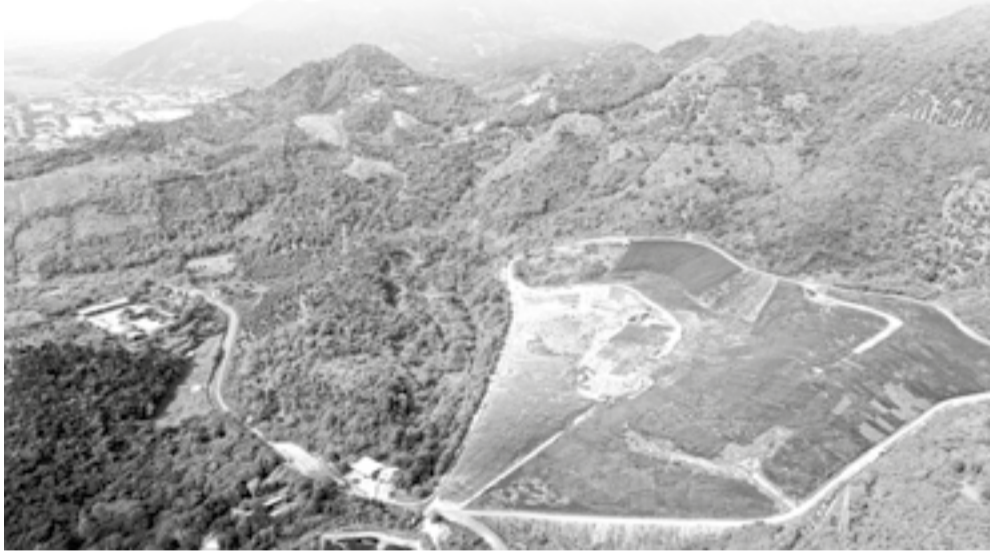
● Khu vực bãi rác Rù Rì và bãi chôn lấp rác Lương Hòa.

Để xử lý dứt điểm tình trạng nước rỉ rác từ bãi rác Rù Rì (phường Bắc Nha Trang) vẫn âm ỉ chảy ra môi trường mỗi khi có mưa kéo dài, UBND tỉnh đã yêu cầu các cơ quan, đơn vị liên quan nhanh chóng xây dựng, đưa công trình xử lý ô nhiễm môi trường tại bãi rác Rù Rì vào hoạt động trong tháng 8-2026.