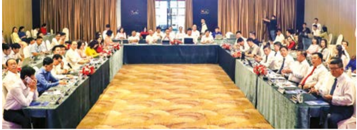
● Toàn cảnh tọa đàm.