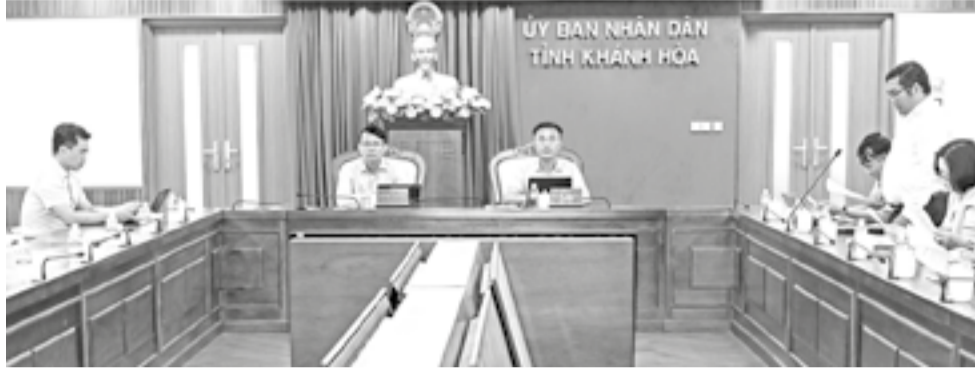
● Quang cảnh cuộc họp tại trụ sở UBND tỉnh.