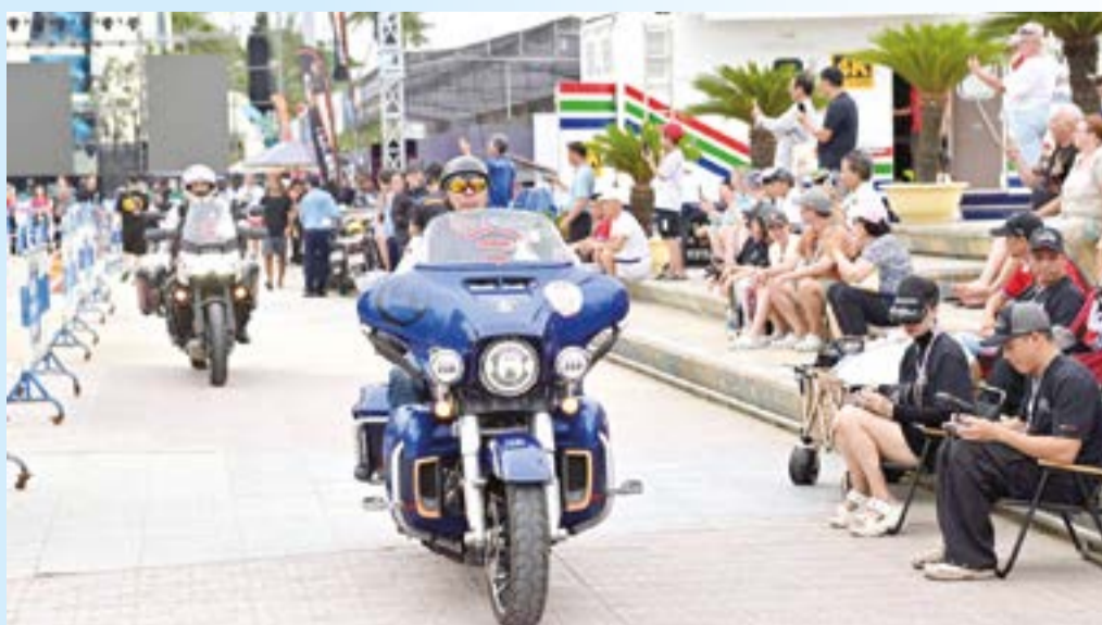
● Sự kiện còn có sự tham gia của hàng chục biker đến từ Trung Quốc.