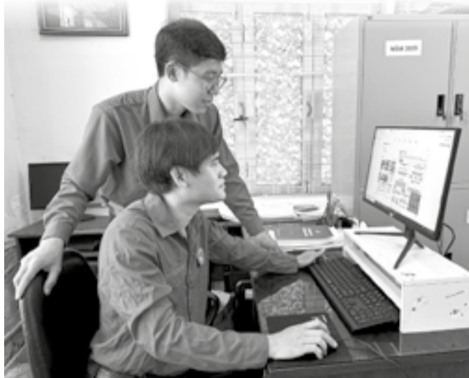
● Đoàn viên, thanh niên lan tỏa thông tin tích cực trên không gian mạng.

Cuộc cách mạng công nghiệp 4.0 đã mở ra không gian phát triển chưa từng có. Chỉ với một chiếc điện thoại thông minh, người dùng có thể tiếp cận kho tri thức khổng lồ, kết nối toàn cầu và tham gia vào mọi lĩnh vực của đời sống xã hội. Tuy nhiên, bên cạnh những tiện ích, không gian mạng cũng đầy rẫy tin giả, thông tin độc hại nguy cơ ảnh hưởng đến tư tưởng của người dân, nhất là giới trẻ. Trong bối cảnh đó, tổ chức Đoàn các cấp trên địa bàn tỉnh đã phát huy tích cực vai trò của mình trong việc định hướng cho đoàn viên, thanh niên (ĐV-TN), góp phần bảo vệ nền tảng tư tưởng của Đảng trên không gian mạng.