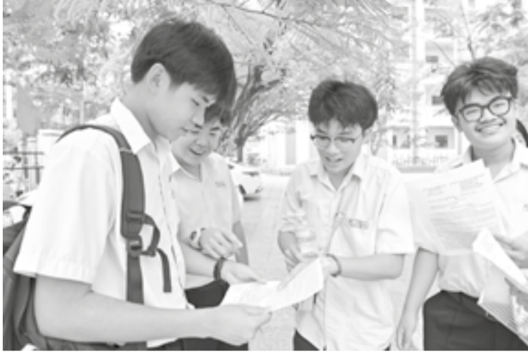
● Các thí sinh trao đổi sau môn thi Ngữ văn.

Kết thúc 120 phút làm bài môn Ngữ văn, TS tại các điểm thi rời phòng thi với tâm trạng khá thoải mái. Nhiều TS đánh giá đề thi vừa sức, có tính phân hóa, bám sát chương trình học và cấu trúc đề minh họa của Sở Giáo dục và Đào tạo. Đề thi được thiết kế theo hướng mở, câu hỏi gần gũi với đời sống, tạo điều kiện để TS thể hiện quan điểm và suy nghĩ cá nhân. Ở phần đọc hiểu văn bản (4 điểm), căn cứ vào ngữ liệu là đoạn trích "Kho báu để lại" in trong "Truyện tuyển cho em - Chọn lọc các truyện hay dành cho thiếu nhi" của Nhà xuất bản Trẻ, hệ thống 5 câu hỏi được sắp xếp theo