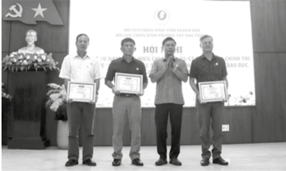
● Các tập thể có thành tích xuất sắc được biểu dương.

Chiều 28-5, Hội Cựu chiến binh (CCB) phường Tây Nha Trang tổ chức hội nghị tổng kết 10 năm thực hiện Chỉ thị số 05, ngày 15-5-2016 của Bộ Chính trị (khóa XII) về đẩy mạnh học tập và làm theo tư tưởng, đạo đức, phong cách Hồ Chí Minh.