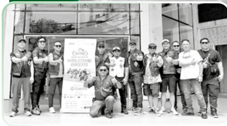
● Các thành viên Câu lạc bộ Viking Thailand háo hức tham gia Lễ hội Mô tô phân khối lớn châu Á - Thái Bình Dương tại Nha Trang - Khánh Hòa.

Lễ hội Mô tô phân khối lớn châu Á - Thái Bình Dương do Báo và Phát thanh, Truyền hình Khánh Hòa phối hợp với Sở Văn hóa, Thể thao và Du lịch, Công ty Cổ phần Tập đoàn Kỹ Nguyên tổ chức từ ngày 29 đến 31-5 tại Nha Trang.