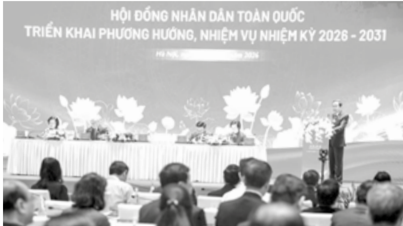
● Quang cảnh tại hội nghị.

Sáng 28-5, tại TP. Hà Nội, Ủy ban Thường vụ Quốc hội tổ chức Hội nghị toàn quốc triển khai phương hướng, nhiệm vụ của HĐND nhiệm kỳ 2026 - 2031. Các đồng chí: Trần Thanh Mẫn - Ủy viên Bộ Chính trị, Chủ tịch Quốc hội; Trần Cẩm Tú - Ủy viên Bộ Chính trị, Thường trực Ban Bí thư; Đỗ Văn Chiến - Ủy viên Bộ Chính trị, Phó Chủ tịch Thường trực Quốc hội; Phạm Thị Thanh Trà - Bí thư Trung ương Đảng, Phó Thủ tướng Chính phủ; Nguyễn Thị Thanh - Ủy viên Trung ương Đảng, Phó Chủ tịch Quốc hội chủ trì hội nghị.