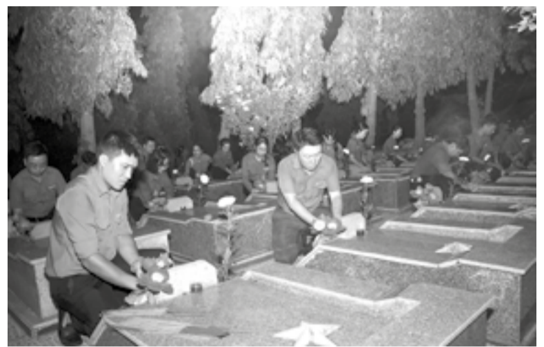
● Đoàn viên, thanh niên dâng hương, thắp nến tri ân các anh hùng, liệt sĩ tại Nghĩa trang liệt sĩ Hòn Dung.

Trong dịp này, tỉnh sẽ tập trung triển khai thực hiện tốt các chính sách ưu đãi đối với người có công với cách mạng. Sở Nội vụ sẽ tham mưu trình HĐND tỉnh ban hành 2 nghị quyết liên quan đến chế độ, chính sách ưu đãi đối với người có công; đồng thời tăng cường hướng dẫn, kiểm tra việc thực hiện các chế độ trợ cấp, quà tặng