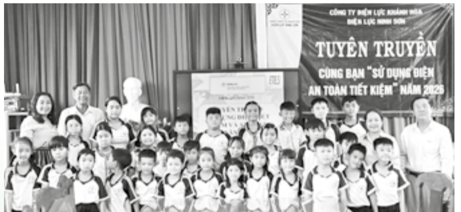
● Học sinh Trường Tiểu học Quảng Sơn B, xã Ninh Sơn tham gia chương trình tuyên truyền sử dụng điện an toàn, tiết kiệm do Điện lực Ninh Sơn phối hợp tổ chức.