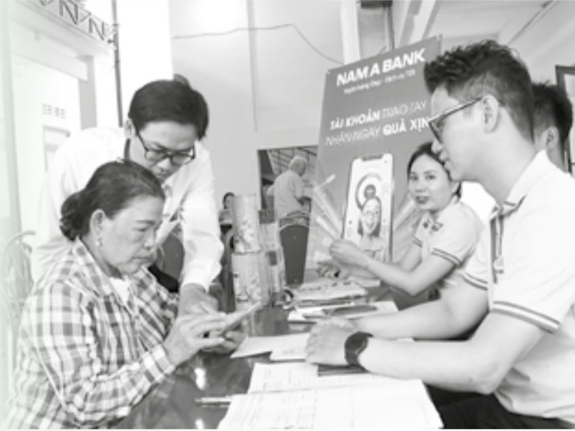
● Cán bộ ngân hàng tư vấn, hỗ trợ mở tài khoản ngân hàng để chuyển đổi chi trả trợ cấp không dùng tiền mặt cho người có công với cách mạng phường Nam Nha Trang.

Những năm qua, các cấp, ngành, địa phương trên địa bàn tỉnh đã tích cực vận động, triển khai chi trả trợ cấp an sinh xã hội hàng tháng không dùng tiền mặt cho người có công với cách mạng, người cao tuổi và các đối tượng bảo trợ xã hội. Qua đó, giúp người nhận trợ cấp được nhanh chóng, thuận tiện, an toàn, giảm thời gian đi lại, hạn chế sai sót trong quá trình chi trả.