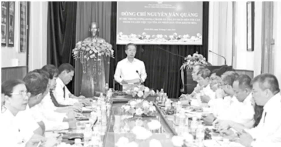
● Quang cảnh buổi làm việc.