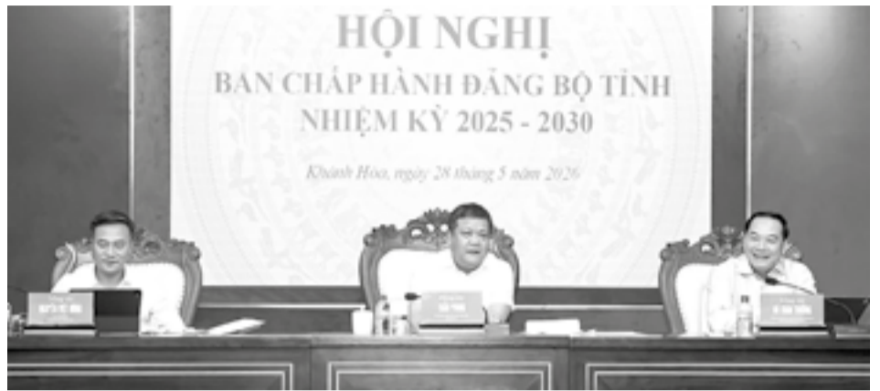
● Thường trực Tỉnh ủy chủ trì hội nghị.