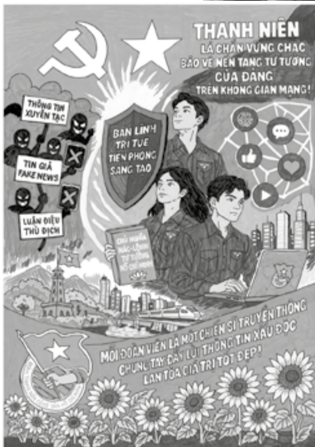
● Tác phẩm dự thi Cuộc thi chính luận bảo vệ nền tảng tư tưởng của Đảng trong đoàn viên, thanh thiếu niên năm 2026 do đoàn viên phường Đô Vinh thực hiện.

địa bàn tỉnh, tiêu biểu như Đoàn phường Nha Trang đã chứng minh tính đúng đắn của phương châm “Muốn định hướng được giới trẻ thì phải nói bằng ngôn ngữ của giới trẻ”. Là địa bàn có đông thanh niên, công tác định hướng tư tưởng được triển khai với nhiều hình thức gần gũi hơn, đơn vị đã chủ động ứng dụng công nghệ thông tin, tăng cường sử dụng Facebook, Zalo, TikTok để lan tỏa thông tin tích cực, các câu chuyện đẹp, gương thanh niên tiêu biểu cũng như các nội dung chính thống. Thay vì tuyên truyền khô cứng, nhiều nội dung được thể hiện bằng video ngắn, infographic, hình ảnh trực quan, dễ tiếp cận. Song song đó, công tác nắm bắt dư luận xã hội trong thanh niên cũng được Đoàn phường chú trọng. Cán bộ đoàn thường xuyên trao đổi, lắng nghe tâm tư, nguyện vọng của ĐV-TN để kịp thời định hướng thông tin, giải đáp những vấn đề được quan tâm. Đoàn phường phối hợp với các ngành, đoàn thể tổ chức các buổi tuyên truyền pháp luật, kỹ năng sử dụng mạng xã hội an toàn, kỹ năng nhận diện thông tin giả, thông