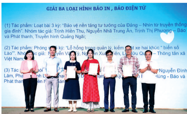
● Báo và Phát thanh, Truyền hình Khánh Hòa đoạt giải ba loại hình Báo in, Báo điện tử.