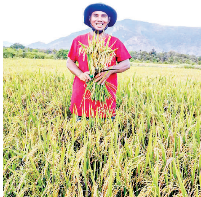
● Người dân xã Bắc Ái vui mừng đón mùa vàng bội thu.

và Môi trường: Việc một khu vực miền núi còn nhiều khó khăn, không thuận lợi trồng lúa như xã Bắc Ái lại sản xuất và có được thương hiệu gạo sạch Phước Chính được tỉnh công nhận là sản phẩm OCOP 3 sao cho thấy sự nỗ lực rất lớn của chính quyền và người dân địa phương. Về định hướng phát triển trong thời gian tới, Sở Nông nghiệp và Môi trường sẽ chỉ đạo các cơ quan chuyên môn trực thuộc phối hợp với UBND xã khảo sát, đánh giá các điều kiện thực tế để xem xét mở rộng diện tích trồng lúa của HTX Phước Chính thêm 50ha tại thôn Suối Rớ. Đồng thời, sở sẽ hỗ trợ địa phương trong việc hướng dẫn kỹ thuật, hoàn thiện quy trình kiểm soát chất lượng nhằm nâng cao thứ hạng và giá trị thương hiệu cho sản phẩm gạo sạch của HTX Phước Chính; qua đó nâng cao chuỗi giá trị nông sản, góp phần thúc đẩy phát triển kinh tế - xã hội xã Bắc Ái nói riêng và các khu vực miền núi trên địa bàn tỉnh nói chung.