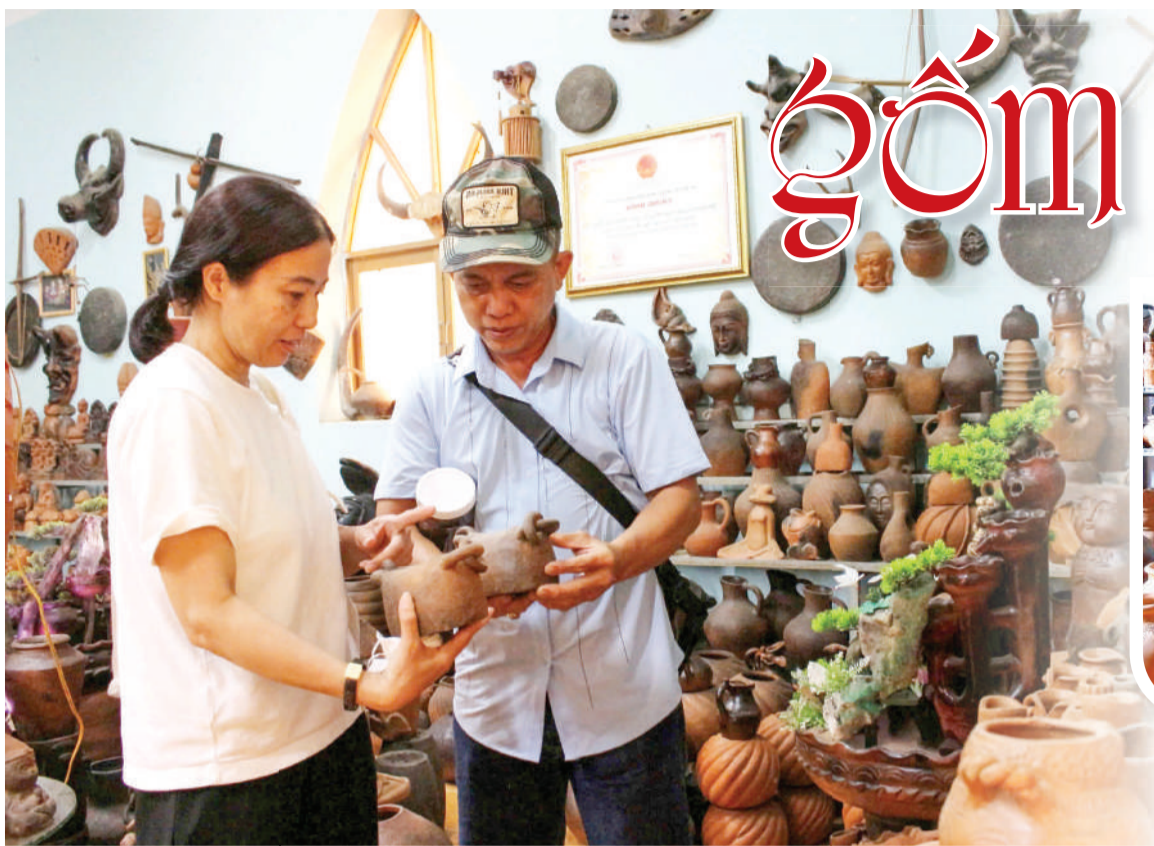
● Du khách tham quan, mua sắm tại Trung tâm Sản xuất, trưng bày làng gốm Bàu Trúc.