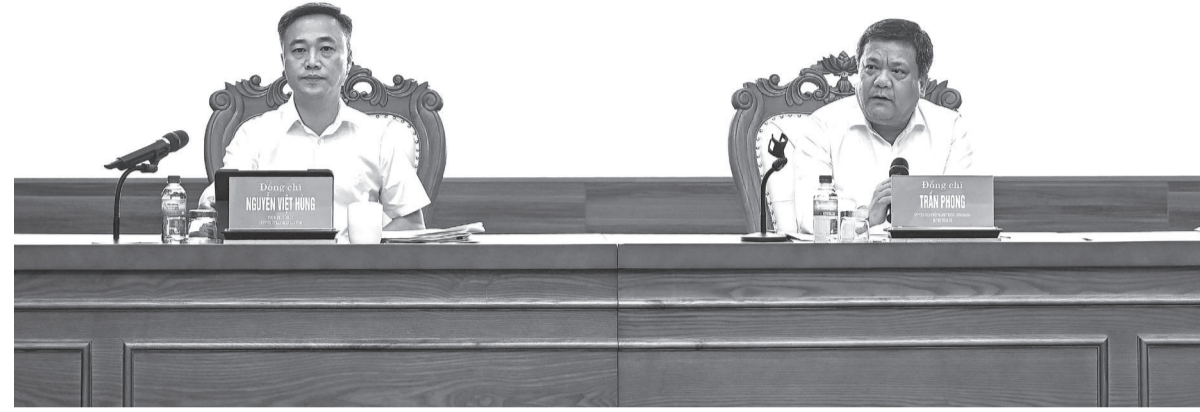
● Các đồng chí Thường trực Tỉnh ủy chủ trì hội nghị.

ơ sở; đồng thời cùng trao đổi, tháo gỡ vướng mắc trong quá trình tổ chức thực hiện nhiệm vụ.