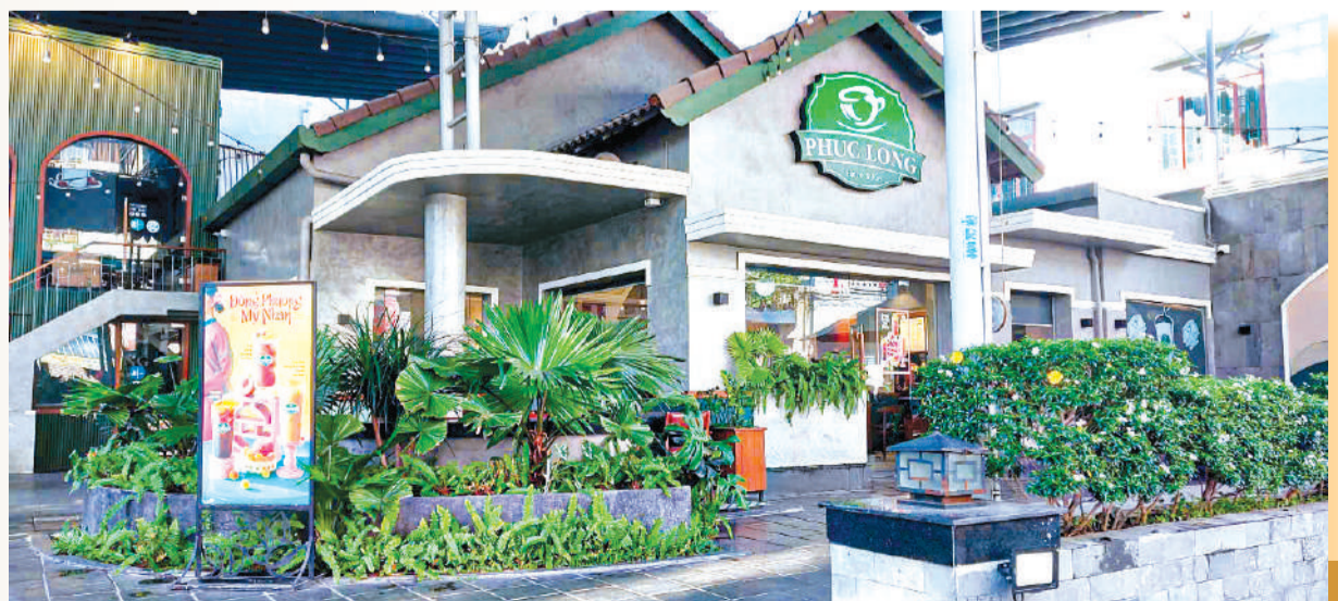
● Ngôi nhà hiện nay.