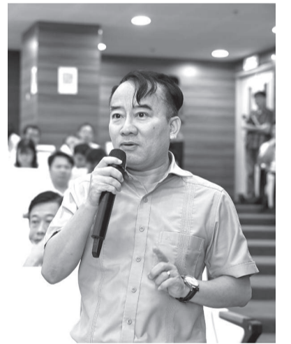
● Lãnh đạo Sở Nội vụ giải đáp ý kiến của xã, phường.