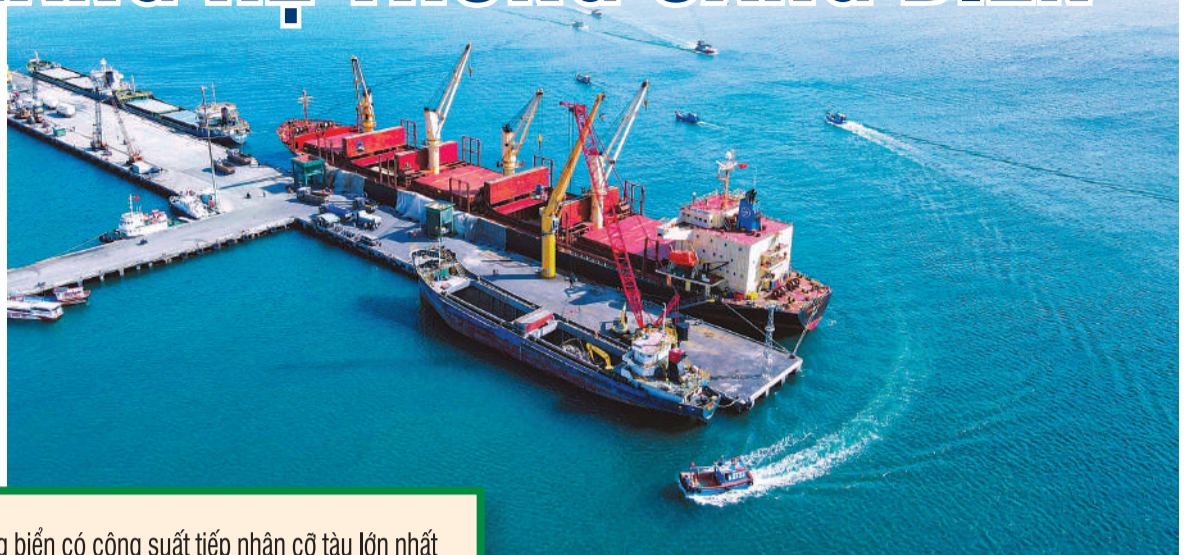
● Cảng Cam Ranh thường xuyên đón những tàu hàng lớn.

Ông Chu Văn An cho biết, Sở Xây dựng sẽ tham mưu UBND tỉnh một số nhóm giải pháp phát triển cảng biển như: Tạo chân hàng và thu hút nguồn hàng; áp dụng các chính sách, cơ chế đặc thù và chuyển đổi số trong công tác quản lý nhà nước... Đồng thời, xây dựng lộ trình đầu tư phân kỳ theo 2 giai đoạn trọng tâm, tập trung