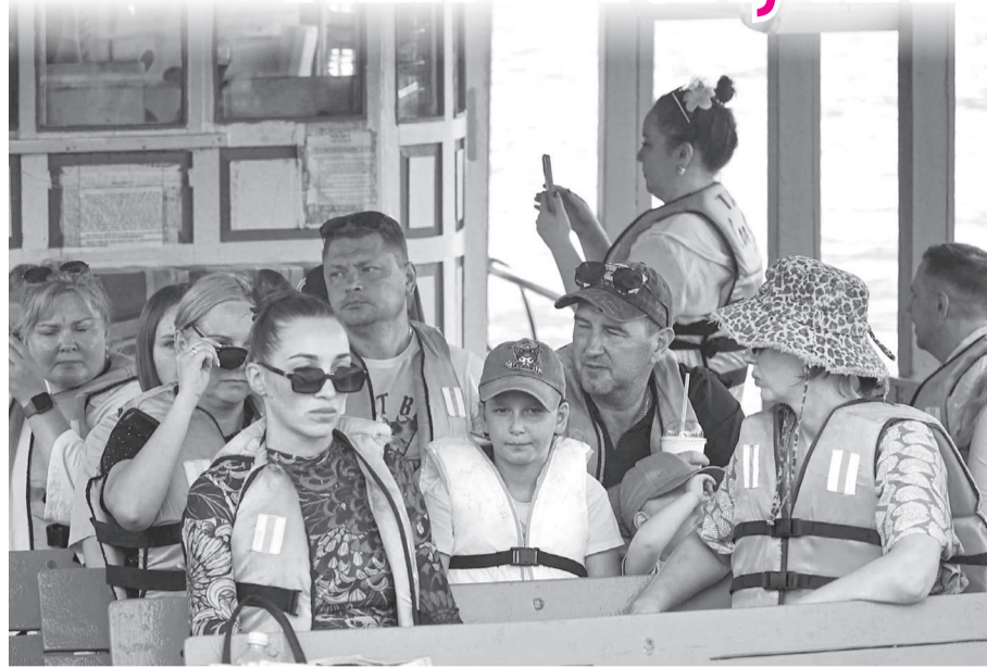
● Khách Nga đi tour tham quan vịnh Nha Trang.