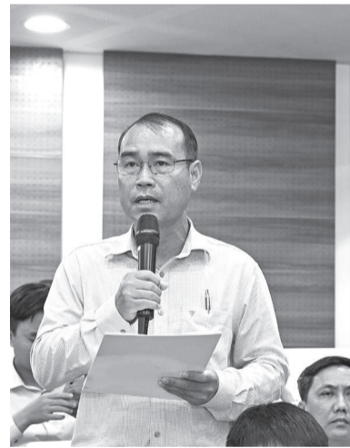
● Đại diện xã, phường phát biểu.