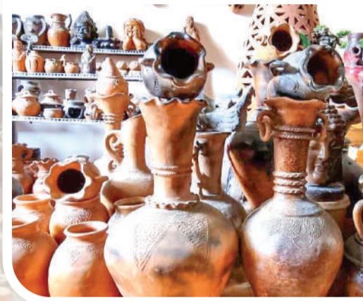
● Sản phẩm gốm Chăm.