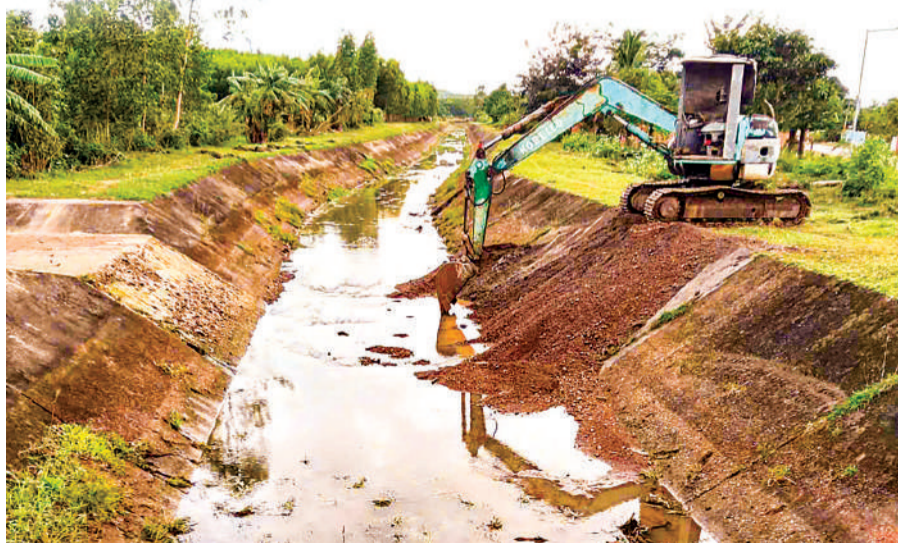
● Nạo vét kênh chính đông hồ chứa nước Đá Bàn.

bị đất cát lấp đầy. Các tuyến kênh chính tây, kênh N2T, kênh Bốn Tổng và Buy Ruột Ngựa không chỉ bị bồi lấp lòng kênh mà còn xuất hiện tình trạng sạt lở bờ nghiêm trọng. Đặc biệt, tại xi phông số 1 trên kênh chính đông, tình trạng xói lở và bồi