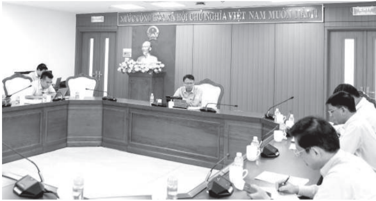
• Quang cảnh cuộc họp.

Theo báo cáo của Ban Quản lý Dự án Đầu tư xây dựng các công trình nông nghiệp và giao thông tỉnh, Dự án Cơ sở hạ tầng Khu trường học, đào tạo và dạy nghề Bắc Hòn Ông có tổng mức đầu tư hơn 562,8 tỷ đồng từ nguồn ngân sách nhà nước, được triển khai nhằm đầu tư hoàn thiện hạ tầng kỹ thuật phục vụ khu trường học, đào tạo và dạy nghề Bắc Hòn Ông. Đến nay, hạ tầng kỹ thuật giai đoạn 1 của dự án với quy mô khoảng 38,85ha đã cơ bản hoàn thành và đưa vào sử dụng nhiều hạng mục quan trọng. Đối với giai đoạn 2, quy mô mở rộng khoảng 14,86ha, đã hoàn thành nhiều hạng mục hạ tầng kỹ thuật. Các cơ quan liên quan đang triển khai các thủ tục về bồi thường, hỗ trợ, tái định cư đối với các trường hợp còn lại để tiếp tục hoàn thiện dự án. Theo đó, chủ đầu tư đã lập phương án bồi thường, hỗ trợ, tái định cư đối với 228 trường hợp còn lại và đang phối