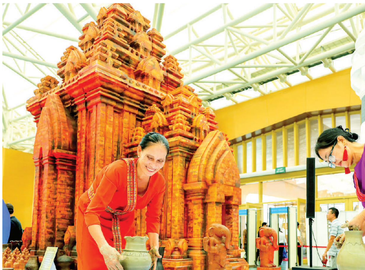
● Các nghệ nhân làng gốm Bàu Trúc trình diễn tại Triển lãm thành tựu đất nước nhân dịp kỷ niệm 80 năm Ngày Quốc khánh nước Cộng hòa xã hội chủ nghĩa Việt Nam vào năm 2025.