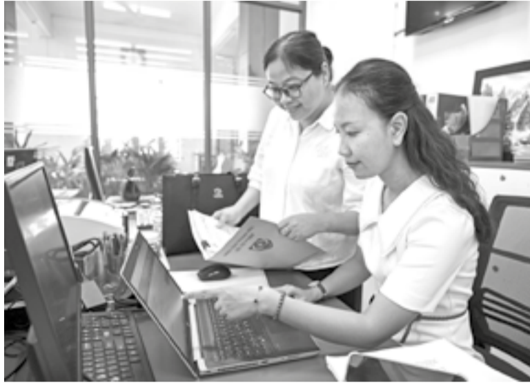
● Công chức Sở Tư pháp rà soát dữ liệu phiếu điều tra trên phần mềm.