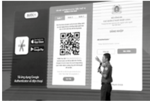
● Đại diện Phòng Quản lý xuất nhập cảnh hướng dẫn việc vận hành, khai thác sử dụng hệ thống phần mềm dùng chung của Bộ Công an.