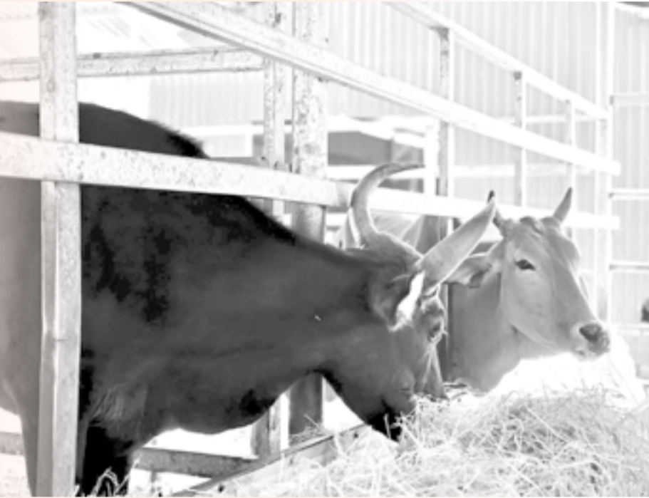
● Đàn bò tốt lai vẫn được chăm sóc, theo dõi sức khỏe hàng ngày tại khu nuôi bán hoang dã sau khi đề tài khoa học kết thúc.

Trong văn bản gửi UBND tỉnh, Ban Quản lý Vườn Quốc gia Núi Chúa - Phước Bình đề xuất tiếp tục duy trì chăm sóc quần thể bò tốt lai nhằm bảo tồn nghiêm ngặt nguồn gen quý hiếm, đồng thời phục vụ giáo dục đa dạng sinh học, nghiên cứu và tham quan học tập. Đơn vị cũng kiến nghị xây dựng nhiệm vụ khoa học mới kéo dài 36 tháng để tiếp tục duy trì và khai thác nguồn gen bò tốt lai. Ở góc độ chuyên môn,