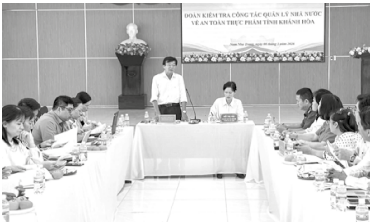
● Đoàn kiểm tra liên ngành về an toàn thực phẩm tỉnh kiểm tra công tác quản lý về an toàn thực phẩm tại phường Nam Nha Trang.

Song song đó, công tác tuyên truyền được triển khai rộng khắp với hình thức đa dạng. Từ đầu năm đến nay, các địa phương đã tổ chức hơn 230 lớp nói chuyện chuyên đề về ATTP cho hơn 2.100 người; thực hiện hơn 770 buổi phát thanh tuyên truyền; treo hàng trăm băng rôn, khẩu hiệu tại khu dân cư, chợ và cơ sở sản xuất, kinh doanh thực phẩm. Với tinh thần “không có vùng trống quản lý”, toàn tỉnh đã thành lập 72 đoàn kiểm tra liên ngành, tiến hành kiểm tra tại 2.914 cơ sở sản xuất, kinh doanh, chế biến thực phẩm. Qua kiểm tra, gần 98% cơ sở đạt yêu cầu ATTP; 32 cơ sở bị xử phạt với tổng số tiền hơn 408 triệu đồng. Các đoàn kiểm tra đã lấy gần 50 mẫu thực phẩm gửi xét nghiệm, kết quả có hơn 93% mẫu đạt yêu cầu; đồng thời thực hiện test nhanh hơn 930 mẫu thực phẩm, đều cho kết quả âm tính. Nhờ triển khai đồng bộ các giải pháp, đến