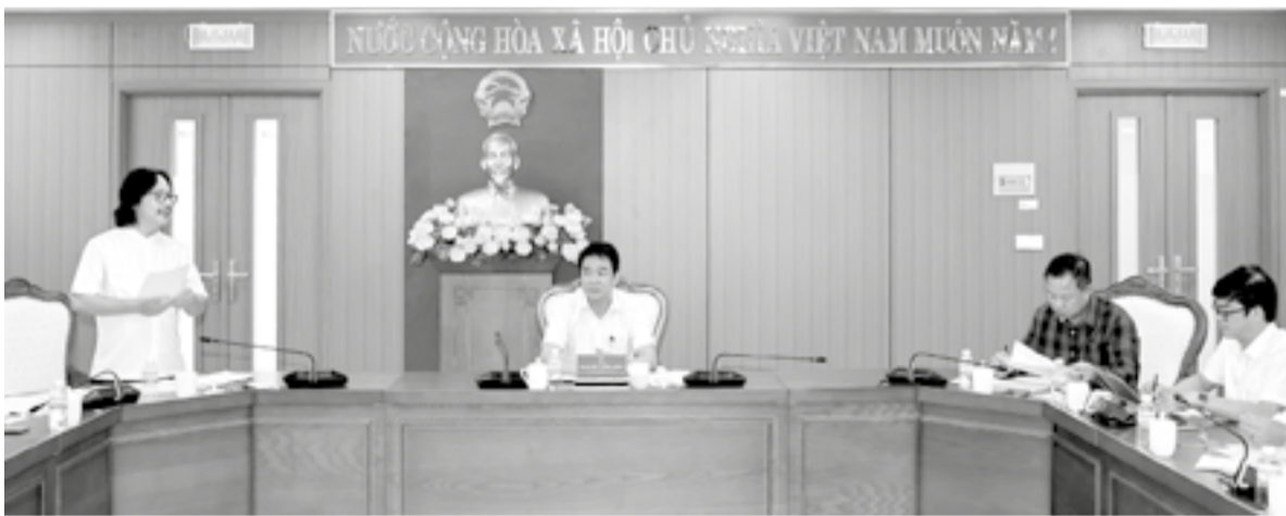
● Quang cảnh cuộc họp.