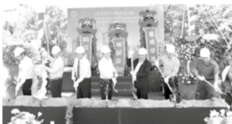
● Đại biểu thực hiện nghi lễ động thổ khởi công dự án.

Dự án Tổ hợp căn hộ du lịch, khu thương mại dịch vụ và căn hộ chung cư cao tầng An Viên là tổ hợp đa chức năng được triển khai trên khu đất đặc địa với tổng diện tích 5.600m 2 , bao gồm 28 tầng nổi với gần 800 căn hộ, 2 tầng hầm và 1 tầng kỹ thuật mái. Thời gian thi công dự kiến là 36 tháng kể từ ngày khởi công. Công trình được kỳ vọng tạo ra không gian sống hiện đại, tiện nghi, giàu giá trị trải nghiệm cho cư dân và du khách đến với đô thị biển Nha Trang.