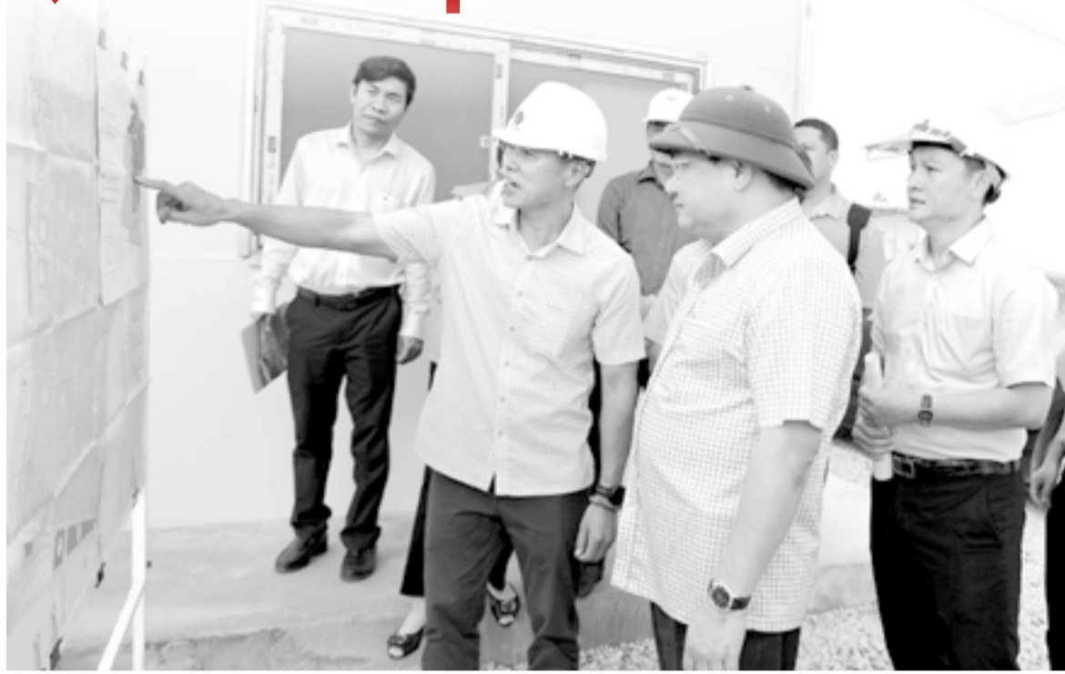
● Chủ đầu tư Dự án Khu công nghiệp Dốc Đá Trắng báo cáo tiến độ thực hiện dự án với đoàn công tác.

Trên công trường, chủ đầu tư đang tập trung san nền khu vực 1 với 60ha, khối lượng thi công đã đạt 80%, dự kiến hoàn thành trong quý III/2026. Việc đẩy nhanh tiến độ nhằm chuẩn bị cho kế hoạch thu hút đầu tư trong quý IV với diện tích khoảng 20ha, ưu tiên các nhà đầu tư đã ký bản ghi nhớ trong năm 2025 như: Công ty TNHH Frasers Property Development Services Việt Nam, Công ty TNHH Daisin Vina, Sufex Trading và Công ty Cổ phần Rong biển DT Khánh Hòa.