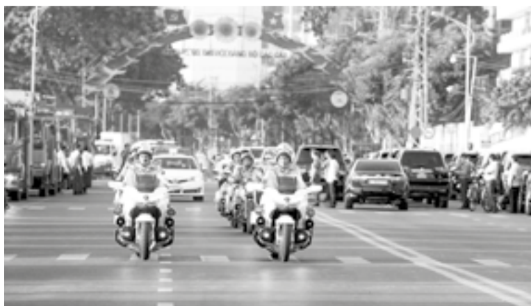
● Lực lượng Công an tỉnh ra quân thực hiện cao điểm tấn công, trấn áp tội phạm.