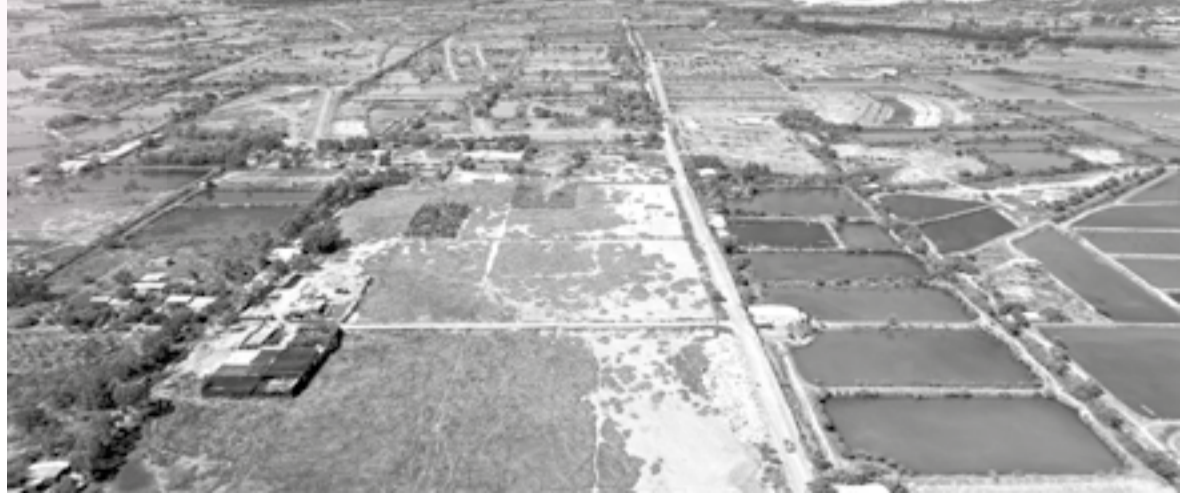
● Khu vực triển khai dự án.