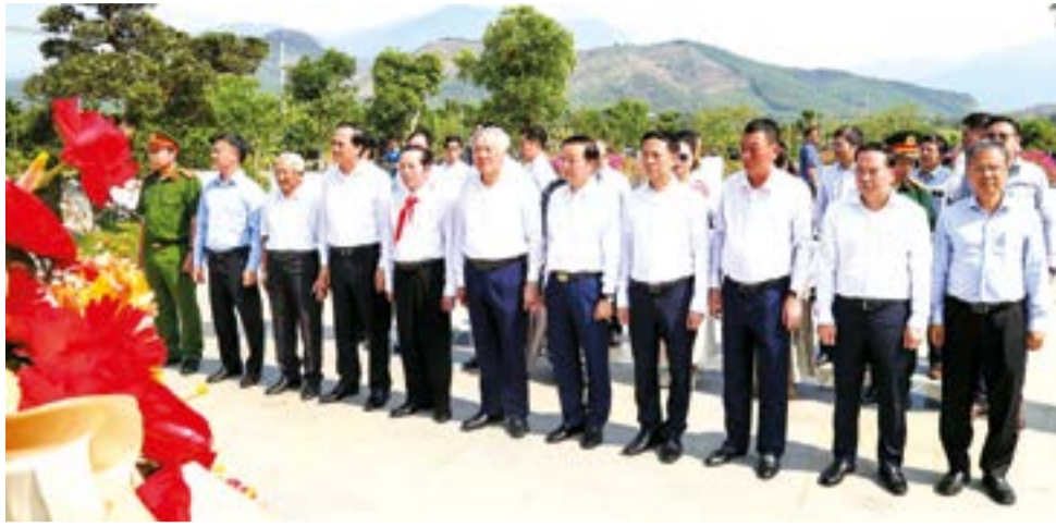
• Các đồng chí nguyên lãnh đạo Đảng, Nhà nước, lãnh đạo tỉnh Khánh Hòa và các đại biểu dâng hoa tại Đài tưởng niệm Tiểu đoàn 59, Khu lưu niệm Chiến thắng Vườn Gòn - Đá Bàn.