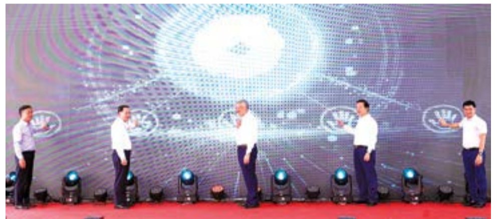
• Các đại biểu thực hiện nghi thức động thổ xây dựng cầu Đá Bàn.

Phát biểu tại buổi lễ, nguyên Phó Thủ tướng Chính phủ Trần Hồng Hà nhấn mạnh: Cầu Đá Bàn chính là chiếc cầu đưa các thế hệ hôm nay và mai sau đến gần hơn với Khu lưu niệm Chiến thắng Vườn Gòn - Đá Bàn - một "địa chỉ đỏ" giáo dục truyền thống yêu nước. Công trình là biểu tượng cho sự tri ân của thế hệ đi sau, tiếp