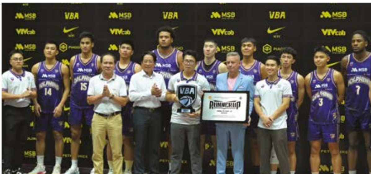
• Đội bóng Nha Trang Dolphins giành ngôi á quân mùa giải VBA 2025 tại Nha Trang.