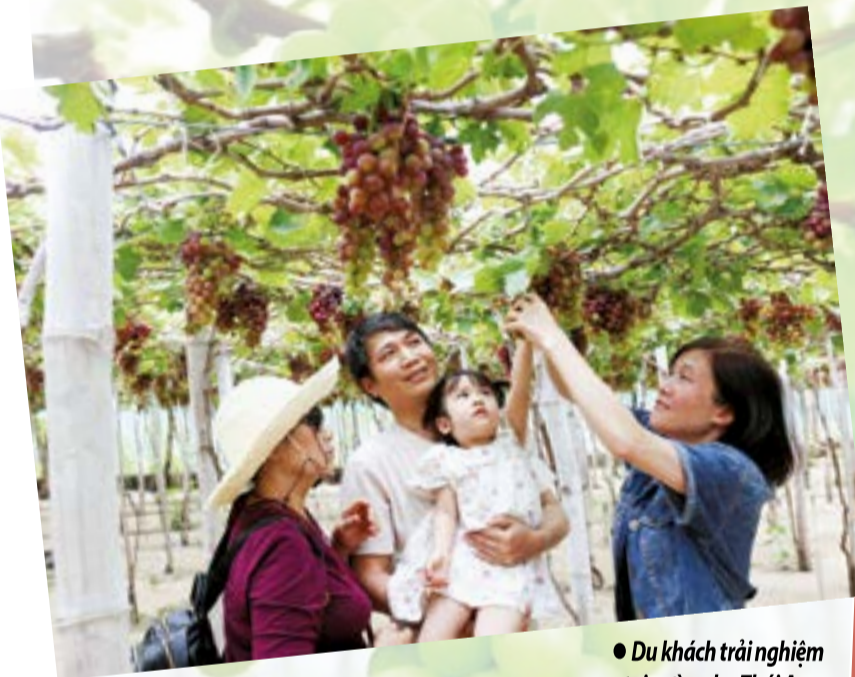
● Du khách trải nghiệm tại vườn nho Thái An.