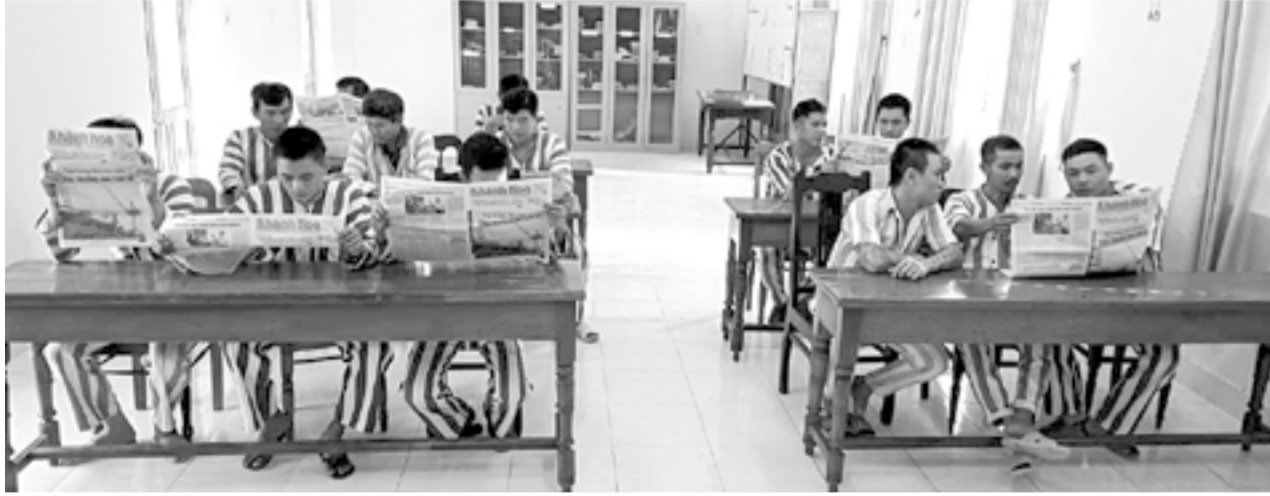
● Các phạm nhân tại Trại tạm giam số 2 tham gia đọc báo vào buổi sinh hoạt thứ Sáu hàng tuần.

Không chỉ là nơi giam giữ những người vi phạm pháp luật trong quá trình điều tra, truy tố, xét xử hay chấp hành án phạt tù, Trại tạm giam số 1 (phường Nam Nha Trang) và Trại tạm giam số 2 (xã Thuận Bắc), Công an tỉnh còn là môi trường giáo dục, cải tạo đặc biệt, nơi những mảnh đời lầm lỗi được khơi dậy niềm tin hướng thiện.