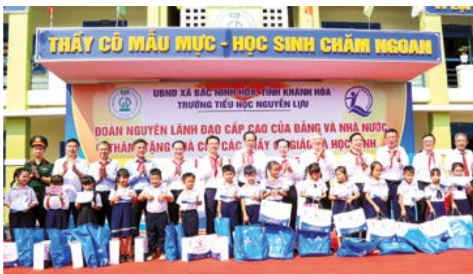
• Các đồng chí nguyên lãnh đạo Đảng và Nhà nước, lãnh đạo tỉnh, lãnh đạo các đơn vị trao quà cho học sinh Trường Tiểu học Nguyễn Lựu.