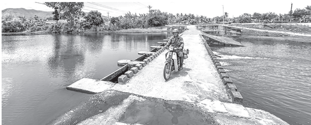
● Người dân qua sông Đá Bàn trên đập thủy lợi Hòa Huỳnh.

Tương tự, ông Đào Trung Hà, ở thôn 5 cho biết, không chỉ thiếu an toàn, việc người dân vận chuyển nông sản bằng cách đi qua đập có