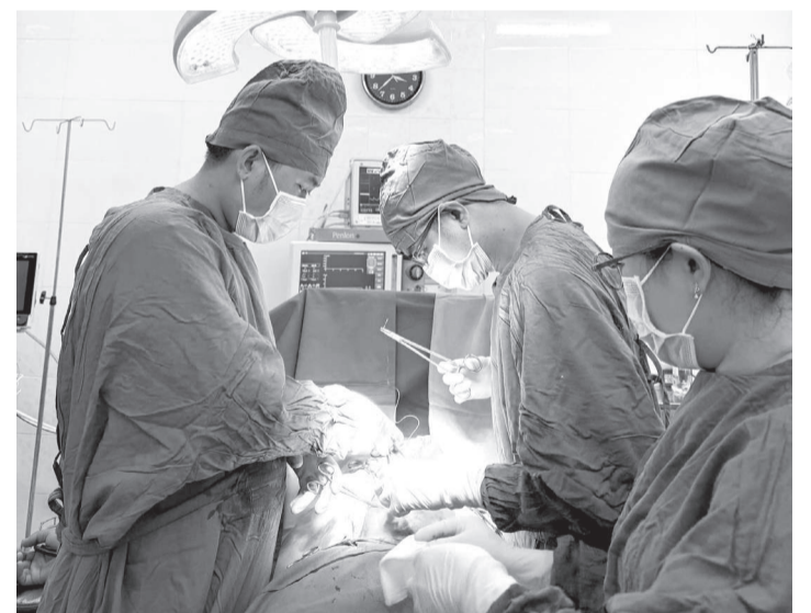
● Các bác sĩ Bệnh viện Đa khoa khu vực Ninh Hòa phẫu thuật lấy khối u cho bệnh nhân.