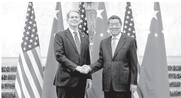
● Phó Thủ tướng Trung Quốc Hà Lập Phong và Bộ trưởng Tài chính Mỹ Scott Bessent.