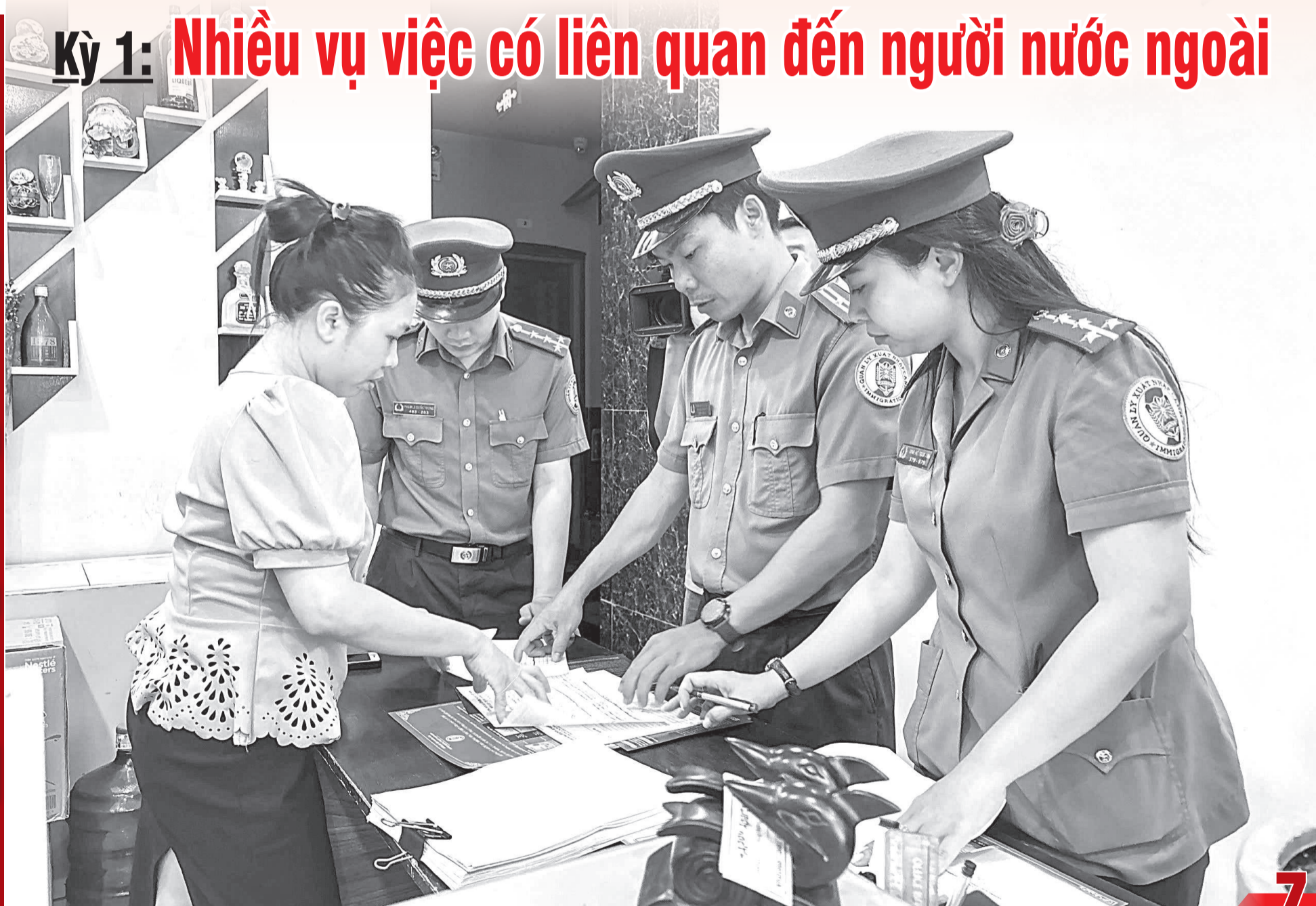
● Lực lượng chức năng kiểm tra việc chấp hành pháp luật tại một cơ sở cho người nước ngoài lưu trú khu vực Nha Trang.

Kỳ 1: Nhiều vụ việc có liên quan đến người nước ngoài