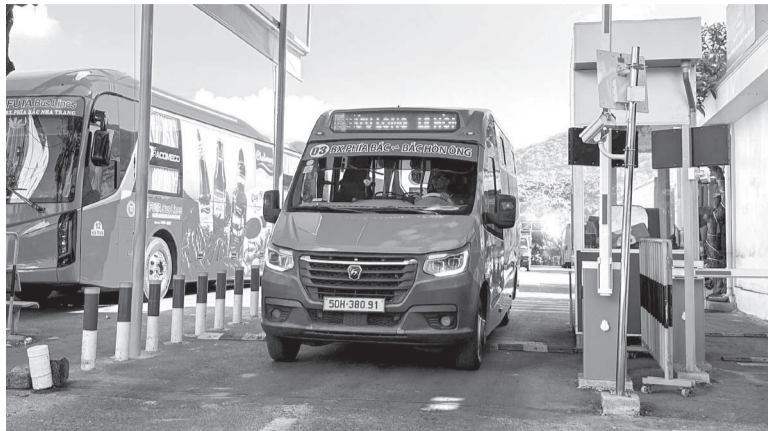
● Bến xe phía bắc Nha Trang áp dụng thu phí không dừng.

phía bắc Nha Trang đã triển khai áp dụng thu phí không dừng, còn lại đang trong giai đoạn nghiên cứu, chuẩn bị đầu tư.