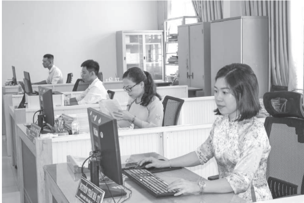
● Cán bộ, công chức xã Vạn Ninh tập trung xử lý công việc.

Công tác sắp xếp tổ chức bộ máy theo các chủ trương mới của Trung ương được triển khai quyết liệt, đồng bộ. Tỉnh đã chỉ đạo xây dựng và thông qua 112 đề án đổi mới, nâng cao chất lượng, hiệu quả hoạt động của các cấp ủy, cơ quan, đơn vị giai đoạn 2026 - 2030. Đồng thời, rà soát, hoàn thiện chức năng, nhiệm vụ, quyền hạn và mối quan hệ công tác theo hướng rõ người, rõ việc, rõ trách nhiệm, rõ thẩm quyền. Tỉnh triển khai đánh giá, xếp loại cán bộ, công chức, viên chức bằng Bộ công cụ đo lường hiệu quả công việc (KPI); tăng cường điều động, luân chuyển giữa khối Đảng và khối chính quyền,