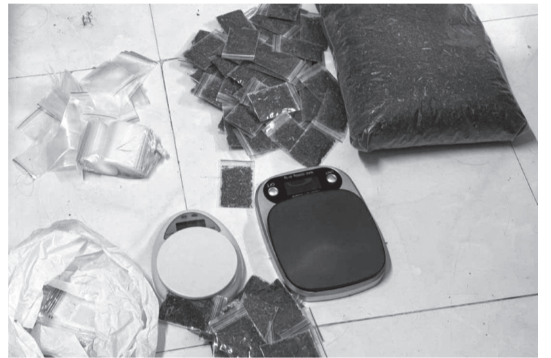
● Tang vật vụ án bị thu giữ.

Thực hiện đợt cao điểm tấn công, trấn áp các loại tội phạm, Bộ đội Biên phòng tỉnh vừa phối hợp triệt phá thành công chuyên án KH526 bắt giữ 4 đối tượng trong đường dây mua bán, tàng trữ trái phép chất ma túy trên địa bàn.