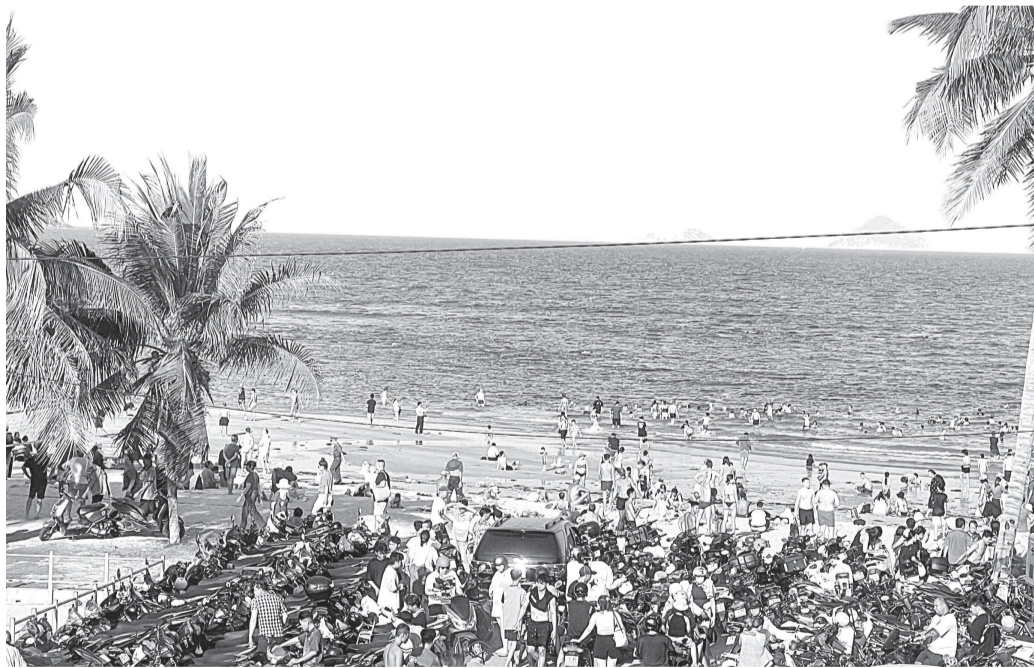
● Rất đông người dân và du khách nước ngoài tắm biển Nha Trang.

công an thu giữ 1 ba lô chứa 153 gói ma túy các loại: Ma túy đá, ma túy khay, nấm ảo giác, tem giấy LSD và cần sa. Đối tượng R.A. khai phương thức buôn bán chất cấm thông qua ứng dụng mạng xã hội Telegram, chủ yếu cung cấp cho những người nước ngoài khác đang du lịch và lưu trú tại Khánh Hòa, hình thành một đường dây khép kín, hoạt động tinh vi.