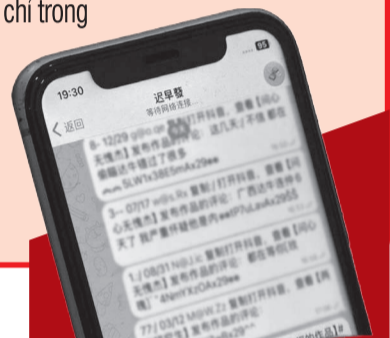
● Các đối tượng tổ chức đánh bạc sử dụng mạng xã hội TikTok để tương tác.

Chỉ trong 5 tháng đầu năm 2026, Công an tỉnh đã phối hợp với các đơn vị liên quan tiến hành trục xuất 116 trường hợp người nước ngoài, chủ yếu là công dân Nga, Trung Quốc, Kazakhstan... vì vi phạm quy định xuất nhập cảnh, khai báo sai sự thật hoặc sử dụng chất ma túy. Một ví dụ điển hình là tháng 8-2025, 38 người nước ngoài vi phạm đã bị Công an tỉnh tiến hành trục xuất chỉ trong 1 đợt. Bên cạnh đó, lực lượng chức năng còn xử phạt hành chính 289 trường hợp vi phạm các quy định pháp luật Việt Nam với số tiền lên đến hơn 3 tỷ đồng.