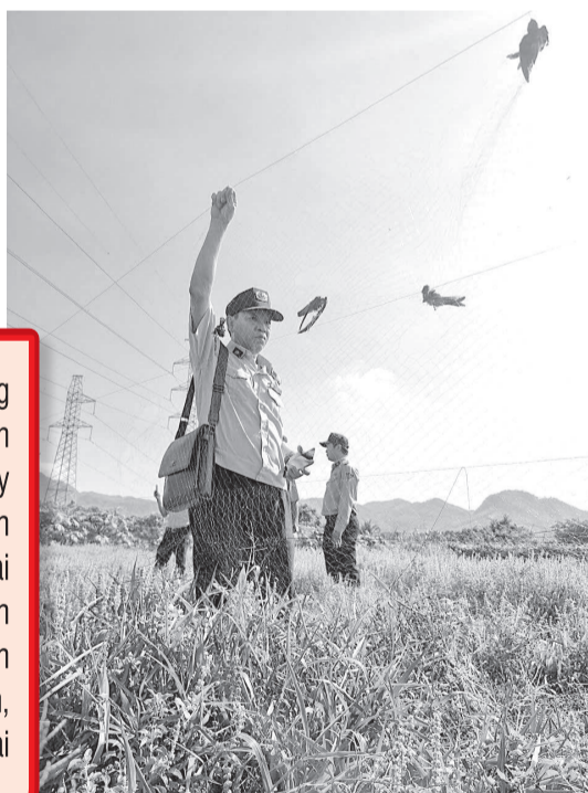
● Một vụ săn bắt chim yến bị phát hiện.