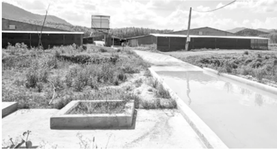
• Trại chăn nuôi vịt bị người dân phản ánh không bảo đảm yếu tố môi trường.

Thời gian qua, một số người dân ở 2 thôn Hòn Lay và Cà Thiêu, xã Trung Khánh Vĩnh phản ánh lên chính quyền địa phương và cơ quan ngôn luận về việc một trại chăn nuôi vịt ở địa phương gây mùi hôi thối, ảnh hưởng đến đời sống. Phóng viên Báo và Phát thanh, Truyền hình Khánh Hòa đã đến tìm hiểu vụ việc.