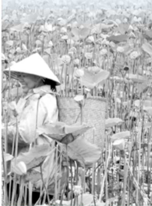
lấy ngó sen.