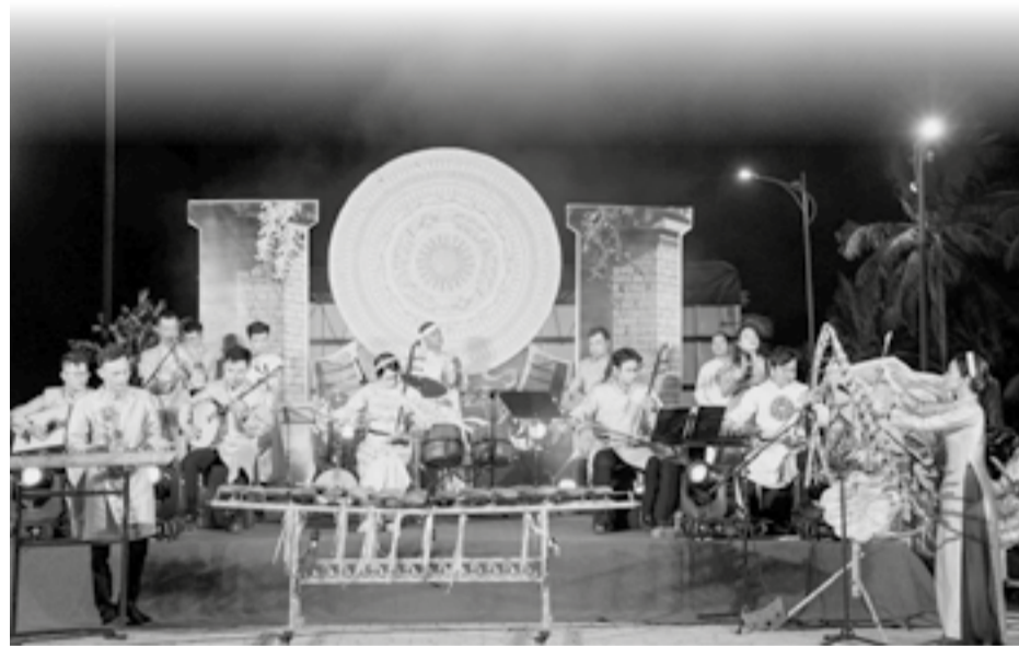
● Tiết mục hòa tấu nhạc cụ dân tộc “Pô Nagar huyền thoại”.

Thất bại 1-4 trước U17 Hàn Quốc chỉ trong 10 phút cuối trận thực sự là cú ngã đau của các cầu thủ trẻ U17 Việt Nam tại bảng C vòng chung kết U17 châu Á. Tuy vậy, U17 Việt Nam vẫn đang nắm trong tay chiếc “chìa khóa” mở cánh cửa lịch sử - tấm vé dự FIFA U17 World Cup 2026 và tất cả sẽ được định đoạt trong trận đấu quyết định trước U17 UAE diễn ra rạng sáng 14-5 theo giờ Việt Nam.