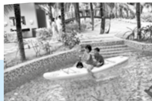
● Du khách nhí vui chơi tại hồ bơi trong khuôn viên Arena Resort Cam Ranh, một trong những điểm lưu trú thu hút nhiều gia đình trong mùa du lịch hè tại Bãi Dài.