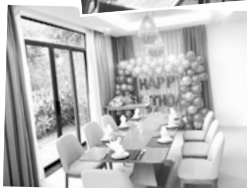
● Không gian villa tại Wyndham Garden Cam Ranh được nhiều gia đình lựa chọn để tổ chức tiệc sinh nhật, sum họp trong kỳ nghỉ.