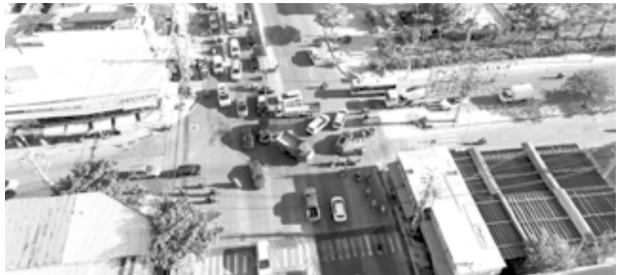
• Ùn ứ tại khu vực nút giao đường Nguyễn Tất Thành - Phước Long - Võ Văn Kiệt trong giờ cao điểm.

Bạn đọc phản ánh, nút giao đường Nguyễn Tất Thành - Phước Long - Võ Văn Kiệt nằm ở phía đông cầu Bình Tân thường xuyên kẹt xe, nhất là vào giờ cao điểm. Nguyên nhân là do nút giao này có lưu lượng phương tiện giao thông dày đặc, nhiều xe tải, xe khách lớn lưu thông. Chỉ cần một xe lớn chuyển hướng tại nút giao là các phương tiện khác phải dừng lại, gây ùn ứ.