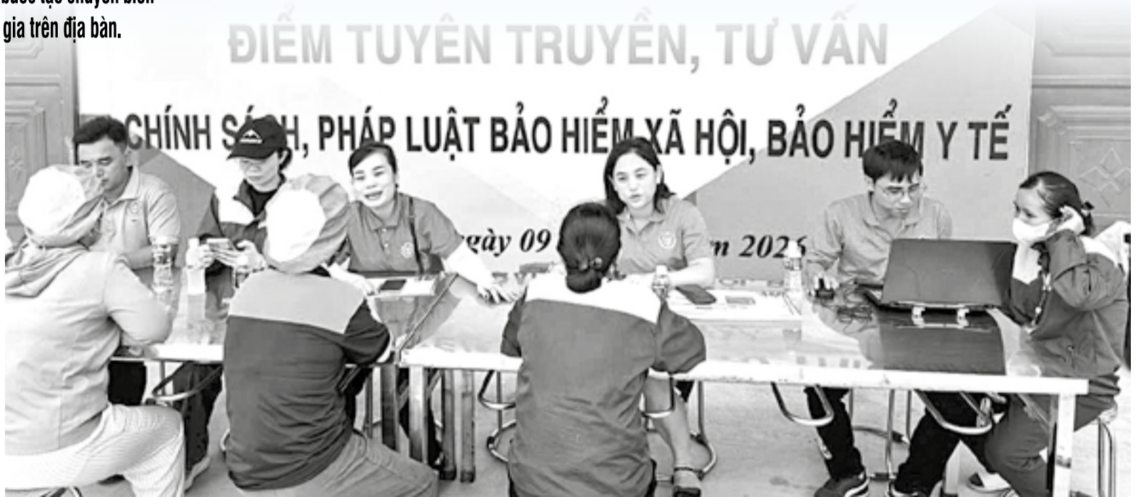
• Bảo hiểm xã hội cơ sở Ninh Chủ tổ chức gian hàng tuyên truyền, tư vấn trực tiếp về chính sách bảo hiểm xã hội, bảo hiểm y tế cho người dân.