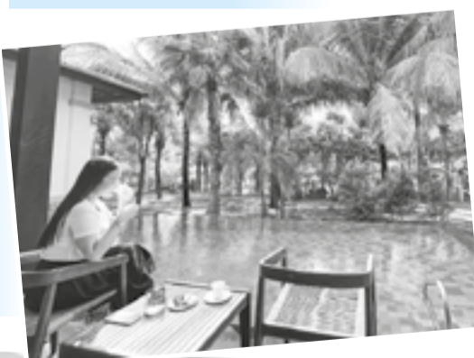
● Du khách thường trà chiều bên hồ bơi riêng tại Duyên Hà Resort Cam Ranh.