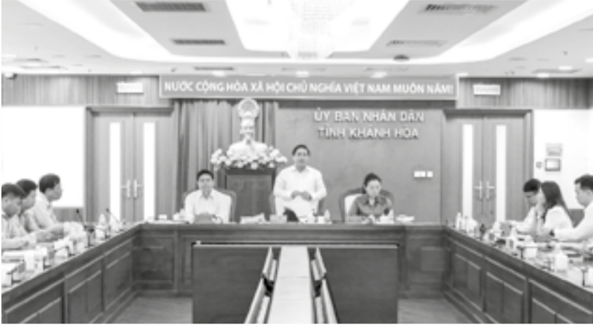
● Quang cảnh tại Phiên họp Thường trực HĐND tỉnh tháng 5.