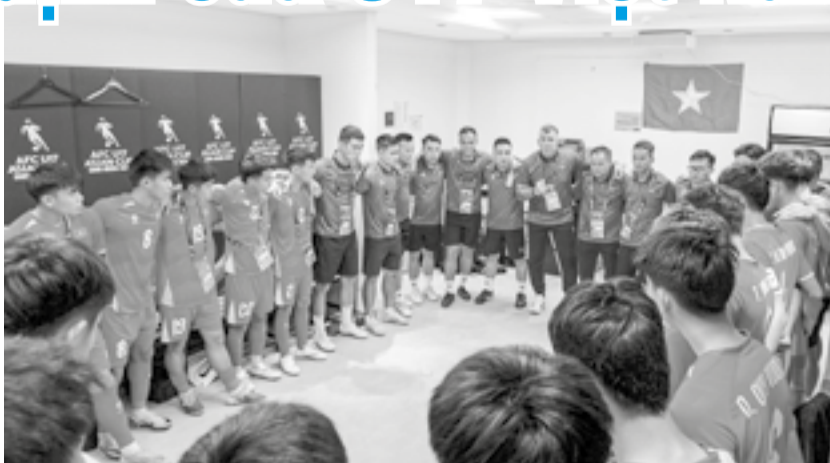
● U17 Việt Nam quyết tâm cao trước trận đấu với U17 UAE.

Sau 2 lượt trận vòng chung kết U17 châu Á, bảng C định hình với vị trí tạm dẫn đầu thuộc về U17 Hàn Quốc (4 điểm). U17 Việt Nam và U17 Yemen cùng 3 điểm, tuy nhiên U17 Việt Nam tạm xếp trên do hơn về hiệu số đối đầu. U17 UAE đang đứng cuối khi chỉ có 1 điểm. Ở lượt trận cuối, U17