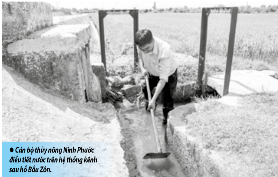
● Cán bộ thủy nông Ninh Phước điều tiết nước trên hệ thống kênh sau hồ Bầu Zôn.

Ngay từ đầu năm, khi nguy cơ El Nino được dự báo quay trở lại, UBND tỉnh cùng các sở, ngành chức năng đã liên tục ban hành văn bản