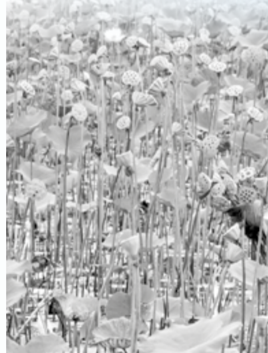
● Thư họa

Nhớ những mùa hè cũ ở Nha Trang, vào mùa sen, tôi thường chạy xe máy đến các ruộng sen, hồ sen và chụp hình. Với tôi, nhìn hoa sen nở hồng hay trắng trông thật đẹp. Có lần, tôi và chị bạn chạy xe máy ra Ninh Hòa. Hôm ấy mát trời, chúng tôi lang thang khắp nẻo đường quê. Đến một ruộng sen trắng đang mùa rộ hoa, mỗi người tìm góc riêng say sưa bấm máy. Mùa sen quê tôi thanh bình, dịu dàng. Cũng có một lần ngồi trên xe lửa về Nha Trang, khi còn cách phố biển khoảng hai chục cây số, tôi nhìn thấy một hồ sen đang mùa rộ hoa, đẹp ngắt ngây! Sau này ở TP. Hồ Chí Minh, tôi đã vài lần đi xe buýt đến những cánh đồng sen chụp hình, hay chỉ ngồi trên một tấm ván, nhìn sen và nghĩ ngợi mông lung.