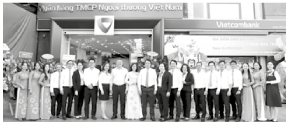
• Lãnh đạo Vietcombank Khánh Hòa chụp ảnh cùng tập thể cán bộ, nhân viên Phòng giao dịch Nam Nha Trang tại điểm giao dịch mới.

Được biết, Vietcombank Khánh Hòa hiện có mạng lưới hoạt động gồm trụ sở chi nhánh và 8 PGD, phân bố tại các khu vực kinh tế - xã hội trọng điểm của tỉnh. Với phương châm lấy khách hàng