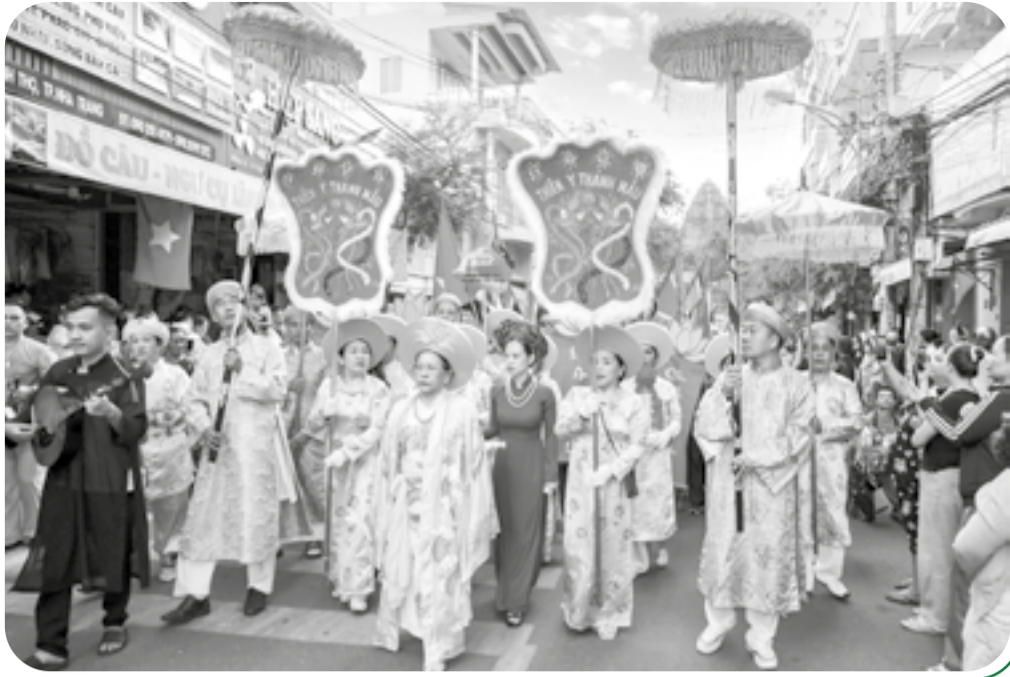
● Người dân tham gia diễu hành trong Lễ hội Tháp Bà Pô Nagar.