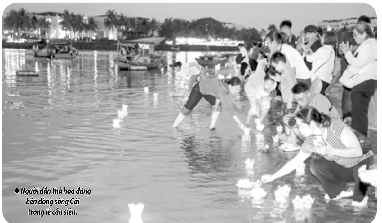
● Người dân thả hoa đăng bên dòng sông Cái trong lễ cầu siêu.