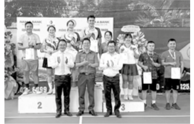
● Ban tổ chức trao giải cho các vận động viên đạt giải nội dung đôi nam nữ.

Ngày 11-5, Phòng An ninh kinh tế Công an tỉnh tổ chức Giải pickleball chào mừng 73 năm Ngày truyền thống Lực lượng An ninh kinh tế (13-5-1953 - 13-5-2026).