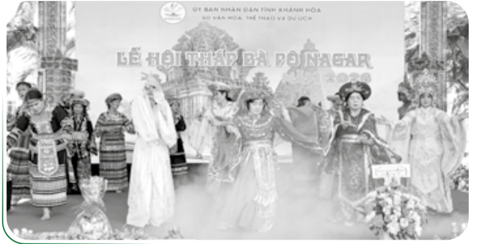
● Tiết mục múa bóng của một đoàn thực hành tín ngưỡng thờ Mẫu.