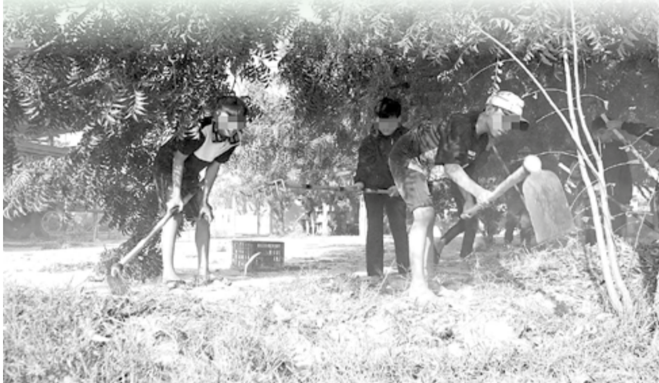
● Thanh thiếu niên vi phạm tích cực tham gia các hoạt động tại cộng đồng.

Với những tác động tiêu cực từ mạng xã hội, môi trường sống và biến động tâm lý tuổi mới lớn, nhiều thanh thiếu niên dễ sa ngã. Từ thực tế đó, Công an xã Phước Dinh đã triển khai nhiều giải pháp với phương châm “Mềm mỏng trong phương pháp, kiên quyết trong mục tiêu” nhằm giáo dục, điều chỉnh hành vi cho thanh thiếu niên, nhất là những trường hợp từng vi phạm pháp luật.