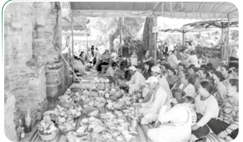
● Đồng bào Chăm thực hiện lễ cúng dâng Mẹ xứ sở.