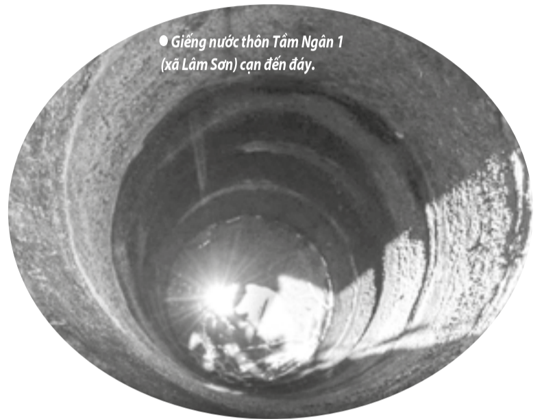
● Giếng nước thôn Tâm Ngân 1 (xã Lâm Sơn) cạn đến đáy.

Thời tiết nắng hạn, những cơn mưa tự nhiên cho người dân vùng cao giờ chỉ còn trông đá cuội. Tại một số địa phương, suối khô, giếng cạn, nhiều hộ dân phải phụ thuộc vào những giếng nước đào chung cũng đang thiếu nước. Ông Nguyễn Hoàng Tiến - Phó Chủ tịch UBND xã Lâm Sơn cho biết, hiện nay, còn hơn 300