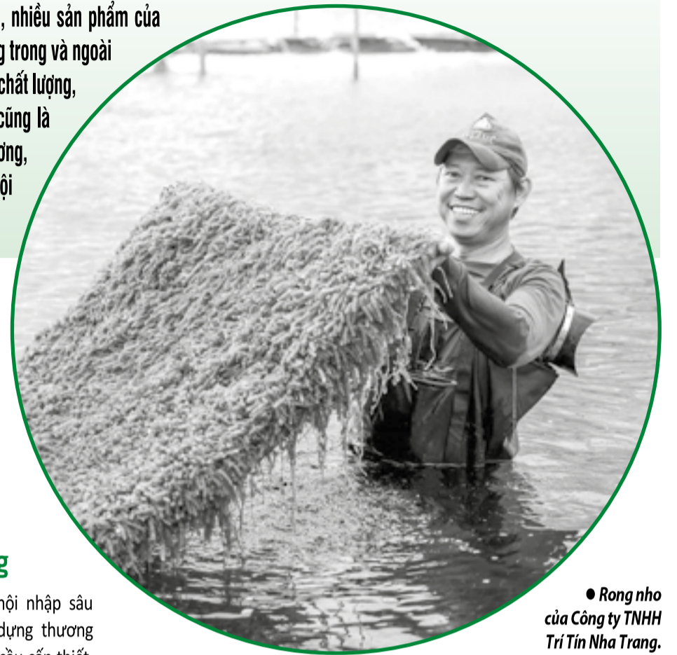
● Rong nho của Công ty TNHH Trí Tín Nha Trang.

Trong bối cảnh hội nhập sâu rộng, việc xây dựng thương hiệu đã trở thành yêu cầu cấp thiết. Để thúc đẩy phát triển thương hiệu, UBND tỉnh đã ban hành Văn bản số 5591, ngày 23-4-2026 về triển khai Chương trình Thương hiệu quốc gia Việt Nam năm 2026 trên địa bàn tỉnh. Theo đó, UBND tỉnh yêu cầu các sở, ngành, địa phương tăng cường hỗ trợ DN xây dựng thương hiệu, xúc tiến thương mại, quảng bá sản phẩm chủ lực và tiếp cận các tiêu chuẩn xanh, bền vững. Theo định hướng này, việc phát triển thương hiệu không chỉ tập trung ở DN lớn, mà còn hướng đến DN nhỏ và vừa,