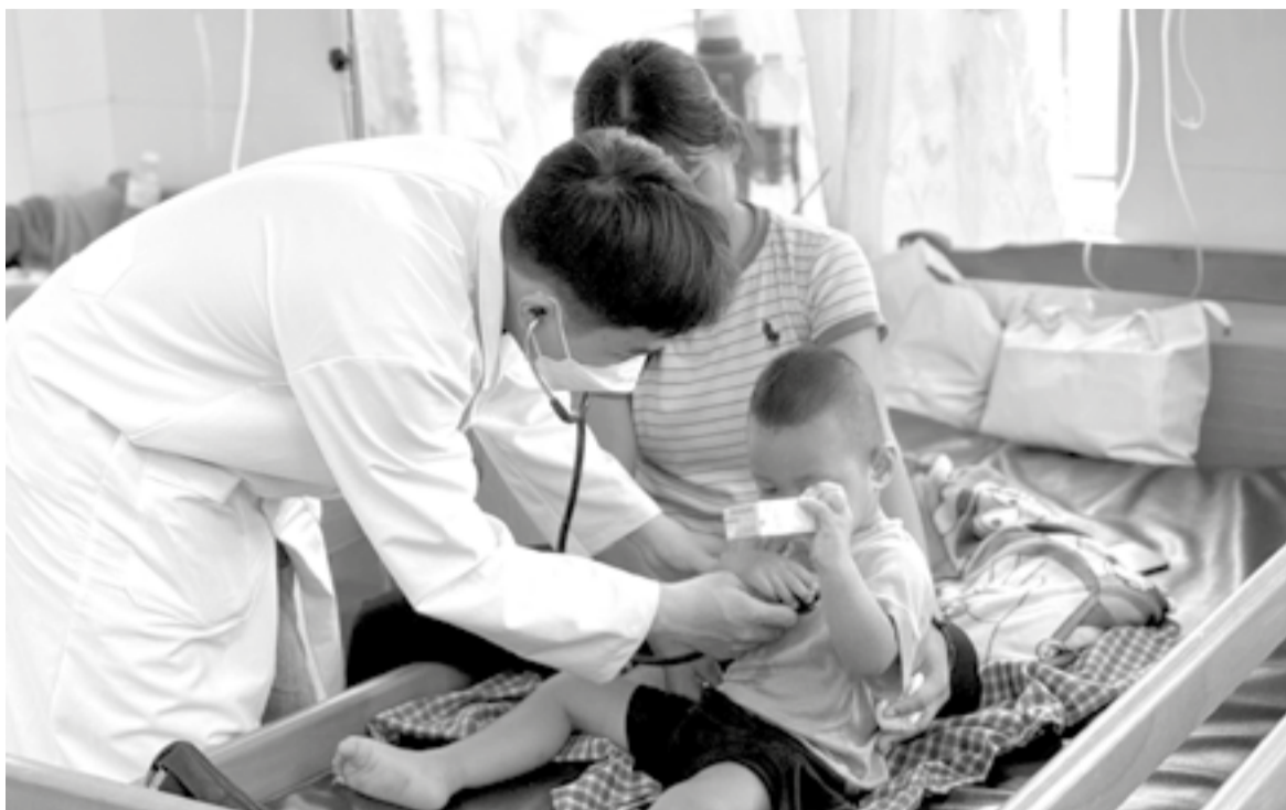
● Bác sĩ Bệnh viện Bệnh nhiệt đới Khánh Hòa kiểm tra sức khỏe cho trẻ mắc bệnh tay chân miệng.