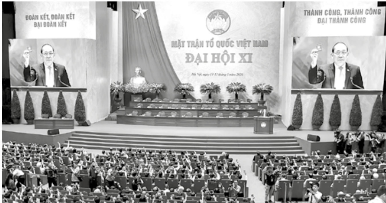
● Quang cảnh phiên trù bị Đại hội đại biểu toàn quốc Mặt trận Tổ quốc Việt Nam lần thứ XI.

Chiều 11-5, 1.136 đại biểu chính thức, đại diện cho các giai tầng, dân tộc, tôn giáo, lực lượng vũ trang, kiều bào ta ở nước ngoài, cán bộ Mặt trận các cấp... đã về Trung tâm hội nghị quốc gia (TP. Hà Nội) dự phiên trù bị Đại hội đại biểu toàn quốc MTTQ Việt Nam lần thứ XI, nhiệm kỳ 2026 - 2031. Dự đại hội có đồng chí Bùi Thị Minh Hoài - Ủy viên Bộ Chính trị, Bí thư Trung ương Đảng, Bí thư Đảng ủy MTTQ, các đoàn thể Trung ương, Chủ tịch Ủy ban Trung ương MTTQ Việt Nam khóa X; các đồng chí Phó Chủ tịch không chuyên trách Ủy ban Trung ương MTTQ Việt Nam: Hà Thị Khiết - nguyên Bí thư Trung ương Đảng, nguyên Trưởng Ban Dân vận Trung ương; Nguyễn Thị Doan - nguyên Phó Chủ tịch nước. Tham dự có các đồng chí Ủy viên Trung ương Đảng, nguyên Ủy viên Trung ương Đảng, Ủy viên dự khuyết Trung ương Đảng; đại diện các ban, bộ, ngành, đoàn thể, đơn vị; các Phó Chủ tịch, nguyên Phó Chủ tịch, Ủy viên, nguyên Ủy viên Đoàn Chủ tịch Ủy ban