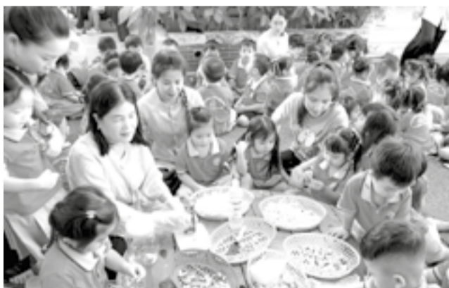
● Các bé Trường Mầm non Vạn Lương (xã Vạn Ninh) tham gia hoạt động.

Theo đó, thời gian tổ chức hoạt động hè từ ngày 3-6 đến hết ngày 30-7 (căn cứ điều kiện thực tế, cơ sở giáo dục mầm non thống nhất thời gian cụ thể với cha mẹ trẻ). Các cơ sở giáo dục mầm non chỉ tổ chức nhận trẻ trong hè khi bảo đảm các điều kiện an toàn trường học, cơ sở vật chất, đội ngũ. Đối với các cơ sở giáo dục mầm non đang xây dựng, cải tạo, sửa chữa trường, lớp, cần có giải pháp bảo đảm an toàn và không ảnh hưởng đến sinh hoạt của trẻ. Các cơ sở giáo dục mầm non cần phân công, bố trí ít nhất 2 giáo viên/lớp để thực hiện kế hoạch hoạt động trong ngày theo nội dung nuôi dưỡng, chăm sóc và giáo dục trẻ trong hè; tuyệt đối không nhận trẻ khi trường, lớp chưa bảo đảm các điều kiện an toàn. Trong trường