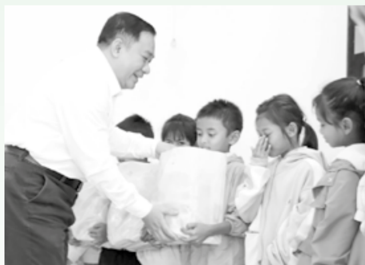
● Lãnh đạo Sở Y tế trao quà cho trẻ em có hoàn cảnh khó khăn xã Trung Khánh Vinh.

UBND tỉnh giao Sở Y tế là cơ quan chủ trì triển khai kế hoạch; phối hợp với Tỉnh đoàn tổ chức lễ phát động Tháng hành động vì trẻ em năm 2026 lồng ghép với lễ phát động hoạt động hè dành cho thiếu nhi. Đồng thời, ngành y tế tổ chức tập huấn kỹ năng bảo vệ trẻ em, chăm sóc sức khỏe tâm thần; huy động nguồn lực hỗ trợ trẻ em nghèo, trẻ em mắc bệnh nặng; tổ chức thăm, tặng quà cho trẻ em tại bệnh viện, cơ sở trợ giúp xã hội và cộng đồng. Sở Giáo dục và Đào tạo triển khai các hoạt động xây dựng môi trường học tập an toàn trên không gian mạng; tăng cường dạy bơi, kỹ năng phòng, chống tai nạn