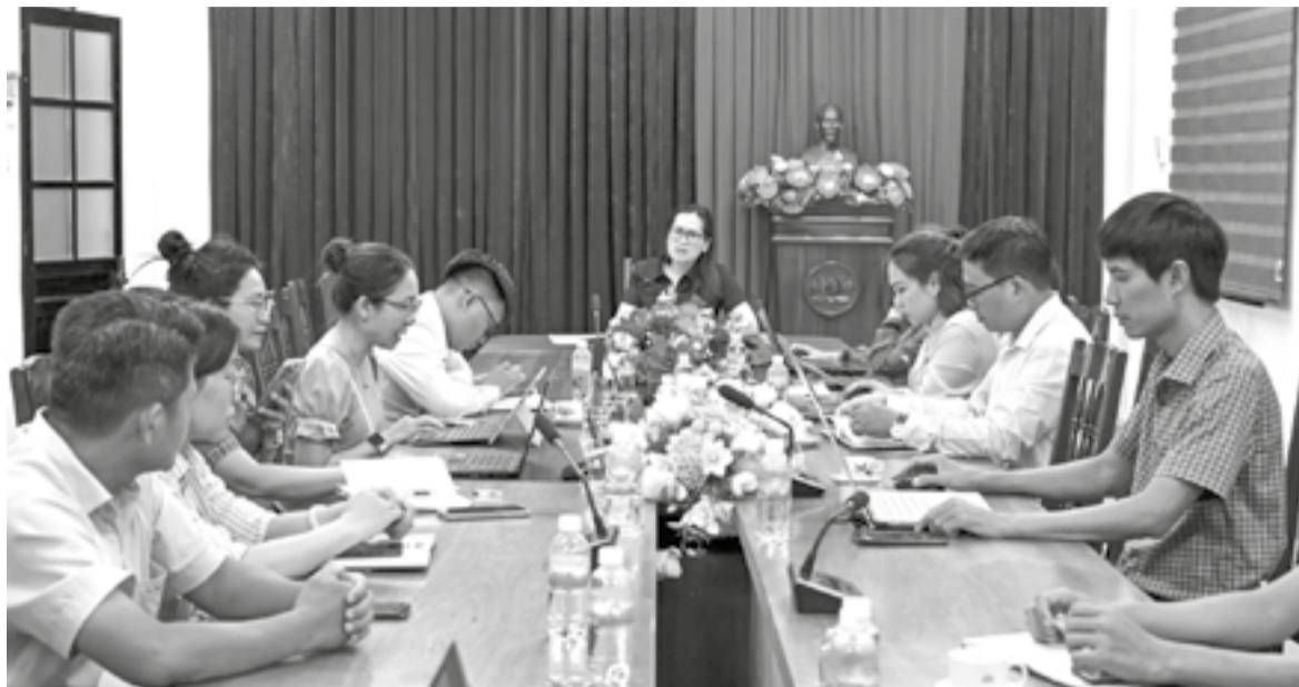
● Quang cảnh cuộc họp Tổ Thường trực Ban Chỉ đạo điều tra cơ sở hành chính, sự nghiệp tỉnh ngày 8-5.

Những ngày này, các thành viên Tổ Thường trực Ban Chỉ đạo điều tra cơ sở hành chính, sự nghiệp cấp tỉnh, cấp xã và các giám sát viên thường xuyên theo sát các nhóm Zalo để nắm bắt tiến độ thực hiện, kịp thời phản hồi, tháo gỡ vướng mắc, đôn đốc xử lý các phiếu bị trả lại... Theo thông tin từ Tổ Thường trực Ban Chỉ đạo điều tra cơ sở hành chính, sự nghiệp tỉnh, tuần qua, công tác thu thập thông tin, phê duyệt phiếu tiếp tục chuyển biến tích cực, tiến độ phê duyệt phiếu tăng nhanh. Tính đến ngày 6-5, số lượng phiếu đã hoàn thành kê khai, phê duyệt của các cơ quan, đơn vị, địa phương tăng 66 phiếu, tương đương tăng 4,69% so với ngày 29-4, đạt 91,39%. Số phiếu đang lưu giảm mạnh từ 106 phiếu