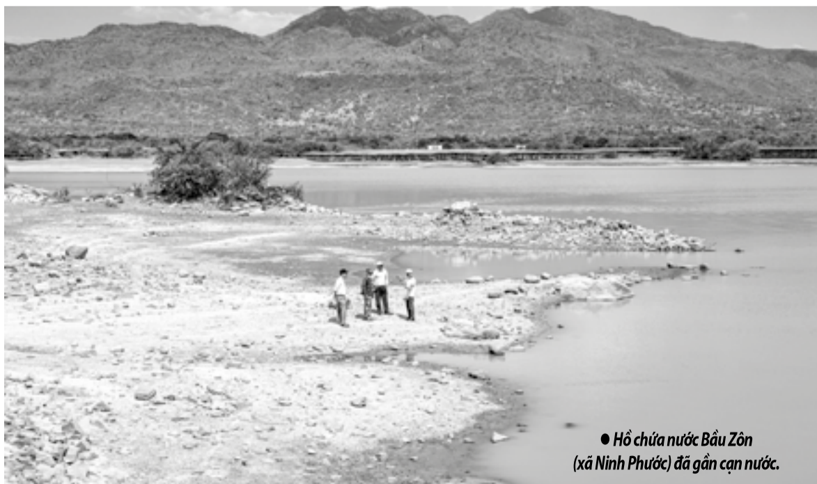
● Hồ chứa nước Bầu Zôn (xã Ninh Phước) đã gần cạn nước.

Tại khu vực phía nam tỉnh, thời điểm này, hơn 40.906ha rừng và đất lâm nghiệp trong lâm phận của Ban Quản lý Rừng phòng hộ Tân Giang - Thuận Nam trên 47 tiểu khu thuộc địa bàn 6 xã: Phước Dinh, Thuận Nam, Cà Ná, Phước Hà, Phước Hữu, Phước Hậu nằm trong vùng khô hạn nhất cả nước đều có cấp dự báo cháy rừng cấp V. Qua rà soát của đơn vị, các điểm có nguy cơ cháy cao tập trung tại các tiểu khu: 202b, 199, 188, 187 (xã Phước Hà); 179, 177, 174 (xã Phước Hữu)... Đây là những khu vực gần khu dân cư, có lớp thực bì dưới tán rừng dày, dễ bắt lửa. Ban Quản lý Rừng phòng hộ Tân Giang - Thuận Nam đã chủ động triển khai công tác phòng cháy, chữa cháy rừng từ sớm, từ xa theo phương châm “4 tại chỗ”.