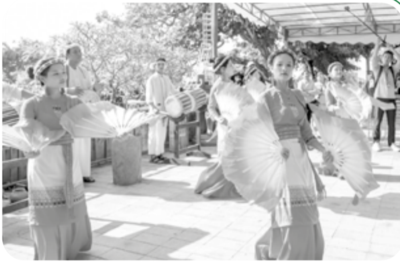
● Thiếu nữ Chăm biểu diễn vũ điệu truyền thống trong lễ rước nước.