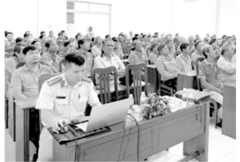
● Hơn 200 tài xế xích lô tham gia buổi tuyên truyền.

Sáng 9-5, Đội Cảnh sát giao thông đường bộ (Phòng Cảnh sát giao thông, Công an tỉnh) phối hợp với Công đoàn phường Nha Trang tổ chức tuyên truyền pháp luật về trật tự an toàn giao thông (ATGT) cho hơn 200 tài xế xích lô thuộc Nghiệp đoàn xích lô du lịch Nha Trang.