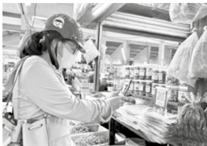
● Người dân quét mã QR thanh toán khi mua hàng tại chợ truyền thống.

UBND tỉnh vừa ban hành Công văn số 5898 về việc tăng cường phối hợp thúc đẩy thanh toán không dùng tiền mặt nhằm nâng cao hiệu quả quản lý thuế năm 2026.