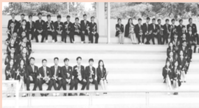
● Học sinh Trường THPT Nguyễn Văn Trỗi (phường Nha Trang) xếp hình tên lớp 12C7.