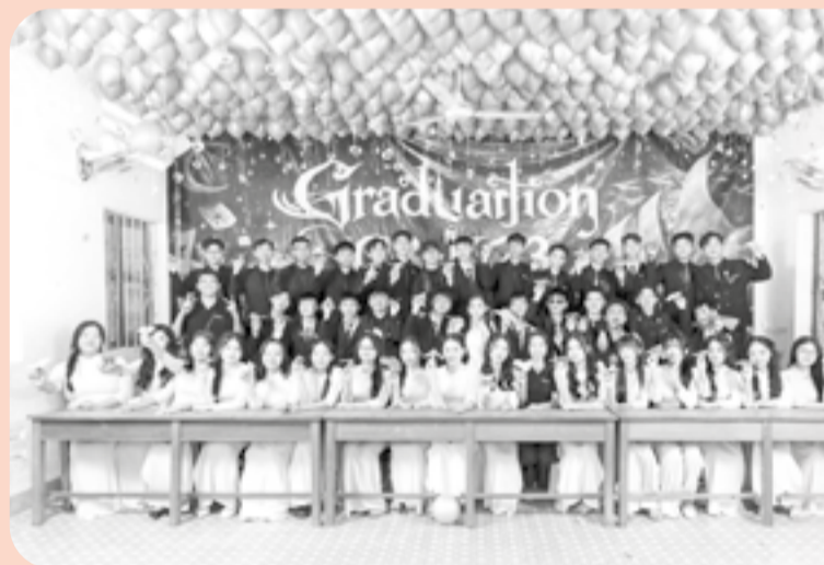
● Học sinh lớp 12 Trường THPT Ngô Gia Tự (phường Bắc Cam Ranh) chụp ảnh kỷ yếu.

chụp kỷ yếu từ lâu, bởi đây là dịp cả lớp được ở bên nhau đông đủ nhất trước khi thi tốt nghiệp. Sau này, mỗi người sẽ có con đường riêng nên ai cũng muốn lưu giữ thật nhiều kỷ niệm”.