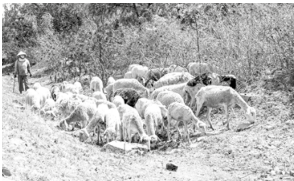
● Đàn cừu tìm kiếm thức ăn giữa khí hậu khô nóng, thực bì cháy sém tại xã Ninh Phước.