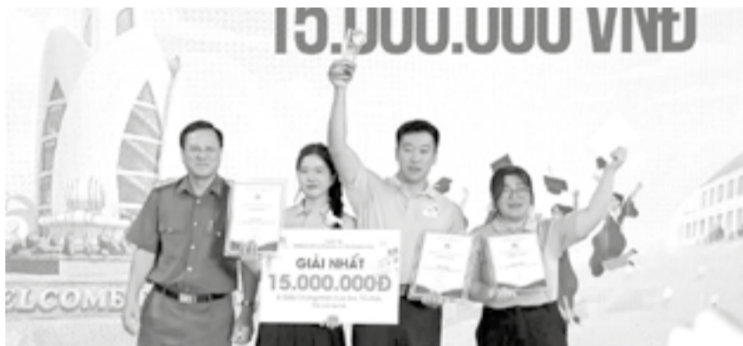
● Ban Tổ chức trao giải nhất cho đội Trường Đại học Nha Trang.

Ngày 9-5, tại Trường Đại học (ĐH) Nha Trang, Công an tỉnh phối hợp với nhà trường tổ chức cuộc thi Trường học không ma túy tỉnh Khánh Hòa năm 2026. Cuộc thi có 9 đội đại diện cho 9 trường ĐH, cao đẳng trên địa bàn tỉnh tham gia, gồm: Trường ĐH Nha Trang; Trường ĐH Khánh Hòa; Trường ĐH Thái Bình Dương; Trường ĐH Tôn Đức Thắng - Phân hiệu Khánh Hòa; Trường ĐH Thông tin liên lạc; Trường Sĩ quan Không quân; Trường Cao đẳng Kỹ thuật Công nghệ Nha Trang; Trường Cao đẳng Y tế Khánh Hòa và Trường Cao đẳng Du lịch Nha Trang.