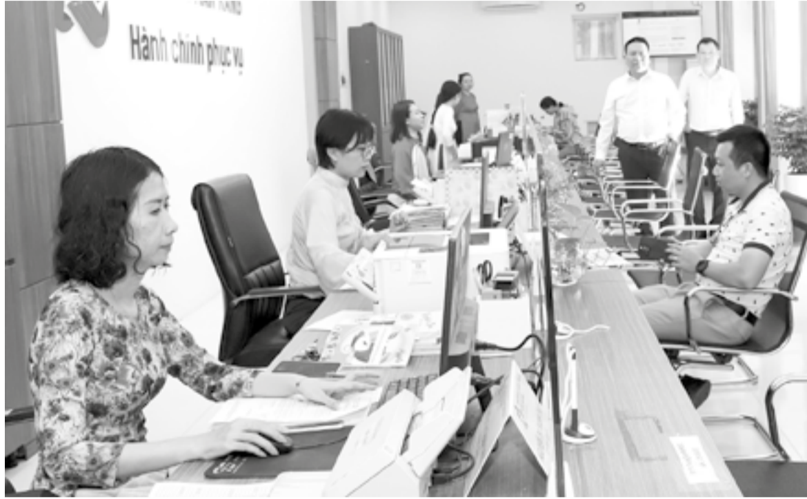
● Trung tâm Phục vụ hành chính công phường Phan Rang được đầu tư khang trang, phục vụ tốt nhu cầu của người dân, doanh nghiệp.

Với tinh thần quyết liệt trong chỉ đạo và sự đồng bộ, sáng tạo trong triển khai, công tác chuyển đổi số (CĐS) của phường Phan Rang thời gian qua đạt nhiều kết quả tích cực. Qua đó không chỉ góp phần nâng cao năng lực lãnh đạo của cấp ủy, hiệu lực, hiệu quả quản lý, điều hành của chính quyền, mà chất lượng phục vụ Nhân dân cũng từng bước được nâng lên.