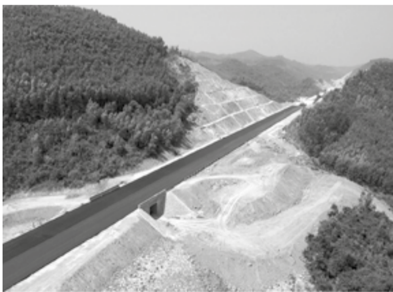
● Đường bộ cao tốc Khánh Hòa - Buôn Ma Thuật đang hoàn thiện.

khai kế hoạch giải ngân vốn đầu tư công năm 2026, đề ra các giải pháp nhằm phấn đấu đạt mục tiêu giải ngân 100% kế hoạch vốn Thủ tướng Chính phủ giao. Đồng thời, các cơ quan liên quan ban hành nhiều văn bản chỉ đạo, đôn đốc chủ đầu tư nhằm đưa ra các giải pháp tháo gỡ, xử lý khó khăn theo thẩm quyền, đẩy nhanh tiến độ giải ngân. Tuy nhiên, lũy kế từ đầu năm đến nay, tỷ lệ giải ngân vốn đầu tư công còn thấp. Nguyên nhân chính do giải phóng mặt bằng chậm; vật liệu đất đắp để phục vụ thi công dự án hiện nay rất khó khăn, các mỏ khoáng sản trong khu vực không đảm bảo cung cấp cho dự án. Ngoài ra, việc chậm trễ trong hồ sơ thủ tục và thanh toán; năng lực tổ chức thực hiện của một số nhà thầu và đơn vị còn yếu cũng là yếu tố ảnh hưởng đến tỷ lệ giải ngân chưa như kỳ vọng.