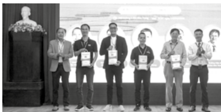
● Lãnh đạo Trường Đại học Nha Trang, Trường Kỹ thuật và Công nghệ tặng quà cho các diễn giả tham gia hội thảo.

Chiều 9-5, Trường Kỹ thuật và Công nghệ (trực thuộc Trường Đại học Nha Trang) tổ chức hội thảo "Kỹ thuật và công nghệ cơ khí thủy sản thông minh - TESF 2026".