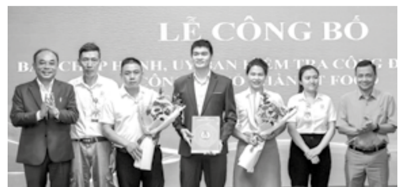
● Đại diện Liên đoàn Lao động tỉnh trao quyết định kết nạp đoàn viên, công nhận tổ chức Công đoàn cơ sở Công ty Cổ phần DT Food.

Rong biển DT Khánh Hòa và Công ty Cổ phần DT Food chuyên nuôi trồng, sản xuất, chế biến, gia công, phân phối và xuất khẩu các dòng sản phẩm từ rong nho biển và yến sào DT Nest. Trong năm, thu nhập bình quân của người lao động hơn 9 triệu đồng/người/tháng. Ngoài ra, được sự quan tâm, tạo điều kiện của Ban Giám đốc công ty, CĐCS DT Group đã dành nhiều chính sách cho đoàn viên công đoàn; 100% người lao động được ký hợp đồng lao động, tham gia đầy đủ bảo hiểm xã hội, bảo hiểm y tế, bảo hiểm thất nghiệp. Việc chi