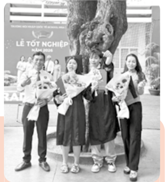
● Học sinh chụp ảnh cùng gia đình và thầy giáo chủ nhiệm tại Trường iSchool Nha Trang.