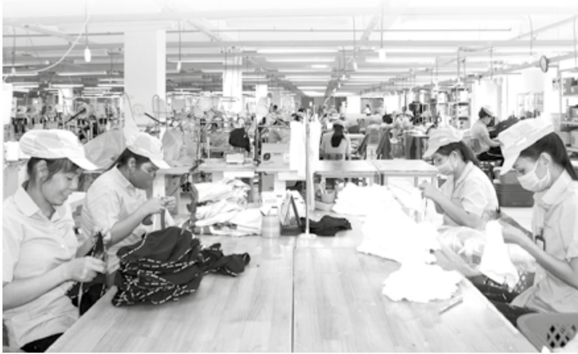
● Công nhân tại Khu Công nghiệp Suối Dầu.

thực tế đáng quan tâm là lao động trung niên và NCT chủ yếu làm việc trong khu vực phi chính thức, tự tạo việc làm, quy mô nhỏ, thu nhập chưa ổn định. Các mô hình việc làm linh hoạt, bán thời gian phù hợp với sức khỏe và kinh nghiệm của người lớn tuổi chưa phát triển đồng bộ. Bên cạnh đó, khả năng tiếp cận đào tạo lại, chuyển đổi nghề của nhóm lao động này còn hạn chế, nhất là trong bối cảnh chuyển đổi số và yêu cầu kỹ năng ngày càng cao. Điều này khiến một bộ phận lao động có nguy cơ mất việc khi doanh nghiệp tái cơ cấu hoặc đổi mới công nghệ.