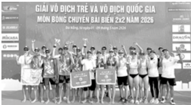
● Đội tuyển bóng chuyền bãi biển Sanvinest Khánh Hòa giành chức vô địch nam, nữ tại giải vô địch 2x2 quốc gia.

Tại Giải vô địch trẻ và vô địch quốc gia môn bóng chuyền bãi biển 2x2 năm 2026 (diễn ra từ ngày 1 đến 9-5 tại TP. Đà Nẵng), hai đôi vận động viên nam, nữ đội Sanvinest Khánh Hòa đã xuất sắc giành chức vô địch.