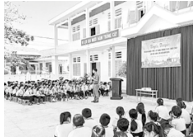
● Cán bộ Đội Chữa cháy và cứu nạn, cứu hộ khu vực 5 tổ chức tuyên truyền tại Trường Tiểu học Ninh Phú.

Đội Chữa cháy và cứu nạn, cứu hộ (CNCH) khu vực 5 thuộc Phòng Cảnh sát phòng cháy, chữa cháy (PCCC) và CNCH Công an tỉnh vừa phối hợp với Trường Tiểu học Ninh Phú (phường Hòa Thắng) và Trường Tiểu học Ninh Ích (xã Nam Ninh Hòa) tổ chức tuyên truyền, trải nghiệm an toàn PCCC cho gần 1.000 cán bộ, giáo viên và học sinh của các trường.