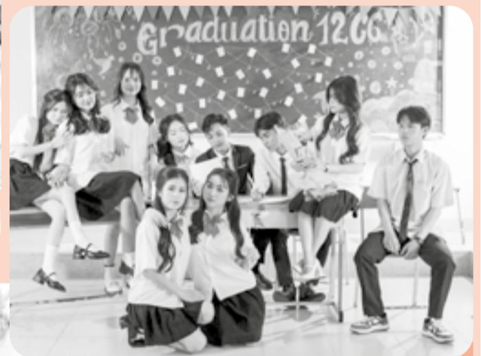
● Các bạn học sinh Trường THPT Nguyễn Trãi (phường Ninh Hòa) chụp ảnh với chủ đề Thanh xuân vườn trường.