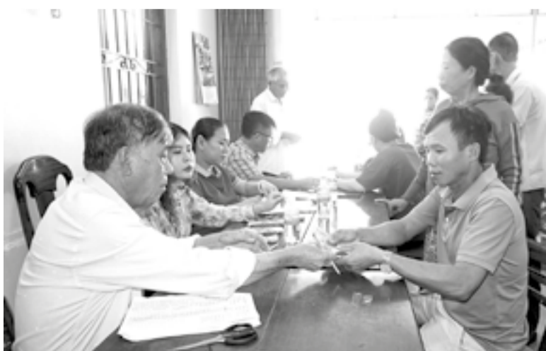
● Thực hiện chi hỗ trợ cho thành viên Hợp tác xã Nông nghiệp kinh doanh tổng hợp Vạn Lương 1.