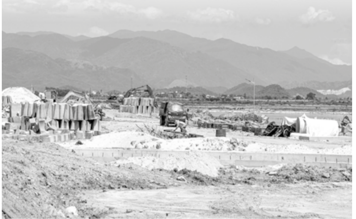
● Thi công tuyến đường ven biển Vạn Lương - Ninh Hòa.