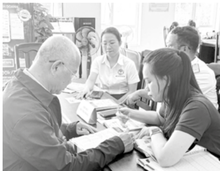
● Cán bộ thuế tuyên truyền, hướng dẫn chính sách thuế cho người dân.