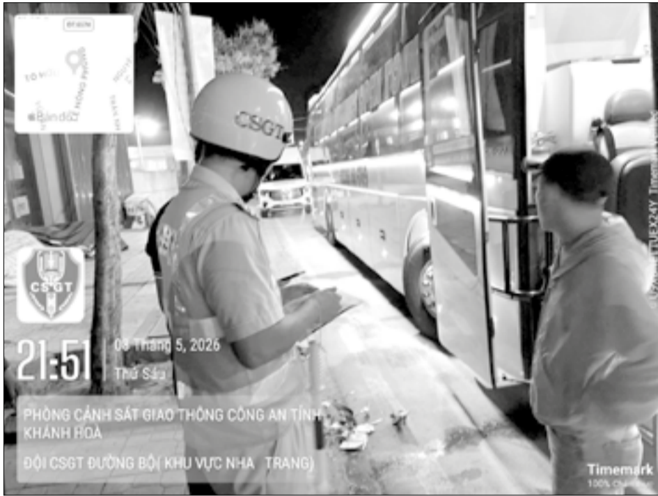
● Lực lượng Cảnh sát giao thông kiểm tra, xử lý xe khách vi phạm quy định pháp luật trên đường Tố Hữu.

Liên quan đến bài viết Bức xúc "xe dù, bến cóc" đăng trên Báo Khánh Hòa số ra ngày 6-5, đại diện Đội Cảnh sát giao thông đường bộ (Phòng Cảnh sát giao thông, Công an tỉnh) cho biết, đội đã ra quân xử lý hoạt động xe khách vi phạm quy định pháp luật về trật tự, an toàn giao thông (ATGT). Trước đó, đội đã thực hiện nhiều đợt tuần tra, kiểm soát, xử lý nhiều trường hợp vi phạm.