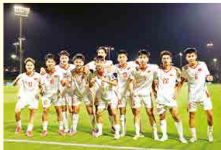
● Các cầu thủ U17 Việt Nam trong trận thắng U17 Yemen.