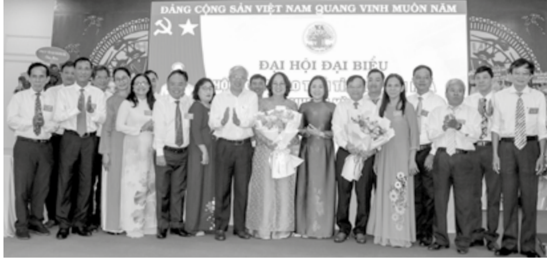
● Lãnh đạo Trung ương Hội Người cao tuổi Việt Nam và lãnh đạo Ủy ban MTTQ Việt Nam tỉnh tặng hoa chúc mừng Ban Chấp hành Hội Người cao tuổi tỉnh, nhiệm kỳ 2026 - 2031.