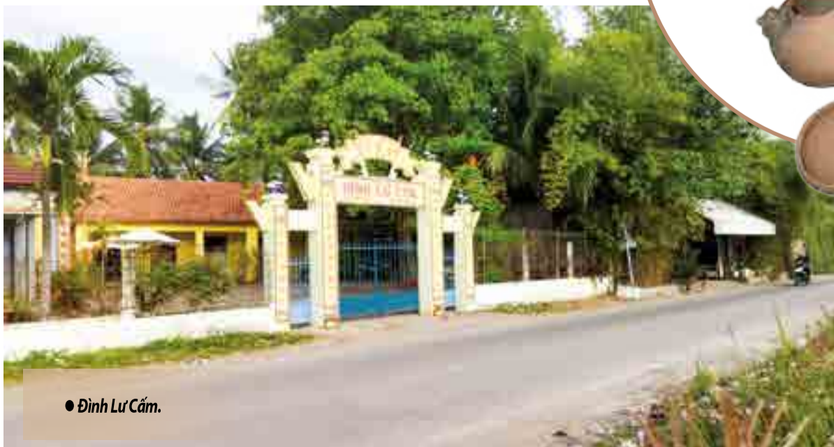
● Đình Lư Cấm.

● Những ống ghè, ấm, chén, nôi... của làng Lư Cấm một thời.