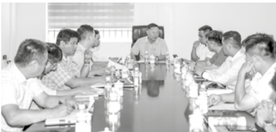
● Lãnh đạo Sở Văn hóa, Thể thao và Du lịch chủ trì cuộc họp.

Sáng 8-5, Sở Văn hóa, Thể thao và Du lịch tổ chức cuộc họp về kế hoạch ghi hình chương trình “Mái ấm gia đình Việt”. Đây là lần thứ 2 chương trình ghi hình tại tỉnh Khánh Hòa (lần thứ nhất vào đầu năm 2024, tại Trường THCS Trần Nhân Tông, xã Diên Khánh).