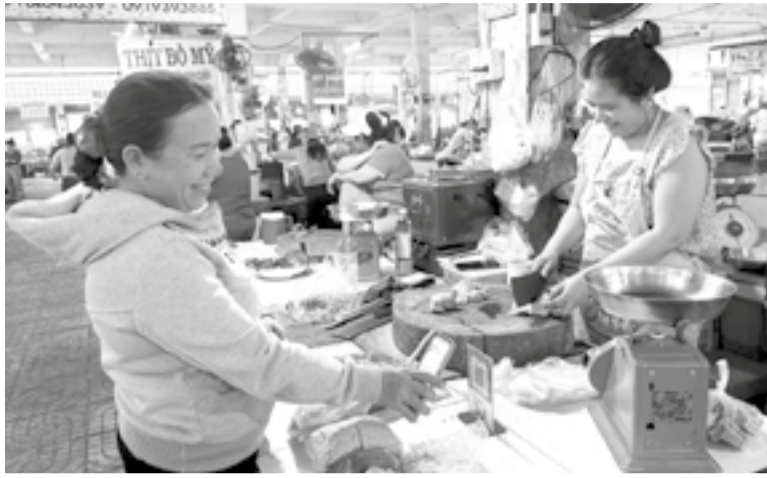
● Khách hàng thanh toán không dùng tiền mặt tại chợ Phan Rang.