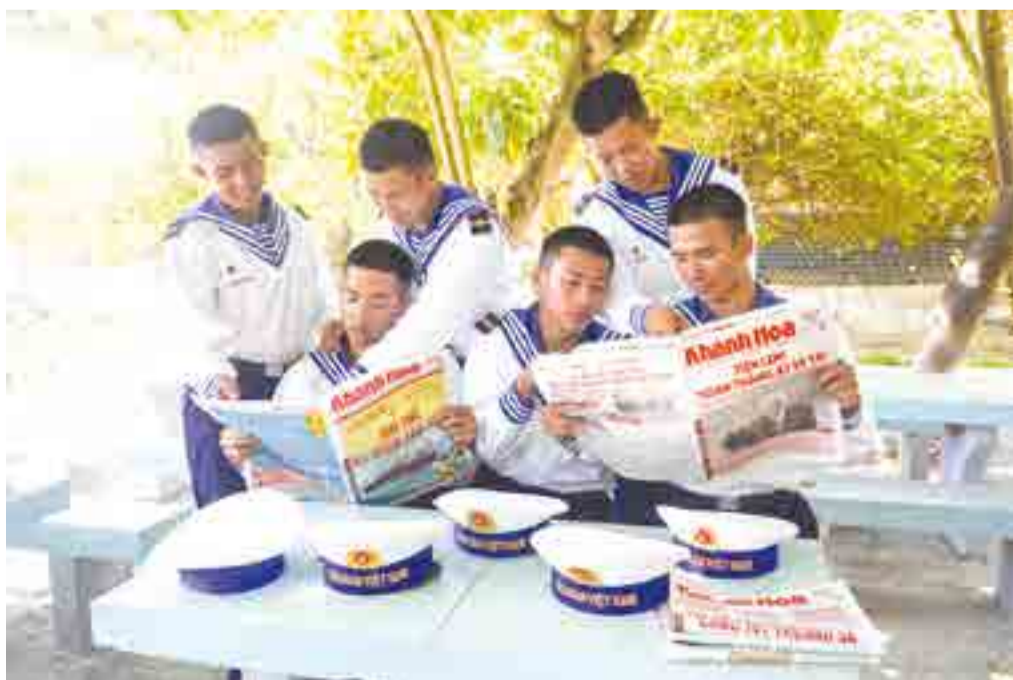
● Các chiến sĩ đảo Song Tử Tây đọc Báo Khánh Hòa.

nội bộ vang lên khắp đảo. Những bản tin được biên soạn ngắn gọn, đọc qua loa truyền thanh cập nhật tình hình trong nước, quốc tế và thông tin nội bộ của đơn vị. Giọng đọc quen thuộc của chiến sĩ trực ban trở thành “đồng hồ” báo hiệu một ngày mới bắt đầu. Tại nhà văn hóa trên đảo, ngoài xem tivi, đọc báo, nơi đây còn tổ chức các buổi