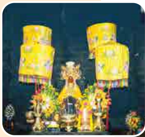
● Hình tượng Thiên Y A Na Thánh Mẫu của người Việt, cũng là Mẹ xứ sở Nữ thần Pô Inư Nương của đồng bào Chăm.

Lễ hội Tháp Bà Pô Nagar là một trong những lễ hội dân gian truyền thống lớn nhất khu vực duyên hải Nam Trung Bộ - Tây Nguyên. Không chỉ tôn vinh những giá trị nhân văn cao đẹp, lễ hội còn là điểm giao thoa văn hóa đặc sắc giữa tín ngưỡng thờ Mẫu Thiên Y A Na của người Việt và Mẹ xứ sở Nữ thần Pô Inư Nương của đồng bào Chăm.