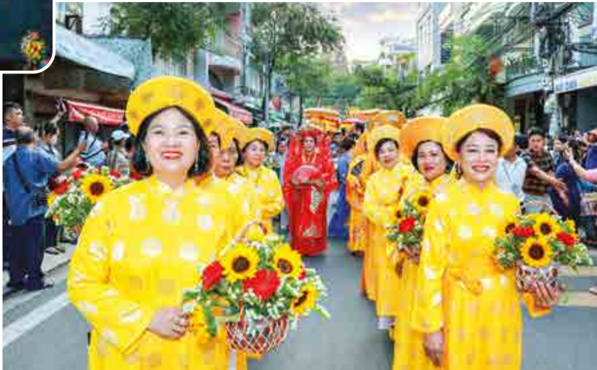
● Niềm vui của người dân tham gia diễu hành trong Lễ hội Tháp Bà Pô Nagar năm 2026.