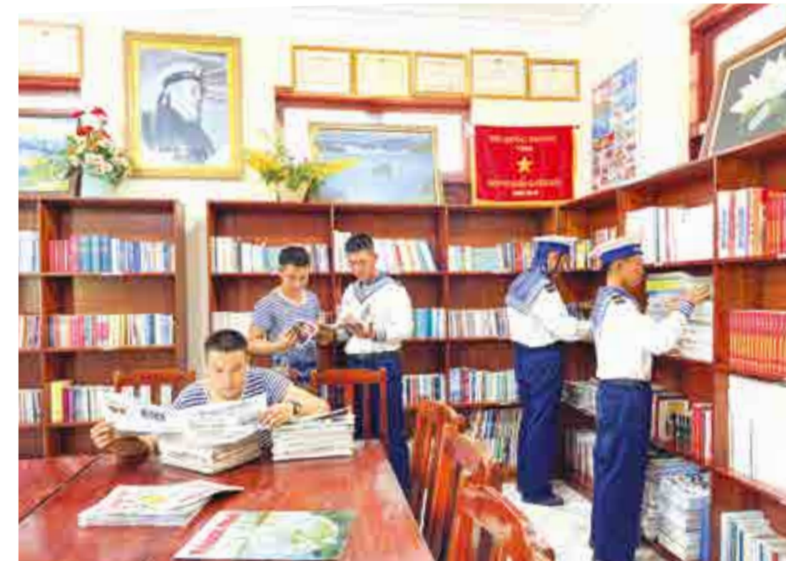
● Các chiến sĩ đảo Sinh Tồn tìm tài liệu, đọc tin tức sau giờ huấn luyện.

Buổi tối, sau giờ ăn, nhà văn hóa sáng đèn. Chiếc tivi đặt giữa phòng trở thành “cửa sổ” mở ra thế giới. Bản tin thời sự trên Đài Truyền hình Việt Nam vang lên quen thuộc. Các cán bộ, chiến sĩ ngồi thành hàng, chăm chú theo dõi từ tin chính trị, kinh tế đến thời tiết trên biển.