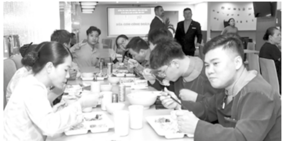
● Đoàn viên, người lao động dùng đồ ăn tại "Bữa cơm công đoàn".

Ngày 8-5, Liên đoàn Lao động tỉnh cùng Công đoàn phường Nha Trang phối hợp với Công đoàn cơ sở Công ty Cổ phần T.D tổ chức “Bữa cơm công đoàn” cho hơn 500 đoàn viên, người lao động đang làm việc tại công ty. Hoạt động nhằm hưởng ứng Tháng hành động về an toàn, vệ sinh lao động và Tháng Công nhân năm 2026.