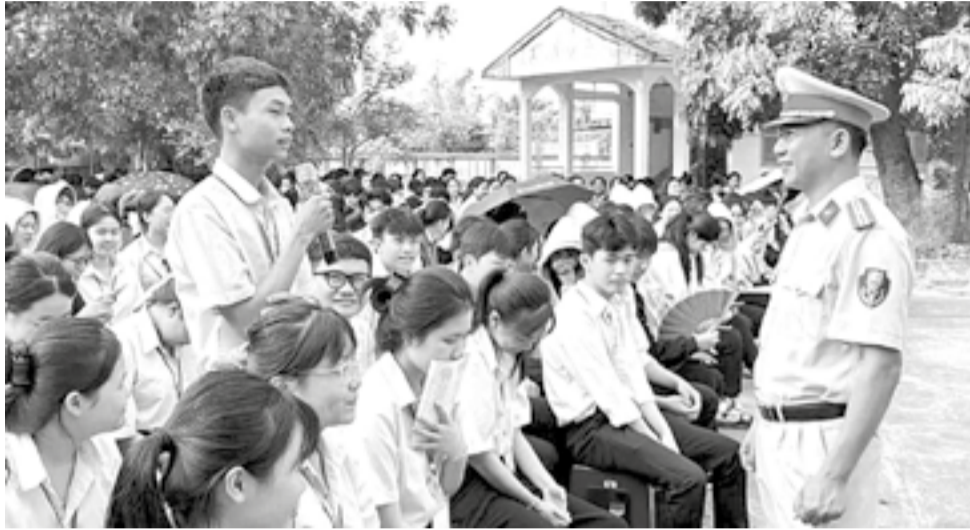
● Cảnh sát giao thông tuyên truyền an toàn giao thông cho học sinh Trường THPT Nguyễn Chí Thanh (phường Ninh Hòa).

Thời gian qua, tình trạng học sinh (HS) vi phạm trật tự an toàn giao thông (ATGT) trên địa bàn tỉnh vẫn diễn ra phổ biến. Trước thực tế đó, lực lượng Cảnh sát giao thông (CSGT) và nhà trường đã tích cực triển khai nhiều biện pháp nhằm nâng cao ý thức tham gia giao thông cho HS.