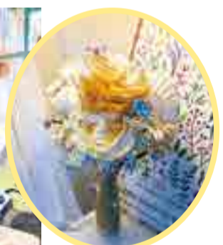
● Bó hoa làm từ vỏ sò, vỏ ốc.

hồn xứ biển đó nhanh chóng được nhiều người đón nhận. Trong ngày trọng đại của đời mình, chị cũng tự tay làm bó hoa cưới từ vỏ sò - sản phẩm mang đậm dấu ấn hành trình khởi nghiệp của riêng mình.