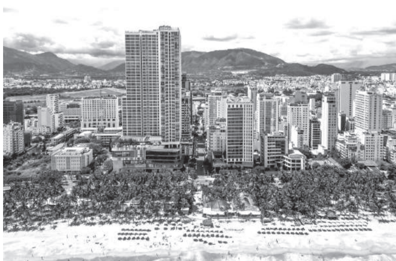
● Một góc phường Nha Trang.

Theo đó, thực hiện Nghị quyết số 109 ngày 16-4-2026 của Chính phủ về cập nhật, bổ sung Chương trình hành động triển khai Nghị quyết Đại hội XIII của Đảng và Kết luận số 18 của Ban Chấp hành Trung ương khóa XIV, công tác quy hoạch được xác định là nhiệm vụ trọng tâm, tạo điều kiện huy động, phân bổ và sử dụng hiệu quả các nguồn lực, phục vụ