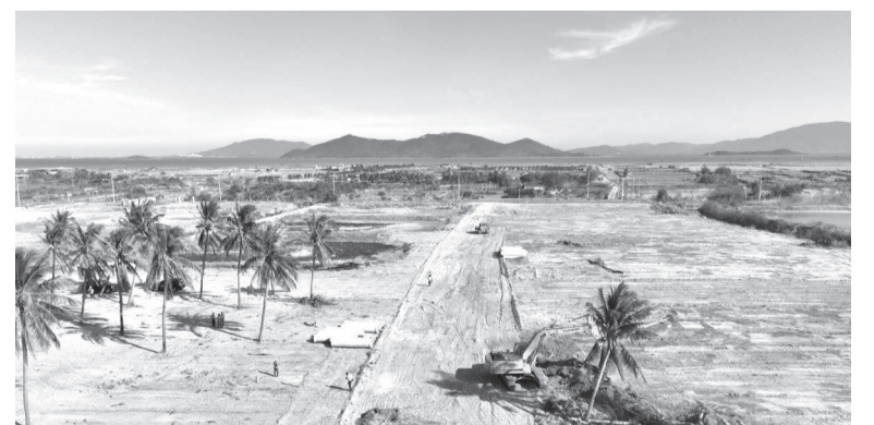
● Khu vực triển khai dự án Khu tái định cư Vạn Thắng, giai đoạn 1.

Đáng chú ý, đối với các công trình, vật kiến trúc không đủ điều kiện bồi thường theo quy định, tỉnh vẫn xem xét hỗ trợ theo từng loại công trình. Trong đó, tường rào, bờ kè, móng trụ được hỗ trợ bằng 100% đơn giá xây dựng mới; nhà ở, mái che và công trình phục vụ sinh hoạt thường xuyên được hỗ trợ 80% đơn giá xây dựng mới.