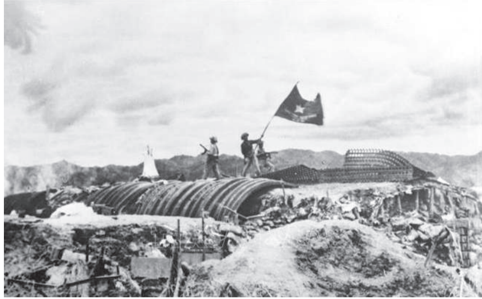
● Chiều 7-5-1954, lá cờ "Quyết chiến - Quyết thắng" của Quân đội nhân dân Việt Nam tung bay trên nóc hầm tướng De Castries. Chiến dịch lịch sử Điện Biên Phủ đã toàn thắng.

Cách đây 72 năm, toàn Đảng, toàn quân và toàn dân ta đã đoàn kết một lòng, vượt qua muôn vàn khó khăn, kiên cường chiến đấu oanh liệt làm nên Chiến thắng Điện Biên Phủ “lừng lẫy năm châu, chấn động địa cầu” - một trong những mốc son chói lọi trong lịch sử dựng nước và giữ nước của dân tộc.