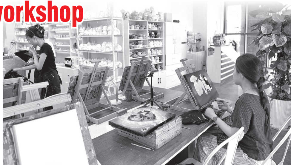
● Một bạn trẻ trải nghiệm vẽ tranh tại Bối Art - Workshop Nha Trang.

Sở dĩ quán cà phê truyền thống, mô hình cà phê kết hợp workshop mang đến trải nghiệm hoàn toàn khác biệt. Thay vì chỉ ngồi uống nước và trò chuyện, khách hàng được trực tiếp tham gia các hoạt động sáng tạo, tạo