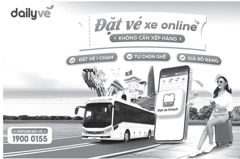
● Dailyve giới thiệu nền tảng đặt vé online với thao tác một chạm, giúp người dùng chủ động hành trình.

Theo đại diện Dailyve, hành vi người dùng đang thay đổi theo hướng ngày càng chủ động. Dữ liệu của chúng tôi cho thấy, tỷ lệ người dùng đặt vé trước 7 đến 14 ngày trong mùa cao điểm đang tăng lên rõ rệt. Đây là khoảng thời gian giúp người dùng có nhiều lựa chọn nhất về giá và lịch trình. Bên cạnh đó, việc minh bạch thông tin và cho phép so sánh trực tiếp cũng giúp người dùng đưa ra quyết định nhanh hơn, giảm áp lực trong quá trình chuẩn bị. Không dừng lại ở việc đặt vé sớm, nhiều bạn trẻ còn xây dựng phương án dự phòng như: Lựa chọn nhiều khung giờ khác nhau, cân nhắc các tuyến thay