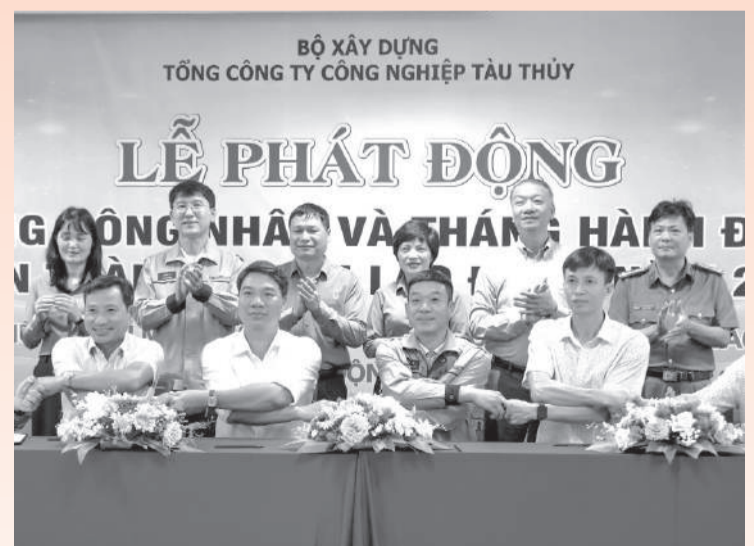
● Các công ty đóng tàu ký kết thi đua hưởng ứng Tháng hành động về an toàn vệ sinh lao động năm 2026.

Địp này, 13 doanh nghiệp đóng tàu thực hiện ký kết thi đua hưởng ứng Tháng hành động