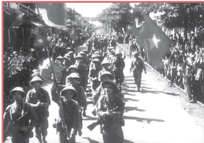
● Cảnh bộ đội tiến về Hà Nội tháng 10-1954 trong phim của đạo diễn Roman Karmen.

Chiến dịch Điện Biên Phủ diễn ra từ ngày 13-3 đến 7-5-1954 với 3 đợt tiến công. Quân ta đã lần lượt đánh chiếm, tiêu diệt các cứ điểm: Him Lam, Độc Lập, Bản Kéo, sân bay Mường Thanh, đồi C1, đồi D1, đồi A1... 17 giờ 30 phút ngày 7-5-1954, quân ta chiếm sở chỉ huy của địch; tướng De Castries cùng Bộ Tham mưu và toàn bộ binh lính ở khu trung tâm ra hàng. Lá cờ "Quyết chiến, quyết thắng" tung bay trên nóc hầm sở chỉ huy địch. Đến 24 giờ ngày 7-5-1954, toàn bộ quân địch ở Hồng Cúm bị bắt làm tù binh. Sau 56 ngày đêm chiến đấu dằng dặc, mưu trí, sáng tạo, quân và dân ta đã đập tan toàn bộ tập đoàn cứ điểm Điện Biên Phủ, tiêu diệt và bắt sống 16.200 tên địch, bắn rơi 62 máy bay, thu 64 ô tô và toàn bộ vũ khí, đạn dược, quân trang, quân dụng của địch.