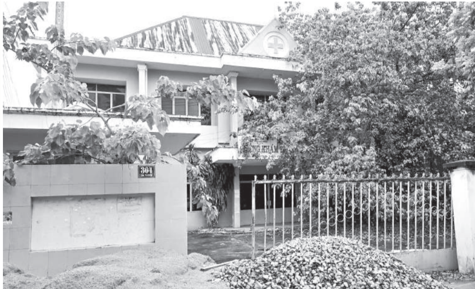
● Trụ sở Phòng khám đa khoa số 5 (304 đường Dã Tượng, phường Nam Nha Trang) bị bỏ hoang, chuẩn bị được sửa chữa làm Trạm Y tế phường.

Đối với khối MTTQ, sở, ngành và cấp xã, qua rà soát có 2.473 cơ sở nhà, đất được phân loại xử lý. Sau khi hợp nhất tỉnh, UBND tỉnh đã ban hành Quyết định số 47, ngày 8-1-2026, phê duyệt phương án sắp xếp lại, xử lý đối với 2.473 cơ sở nhà, đất của các cơ quan, đơn vị và địa phương. Các cơ sở này được phân thành 2 nhóm: Nhóm 1 gồm 2.094 cơ sở tiếp tục sử dụng theo hình thức "giữ lại tiếp tục sử dụng"; nhóm 2 gồm 379 cơ sở không còn nhu cầu sử dụng hoặc sử dụng không hiệu quả, được sắp xếp theo các hình thức "thu hồi", "điều chuyển" và "chuyển giao về địa phương quản lý, xử lý". Trong đó, có 4 cơ sở thu hồi do sử dụng không hiệu quả; 106 cơ sở điều chuyển cho các đơn vị đã xác định tiếp nhận; 269 cơ sở chuyển giao về địa phương quản lý, xử lý do chưa xác định được đơn vị tiếp nhận. Trên cơ sở phương án này, Chủ tịch UBND tỉnh đã ban hành các quyết định thu hồi, điều chuyển, trong đó: 18 cơ sở cho