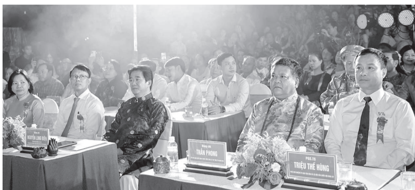
● Các đồng chí lãnh đạo dự lễ khai mạc.