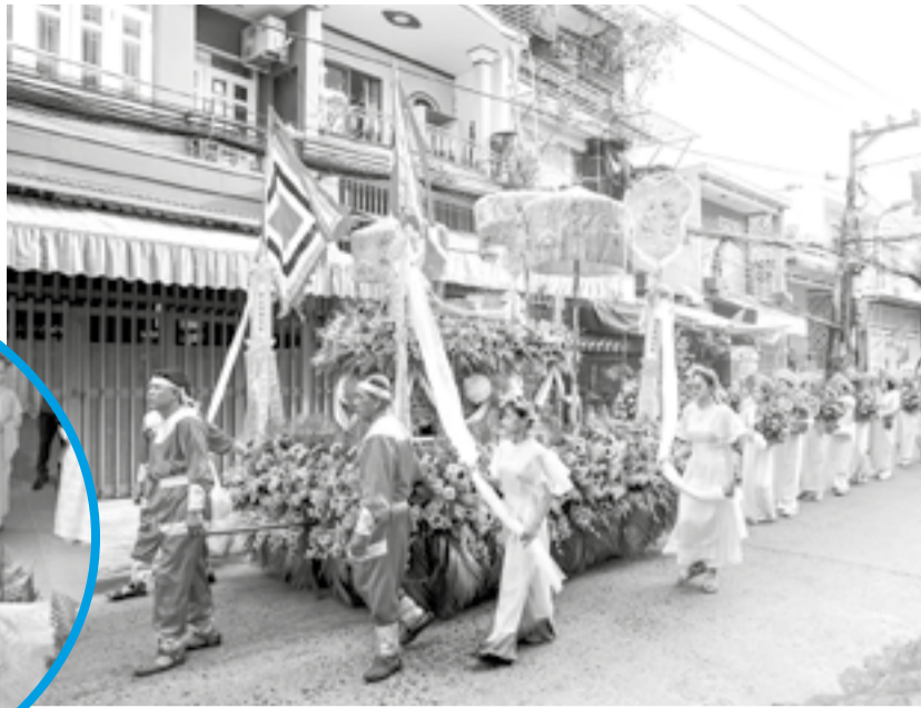
● Xe hoa, kiệu lọng được trang trí đẹp mắt.