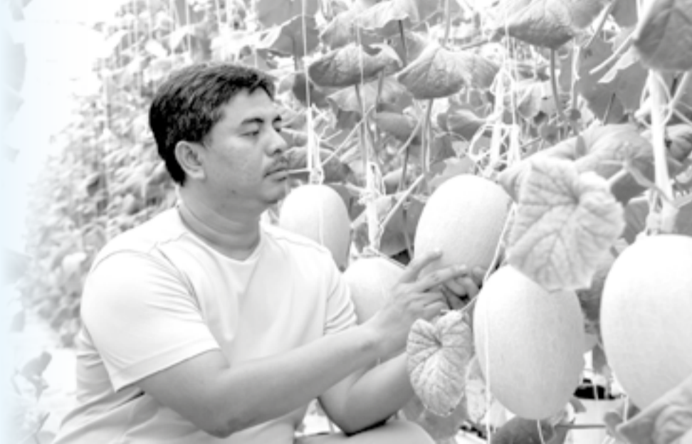
● Nông dân tại thôn Ma Ty, xã Bắc Ái Tây trồng dưa lưới công nghệ cao.

Từ đầu năm đến nay, ngành trồng trọt trong tỉnh ghi nhận những chuyển biến tích cực. Đặc biệt, việc đẩy mạnh ứng dụng công nghệ cao và cánh đồng lớn đang trở thành động lực, tạo đà cho phát triển nông nghiệp bền vững của địa phương.