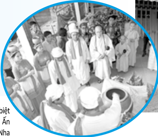
● Thực hiện nghi thức lấy nước từ chùa Hải Ấn.

Từ xa xưa, lễ rước nước gắn liền với ý nghĩa thiêng liêng cầu mưa thuận gió hòa, mùa màng tươi tốt, đồng thời tượng trưng cho sự thanh tẩy, gột rửa và ban phát ân huệ của đấng thần linh đối với người dân. “Đồng bào Chăm thường