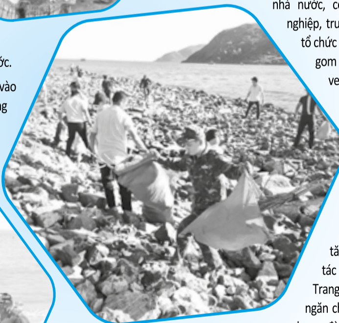
● Hoạt động thu gom rác thải ven vịnh Nha Trang