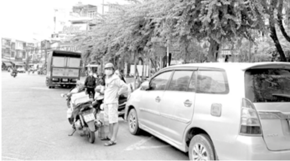
● Nhà chờ xe buýt trên đường 2 tháng 4 không còn chỗ cho xe buýt vào đón khách.

Đại diện Công ty Cổ phần Xe khách Phương Trang Futabuslines - chi nhánh Nha Trang cho