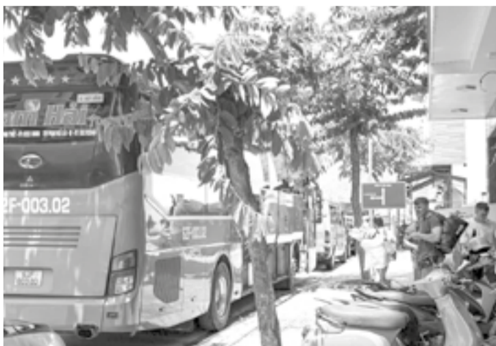
● Xe Nam Hải đón khách trên đường Tố Hữu.

Trước đó, khoảng 7 giờ ngày 30-4, trên tuyến đường Thích Quảng Đức (phường Nam Nha Trang), 2 xe khách Bình Minh Tải cùng dừng đối diện văn phòng nhà xe Bình Minh Tải để đón khách chạy tuyến Nha Trang - TP. Hồ Chí Minh. Khi đã đủ khách, một chiếc xe đánh lái chiếm gần hết tuyến đường để “xuất