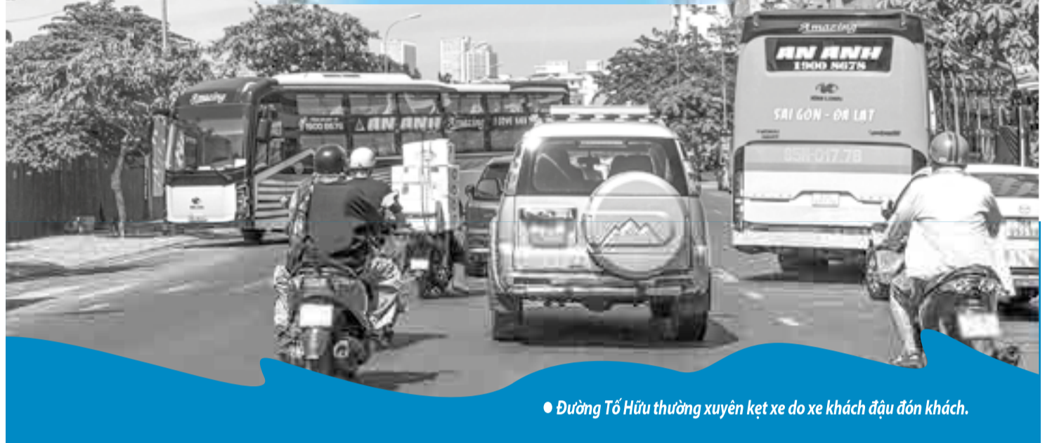
● Đường Tố Hữu thường xuyên kẹt xe do xe khách đậu đón khách.