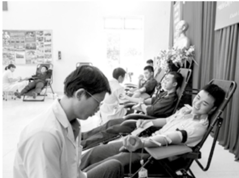
● Cán bộ, chiến sĩ Tiểu đoàn Huấn luyện chiến sĩ mới tham gia "Ngày hội Hiến máu tình nguyện" năm 2026.