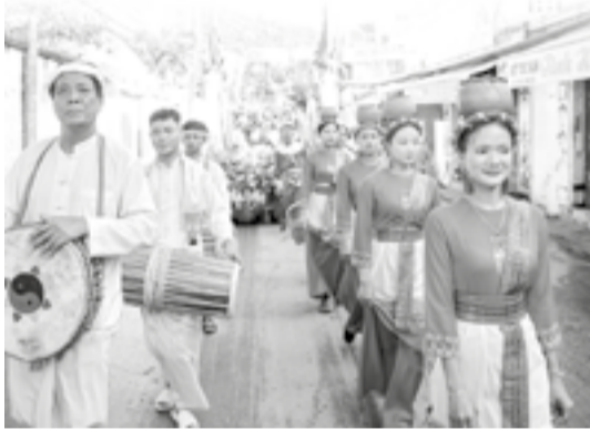
● Đoàn rước di chuyển từ chùa Hải Ấn mang nước về dâng Mẫu ở Khu di tích quốc gia đặc biệt Tháp Bà Pô Nagar.