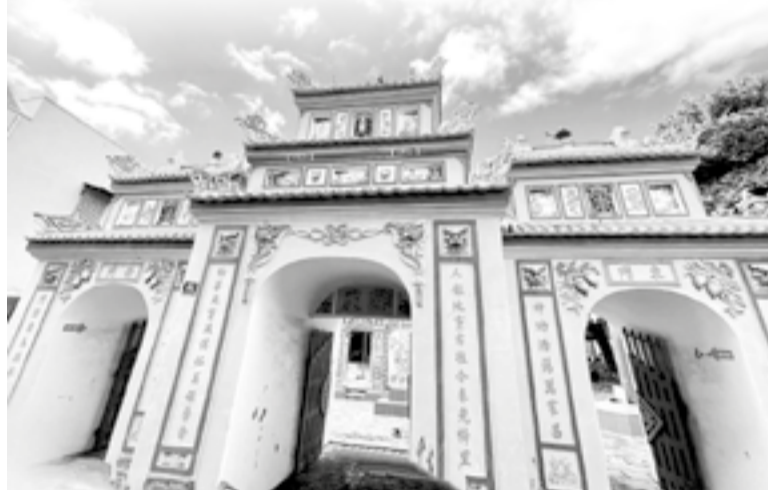
● Cổng tam quan đình Dư Khánh.

Đình tọa lạc trên khuôn viên khoảng 1.956m 2 , với các công trình tiêu biểu của đình làng Việt gồm: Cổng tam quan, tòa chánh điện, nhà tiền hiền, nhà trụ (nhà bếp), nhà cối (nhà kho), bắc bang và đông bang (2 dãy nhà nằm ở hướng bắc và hướng nam của đình). Tại cổng tam quan, cửa Trung môn có 2 tầng, 3 lớp mái và 2 cổng hai bên có 1 tầng, 2 lớp mái. Trên cổng Trung môn có cặp rồng bằng sứ xanh và 2 cổng hai bên là cặp búp sen chớm nở cùng các đường chạm khối, trang trí. Trước cổng đình, bình phong ngoại được chạm trổ tinh xảo. Bên trong đình, bình phong nội được xây dựng theo kiểu tứ trụ với 2 cặp lân, rồng xanh chính điện, cùng hình ảnh long, phụng chạm nổi ở mặt trước thể hiện âm dương hòa hợp, mưa thuận gió hòa.