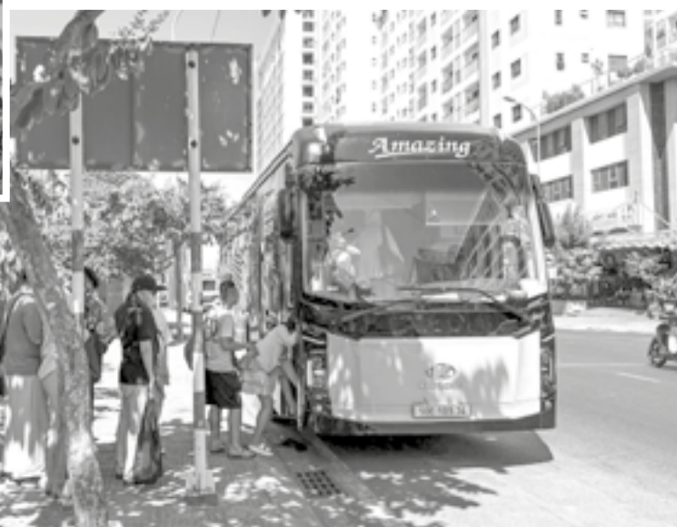
● Xe An Anh đón khách trên đường Tố Hữu.