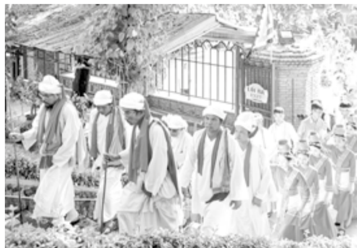
● Các vị chức sắc người Chăm tham gia lễ rước nước.