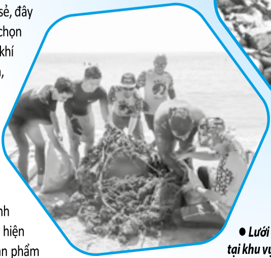
● Lưới mắc ở san hô được thu gom tại khu vực biển Hòn Chồng - Đặng Tất.