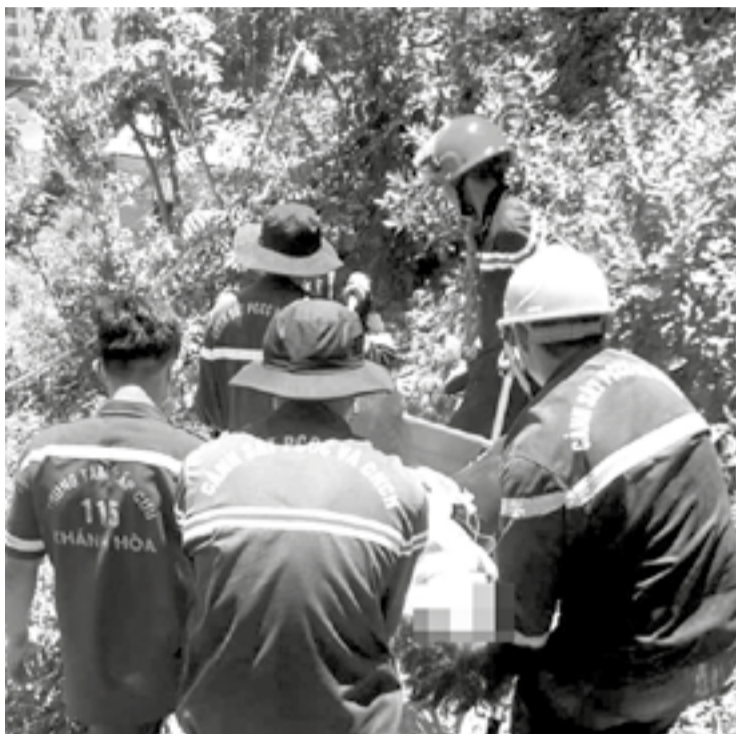
● Lực lượng chức năng đưa du khách người Úc bị kiệt sức khi đang leo núi Cô Tiên xuống núi.