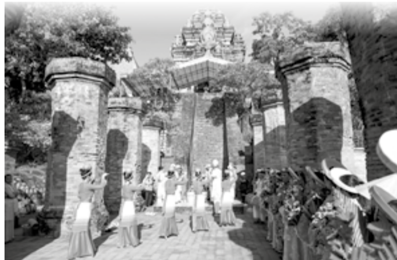
● Lễ rước nước mang ý nghĩa cầu mưa thuận gió hòa, mùa màng tươi tốt.

tổ chức lễ rước nước để dâng lên các vị thần linh và cầu xin để được ban cho mưa thuận gió hòa, con cháu đông đúc, làm ăn phát đạt, sức khỏe dồi dào, đồng bào khắp nơi làm ăn thịnh vượng. Lễ rước nước hôm nay là một hoạt động có ý nghĩa to lớn và được tổ chức rất bài bản. Tôi hy vọng, nghi lễ này được duy trì, truyền nối đến nhiều thế hệ sau như chúng ta đã tiếp nhận từ các thế hệ ông cha”, ông Đàng Tấn Niên - thành viên Hội đồng Chức sắc Chăm Balamôn tỉnh cho biết.