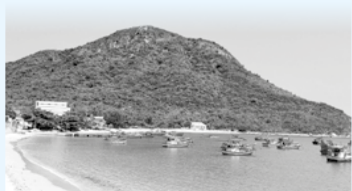
● Khung cảnh yên bình ở làng chài Ninh Vân.

Buổi chiều, trời dịu dần, chúng tôi đi tham quan địa điểm lưu niệm Tàu C235. Điểm tham quan cuối ngày là bãi cây cổ thụ, đây là điểm đến mới của giới trẻ khi đến với làng chài Ninh Vân. Trên bãi có 1 cây gạo cổ thụ, một cụm 3 cây găng. Nơi đây còn có nhiều cây cóc núi với thân và cành uốn éo rất đẹp mắt. Đang là đầu mùa hè, mấy cây cóc núi đang vào mùa đậu trái, mọc thành chùm trên ngọn cây. Vài nhánh vươn dài ra hướng biển, sà xuống gần mặt đất làm tăng thêm vẻ đẹp của cảnh quan như một khu rừng cổ tích. Nắng chiều thả những ánh vàng lên ngọn cây cổ thụ và bãi cát đẹp nao lòng. Xa xa, rạn san hô phơi mình trong nắng chiều khi thủy triều đang rút. Những tảng đá lớn, nhỏ nhiều hình thù