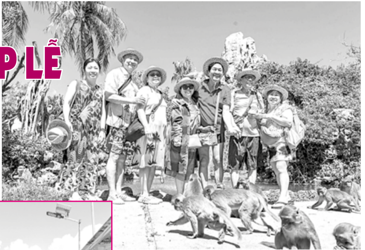
● Khách tham quan Khu Du lịch Đảo Khi.

Kỳ nghỉ lễ 30-4 và 1-5 năm nay, Khánh Hòa là một trong những điểm đến thu hút đông du khách. Từ bãi biển Nha Trang đến những điểm vui chơi giải trí luôn nhộn nhịp bước chân du khách. Xứ Trầm Hương đón khách bằng tất cả sự chu đáo và náo nhiệt đặc trưng của một trung tâm du lịch biển lớn của Việt Nam.