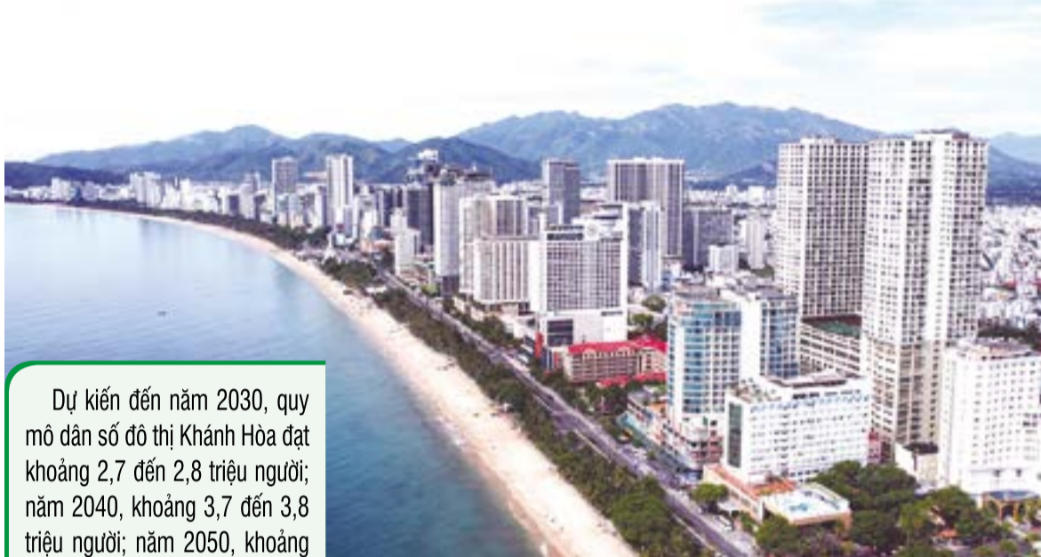
● Đường Trần Phú (phường Nha Trang) với nhiều tiềm năng phát triển du lịch, thương mại, tài chính.

Thủ tướng Chính phủ vừa ban hành Quyết định phê duyệt nhiệm vụ quy hoạch chung đô thị Khánh Hòa đến năm 2050, tầm nhìn đến năm 2075. Mục tiêu xây dựng và phát triển Khánh Hòa trở thành đô thị loại I, hướng tới thành thành phố trực thuộc Trung ương hiện đại, thông minh, xanh, bền vững; đồng thời là cực tăng trưởng quan trọng, đô thị biển - cửa ngõ quốc tế có sức cạnh tranh cao.