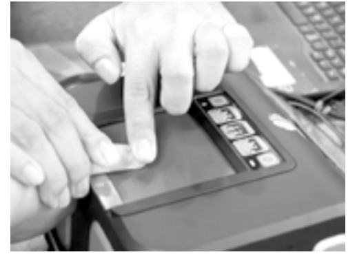
● Thu nhận vân tay các em nhỏ trên thiết bị chuyên dụng để làm căn cước.

Phòng Cảnh sát Quản lý hành chính về trật tự xã hội Công an tỉnh đang chỉ đạo