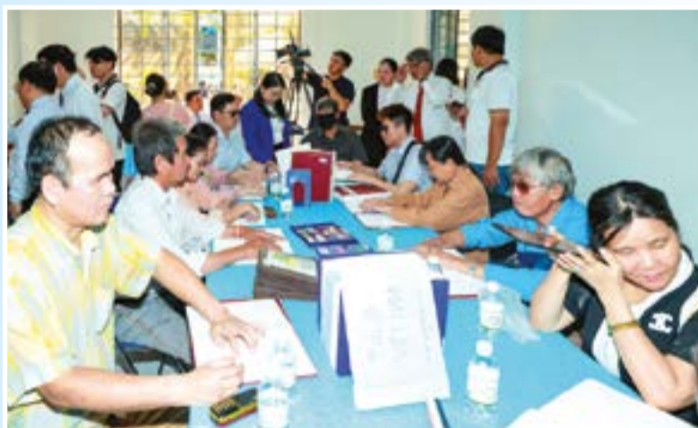
● Bạn đọc sử dụng sách và các thiết bị hỗ trợ đọc sách tại phòng đọc sách dành cho người khiếm thị.