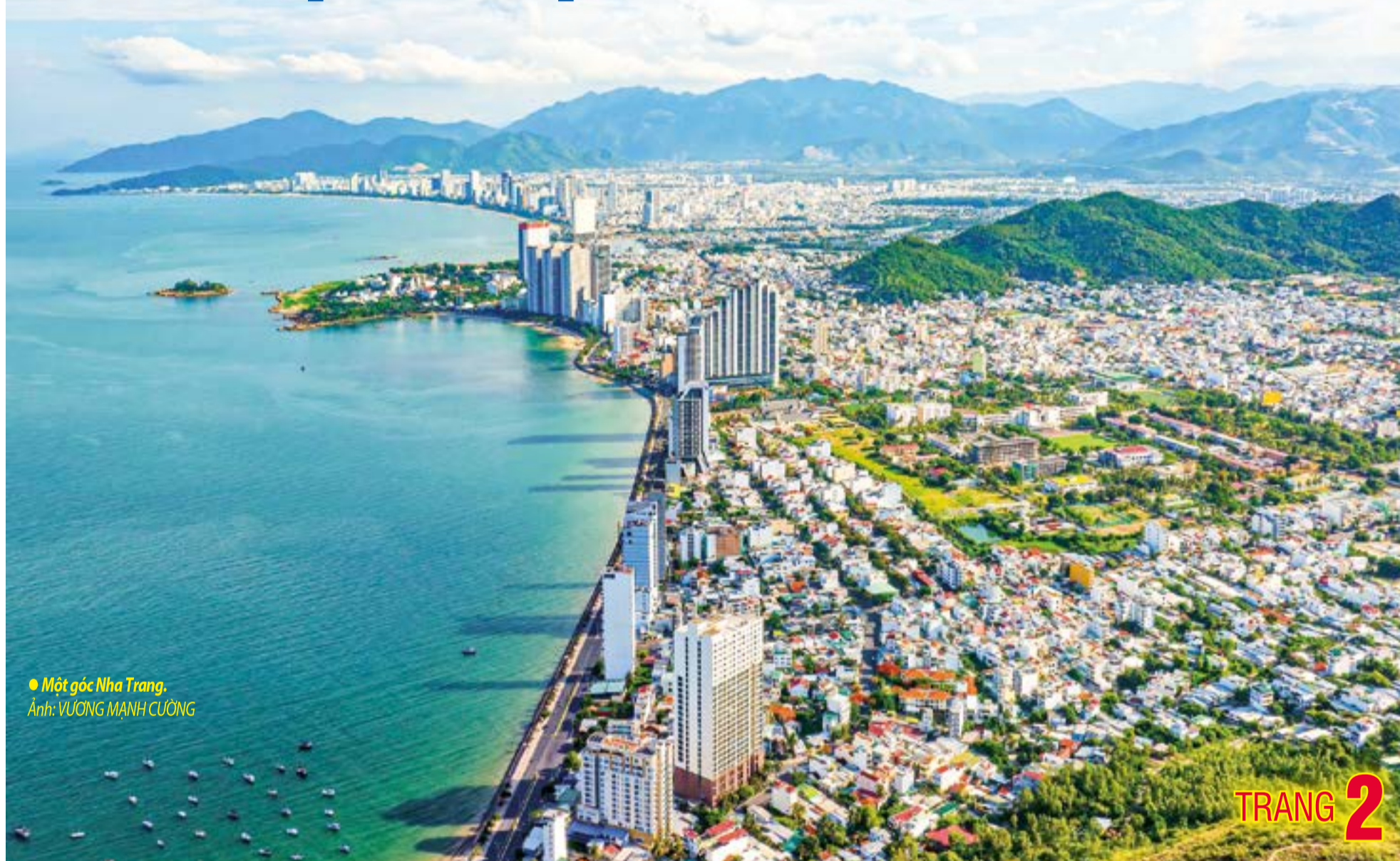
● Một góc Nha Trang.