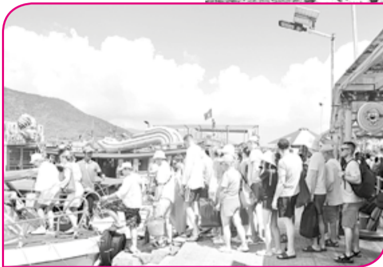
● Khách du lịch xuống tàu tham quan vịnh Nha Trang.

Trong 2 ngày đầu của kỳ nghỉ lễ, bãi biển Nha Trang chật kín người vui chơi và tắm biển. Các khu, điểm tham quan du lịch cũng được nhiều khách du lịch lựa chọn để trải nghiệm. Trong đó, VinWonders Nha Trang tiếp tục là điểm thu hút đông du khách nhất. Từ sáng sớm, khách đã xếp hàng chờ đi cáp treo sang đảo Hòn Tre để tham quan, vui chơi. Bên cạnh các trò chơi mạo hiểm quen thuộc, thủy cung và xiếc chim, năm nay, VinWonders Nha Trang còn làm phong phú thêm hành trình của du khách bằng triển lãm tranh nghệ thuật, workshop vẽ nón lá đậm chất văn hóa dân tộc và chương trình diễu hành quốc kỳ chủ