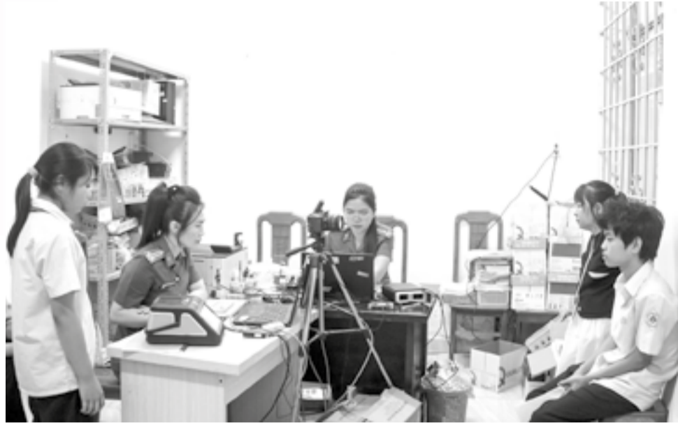
● Không khí làm việc tại Công an phường Bắc Nha Trang vào buổi tối hàng ngày.

chính trị, phối hợp chặt chẽ với các trường học để đẩy nhanh tiến độ cấp căn cước. Tính đến trưa 1-5, chúng tôi đã thu nhận hồ sơ cấp căn cước cho 503 công dân từ 6 đến 14 tuổi và kích hoạt định danh điện tử mức 2 cho 396 trường hợp. Dự kiến trước ngày 10-5 sẽ hoàn thành chỉ tiêu được giao”.