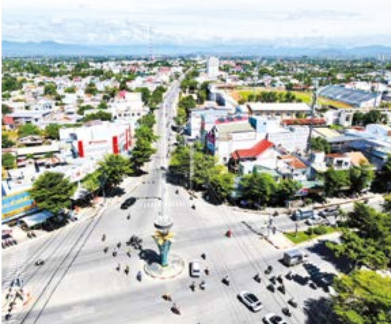
● Ngã năm Phan Rang - nơi những chuyến đi lên Đà Lạt ngày trước luôn bắt đầu bằng một lần chuyển xe.