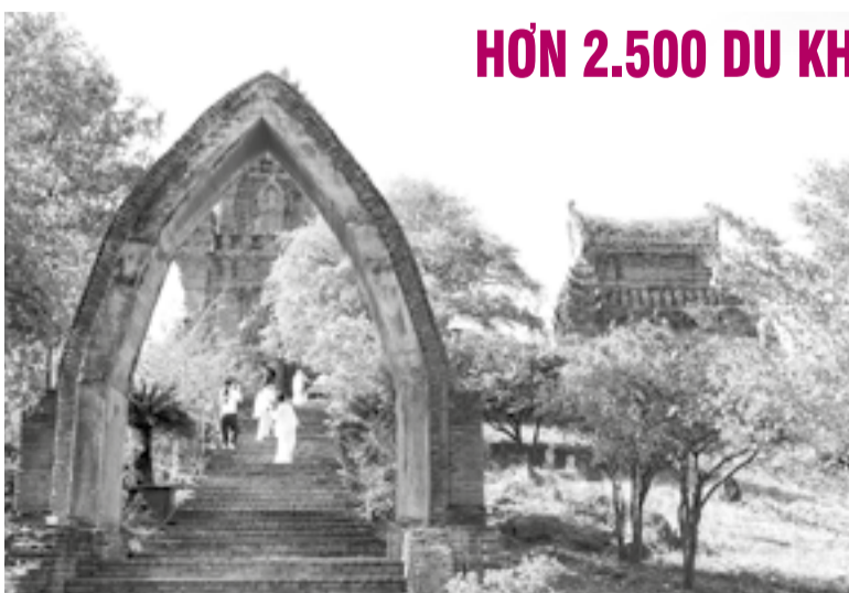
● Du khách tham quan Tháp Pô Klông Garai.

Trong 2 ngày đầu của kỳ nghỉ lễ 30-4 và 1-5, Di tích quốc gia đặc biệt Tháp Pô Klông Garai (phường Đô