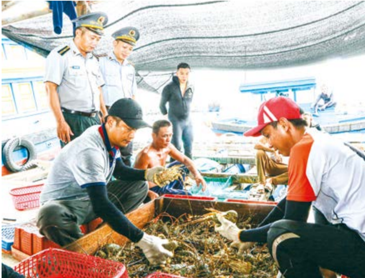
● Lực lượng chức năng tuyên truyền người dân tuân thủ quy định hoạt động nuôi trồng thủy sản trên vịnh Cam Ranh.

Để siết chặt quản lý, UBND tỉnh đã nhiều lần yêu cầu các địa phương không để phát sinh lồng bè mới. Tuy nhiên, qua kiểm tra ngày 22 và 23-4, lực lượng Cảnh vụ Hàng hải Nha Trang phát hiện thêm 4 bè nuôi mới trong khu vực bảo vệ luồng hàng hải Ba Ngòi. Tình trạng lấn chiếm, tái lấn chiếm hành lang bảo vệ luồng còn diễn ra, nhất là tại khu vực từ phao số 4 đến phao số 10 và các vùng nước