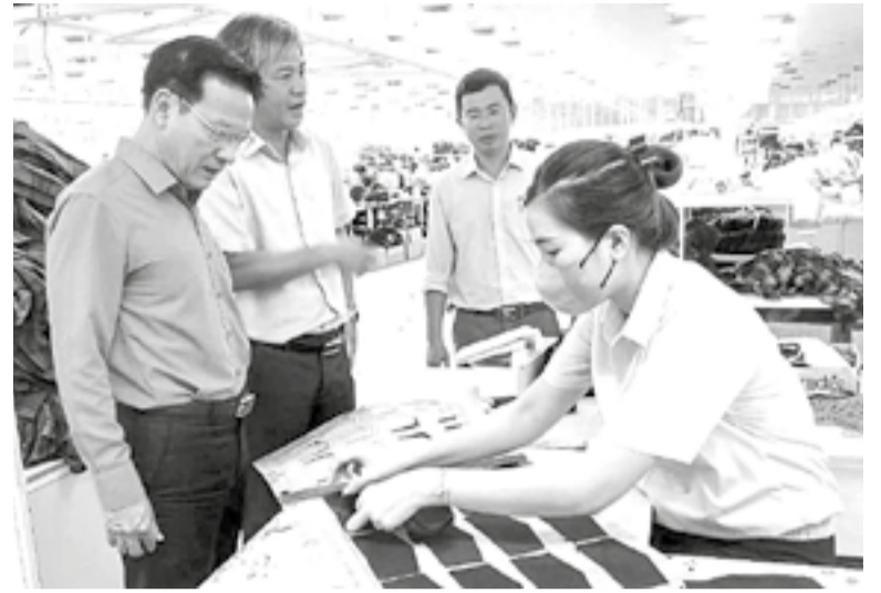
● Lãnh đạo Liên đoàn Lao động tỉnh nắm bắt tình hình đời sống, việc làm của người lao động.

Để bảo đảm hiệu quả, kế hoạch đề ra các giải pháp đồng bộ như: Ký kết chương trình phối hợp truyền