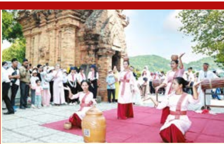
● Thiếu nữ Chăm biểu diễn những điệu múa truyền thống tại Di tích quốc gia đặc biệt Tháp Bà Pô Nagar.

Suốt 13 thế kỷ qua, quần thể Tháp Bà Pô Nagar (phường Bắc Nha Trang) vẫn uy nghiễm tọa lạc trên đỉnh Cù Lao, nơi cửa sông Cái đổ ra biển. Là di tích quốc gia đặc biệt, nơi đây không chỉ lưu giữ kiến trúc độc đáo, mà còn là điểm giao thoa văn hóa Việt - Chăm, mang đến cho du khách những trải nghiệm nghệ thuật truyền thống khó quên.