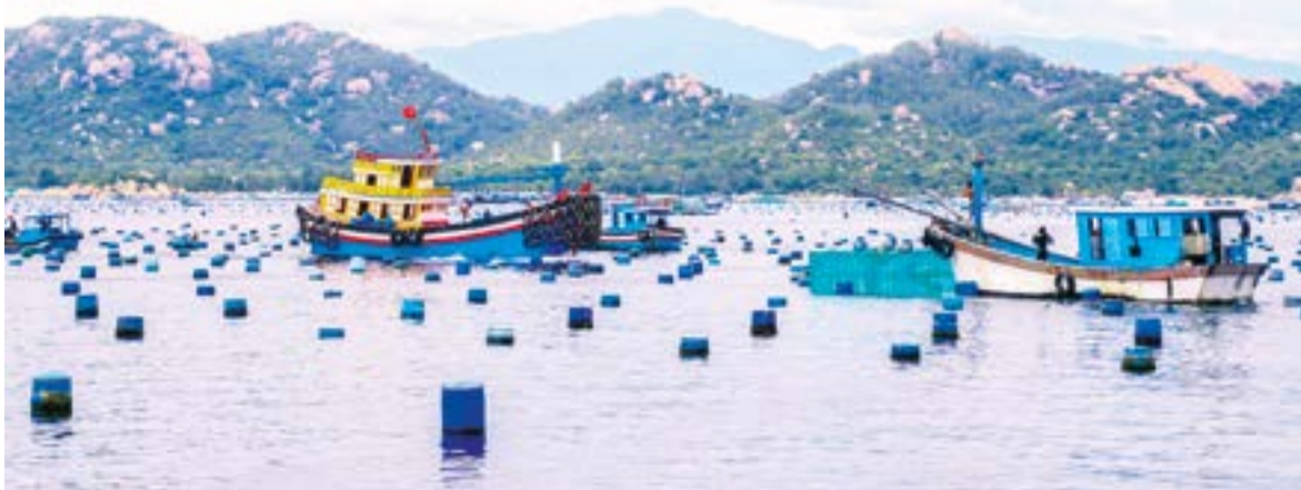
● Khu vực người dân nuôi trồng thủy sản tại vùng nước trường bắn của Vùng 4 Hải quân.