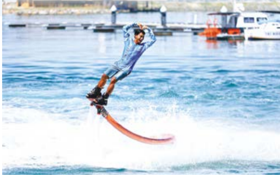
● Trải nghiệm Flyboard trên vịnh Nha Trang.

định hình các giải pháp phát triển môn thể thao biển lướt ván điều để thúc đẩy kinh tế du lịch. Cụ thể như quy hoạch khu vực hoạt động, bảo đảm an toàn, đi cùng với đó là phát triển dịch vụ và bảo vệ môi trường”.