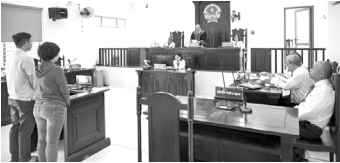
● Tòa tuyên án.