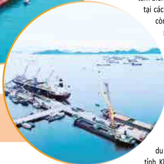
● Cảng Cam Ranh.