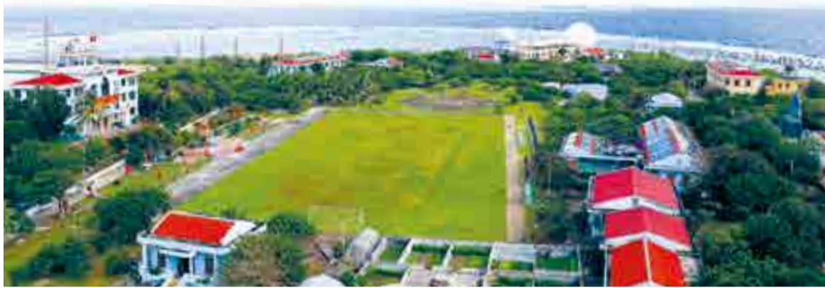
● Một góc đảo Song Tử Tây (đặc khu Trường Sa).