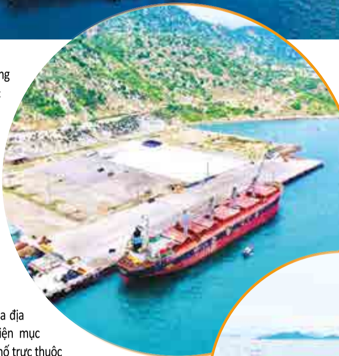
● Cảng biển tổng hợp Cà Ná.