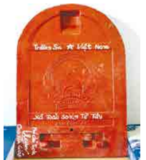
● Viên ngói in hình Quốc huy nước Cộng hòa xã hội chủ nghĩa Việt Nam dùng để lợp những công trình trên đảo Song Tử Tây, lưu giữ và khẳng định chủ quyền biển, đảo Việt Nam.

Nhìn vào những viên gạch đặt nền móng ấy, mỗi người con đất Việt lại thêm thấu hiểu và tri ân công lao của bao thế hệ đi trước - những