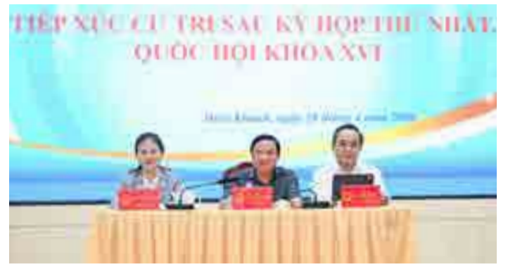
● Các đại biểu Quốc hội tỉnh tại buổi tiếp xúc cử tri 6 xã khu vực Diên Khánh.