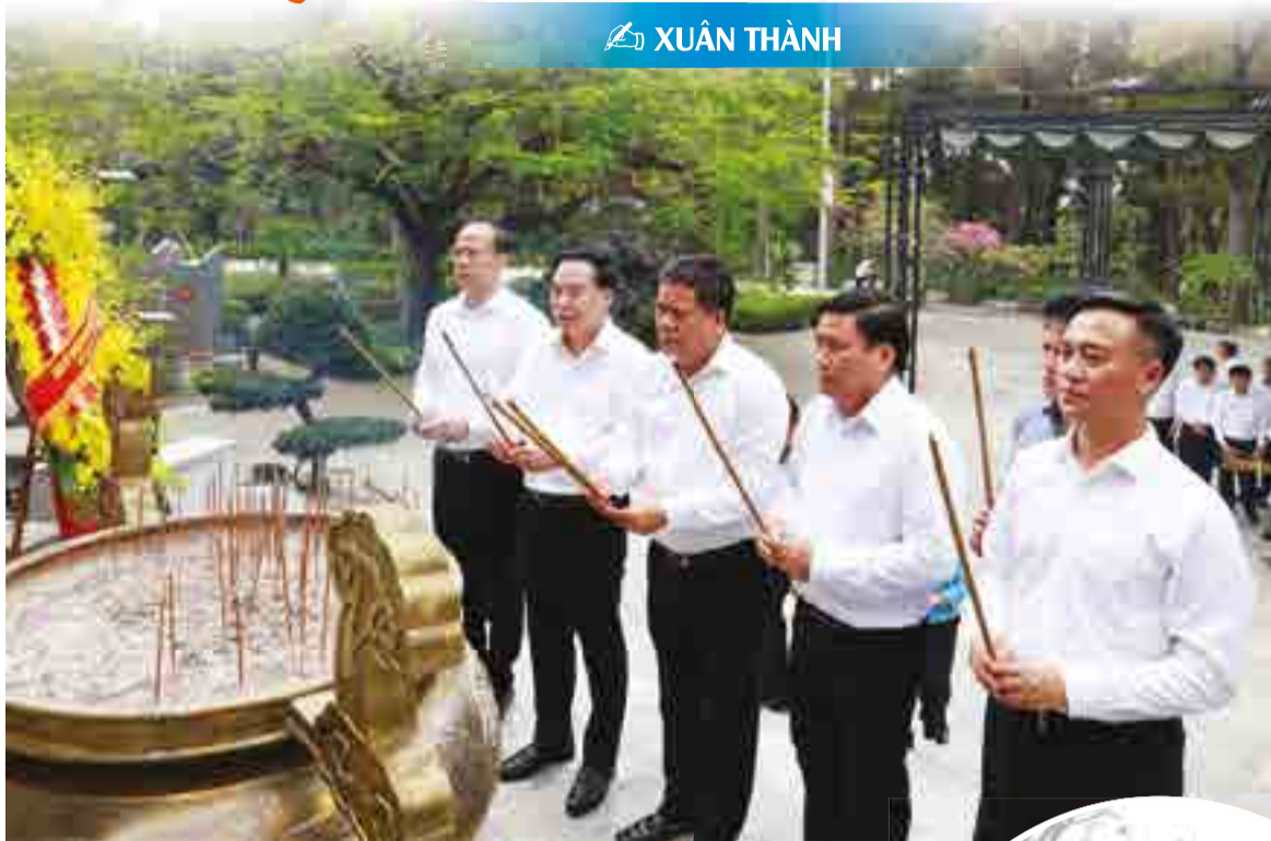
● Lãnh đạo tỉnh dâng hương ở Nghĩa trang Liệt sĩ quốc gia Trường Sơn.

giữa sự sống và cái chết mỏng manh chỉ qua một làn đạn.