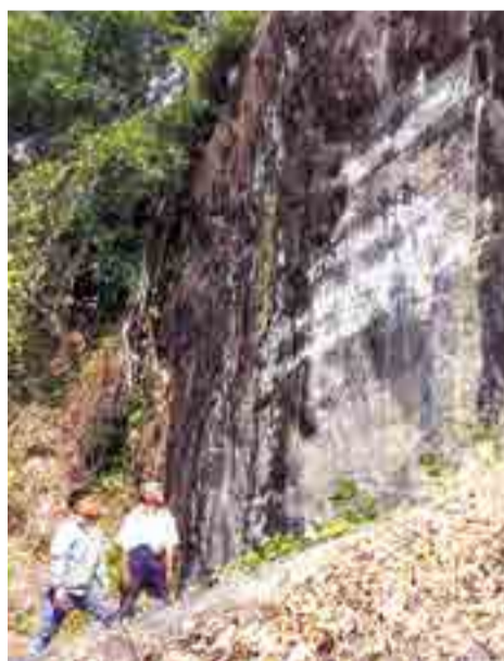
● Bẫy đá Pinăng Tắc - nơi khởi nguồn cao trào kháng chiến chống Mỹ bằng vũ khí thô sơ của đồng bào Raglai xã Bắc Ái Tây.

(nay là xã Bắc Ái Tây), tận dụng địa thế hiểm trở, một bên là vách đá dựng đứng, một bên là dòng sông chảy xiết, ở giữa là một con đường mòn độc đạo để ra vào Phước Bình, đồng chí Pinăng Tắc đã chỉ huy lực lượng dân quân du kích xã bố trí một trận địa phục kích, cho đặt 17 bẫy đá liên hoàn, mỗi chiếc cách nhau chừng 20m, trên đoạn đường dài khoảng 500m, phía dưới cho cắm chông, xoa bẫy; dân quân du kích