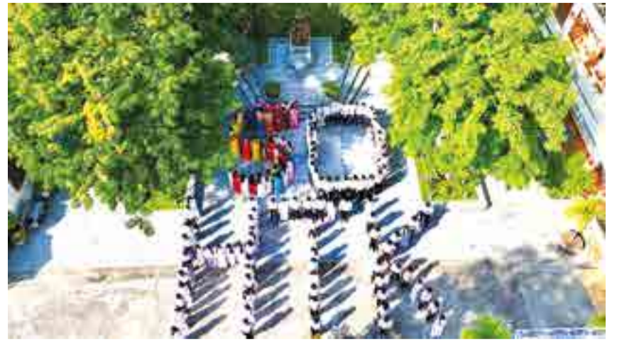
● Ban giám hiệu, giáo viên và học sinh Trường THPT Huỳnh Thúc Kháng xếp hình kỷ niệm 50 năm ngày thành lập trước công trình Tượng đài cụ Huỳnh Thúc Kháng.

Từ năm 2009 đến nay, HS của trường đã đạt 252 giải HS giỏi cấp tỉnh và quốc gia. Hoạt động nghiên cứu, sáng tạo khoa học - kỹ thuật cũng đạt nhiều kết quả tích cực với 16 giải cấp tỉnh và có dự án dự thi cấp quốc gia đạt giải tư. Tỷ lệ tốt nghiệp THPT luôn duy trì ở mức cao, nhiều năm đạt 100%. Tỷ lệ HS trúng tuyển đại học hằng năm hơn 90%, trong đó có nhiều em là thủ khoa của tỉnh. Những con số này không chỉ phản ánh chất lượng dạy và học, mà còn minh chứng cho sự