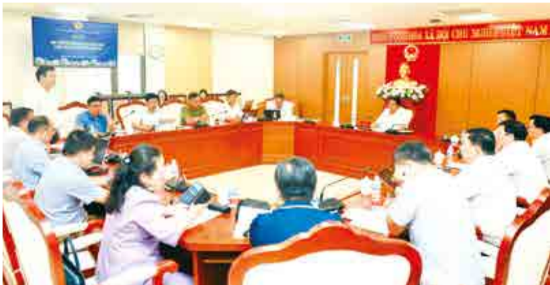
● Quang cảnh cuộc họp.

Chiều 28-4, đồng chí Nguyễn Long Biên - Ủy viên Ban Thường vụ Tỉnh ủy, Phó Chủ tịch Thường trực UBND tỉnh chủ trì cuộc họp nghe báo cáo tiến độ thực hiện kế hoạch triển khai Chiến lược phát triển du lịch tỉnh giai đoạn 2026 - 2030, định hướng đến năm 2045. Tham dự có các thành viên Ban Chỉ đạo Phát triển du lịch tỉnh.