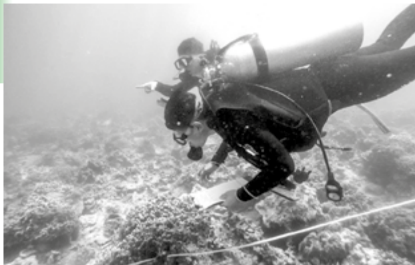
● Thợ lặn thu thập dữ liệu đáy biển ở Hòn Mun (vịnh Nha Trang).

Điển hình như tại Rạn Trào (xã Vạn Hưng) - nơi có hệ động, thực vật phong phú, đa dạng và độ phủ san hô khá cao, năm 2008, Khu bảo vệ hệ sinh thái biển Rạn Trào được thành lập; đến năm 2023 được giao cho Tổ cộng đồng bảo vệ nguồn lợi thủy sản xã Vạn Hưng quản lý. Hiện nay, rạn san hô, cỏ biển tại Rạn Trào phát triển rất tốt, mật độ dày. Khu vực này có nhiều loài