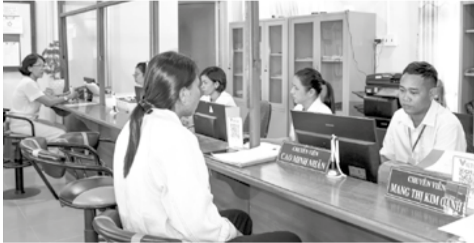
● Người dân đến làm thủ tục hành chính tại Trung tâm Phục vụ hành chính công xã Cam Hiệp.