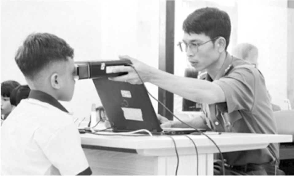
● Cán bộ Công an xã Ninh Phước thu nhận dữ liệu sinh trắc học, cấp căn cước công dân cho học sinh trên địa bàn.

Đều đặn lúc 18 giờ mỗi ngày, đèn trên sân trụ sở Công an xã Ninh Phước bật sáng, báo hiệu ca làm việc ngoài giờ của các tổ công tác bắt đầu. Sân trụ sở Công an xã dần đông lên bởi những phụ huynh vừa tan ca, vội vã đưa con em đến làm căn cước công dân và đăng ký tài khoản định danh điện tử mức 2. Người ngồi chờ đến lượt, người tranh thủ hoàn thiện giấy tờ; cán bộ công an đi lại hướng dẫn, tiếp nhận hồ sơ... không khí khẩn trương nhưng vẫn nề nếp, trật tự.