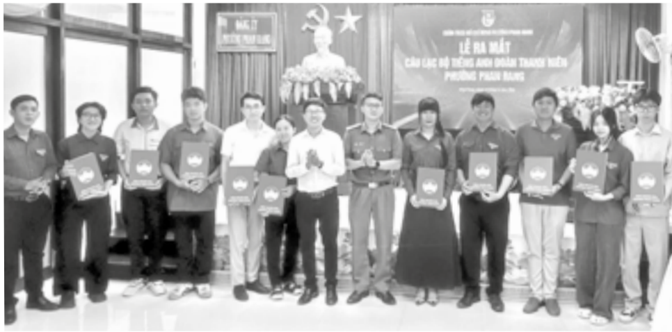
● Đoàn phường Phan Rang ra mắt câu lạc bộ tiếng Anh.

Thời gian qua, phong trào học tập, rèn luyện tiếng Anh trong các bạn trẻ ngày càng sôi nổi, lan tỏa. Cùng với việc duy trì các sân chơi tiếng Anh cho đoàn viên, thanh niên (ĐV-TN), tổ chức đoàn đã triển khai việc thành lập các câu lạc bộ (CLB) tiếng Anh tại các xã, phường, đặc khu để tạo môi trường thuận lợi cho các bạn trẻ nâng cao năng lực ngoại ngữ.