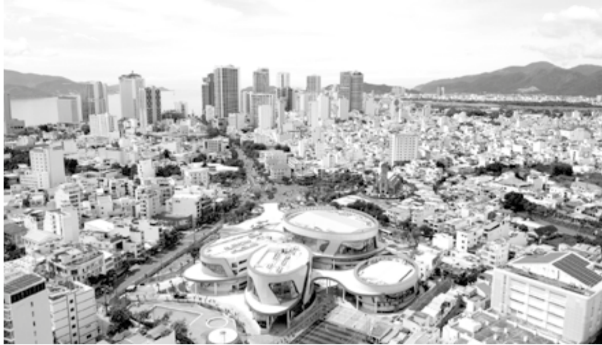
● Một góc đô thị khu vực Nha Trang với điểm nhấn là Cung Văn hóa thiếu nhi tỉnh.

Cụ thể, tiêu chí I về vai trò, vị trí và điều kiện phát triển kinh tế - xã hội gồm 6 tiêu chuẩn. Đến nay, Khánh Hòa đã đạt 1 tiêu chuẩn nhờ có Khu Kinh tế Vân Phong. Còn lại 5 tiêu chuẩn chưa đạt, gồm: Tổ chức từ 2 sự kiện quốc tế cấp khu vực trở lên mỗi năm (bình quân 3 năm gần nhất); thu nhập bình quân đầu người trên năm cao hơn thu nhập bình quân đầu người trên năm của cả nước trong 3 năm gần nhất; tốc