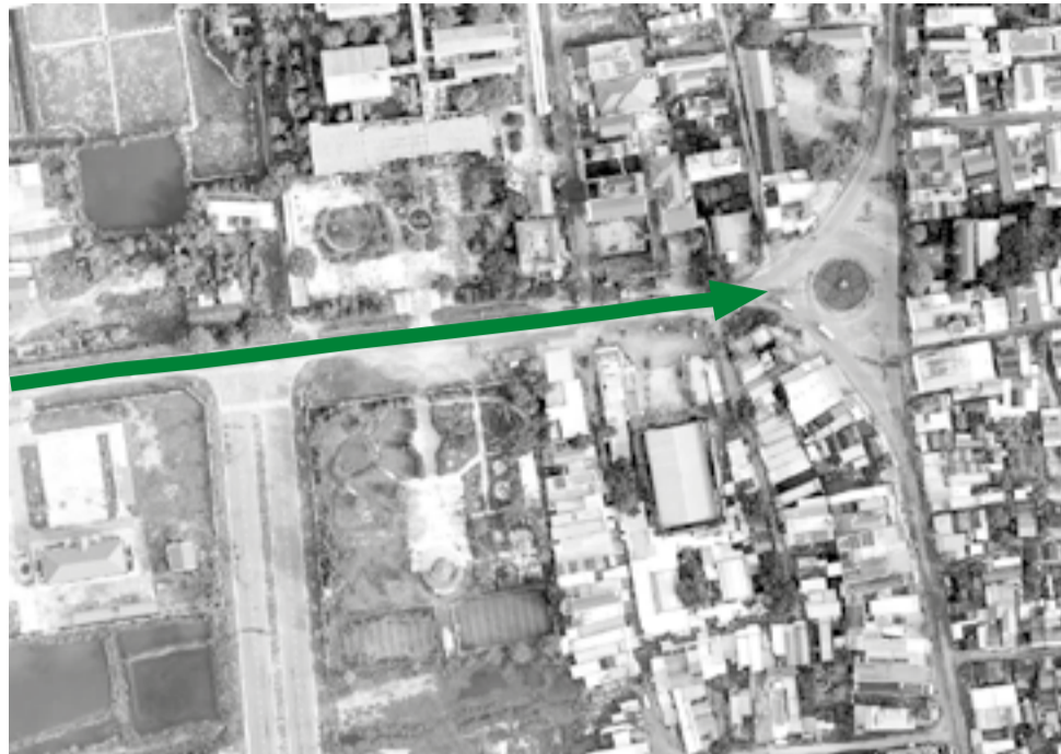
● Tỉnh lộ 1A nối với vòng xoay Ninh Diêm.