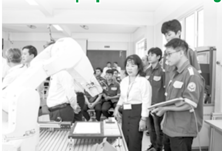
● Đào tạo công nghệ tự động hóa tại Trường Cao đẳng Kỹ thuật Công nghệ Nha Trang.

Theo báo cáo của Sở Nội vụ, qua khảo sát, nhu cầu lao động trong các ngành công nghiệp, năng lượng trên địa bàn tỉnh đang tăng nhanh, đặc biệt ở các lĩnh vực cơ khí, điện - điện tử, tự động hóa và năng lượng. Trên cơ sở đó, UBND tỉnh yêu cầu các sở, ngành, địa phương và doanh nghiệp tăng cường phối hợp, triển khai đồng