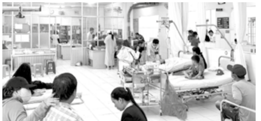
● Đội ngũ y, bác sĩ Khoa Cấp cứu khám cho các bệnh nhân trong những ngày nghỉ lễ.

Theo số liệu của Bệnh viện Đa khoa Khánh Hòa, trong 3 ngày nghỉ lễ Giỗ Tổ Hùng Vương (từ ngày 25 đến 27-4), bệnh viện đã tiếp nhận khám, điều trị cho hơn 700 trường hợp, trong đó có hơn 350 ca điều trị nội trú.