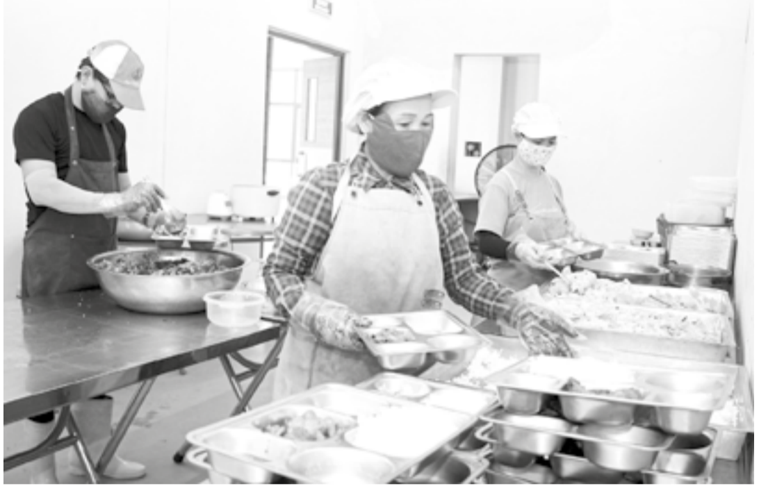
● Chuẩn bị các suất ăn ca cho công nhân tại Công ty Cổ phần Sản xuất và Đầu tư Hoàng Thành Đô Lương.