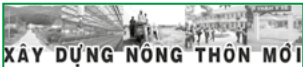
XÂY DỰNG NÔNG THÔN MỚI