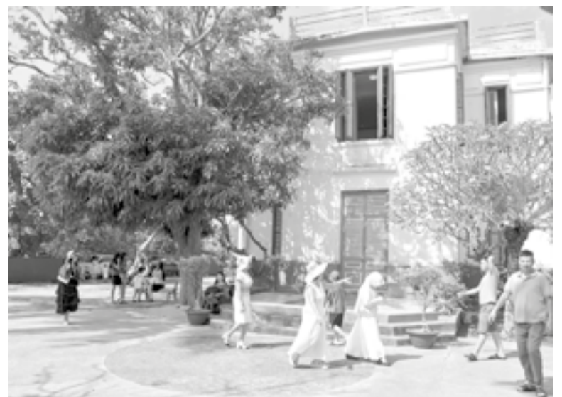
● Nhiều khách đến tham quan di tích Biệt thự Cầu Đá.