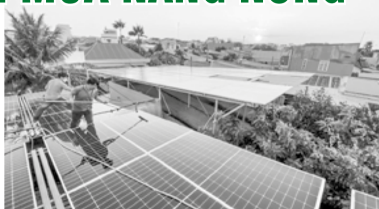
● Người dân phường Phan Rang đầu tư, vận hành hệ thống điện mặt trời mái nhà, góp phần giảm chi phí điện và giảm áp lực cho lưới điện trong giờ cao điểm.

Một điểm đáng chú ý là việc ứng dụng phân tích dữ liệu tiêu thụ điện. Thay vì khuyến nghị chung, ngành điện có thể đưa ra tư vấn cụ thể hơn cho từng nhóm khách hàng, góp phần