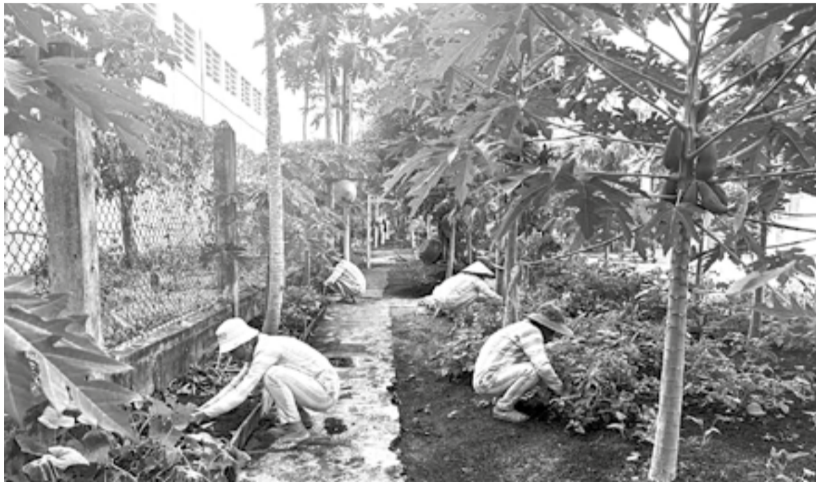
● Các phạm nhân tham gia lao động, cải tạo tại Trại tạm giam số 1.