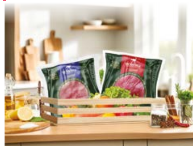
● Sản phẩm thịt đà điểu VietOstrich.

Đặc biệt, khô đà điểu với 3 hương vị đặc trưng (Tứ Xuyên cay nồng, thảo mộc thanh nhẹ, xông khói đậm đà) vừa là mồi nhậu hấp dẫn cho buổi trò chuyện lai rai, vừa là món quà biếu tặng thiết thực và ý nghĩa trong dịp lễ.