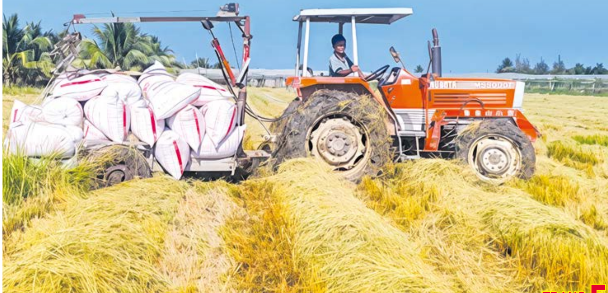
• Dàn gắp lúa giúp giảm bớt sức lao động của con người.

BÁO VÀ PHÁT THANH, TRUYỀN HÌNH KHÁNH HÒA