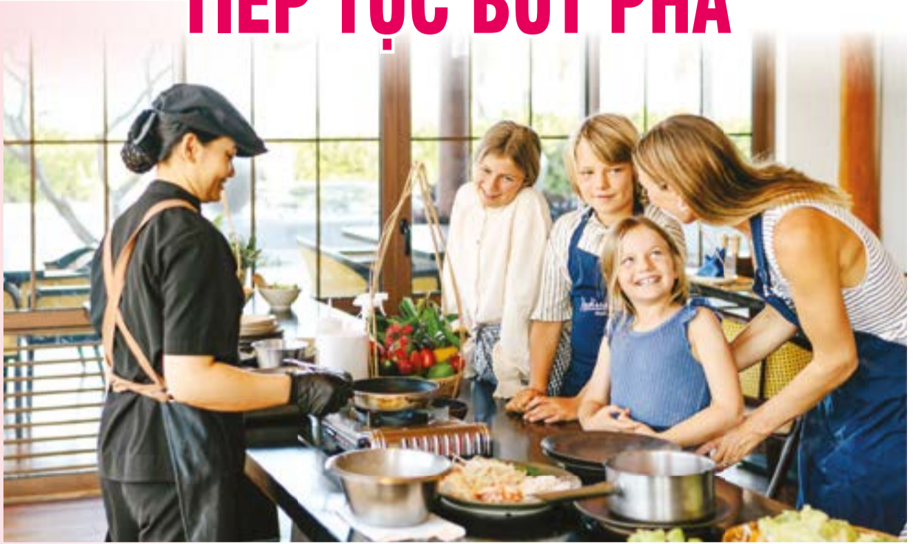
● Khách quốc tế khám phá ẩm thực Việt Nam tại Radisson Blu Resort Cam Ranh.

Trong bối cảnh biến động địa chính trị toàn cầu và áp lực chi phí nhiên liệu tăng cao, du lịch Khánh Hòa vẫn ghi nhận mức tăng trưởng khách quốc tế ấn tượng trong 4 tháng đầu năm 2026, vượt xa tốc độ tăng trưởng chung của cả nước. Đây là kết quả của những nỗ lực đa dạng hóa sản phẩm du lịch, đẩy mạnh xúc tiến, quảng bá và mở rộng kết nối hàng không quốc tế từ cơ quan quản lý lẫn cộng đồng doanh nghiệp trên địa bàn tỉnh.