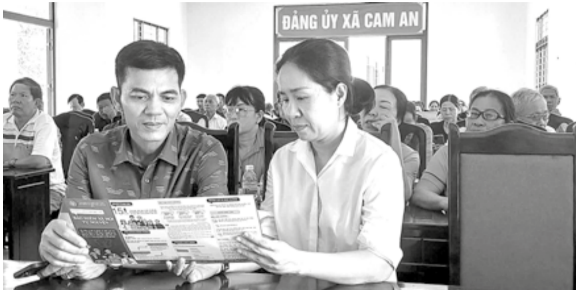
● Tuyên truyền chính sách bảo hiểm xã hội tự nguyện cho hội viên nông dân xã Cam An.

Những năm qua, công tác phối hợp giữa Bảo hiểm xã hội (BHXH) tỉnh và Hội Nông dân (HND) tỉnh đạt nhiều kết quả tích cực, góp phần bảo đảm an sinh xã hội, giúp nông dân được hưởng lương hưu khi về già và chăm sóc y tế thông qua thẻ bảo hiểm y tế (BHYT).