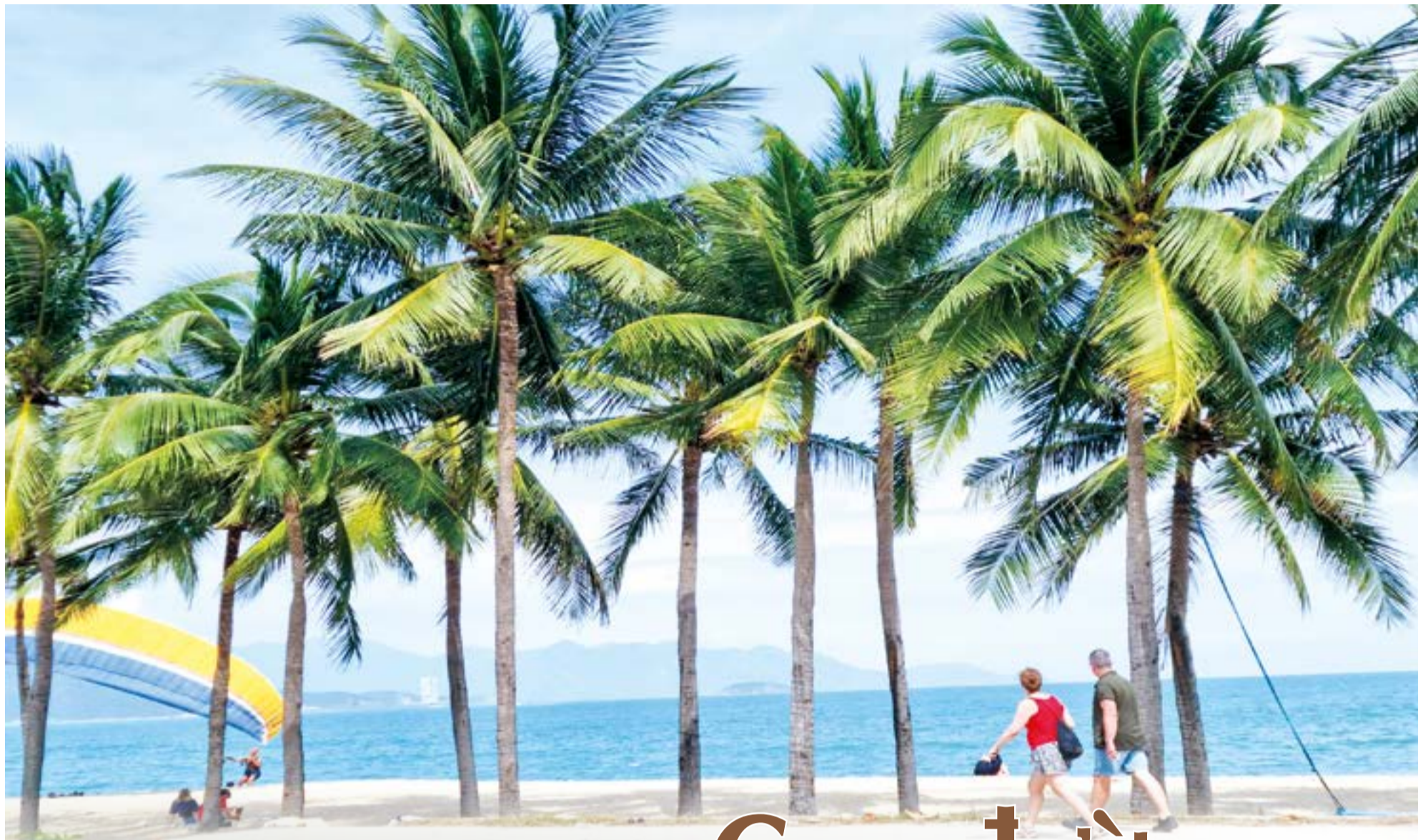
● Ảnh: G.C