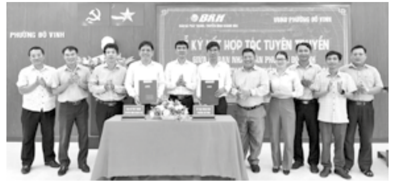
● Lãnh đạo hai bên ký kết hợp tác.

Chiều 24-4, UBND phường Đô Vinh tổ chức lễ ký kết biên bản ghi nhớ phối hợp tuyên truyền với Báo và Phát thanh, Truyền hình Khánh Hòa nhằm tăng cường công tác thông tin toàn diện các nhiệm vụ chính trị, kinh tế - xã hội trên địa bàn.