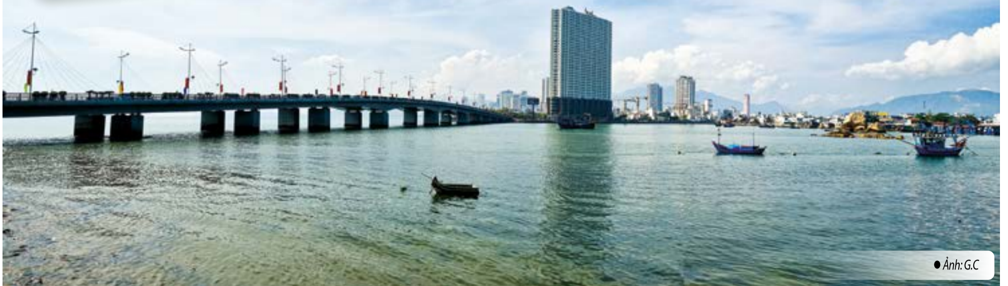
● Ảnh: G.C