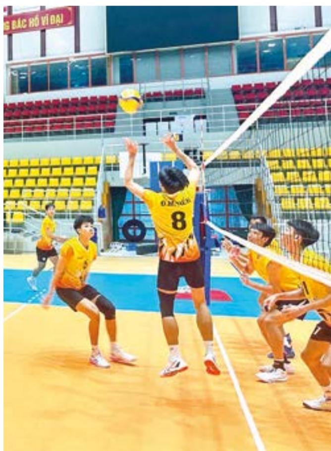
● Đội bóng Sanest Khánh Hòa tập luyện cho các trận đấu giai đoạn lượt đi mùa giải năm nay tại Nhà Thi đấu Đồng Anh (Hà Nội).

Giai đoạn lượt đi Giải bóng chuyền vô địch quốc gia các câu lạc bộ Cúp Phân bón Cà Mau 2026 bước vào lượt trận cuối với những diễn biến đầy kịch tính trên bảng xếp hạng, топ 4 ứng cử viên nặng ký tham dự Cúp Hùng Vương dần lộ diện. Còn đội Sanest Khánh Hòa đã có chiến thắng đầu tiên của mùa giải với tỷ số 3-0 khi gặp đối thủ được đánh giá cao hơn là TP. Hồ Chí Minh.