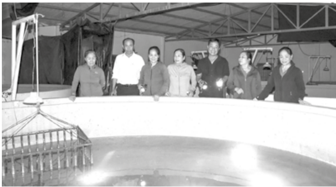
● Nông dân xã Suối Dầu tham quan mô hình nuôi cá chình hoa trong bể xi măng tại Công ty TNHH Nuôi trồng thủy sản Vạn Xuân.

Thời gian qua, Trung tâm Khuyến nông Quốc gia phối hợp với Viện Nghiên cứu thủy sản và doanh nghiệp hỗ trợ nông dân xã Suối Dầu triển khai mô hình nuôi cá chình hoa trong bể xi măng. Mặc dù vốn đầu tư lớn, thời gian nuôi dài, quy trình kỹ thuật tương đối chặt chẽ, nhưng mô hình mang giá trị kinh tế cao nên đang mở ra hướng sinh kế mới cho nông dân nuôi trồng thủy sản nước ngọt.