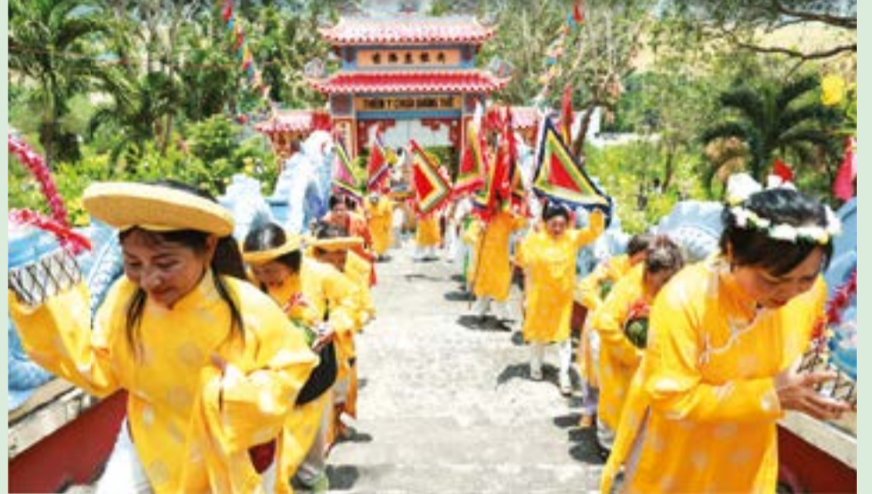
● Đoàn khách hành hương về tham dự lễ hội Am Chúa.