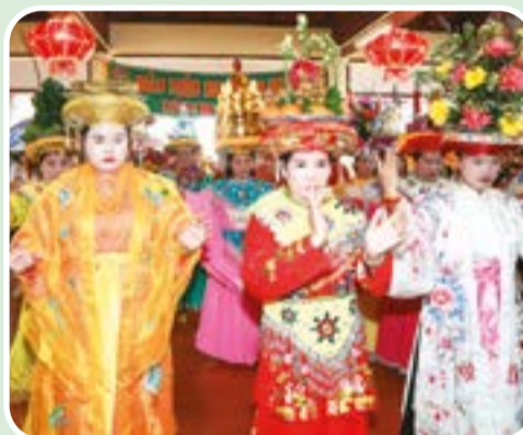
● Biểu diễn múa bóng tại lễ hội.