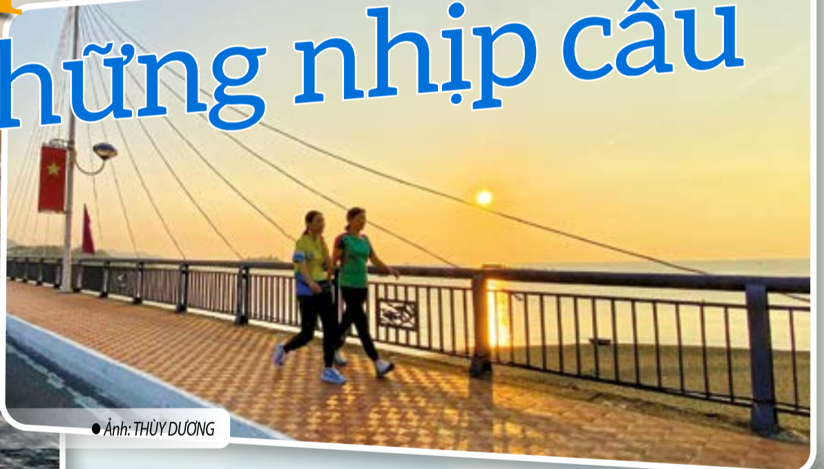
● Ảnh: THÙY DƯƠNG