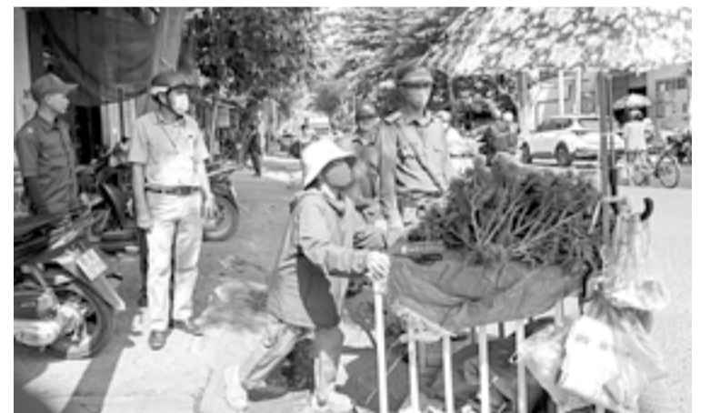
● Lực lượng chức năng phường Phan Rang nhắc nhở các trường hợp buôn bán không đúng nơi quy định.

Thời gian qua, Công an phường Phan Rang phối hợp với Trung tâm Dịch vụ, sự nghiệp công phường ra quân kiểm tra, xử lý các hành vi vi phạm trật tự công cộng, trật tự đô thị trên địa bàn.