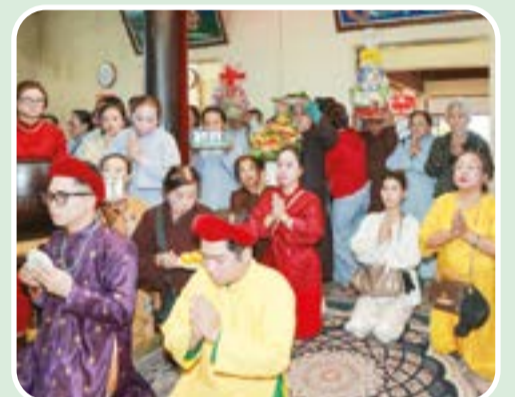
● Một đoàn hành hương thành kính lễ Mẫu.