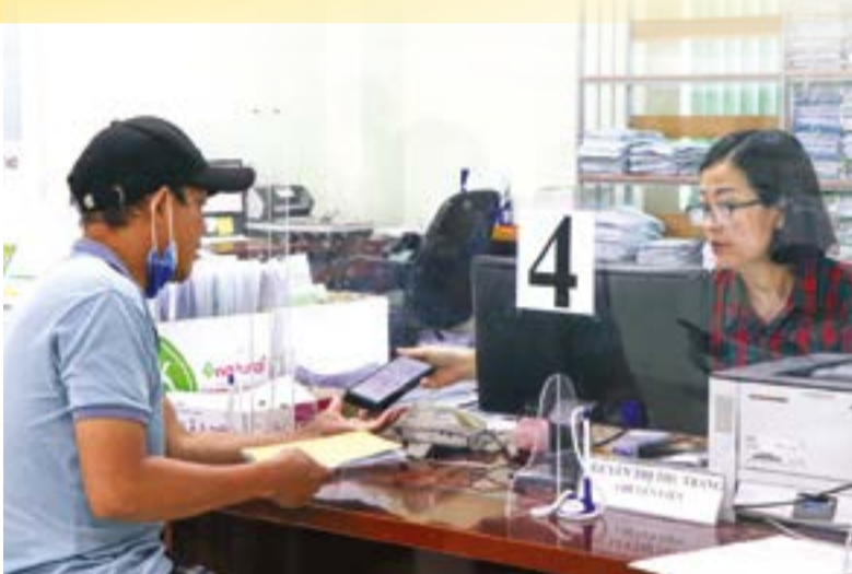
● Người dân thực hiện thủ tục tại bộ phận một cửa của Bảo hiểm xã hội tỉnh.

Trong quý I, tình trạng nợ bảo hiểm xã hội (BHXH), bảo hiểm y tế (BHYT), bảo hiểm thất nghiệp (BHTN) trên địa bàn tỉnh tiếp tục là vấn đề đáng lo ngại. Mặc dù cơ quan chức năng đã triển khai nhiều biện pháp, song số nợ vẫn ở mức cao, kéo dài, ảnh hưởng trực tiếp đến quyền lợi của người lao động (NLĐ) và tính bền vững của hệ thống an sinh xã hội.