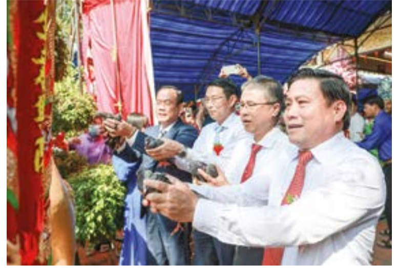
● Đồng chí Lâm Đông và đồng chí Trần Hòa Nam thực hiện nghi thức thả chim bồ câu trong lễ hội Am Chúa.

Sáng 17-4 (nhằm ngày 1-3 âm lịch), tại Khu di tích quốc gia Am Chúa, tọa lạc trên núi Đại An, UBND xã Diên Điền tổ chức khai mạc Lễ hội Am Chúa năm 2026. Đến dự có các đồng chí: Lâm Đông - Phó Bí thư Tỉnh ủy, Chủ tịch HĐND tỉnh; Trần Hòa Nam - Ủy viên Ban Thường vụ Tỉnh ủy, Phó Chủ tịch UBND tỉnh; lãnh đạo các sở, ban, ngành, địa phương và đông đảo người dân, khách hành hương.