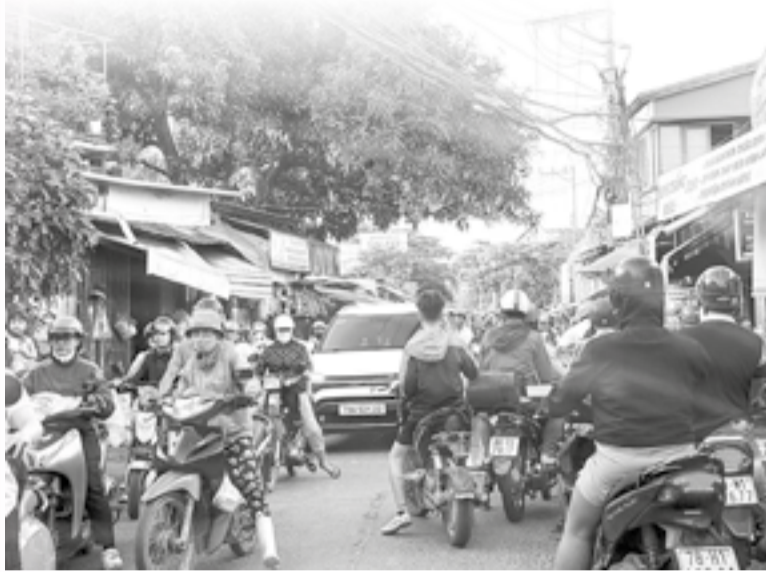
● Đường Trung tâm xã đoạn qua chợ Ga thường xuyên kẹt xe do hai bên đường bị lấn chiếm để buôn bán như chợ tự phát.

Thời gian qua, trên địa bàn các phường khu vực Nha Trang xảy ra tình trạng nhiều cửa hàng kinh doanh, buôn bán lấn chiếm vỉa hè, gây mất mỹ quan đô thị làm ảnh hưởng đến trật tự an toàn giao thông. Chính vì vậy, Phòng Cảnh sát giao thông Công an tỉnh đã ban hành Kế hoạch ra quân lập lại trật tự đô thị, trật tự an toàn giao thông trên địa bàn các phường: Nha Trang, Bắc Nha Trang, Nam Nha Trang, Tây Nha Trang.