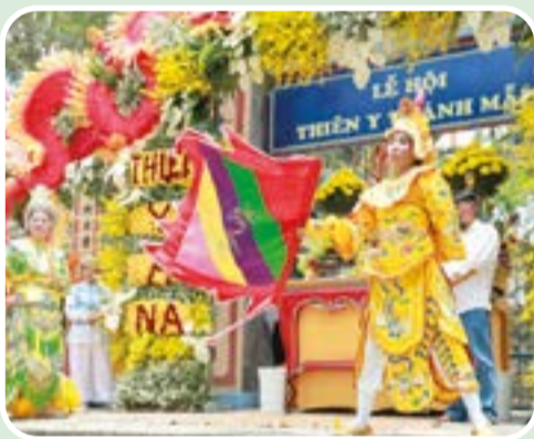
● Màn hát múa ca ngợi công đức Thiên Y A Na Thánh Mẫu.