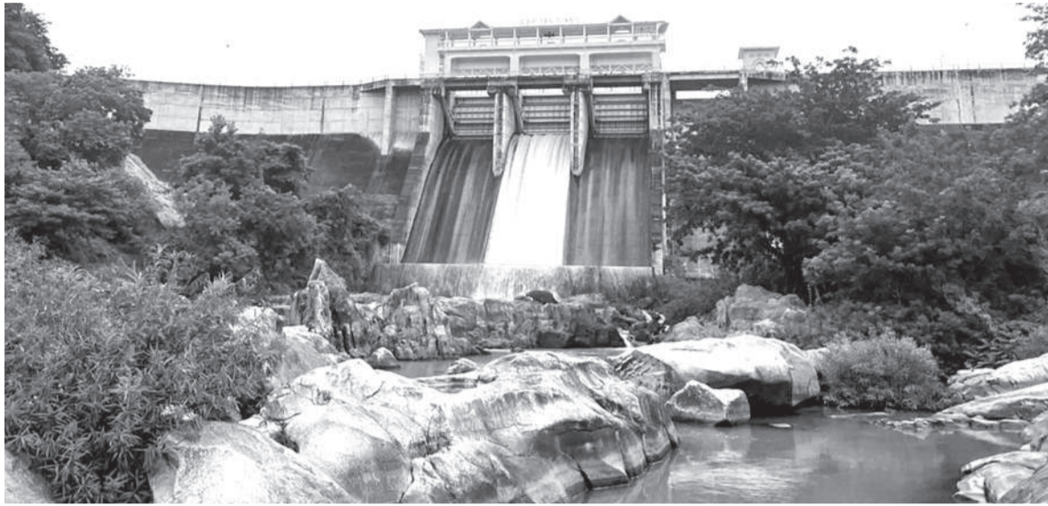
● Hồ Tân Giang vận hành xả nước, tích hợp hệ thống quan trắc phục vụ điều tiết hiệu quả.

trong vận hành hệ thống thủy lợi. Trong khi diện tích gieo trồng vụ đông xuân chưa đạt kế hoạch (97,91%, giảm hơn 481ha), công ty vẫn đảm bảo cấp nước cho gần 248ha phát sinh ngoài kế hoạch. "Đây là kết quả của cách điều hành linh hoạt. Chúng tôi không áp dụng cứng nhắc theo kế hoạch ban đầu mà luôn điều chỉnh theo nhu cầu thực tế tại từng khu vực", ông Xung nói.