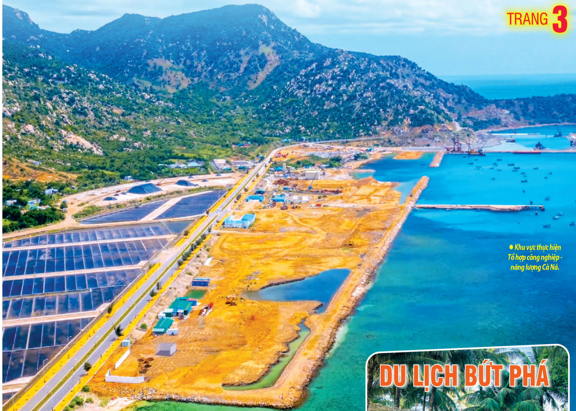
● Khu vực thực hiện Tổ hợp công nghiệp - năng lượng Cà Ná.