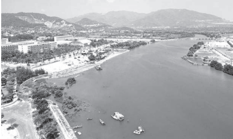
● Khu vực triển khai dự án.

Dự án Chính trị hạ lưu Sông Tắc (giai đoạn 2) sẽ tác động đến hơn 50 hộ dân, chủ yếu là các hộ nuôi trồng thủy sản. Công tác bồi thường, hỗ trợ và chuyển đổi sinh kế đang được triển khai theo quy định nhằm bảo đảm ổn định đời sống cho người dân.