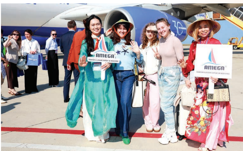
● Doanh nghiệp lữ hành chào đón khách quốc tế đến Khánh Hòa.

Trên địa bàn tỉnh hiện nay vẫn lưu giữ nhiều bia đá cổ, đặc biệt là những bia đá của văn hóa Champa. Đây chính là những cổ vật vô giá, phần nào giúp hậu thế giải mã những thăng trầm lịch sử, hiểu biết hơn quá trình phát triển văn hóa, con người xứ Trầm Hương.