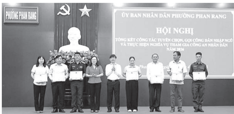
● Lãnh đạo phường Phan Rang trao giấy khen cho các tập thể xuất sắc.

Sáng 10-4, Hội đồng Nghĩa vụ Quân sự phường Phan Rang tổ chức hội nghị tổng kết công tác tuyển chọn, gọi công dân nhập ngũ và thực hiện nghĩa vụ tham gia Công an nhân dân năm 2026.