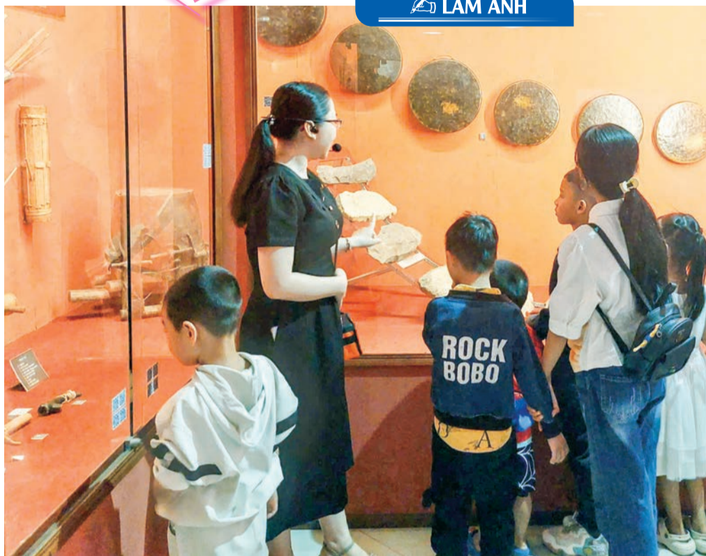
● Trẻ khuyết tật thuộc Trung tâm Hỗ trợ phát triển giáo dục hòa nhập tỉnh tham quan Bảo tàng tỉnh (cơ sở 2).