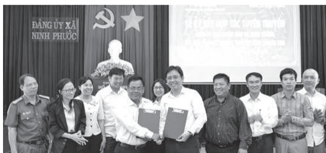
● Đại diện hai bên ký kết hợp tác tuyên truyền.

Theo nội dung ký kết, hai bên thống nhất tuyên truyền việc