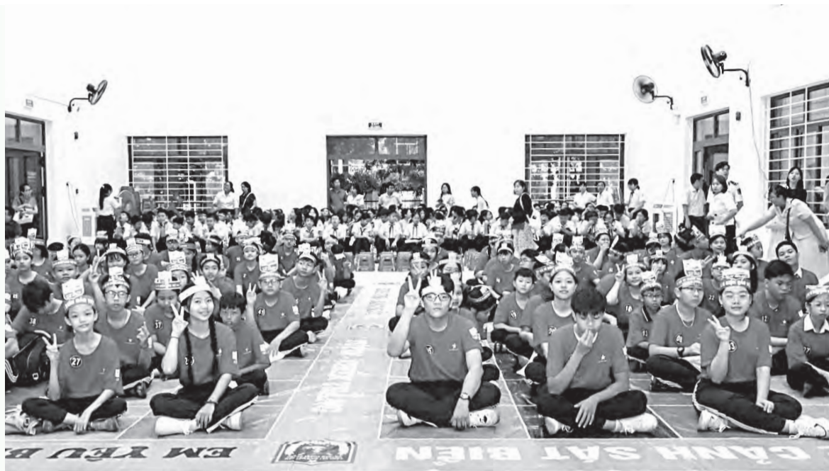
● Học sinh tỉnh Khánh Hòa tham gia cuộc thi.

Không chỉ là sân chơi bổ ích, cuộc thi “Em yêu biển, đảo quê hương” còn là kênh giáo dục trực quan, sinh động, góp phần bồi đắp tình yêu Tổ quốc cho thế hệ trẻ. Thực tiễn triển khai thí điểm vòng chung kết khu vực của cuộc thi do Bộ Tư lệnh Vùng Cảnh sát biển 3 tổ chức đã cho thấy nhiều điểm mới, cách làm sáng tạo, đồng thời đặt ra yêu cầu tiếp tục hoàn thiện để nâng cao chất lượng cuộc thi trong thời gian tới.