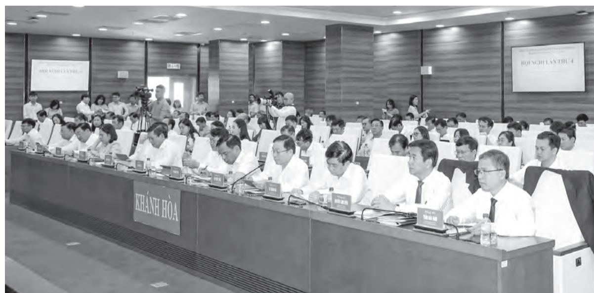
● Quang cảnh hội nghị.