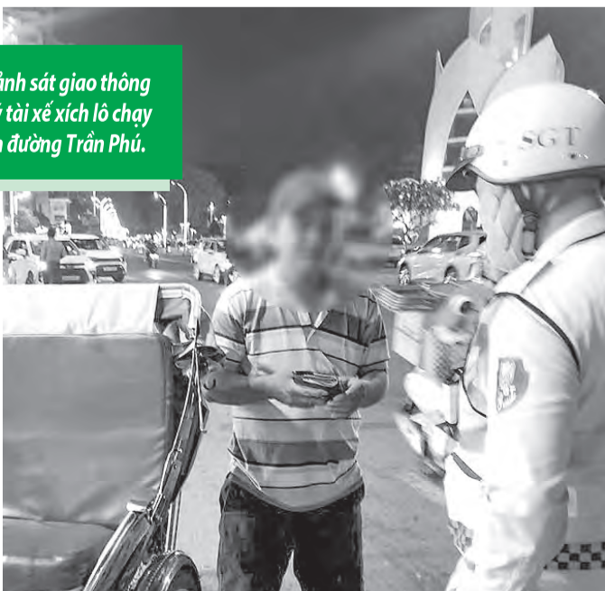
● Cảnh sát giao thông xử lý tài xế xích lô chạy trên đường Trần Phú.