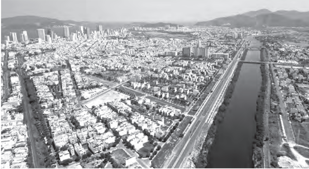
● Đường vành đai kết nối nút giao Ngọc Hội nằm trong danh sách các dự án được áp dụng cơ chế tháo gỡ khó khăn, vướng mắc.

Nhằm giải quyết những khó khăn, vướng mắc của các dự án đầu tư theo hình thức xây dựng - chuyển giao (BT), thời gian qua, tỉnh đã nỗ lực phân tích, đánh giá thực trạng, phân loại các nhóm vấn đề và đề xuất Trung ương xem xét, ban hành các cơ chế, chính sách đặc thù để xử lý dứt điểm các “điểm nghẽn” từ thực tiễn.