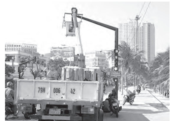
● Đơn vị thi công sửa chữa đèn tín hiệu giao thông trên đường Trần Phú.