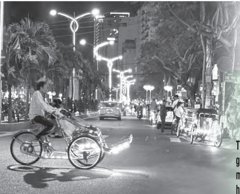
● Tài xế xích lô chạy trên đường Trần Phú.

(Tiếp theo Báo Khánh Hòa thứ Năm, ngày 9-4)