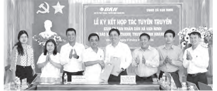
● Lãnh đạo Báo và Phát thanh, Truyền hình Khánh Hòa và UBND xã Vạn Ninh thực hiện nghi thức ký kết.