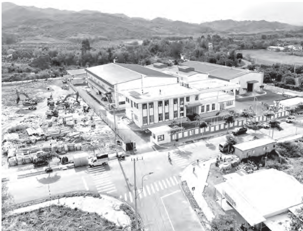
● Một nhà đầu tư thứ cấp đang hoàn thiện nhà xưởng tại Cụm Công nghiệp Sông Cầu.