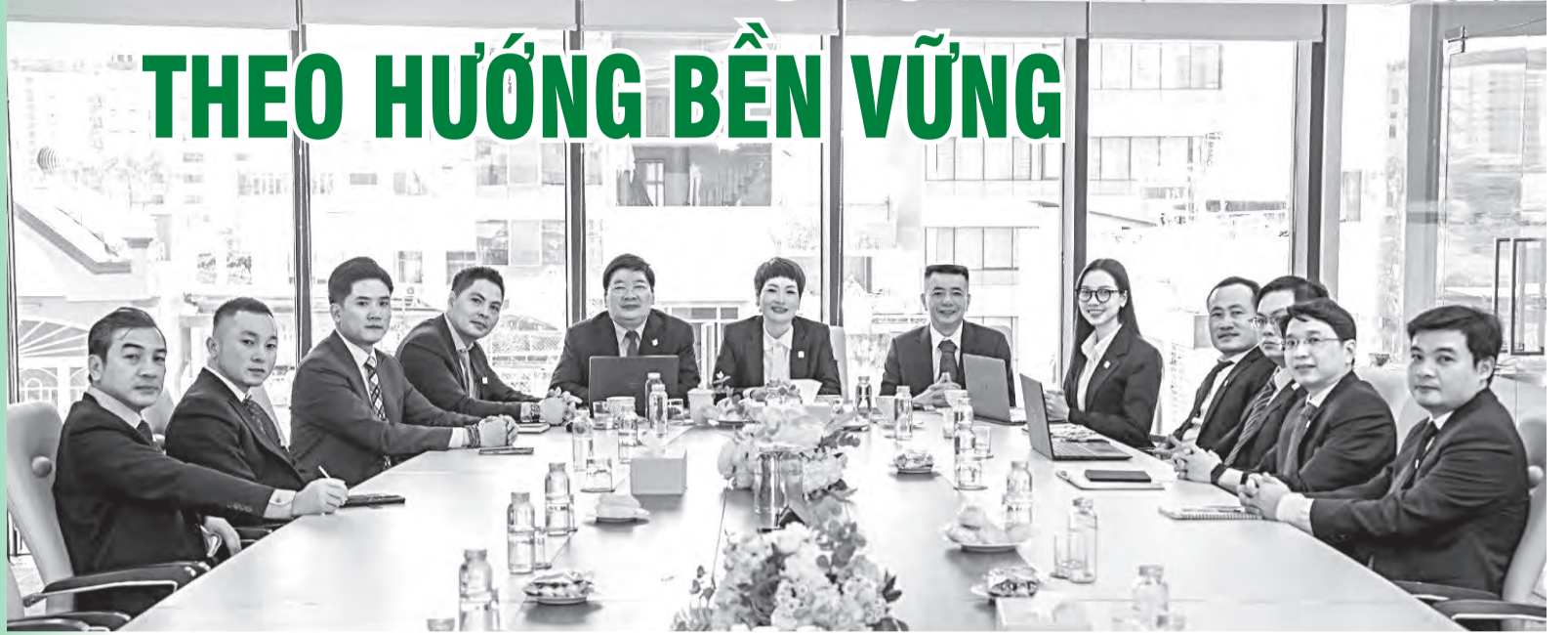
● KLC Group định hướng phát triển thủy sản gắn với giá trị bền vững.

Trong định hướng phát triển kinh tế biển, tỉnh Khánh Hòa đang đẩy mạnh tái cấu trúc ngành thủy hải sản theo hướng nâng cao giá trị gia tăng, tổ chức lại chuỗi sản xuất và tăng cường xuất khẩu chính ngạch. Sự tham gia của các doanh nghiệp có năng lực quản trị và tầm nhìn dài hạn được kỳ vọng sẽ góp phần hiện thực hóa mục tiêu này.