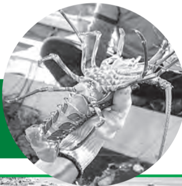
● Tôm hùm - sản phẩm chủ lực của KLC Seafood - được nuôi và thu mua tại các vùng trọng điểm, phục vụ xuất khẩu sang thị trường Trung Quốc.

triển thủy hải sản không chỉ dừng lại ở sản xuất, mà còn tập trung tổ chức lại toàn bộ chuỗi giá trị theo hướng chuẩn mực và bền vững. Khi chuỗi được kiểm soát tốt, sản phẩm không chỉ đáp ứng yêu cầu thị trường mà còn khẳng định uy tín và thương hiệu. Đây là nền tảng để thủy sản Khánh Hòa có thể phát triển ổn định và vươn xa hơn trên thị trường quốc tế".