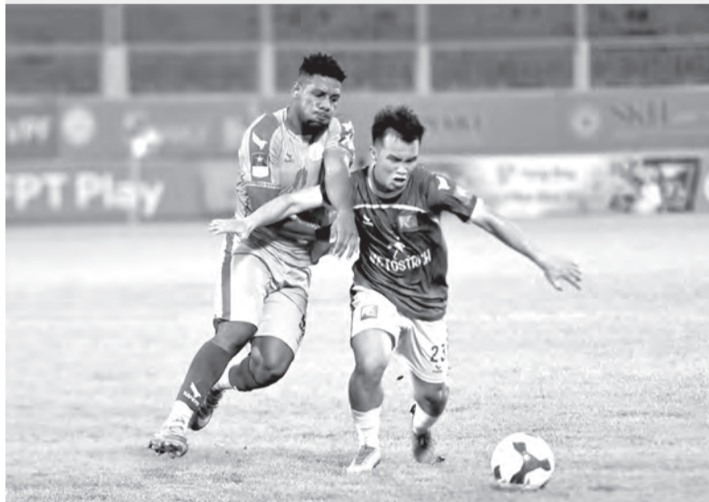
● Trận đấu giữa Khatoco Khánh Hòa và Quy Nhơn United giai đoạn lượt đi.

Vòng 14, Giải hạng Nhất quốc gia đang trở thành tâm điểm với loạt trận đấu được dự đoán hấp dẫn. Tâm điểm là cuộc "Derby miền Trung" giữa Quy Nhơn United và Khatoco Khánh Hòa, nơi đội bóng đất võ tham vọng trở lại đấu trường V.League 1. Trong khi đó, Trường Tươi Đồng Nai hướng đến việc củng cố vị thế dẫn đầu khi làm khách trên sân Đồng Tháp, qua đó khẳng định tham vọng thống trị cuộc đua thăng hạng.