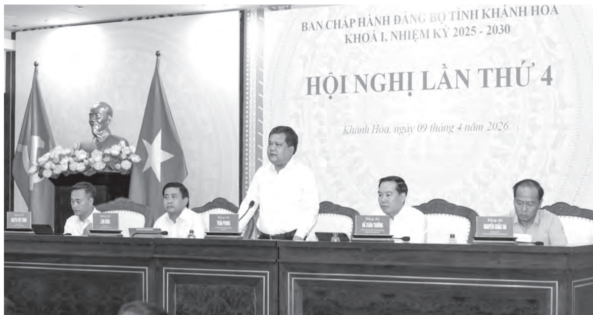
● Các đồng chí Thường trực Tỉnh ủy chủ trì hội nghị.

Đối với dự thảo Nghị quyết của BCH Đảng bộ tỉnh về phát triển du lịch Khánh Hòa trở thành ngành kinh tế mũi nhọn giai đoạn 2025 - 2030, tầm