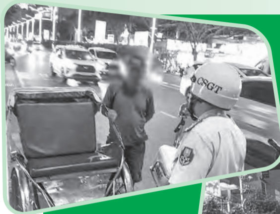
● Mặc dù liên tục bị xử lý nhưng tài xế xích lô vẫn ngang nhiên chạy vào đường cấm.

Thực tế, khung pháp lý về quản lý hoạt động vận chuyển bằng xe thô sơ, xe mô tô, xe gắn máy trên địa bàn tỉnh đã được ban hành. Cụ thể, ngày 13-1, UBND tỉnh ban hành quy định quản lý hoạt động xe thô sơ, trong đó xác định rõ điều kiện phương tiện, phạm vi hoạt động và trách nhiệm của các bên liên quan. Theo đó, Sở Xây dựng có vai trò chủ trì theo dõi, điều phối; Công an tỉnh trực tiếp kiểm tra, xử lý vi phạm; chính