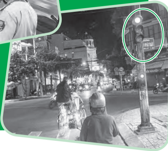
● Một xích lô vượt đèn đỏ trên đường Nguyễn Thị Minh Khai đoạn giao với đường Trần Nhật Duật.

quyền cơ sở chịu trách nhiệm quản lý địa bàn; các tổ chức, cá nhân kinh doanh phải tuân thủ điều kiện hoạt động, công khai thông tin và đảm bảo quyền lợi hành khách. Tuy nhiên, thực tế cho thấy, việc thực thi các quy định vẫn chưa hiệu quả và đặt ra yêu cầu cấp thiết siết chặt kỷ cương, làm rõ trách nhiệm ở từng khâu.