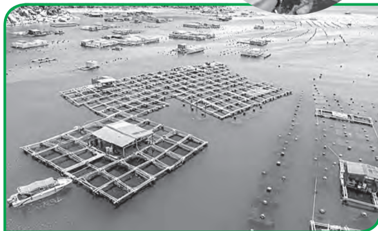
● Vùng nuôi liên kết của KLC Seafood có quy mô lớn tại miền Trung.

vùng nuôi, thu mua, kiểm soát chất lượng, sơ chế, chế biến đến logistics và xuất khẩu. Trong cấu trúc đó, các đơn vị như Công ty TNHH Thương mại - Dịch vụ - Sản xuất Phát Lợi không tồn tại độc lập, mà được tích hợp như những mắt xích chuyên môn hóa, góp phần hoàn thiện năng lực vận hành và tạo nền tảng cho chiến lược phát triển dài hạn của KLC Seafood.