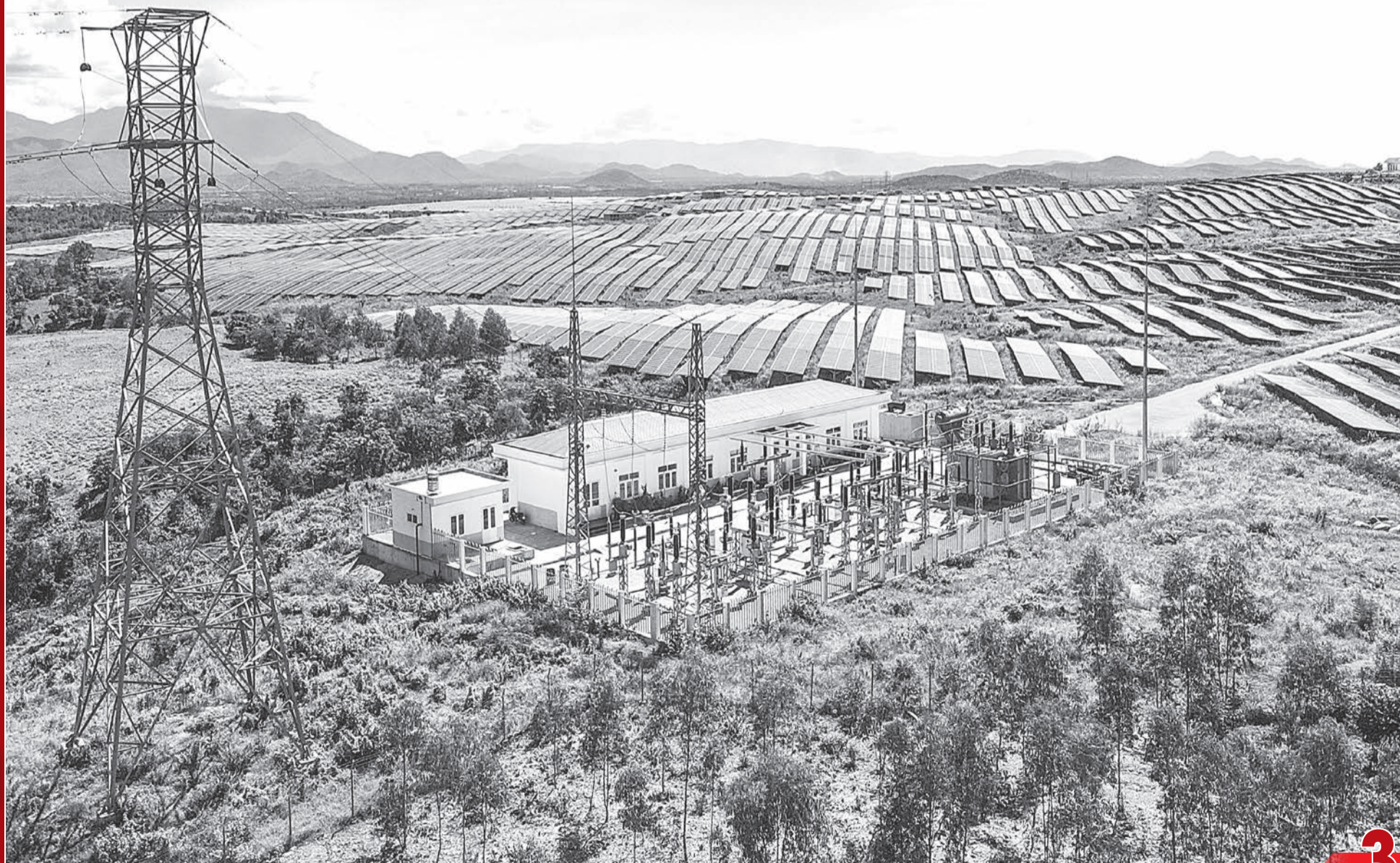
• Nhà máy Điện mặt trời Phước Minh.