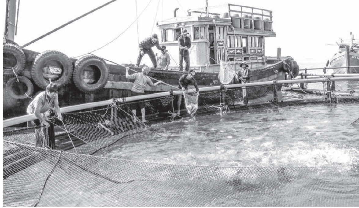
● Ngư dân nuôi biển công nghệ cao tại khu vực Hòn Nội thu hoạch cá thương phẩm.

Điển hình, tại khu vực Đầm Bấy, 5 hộ thả nuôi cá biển trong 10 lồng HDPE (mỗi lồng có thể tích 800m 3 ). Cá giống sau khi ương trong lồng gỗ truyền thống, đạt trọng lượng 50 đến 60g/con thì thả vào lồng HDPE. Trong vụ nuôi năm 2025, các hộ thu