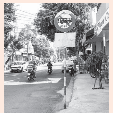
● Ảnh chụp ngày 8-4-2026.

Hiện nay, trên một số tuyến đường thuộc các phường: Nha Trang, Nam Nha Trang có một số biển báo giao thông bị bong tróc, không còn đầy đủ thông tin ghi trên biển báo, như: Biển báo giao thông tại gần nút giao đường Phước Long - Trường Sơn; đường Lê Hồng Phong - Trương Hán Siêu; đường Bửu Đóa - Lý Nam Đế (ảnh)... Rất mong cơ quan chức năng kiểm tra, làm mới các biển báo giao thông nói trên để phát huy tác dụng.