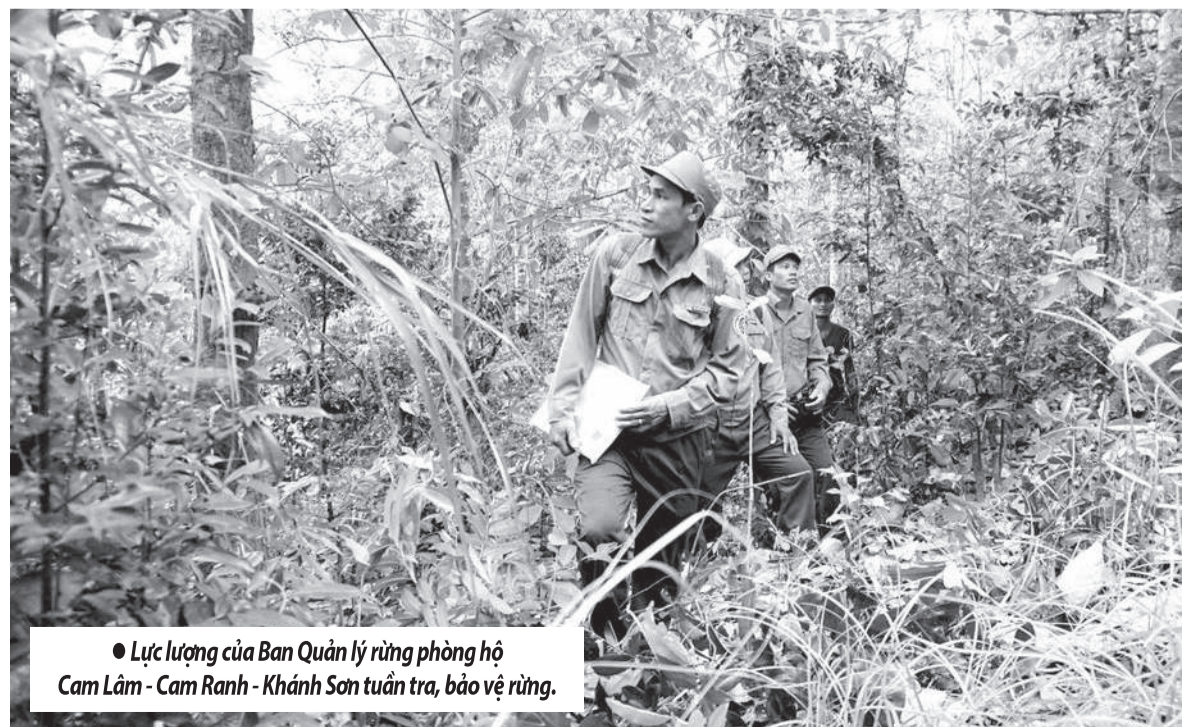
● Lực lượng của Ban Quản lý rừng phòng hộ Cam Lâm - Cam Ranh - Khánh Sơn tuần tra, bảo vệ rừng.

Khánh Hòa hiện có diện tích rừng và đất lâm nghiệp lớn trong khu vực, với tổng diện tích hơn 529.488ha, trong đó diện tích có rừng 403.709ha, tỷ lệ che phủ rừng đạt 47,19%. Diện tích rừng và đất lâm nghiệp chủ yếu do các ban quản lý rừng phòng hộ, đặc dụng, các công ty lâm nghiệp, UBND cấp xã, hộ gia đình, cá nhân quản lý. Trong 8 tháng cao điểm mùa khô năm nay, tổng diện tích rừng có nguy cơ cháy hơn 109.209ha, trong đó hơn 30.676ha rừng trồng và hơn 78.533ha rừng tự nhiên thuộc địa bàn 45 xã, phường.