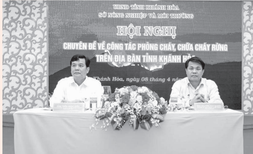
● Lãnh đạo Sở Nông nghiệp và Môi trường chủ trì hội nghị.

Do nắng nóng, khô hạn, hiện nay, nhiều diện tích rừng trên địa bàn tỉnh đứng trước nguy cơ cháy rất cao, thường xuyên ở cấp cảnh báo nguy hiểm, cực kỳ nguy hiểm. Để kịp thời triển khai công tác ứng phó, chiều 8-4, Sở Nông nghiệp và Môi trường tổ chức hội nghị chuyên đề về công tác phòng cháy, chữa cháy rừng (PCCCR). Tại hội nghị, các nguyên nhân dẫn đến nguy cơ cháy rừng đã được chỉ ra; những nhiệm vụ, giải pháp cấp bách trong PCCCR cũng đã được triển khai với phương châm phòng là chính, phòng từ sớm, từ xa và chữa cháy phải kịp thời.