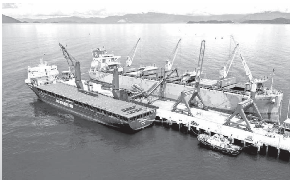
● Một góc Cảng tổng hợp Nam Vân Phong.