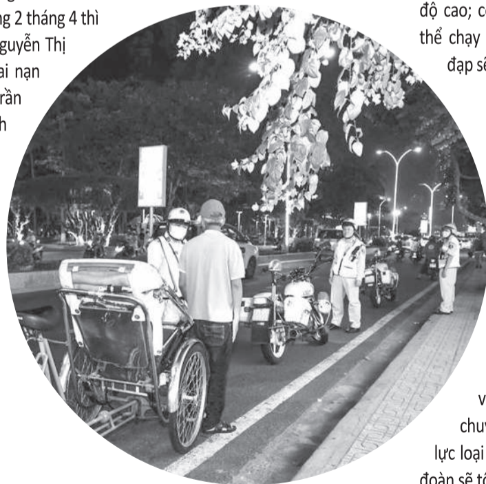
● Đội Cảnh sát giao thông đường bộ xử lý tài xế xích lô trên đường Trần Phú.

Nhằm nâng cao hiệu quả quản lý, không để xảy ra tai nạn, gây ùn tắc