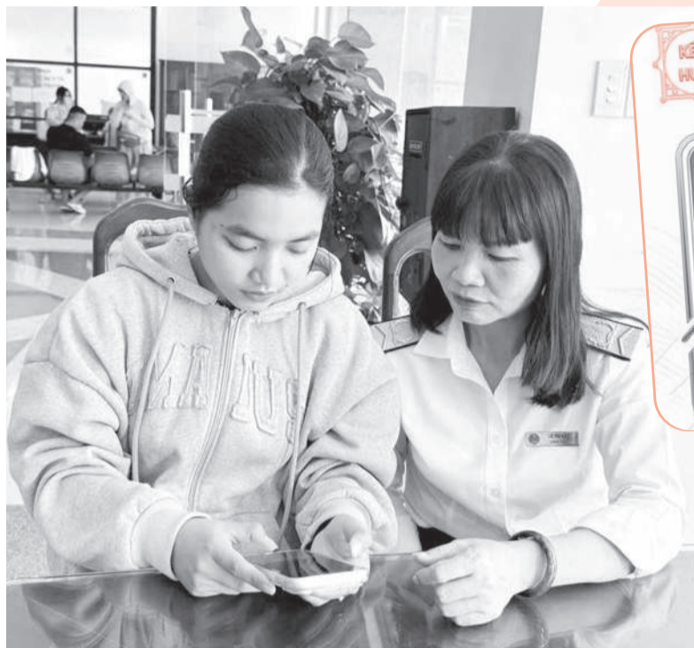
● Cán bộ Thuế cơ sở 2 hướng dẫn người dân cài đặt ứng dụng Etax Mobile.

Bên cạnh đó, nội dung tuyên truyền cũng được tinh gọn, tập trung vào những vấn đề thiết thực, gắn liền với người nộp thuế như: Hộ kinh doanh cần làm gì, sử dụng biểu mẫu nào, thời hạn ra sao... Thông tin được phân loại theo từng nhóm đối tượng, căn cứ mức doanh thu để đảm bảo phù hợp, dễ áp dụng. Đơn cử, trong tháng 4, hộ kinh doanh có doanh thu dưới 500 triệu đồng/năm phải thông báo số tài khoản cho cơ quan thuế, hoàn thành chậm nhất ngày 20-4; hộ kinh doanh có doanh thu từ hơn 500 triệu đồng đến 50 tỷ đồng gửi thông báo tài khoản cùng tờ khai thuế quý I/2026 thời hạn đến ngày 4-5; hộ kinh doanh có doanh thu hơn