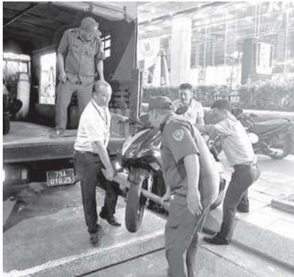
● Lực lượng chức năng phường Nha Trang xử lý các xe máy đỗ trái phép trên vỉa hè.

Ngày trong tối 7-4, Tổ tuần tra, kiểm tra trên các lĩnh vực giao thông, trật tự mỹ quan đô thị, vệ sinh môi trường của phường ra quân kiểm tra trên các tuyến đường: Trần Phú, Lê Lợi, Nguyễn Chánh, Yersin, Lý Tự Trọng, Lê Thánh Tôn, Nguyễn Thị Minh Khai,