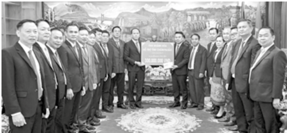
● Đoàn công tác của tỉnh Khánh Hòa tặng tỉnh Champasak số tiền 300 triệu đồng nhằm góp phần đảm bảo an sinh xã hội.