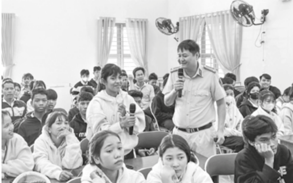
● Học sinh Trường Trung cấp Nghề dân tộc nội trú Khánh Vĩnh trả lời câu hỏi trong một buổi tuyên truyền về trật tự an toàn giao thông.

UBND tỉnh vừa ban hành Kế hoạch bảo đảm trật tự, an toàn giao thông (ATGT) trên địa bàn tỉnh năm 2026. Theo đó, UBND tỉnh yêu cầu đề cao vai trò, trách nhiệm của người đứng đầu các địa phương, đơn vị, người phụ trách công tác bảo đảm trật tự, ATGT; từng bước nâng cao nhận thức, ý thức tự giác chấp hành pháp luật của người tham gia giao thông, nhất là người điều khiển mô tô, xe máy, doanh nghiệp và lái xe vận tải khách.