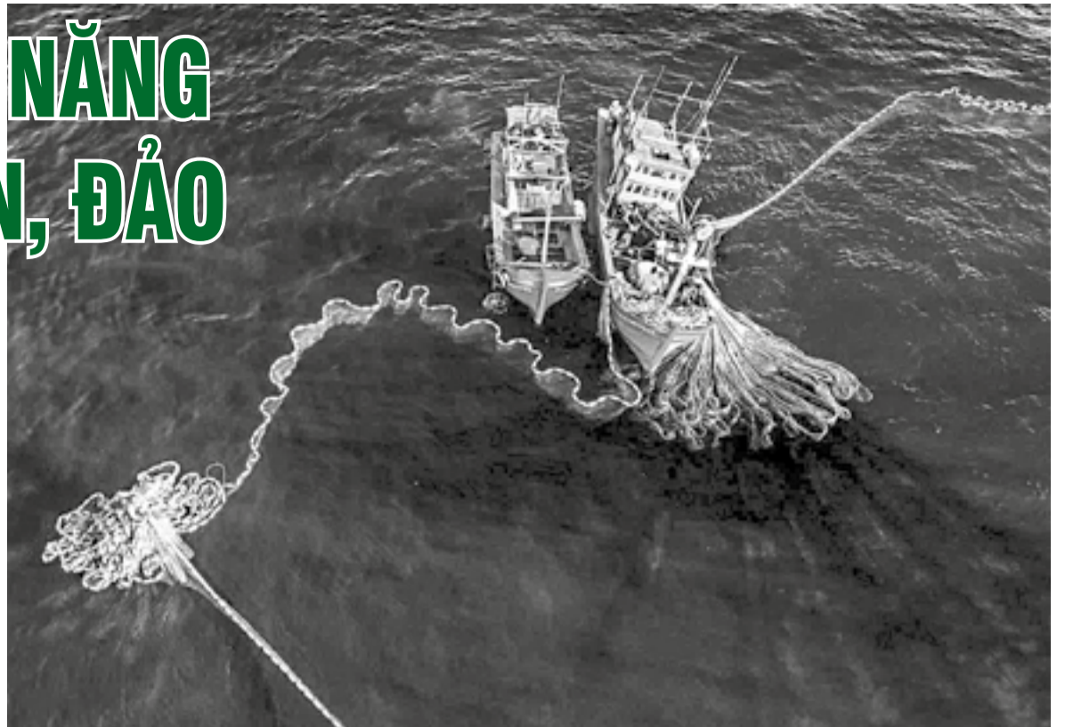
● Ngư dân Khánh Hòa đánh bắt hải sản trên biển.

Với lợi thế có các cảng nước sâu Vân Phong và Cà Ná, tỉnh đang từng bước hình thành chuỗi logistics biển