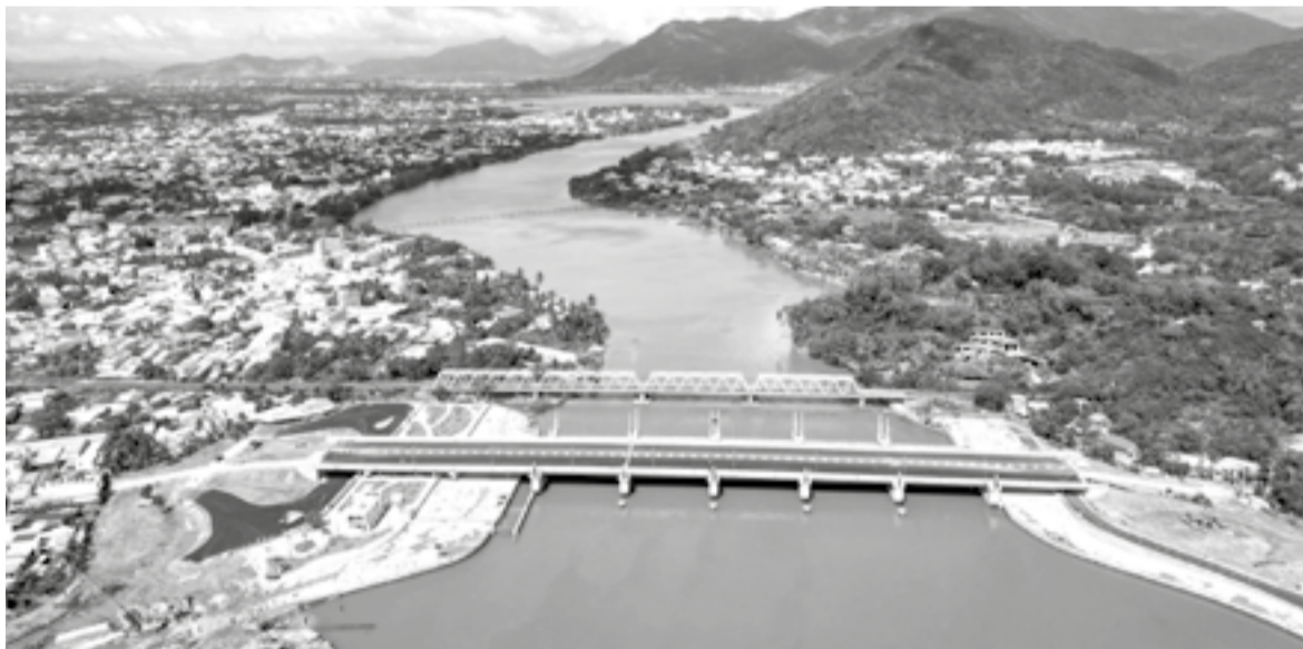
● Công trình đập ngăn mặn trên Sông Cái Nha Trang.

Đập ngăn mặn trên Sông Cái Nha Trang (phường Tây Nha Trang) đã hoàn thành, đưa vào vận hành thử không chỉ phát huy hiệu quả ngăn mặn, giữ ngọt, mà còn là nhịp cầu giao thông thuận tiện, mang đến niềm vui rõ rệt cho người dân.