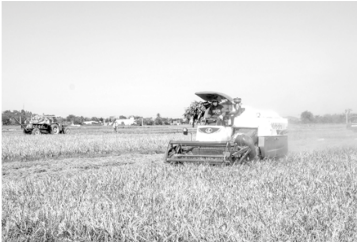
● Nông dân thu hoạch lúa trên cánh đồng Hợp tác xã Nông nghiệp Vạn Phú 1.

Theo ông Phạm Hoàng Danh - Giám đốc HTX Nông nghiệp Vạn Phú 1, toàn HTX sản xuất 235ha lúa đông xuân, đến nay đã thu hoạch xong. Vụ này, ngoài tác động của thời tiết, giá vật tư nông nghiệp, phân bón và nhiên liệu đều tăng mạnh khiến chi phí sản xuất đội lên hơn 20% so với năm trước. Một trong những nỗi lo lớn của nông dân trong giai đoạn thu hoạch là giá dịch vụ. Tuy nhiên, nhờ chủ động ký kết sớm với các đơn vị cung ứng dịch vụ nông nghiệp, HTX đã giữ được giá công gặt ở mức 2 triệu đồng/ha, công vận chuyển khoảng 11.000 đồng/bao. Sau khi