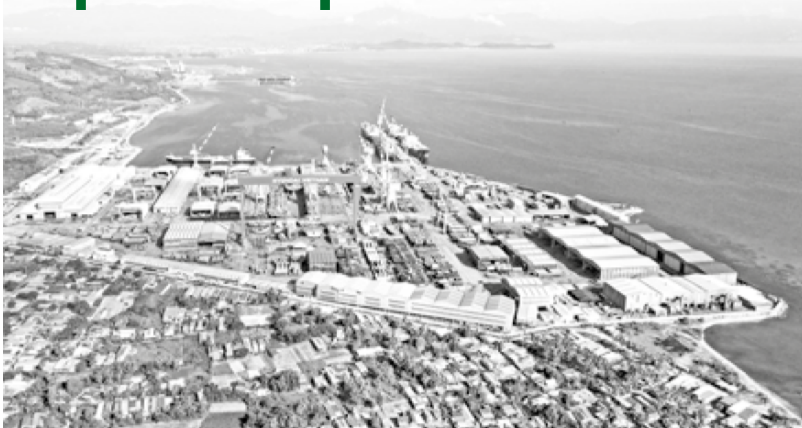
● Toàn cảnh Công ty TNHH Đóng tàu HD Hyundai Việt Nam (phường Đông Ninh Hòa).

Để trở thành thành phố trực thuộc Trung ương, tỉnh còn 3/7 tiêu chuẩn cần hoàn thiện. Trong đó, đối với tiêu chuẩn tỷ lệ số phường trên tổng số đơn vị hành chính cấp xã, tỉnh mới chỉ đạt 24,6% (16 phường trên tổng số 65 đơn vị hành chính cấp xã), trong khi quy định phải từ 30% trở lên. Như vậy, toàn tỉnh cần nâng cấp ít nhất 4 xã lên phường. Kết quả rà soát 27 xã có định hướng nâng cấp lên phường cho thấy sự phân hóa rõ rệt giữa các địa phương. Trong đó, xã Tân Định đạt 8/9 tiêu chuẩn, 6 xã (Diên Khánh, Diên Lạc, Diên Điền, Suối Hiệp, Cam Lâm, Vĩnh Hải) đạt 7/9 tiêu chuẩn; xã Ninh Sơn đạt 6/9 tiêu chuẩn; 6 xã (Hòa Trí, Đại Lãnh, Vạn Thắng, Vạn