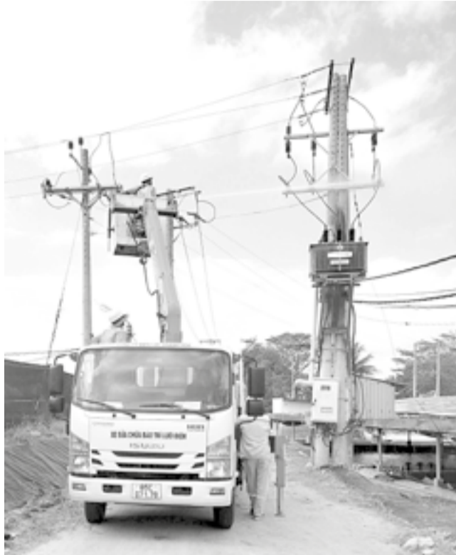
● Công nhân Điện lực Khánh Hòa kiểm tra, bảo trì lưới điện trung áp, chủ động phòng ngừa sự cố trong mùa khô.

hưởng của nắng nóng kéo dài, lượng mưa giảm, nguy cơ hạn hán, thiếu nước cục bộ gia tăng do tác động của hiện tượng ENSO chuyển dần sang trạng thái trung tính hoặc El Nino, nhất là tại các khu vực sản xuất nông nghiệp phụ thuộc nguồn nước hồ chứa, thủy lợi. Trên cơ sở đó, Công ty Điện lực Khánh Hòa đã xây dựng phương án cung cấp điện từ tháng 4 đến tháng 8-2026, với công suất cực đại dự kiến