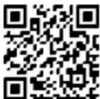
Quét mã QR để xem danh sách phương tiện

Trong thời hạn 01 năm kể từ ngày ra thông báo lần hai, nếu người vi phạm, chủ phương tiện hay người đại diện hợp pháp của phương tiện không đến giải quyết thì Phòng Cảnh sát giao thông Công an tỉnh Khánh Hòa sẽ tiến hành thủ tục tịch thu phương tiện và xử lý theo quy định ./.