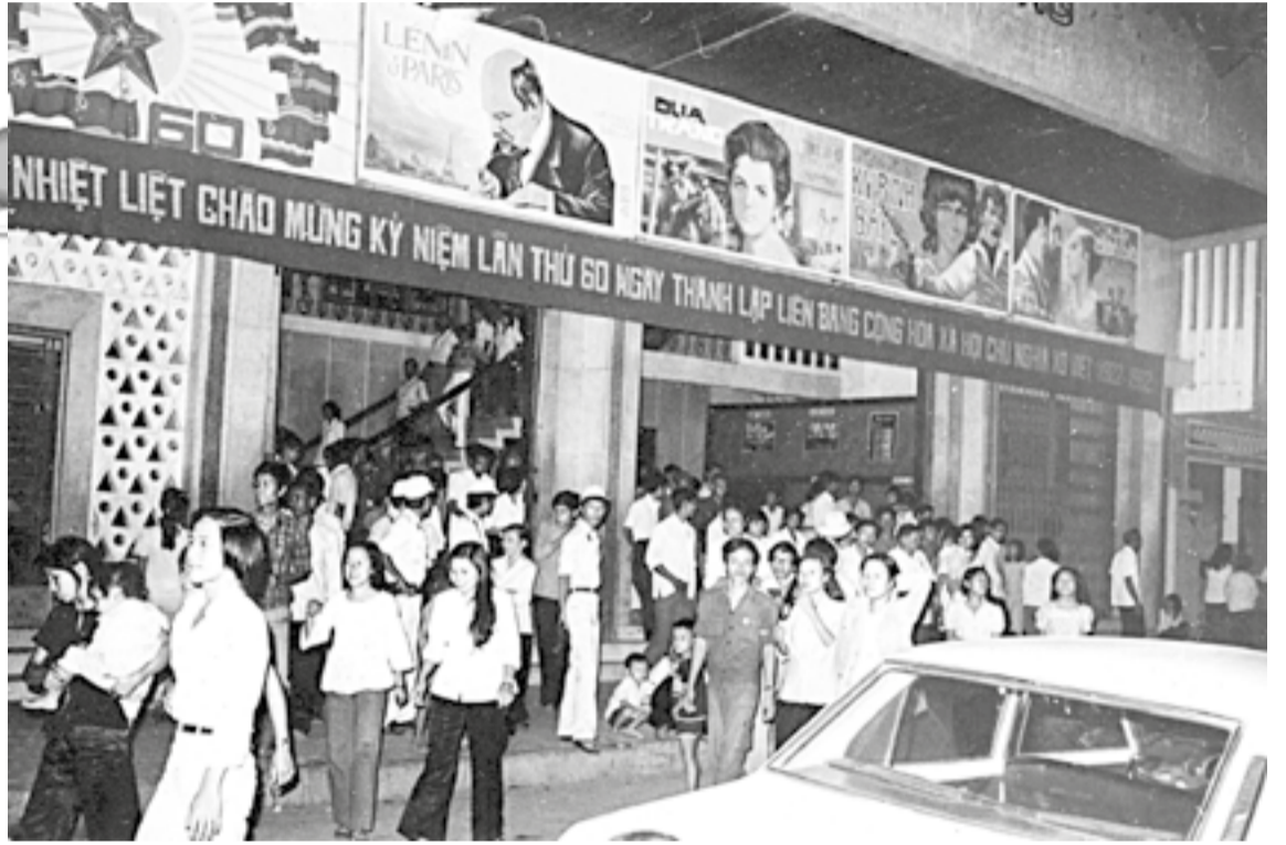
● Người dân đi xem phim ở rạp Nha Trang (đường Hoàng Văn Thụ).