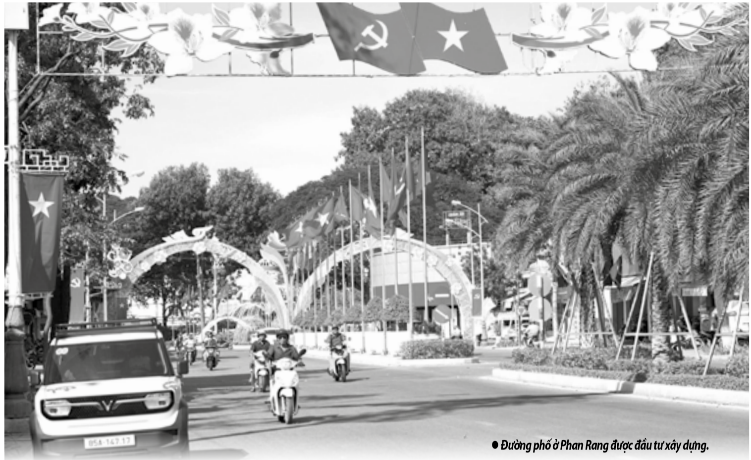
• Đường phố ở Phan Rang được đầu tư xây dựng.