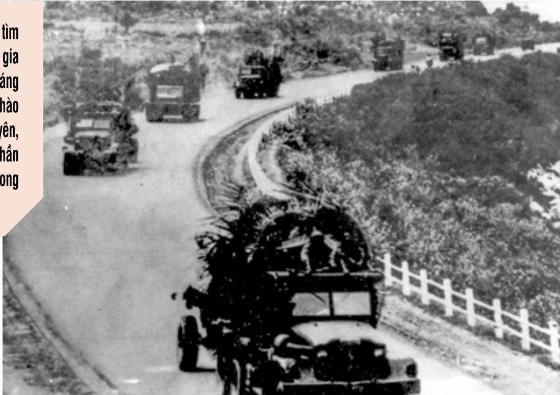
● Quân giải phóng tiến vào Khánh Hòa tháng 4-1975.

Sau khi tuyến phòng thủ ở đèo Phượng Hoàng bị đập tan, quân địch ở Nha Trang hỗn loạn tìm cách tháo chạy. 17 giờ ngày 2-4-1975, sau khi đánh tan các chốt điểm của địch ở đèo Rọ Tượng, đèo Rù Rì, lực lượng binh chủng hợp thành của Sư đoàn 10 rầm rộ vượt qua cầu Xóm Bóng tiến vào giải phóng Nha Trang. Nhân dân đổ ra đường đón bộ đội. Những tiếng hoan hô vang dội, vui mừng khôn xiết. Nhà nhà đều treo cờ Mặt trận, người người đều cầm cờ trên tay vẫy chào. Sau khi giải phóng Nha Trang, ngày 3-4-1975, Sư đoàn 10 tiếp tục tiến quân giải phóng Cam Ranh và Khu liên hợp quân sự Cam Ranh; sau đó tiến vào phía nam giải phóng sân bay Thành Sơn (phường Đô Vinh hiện nay), rồi cùng các lực lượng tham gia tiến công giải phóng Sài Gòn, góp phần làm nên đại thắng mùa xuân năm 1975, giải phóng hoàn toàn miền Nam, thống nhất đất nước.