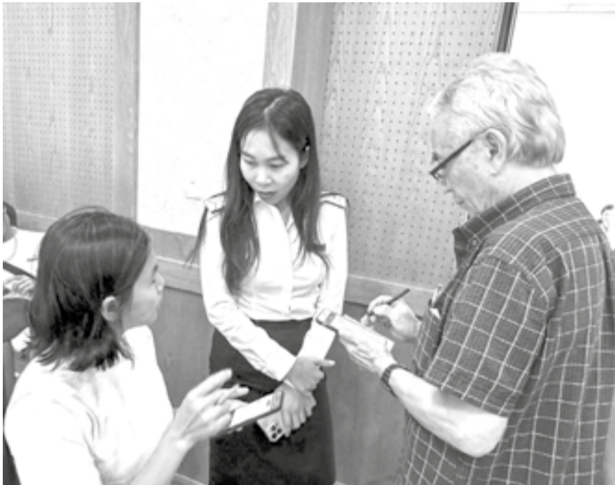
● Cán bộ thuế trao đổi với người dân tại một hội nghị đối thoại, hướng dẫn, hỗ trợ hộ kinh doanh.