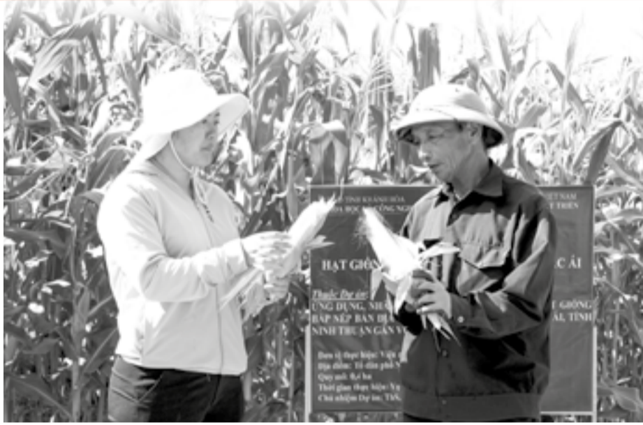
● Cán bộ Viện Nghiên cứu Bông và Phát triển Nông nghiệp Nha Hồ thử nghiệm trồng bắp nếp tại viện.

Trong bối cảnh việc lai tạo cây giống và giống mới tràn ngập thị trường, những giống cây trồng bản địa như khoai lang, bắp nếp truyền thống từng gắn bó với bao thế hệ đang dần bị lãng quên. Do đó, một số địa phương đang thực hiện hành trình phục tráng, nâng tầm giá trị những giống cây này nhằm mở ra hướng đi bền vững cho nông nghiệp và sinh kế của người dân.