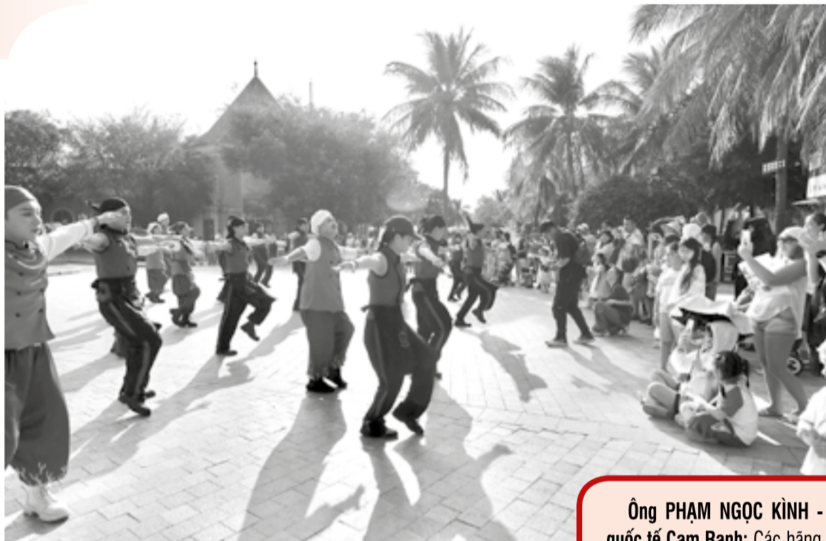
● Khách du lịch theo dõi đội vũ công nhảy múa tại VinWonders Nha Trang.

đốc khách sạn Adamas Boutique Nha Trang cho biết, từ đầu năm đến nay, tỷ lệ lấp phòng luôn đạt khoảng 95%, nhiều ngày cuối tuần đạt 100%.