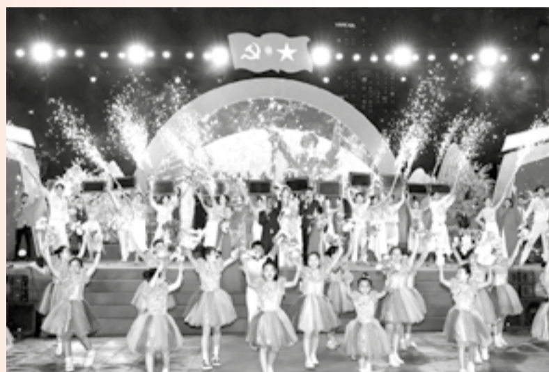
● Tiết mục "Khánh Hòa - vươn mình kỷ nguyên mới" được biểu diễn trong chương trình nghệ thuật chào mừng 96 năm Ngày thành lập Đảng Cộng sản Việt Nam.

Từ nhịp điệu khoan thai ở phần mở đầu, đến giữa bài hát, âm nhạc thay đổi đột ngột, dồn dập, tươi sáng tạo điểm nhấn nghệ thuật độc đáo. Đây là thủ pháp thể hiện sự vươn mình, phản ánh nhịp sống hối hả của một trung tâm kinh tế - công nghệ đang hình thành. Những danh từ như: "Công nghệ", "điện hạt nhân", "trí tuệ" được lồng ghép khéo léo với "tháp nắng lung linh" tạo nên sự kết nối giữa di sản và đổi mới, giữa những vùng đất có bề dày văn hóa tương đồng. Bài hát "Khánh Hòa - vươn mình kỷ nguyên mới" sử dụng những hòa âm hiện đại mang đậm phong cách nhạc Jazz, Pop tạo sự sang trọng, thời thượng, phù hợp với tầm vóc của một đô thị quốc tế tương lai. Phần điệp khúc ở cuối bài với những nốt cao vút như khẳng định khát vọng, quyết tâm của người dân nơi đây.