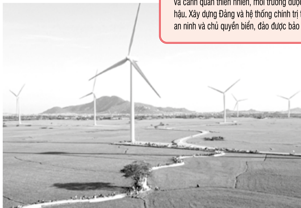
• Điện gió Đầm Nai góp phần đưa Khánh Hòa trở thành trung tâm năng lượng quốc gia.

Đứng trước thực trạng đó, Đảng bộ và Nhân dân Khánh Hòa không chùn bước. Tỉnh ủy xác định khôi phục kinh tế, ổn định đời sống Nhân dân là nhiệm vụ cấp bách hàng đầu. Hàng loạt "chiến dịch" thời bình được phát động như: Rà phá bom mìn, khai hoang phục hóa, khôi phục sản xuất, dựng lại nhà cửa, trường học, trạm y tế. Những cánh đồng hoang dần hồi sinh; những con đường đất dần được thay bằng bê tông nhựa. Từ nền tảng đó, kinh tế từng bước phát triển, đời sống người dân cải thiện rõ rệt.