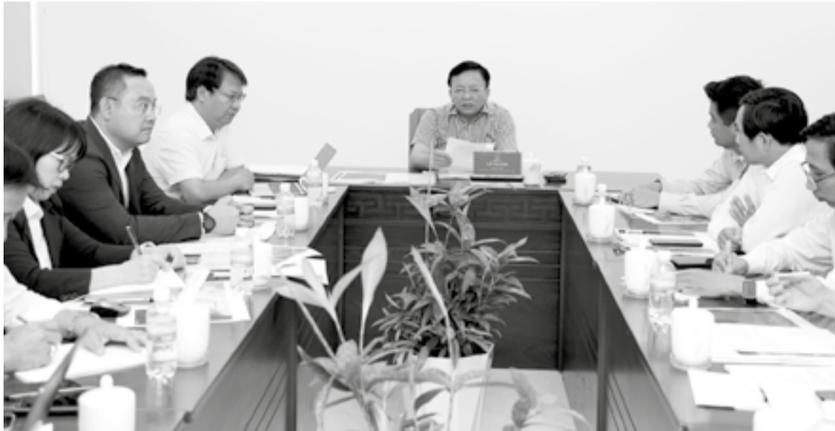
● Đồng chí Lê Huyền phát biểu kết luận cuộc họp.

Chiều 31-3, đồng chí Lê Huyền - Phó Chủ tịch UBND tỉnh chủ trì cuộc họp nghe Sở Xây dựng báo cáo đề xuất thí điểm mở tuyến xe buýt 2 tầng thoáng nóc trên cung đường biển Trần Phú - Phạm Văn Đồng. Tại cuộc họp, đồng chí Lê Huyền cơ bản thống nhất mở tuyến xe buýt này nhằm phục vụ du khách và đa dạng hóa sản phẩm du lịch của tỉnh.