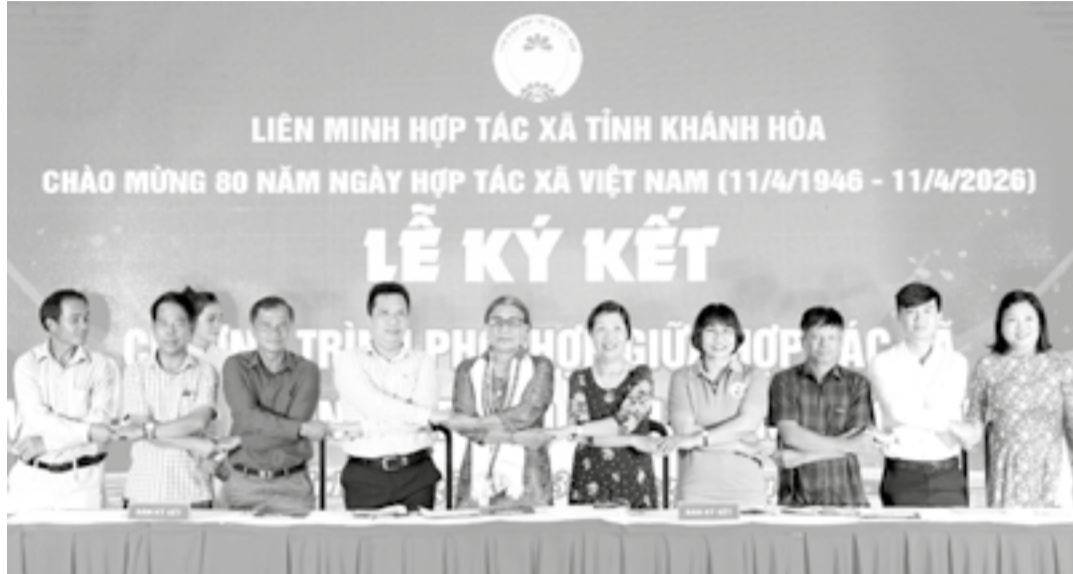
● Đại diện các hợp tác xã, doanh nghiệp ký kết hợp tác tiêu thụ sản phẩm giai đoạn 2026 - 2028.

Ngày 31-3, trong khuôn khổ Hội nghị xúc tiến thương mại, kết nối giao thương khu vực kinh tế tập thể phía nam tỉnh Khánh Hòa năm 2026 do Liên minh Hợp tác xã (HTX) tỉnh tổ chức, nhiều hoạt động trưng bày, giới thiệu sản phẩm, kết nối HTX - doanh nghiệp và ký kết tiêu thụ sản phẩm được tổ chức đồng bộ, tạo không khí giao thương sôi động, thiết thực. Hội nghị nằm trong chuỗi hoạt động chào mừng 80 năm Ngày HTX Việt Nam (11-4-1946 - 11-4-2026), với khoảng 300 đại biểu là đại diện các HTX, doanh nghiệp, tổ hợp tác trong và ngoài tỉnh tham dự.