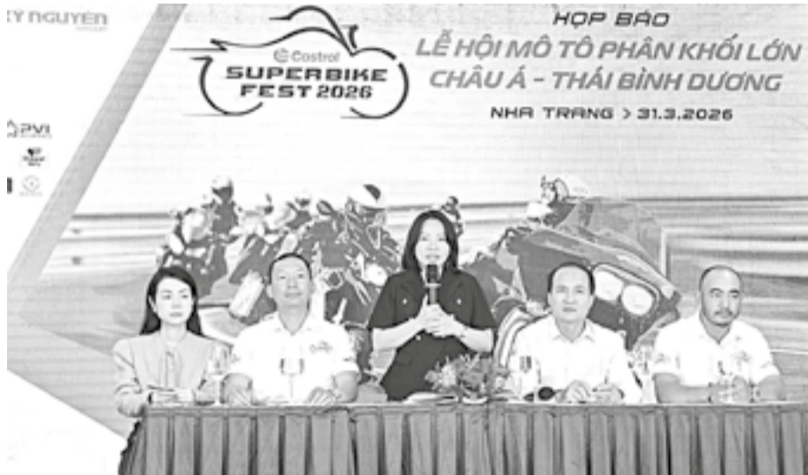
● Ban tổ chức lễ hội điều hành buổi họp báo, trả lời các câu hỏi phóng viên, nhà báo.