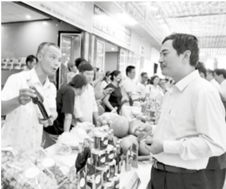
● Đại diện hợp tác xã giới thiệu, kể câu chuyện sản phẩm để nâng cao giá trị nông sản.