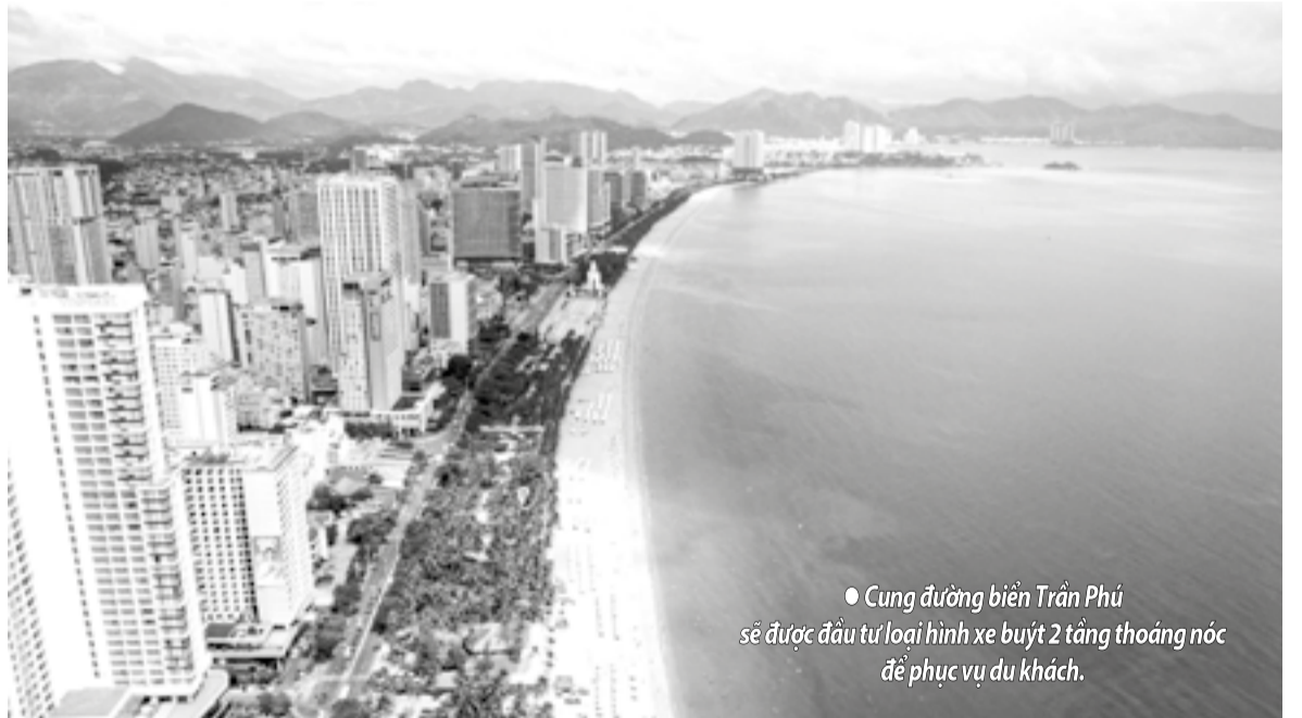
● Cung đường biển Trần Phú sẽ được đầu tư loại hình xe buýt 2 tầng thoáng nóc để phục vụ du khách.