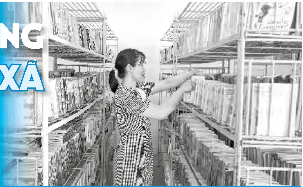
• Nhân viên thư viện phường Nha Trang sắp xếp tài nguyên thông tin.

Hiện nay, nhiều xã, phường trên địa bàn tỉnh chưa có thư viện công cộng; một số địa phương có thư viện thì gặp nhiều khó khăn về cơ sở vật chất, kinh phí, nhân sự. Điều đó đã tạo nên khoảng trống liên quan đến thiết chế văn hóa, ảnh hưởng tới việc phát triển văn hóa đọc tại các xã, phường.