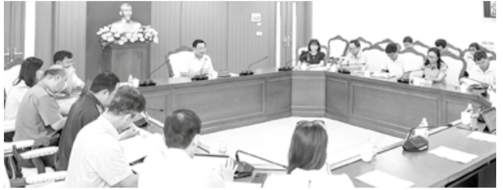
● Quang cảnh cuộc họp.