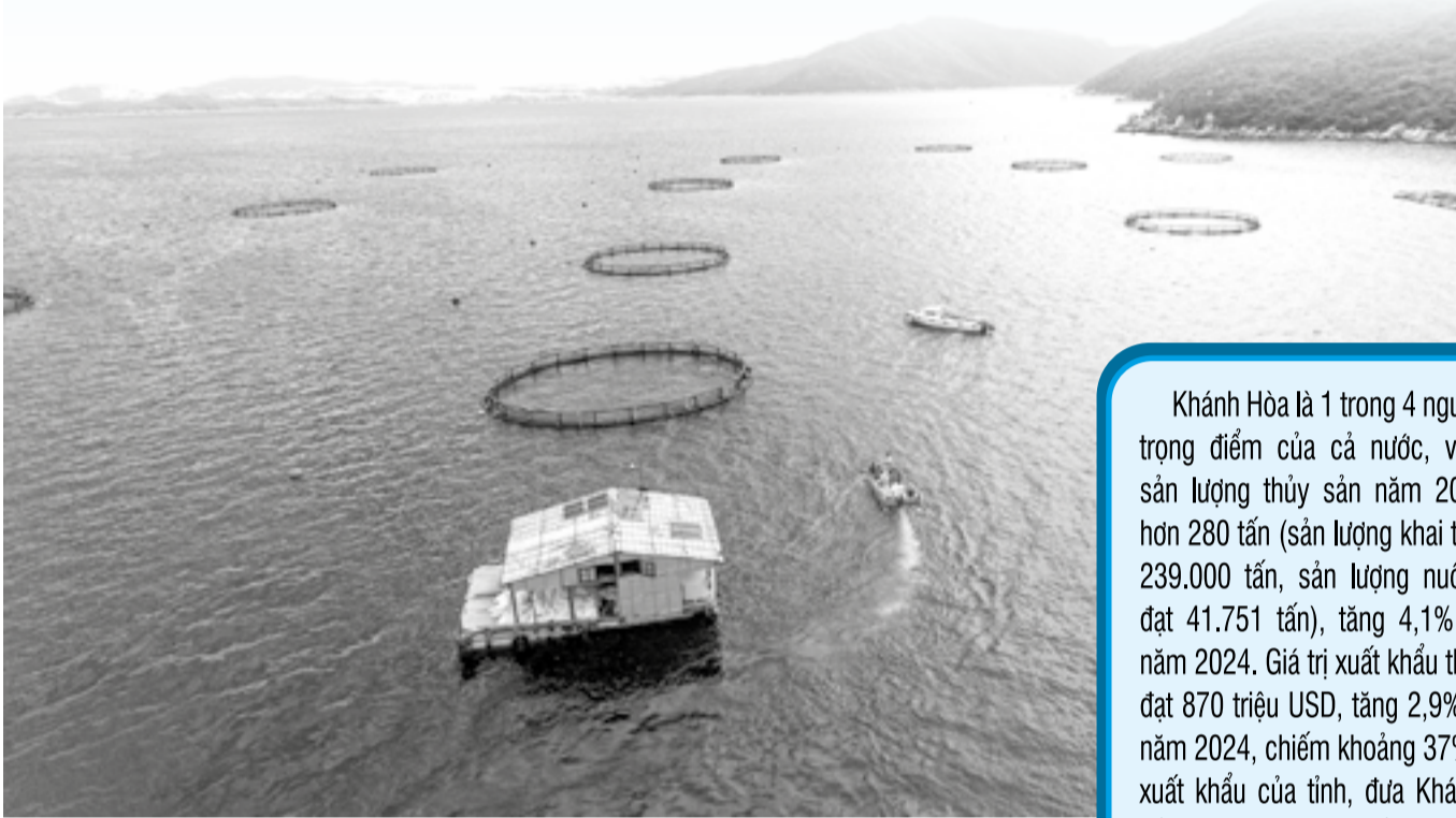
● Nuôi biển công nghệ cao ứng dụng lồng HDPE trên vùng biển vịnh Ván Phong.

Nhận thức sâu sắc tầm quan trọng của ngành Thủy sản đối với sự phát triển kinh tế - xã hội, tỉnh đã và đang tập trung triển khai thực hiện đồng bộ các giải pháp, phát huy tối đa tiềm năng, lợi thế nhằm nâng cao giá trị, đưa ngành Thủy sản phát triển nhanh và bền vững.