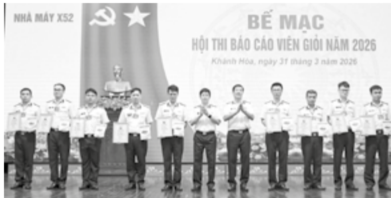
● Ban tổ chức trao giải cho các thí sinh đạt thành tích cao.

Ngày 31-3, Nhà máy X52 (Cục Hậu cần - Kỹ thuật Hải quân) tổ chức Hội thi báo cáo viên giỏi năm 2026. Tham gia hội thi có 20 thí sinh là trợ lý chính trị, bí thư, phó bí thư các chi bộ trực thuộc Đảng bộ nhà máy. Các thí sinh thực hiện 3 phần thi gồm: Soạn đề cương; trả lời câu hỏi của Ban Giám khảo và thi thuyết trình. Nội dung thi tập trung tuyên truyền những nội dung cơ bản của Nghị quyết Đại hội XIV của Đảng, Nghị quyết Đại hội Đảng các cấp, nhiệm kỳ 2025 - 2030, liên hệ thực tiễn tại cơ quan, đơn vị.