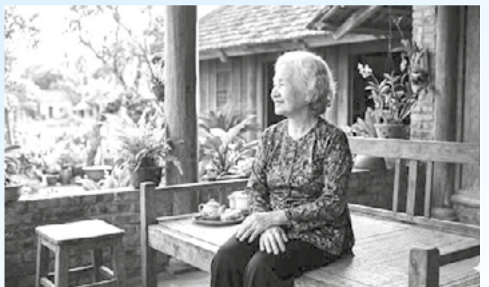
• Ảnh minh họa AI

Ngày đám cưới tôi, tuổi 50, tóc má còn đen, bỏ xõa ngang vai trông má rất trẻ. Ba tôi mất, tóc má bạc dần, để rồi sau đó những tấm hình năm má tuổi 60 tóc lem nhem bạc như tôi bây giờ nhưng trông má cười rất tự nhiên, trẻ trung, không chút vướng bận về mái tóc bạc. Ở tuổi 70, tóc má bạc nhiều. Qua tuổi 80, tóc má trắng xóa, mượt, rất đẹp.