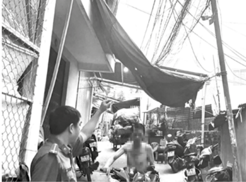
● Camera an ninh được lực lượng Công an lắp đặt tại khu vực "lầu 7", phường Bắc Nha Trang để phòng ngừa tội phạm, tệ nạn ma túy.

Trong thời gian qua, hàng loạt vụ việc nghiêm trọng đã được làm sáng tỏ nhờ hình ảnh từ camera an ninh do người dân và tổ chức cung cấp. Những hình ảnh rõ nét, trung thực này trở thành manh mối, chứng cứ quan trọng giúp cơ quan chức năng xác định hành vi vi phạm, truy tìm đối tượng nhanh chóng, tiết kiệm tối đa thời gian và công sức. Điển hình, thông qua camera của người dân, lực lượng Công an tỉnh đã truy xét và bắt giữ nhiều đối tượng thực hiện hành vi trộm cắp tài sản tại các nhà dân thuộc địa bàn phường Nam Nha Trang. Gần đây nhất là vụ trọng án xảy ra trên đường Lương Định Của, phường Tây Nha Trang vào rạng sáng 5-3. Camera dân cư đã ghi lại toàn bộ diễn biến, giúp công an nhanh chóng xác định danh tính nạn nhân, truy tìm và tạm giữ 2 nghi