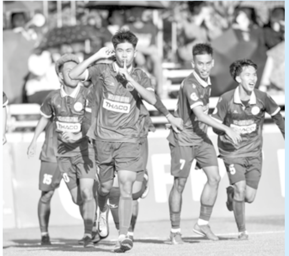
● Niềm vui của các cầu thủ Trường Đại học Nha Trang sau chiến thắng trước đội Trường Đại học Lào.

Sau những lượt trận đấu ở Giải bóng đá Thanh niên sinh viên quốc tế lần II (tại Nha Trang), ở bảng B đã xác định được 2 đại diện lọt vào bán kết. Riêng bảng A, các suất vào bán kết sẽ được định đoạt sau trận đối đầu hứa hẹn rất hấp dẫn giữa chủ nhà Trường Đại học (ĐH) Nha Trang và Trường ĐH Quốc gia Malaysia diễn ra vào ngày 1-4.