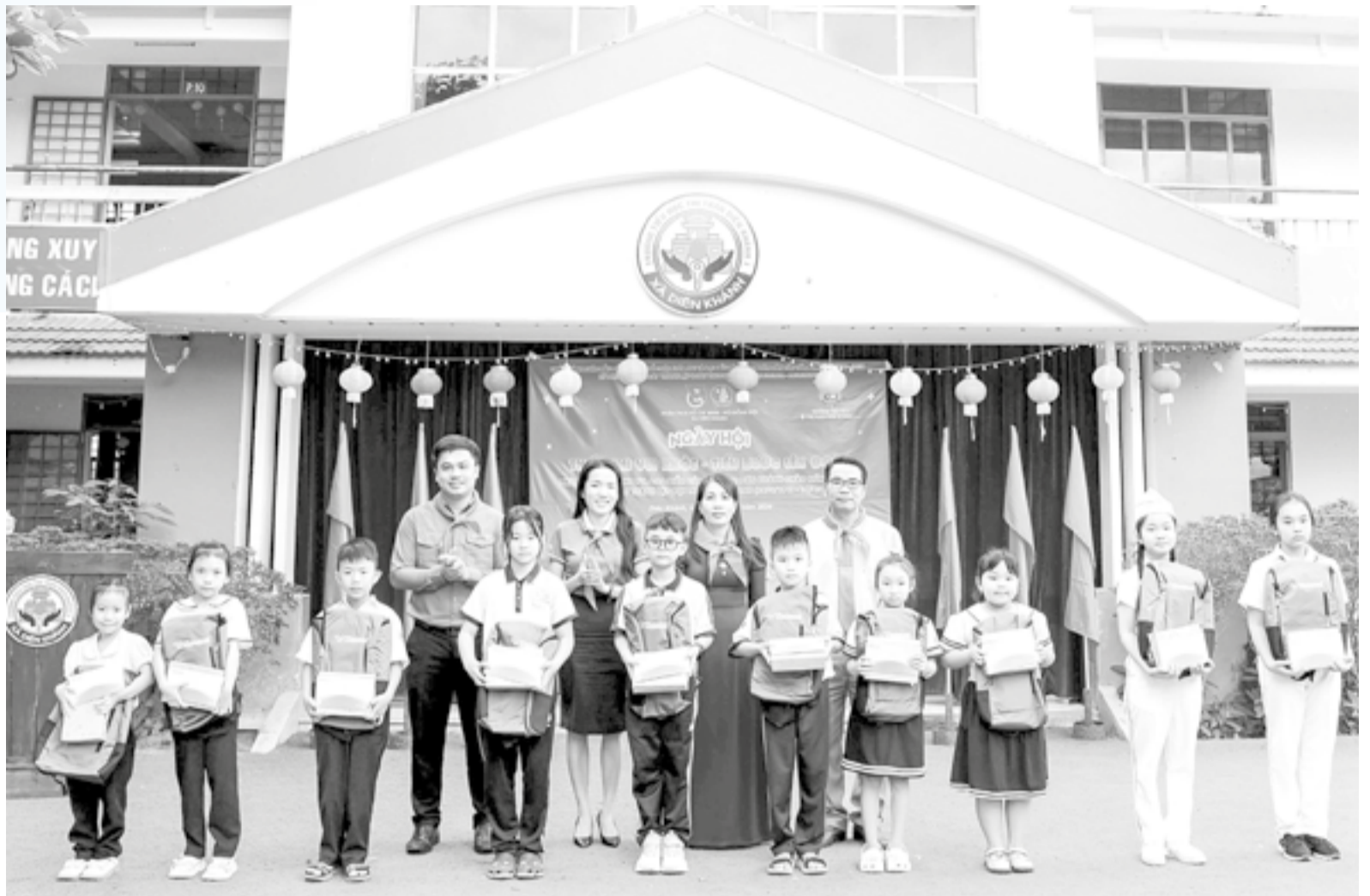
● Đoàn Thanh niên - Hội đồng Đội xã Diên Khánh phối hợp trao quà cho học sinh khó khăn.