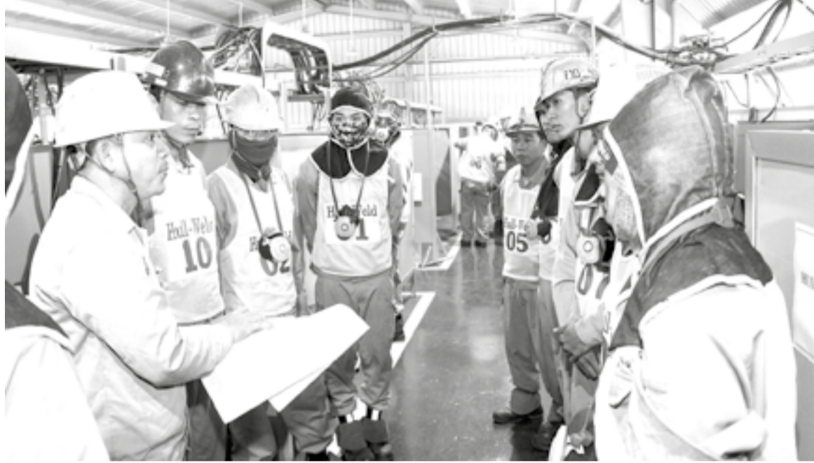
● Hằng năm, Công ty TNHH Đóng tàu HD Hyundai Việt Nam đều tổ chức hội thi nâng cao tay nghề cho người lao động.

9 triệu đồng/người/tháng. Các chế độ tiền lương, tiền thưởng, bảo hiểm xã hội, bảo hiểm y tế, bảo hiểm thất nghiệp được thực hiện đầy đủ, kịp thời. Công ty cũng chú trọng xây dựng môi trường làm việc an toàn, thân thiện; thường xuyên tổ chức đối thoại, lắng nghe tâm tư, nguyện vọng của NLD để kịp thời tháo gỡ khó khăn. Trong đợt mưa lũ vừa qua, tuy bị thiệt hại hơn 80 tỷ đồng song công ty vẫn chi trả đầy đủ lương, thưởng, chế độ cho toàn bộ công nhân.