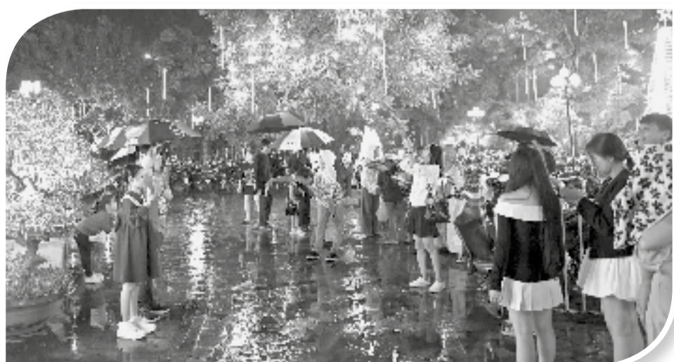
● Dù trời mưa, nhưng không khí Noel tại Nhà thờ Chánh tòa Nha Trang vẫn rất náo nhiệt.