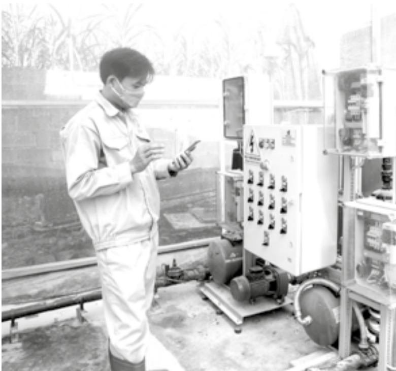
● Nông dân xã Diên Lâm kiểm tra hệ thống cung cấp dưỡng chất cho rau màu.