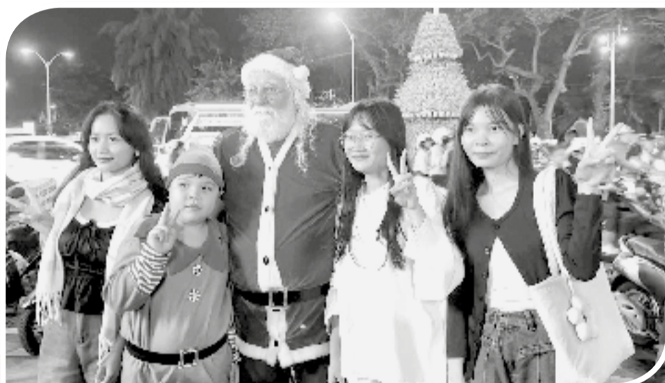
● Du khách thích thú tạo dáng chụp ảnh với ông già Noel.