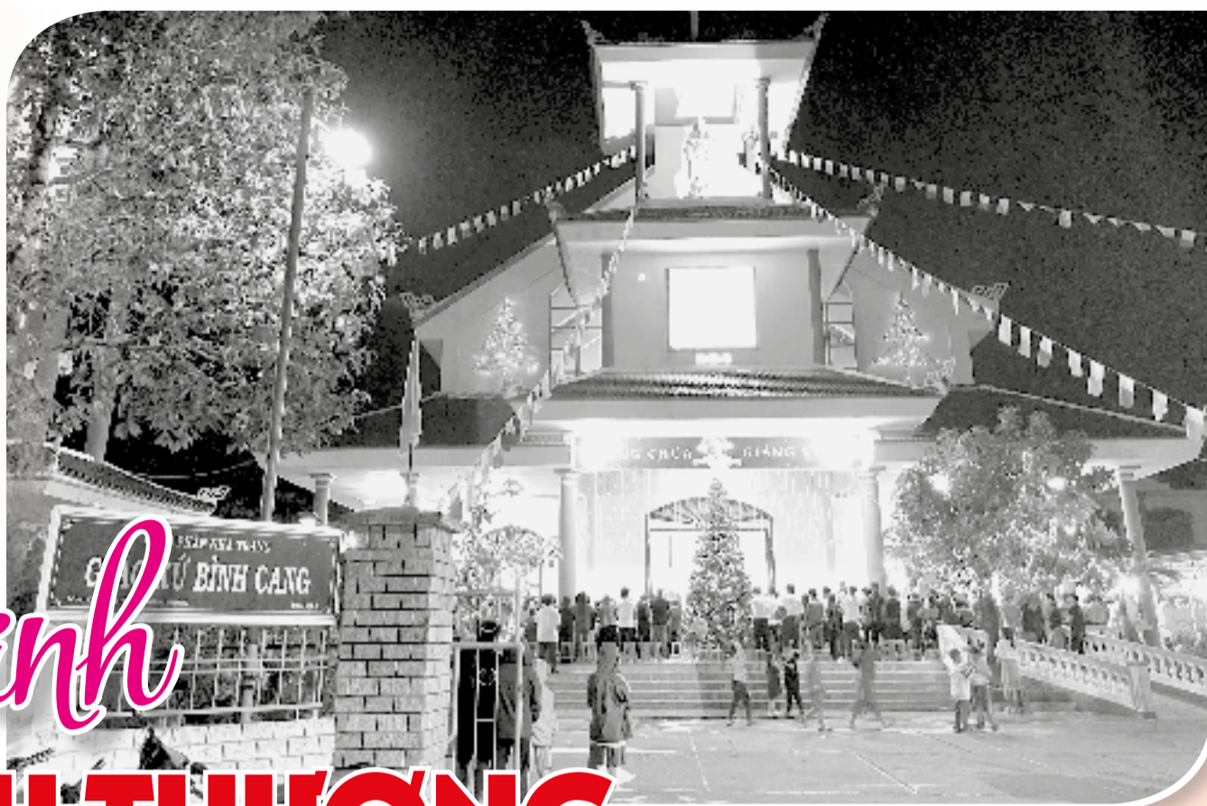
● Nhà thờ Giáo xứ Bình Cang (phường Tây Nha Trang) trong đêm Giáng sinh.