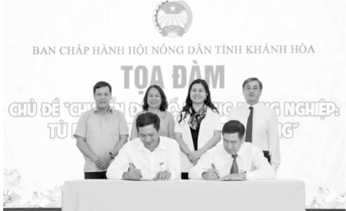
● Hội Nông dân tỉnh ký kết chương trình phối hợp với Sở Khoa học và Công nghệ giai đoạn 2025 - 2030.