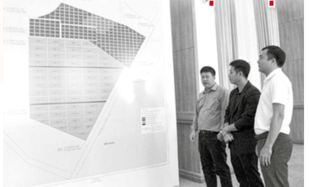
● Các doanh nghiệp tìm hiểu khu vực phát triển nuôi biển phía nam tỉnh.

Sau khi Đề án Quản lý và phát triển vùng nuôi biển khu vực nam Khánh Hòa