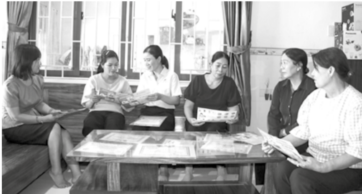
● Cán bộ Trạm Y tế Ninh Quang tuyên truyền cho người dân tại nhà.

Thời gian qua, các cơ sở y tế khu vực Ninh Hòa tích cực triển khai nhiều hoạt động tuyên truyền, khám, chữa bệnh và chăm sóc sức khỏe cộng đồng. Nhờ đó, sức khỏe người dân ngày càng được cải thiện.