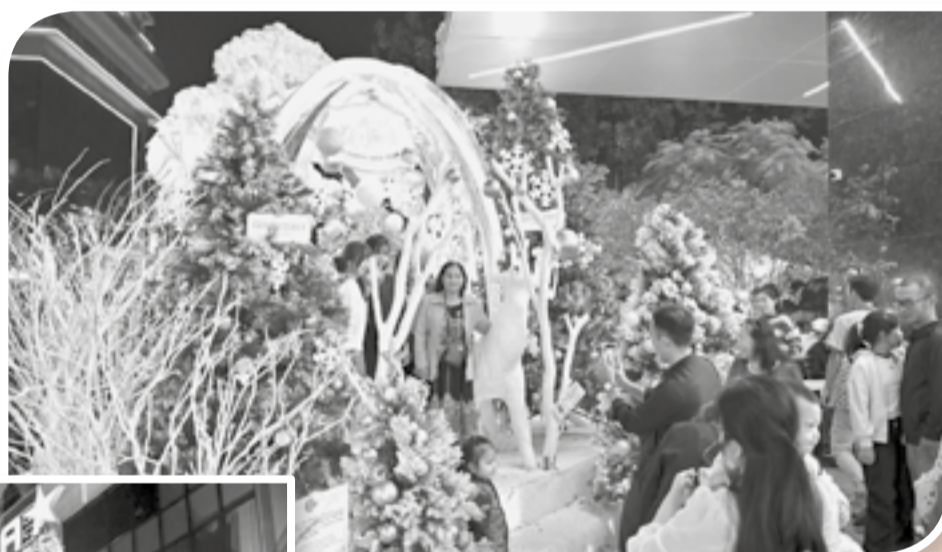
● Người dân check-in tại góc trang trí Giáng sinh của Trung tâm thương mại Gold Coast.