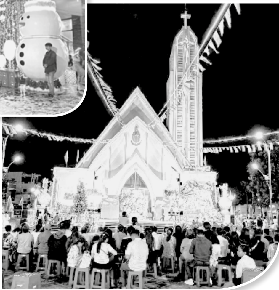
● Nhà thờ Giáo xứ Phan Rang rực rỡ trong đêm Giáng sinh.