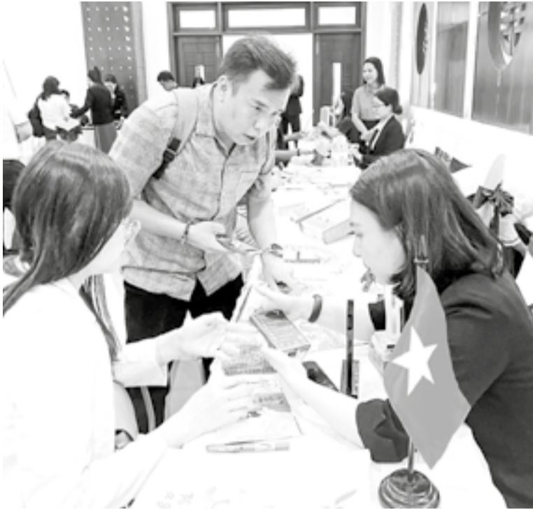
● Đại diện đơn vị lữ hành Malaysia trao đổi thông tin với doanh nghiệp lữ hành Khánh Hòa.

Cùng với sự tăng trưởng về lượng khách, tín hiệu đáng mừng nhất là làn sóng mở rộng mạng lưới đường bay. Theo lãnh đạo Cảng Hàng không quốc tế Cam Ranh, hiện nay có 4 chuyến bay mỗi tuần của hãng AirAsia từ Kuala Lumpur (Malaysia) đến Khánh Hòa. Với thị trường Thái Lan, hãng Thai AirAsia đang khai thác 7 chuyến/tuần từ sân bay Đôn Mương (Bangkok); Thai Vietjet Air chuẩn bị mở đường bay từ sân bay Suvarnabhumi (Bangkok) đến Cam Ranh với tần suất 7 chuyến/tuần. Đặc biệt, hãng hàng không Scoot đã mở đường bay Singapore - Cam Ranh từ cuối tháng 11 với 2 chuyến/tuần, dự kiến tăng lên 5 chuyến/tuần từ đầu năm 2026. Đáng chú ý, Air Cambodia cũng lên kế hoạch