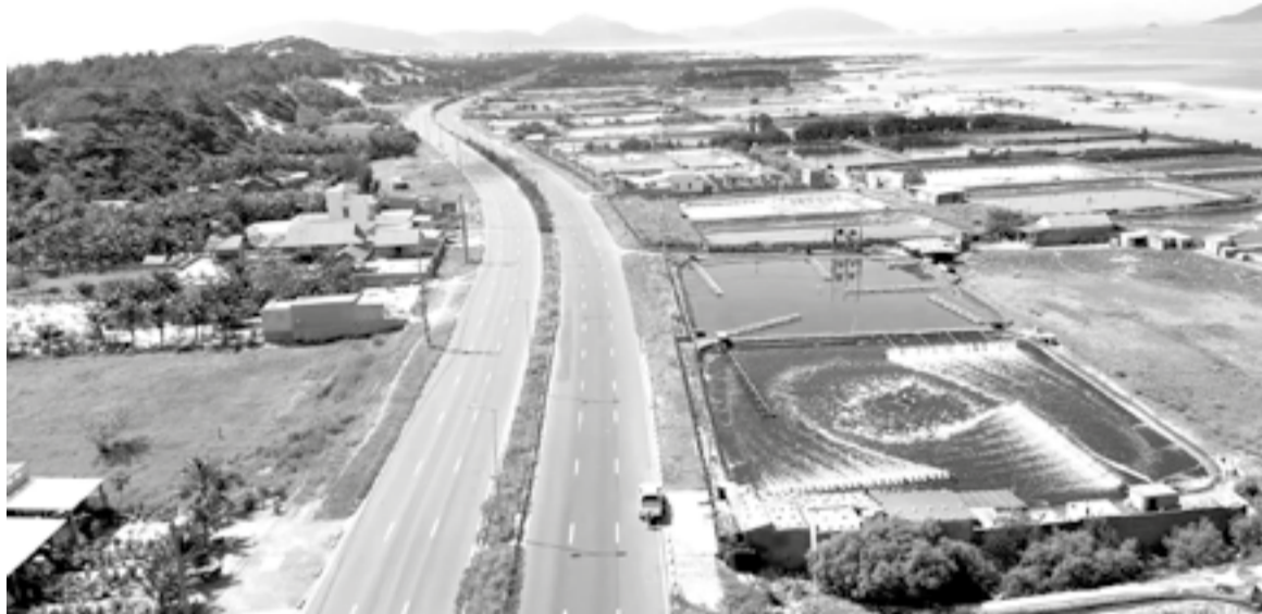
● Tuyến đường từ Quốc lộ 1 đến Đầm Môn được đầu tư xây dựng, tạo động lực phát triển cho xã Đại Lãnh.

Sau sáp nhập tỉnh và triển khai mô hình chính quyền địa phương 2 cấp, xã Đại Lãnh tập trung xây dựng Đảng và hệ thống chính trị trong sạch, vững mạnh; đồng thời lãnh đạo toàn diện nhiệm vụ phát triển kinh tế - xã hội (KT-XH), bảo đảm quốc phòng, an ninh, ổn định đời sống Nhân dân. Những kết quả đạt được tạo nền tảng quan trọng để địa phương tiếp tục vươn lên, đóng góp tích cực vào sự phát triển chung của tỉnh.