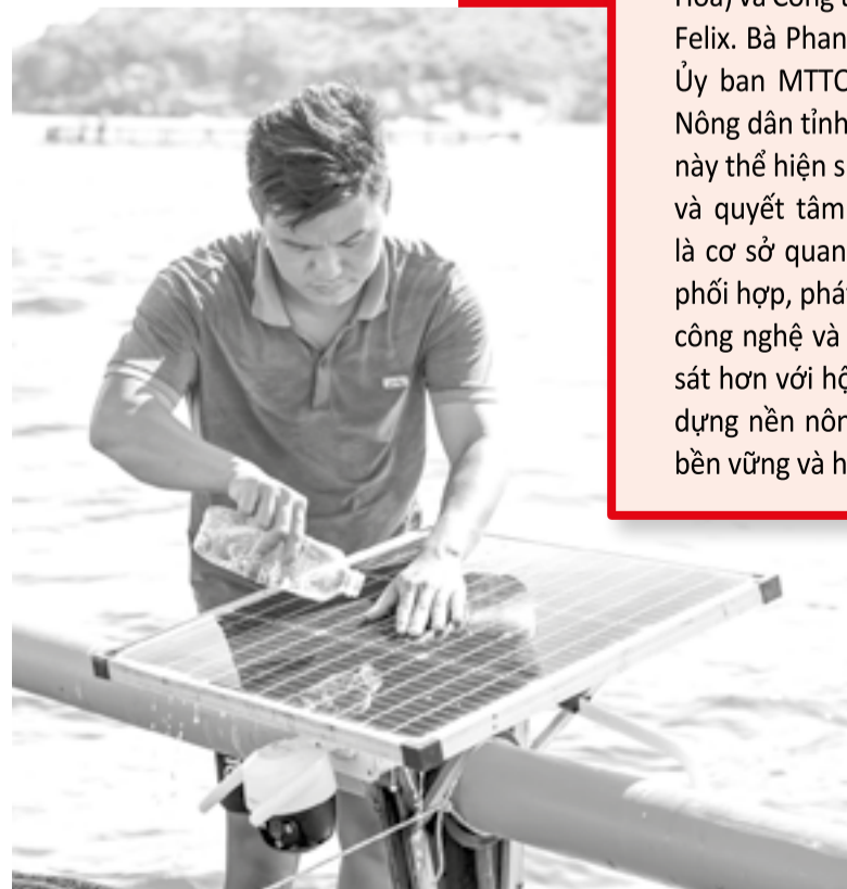
● Ngư dân xã Cam Lâm vệ sinh tấm pin năng lượng mặt trời trên lồng HDPE nuôi thủy sản.