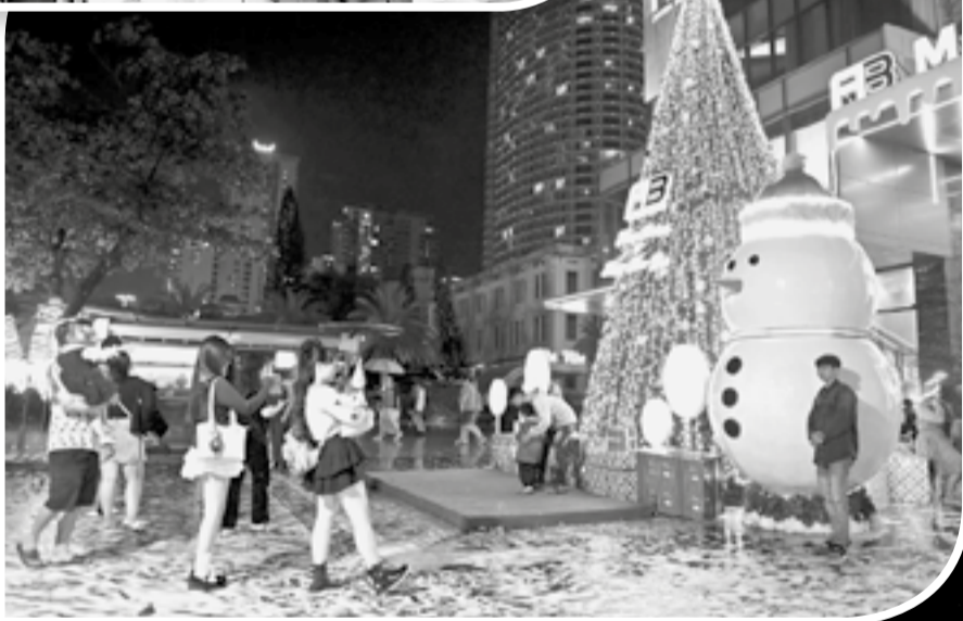
● Không khí Giáng sinh tại Trung tâm Thương mại AB Central Square Nha Trang.