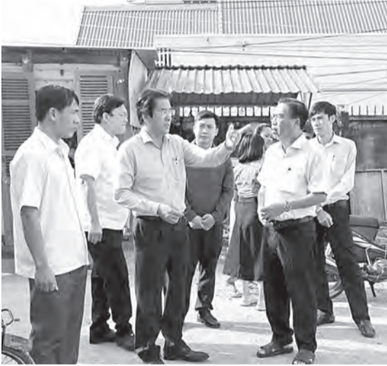
● Phó Chủ tịch Thường trực UBND tỉnh Nguyễn Long Biên kiểm tra tại Trường Tiểu học Lương Cách (sơ sở Đá Bắn).

Sáng 24-11, đồng chí Nguyễn Long Biên - Ủy viên Ban Thường vụ Tỉnh ủy, Phó Chủ tịch Thường trực UBND tỉnh kiểm tra, chỉ đạo khắc phục hậu quả mưa lũ tại