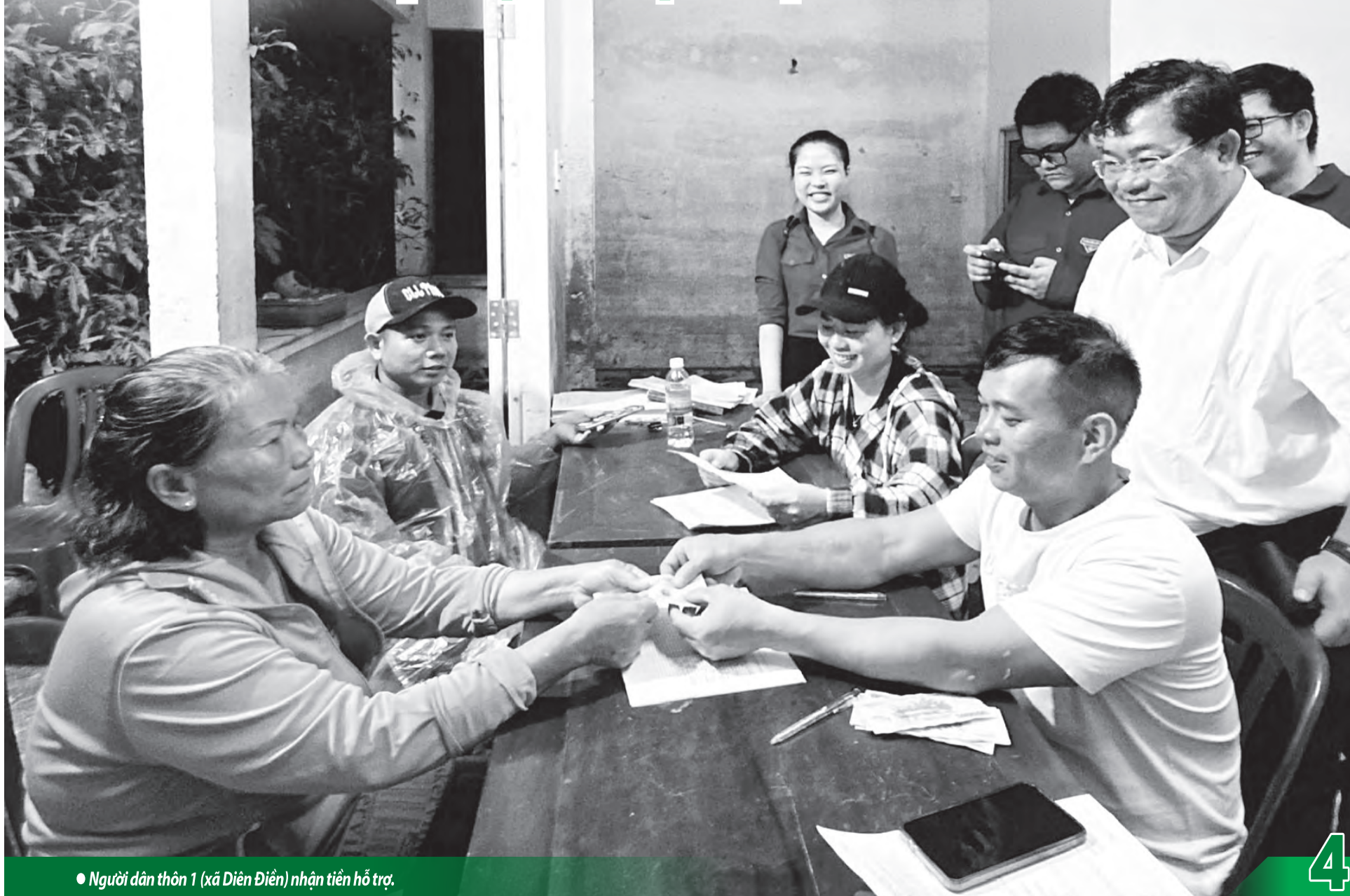
• Người dân thôn 1 (xã Diên Điền) nhận tiền hỗ trợ.

Chi kinh phí hỗ trợ cho người dân khắc phục hậu quả mưa lũ