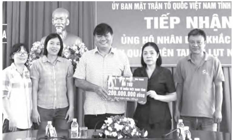
● Đại diện Công ty Cổ phần Sông Đà Nha Trang trao tượng trưng kinh phí ủng hộ người dân bị thiệt hại do lũ lụt.

Sáng 24-11, Ủy ban MTTQ Việt Nam tỉnh tổ chức tiếp nhận 200 triệu đồng của Công ty Cổ phần Sông Đà Nha Trang ủng hộ người dân vùng lũ.