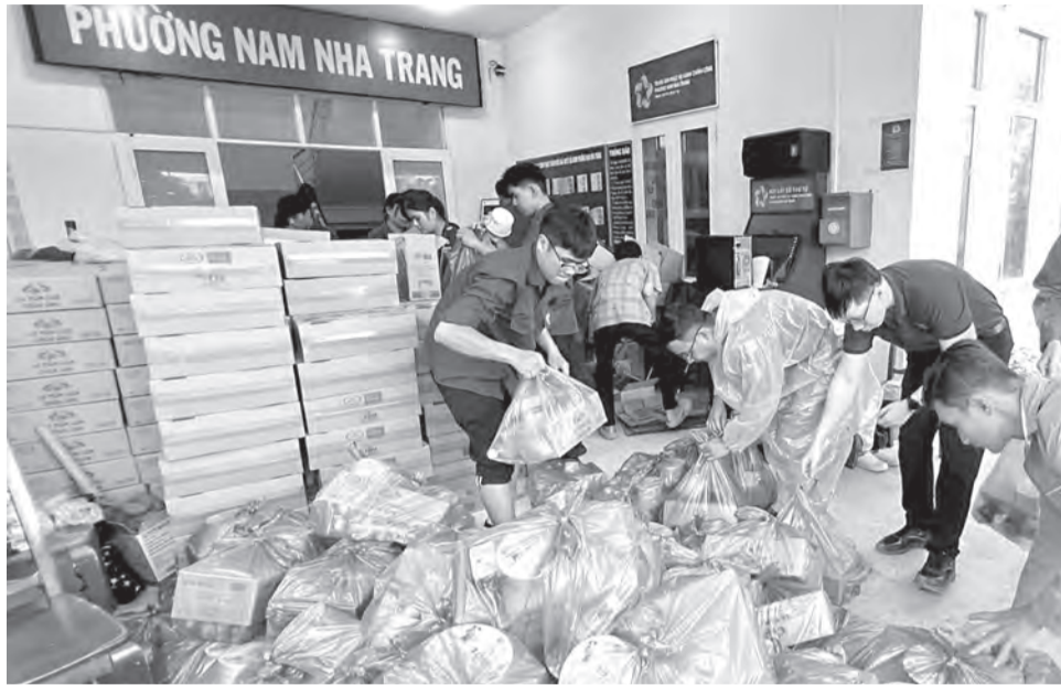
● Tuổi trẻ phường Nam Nha Trang phân loại nhu yếu phẩm để hỗ trợ người dân.

Sau mưa lũ, hàng nghìn bạn trẻ trên toàn tỉnh đã ra quân cùng với các địa phương hỗ trợ người dân khắc phục thiệt hại, tạo nên khí thế tình nguyện rộng khắp, lan tỏa tinh thần sẻ chia.