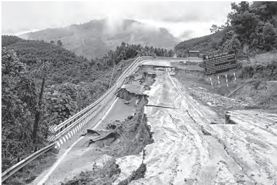
● Đèo Khánh Lê đoạn qua xã Nam Khánh Vĩnh (Quốc lộ 27C) bị sạt lở nghiêm trọng.