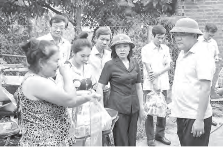
● Chủ tịch UBND tỉnh Trần Phong thăm hỏi người dân Tổ dân phố Thái Thông.

Đến thăm các hộ dân bị ngập lụt sâu tại 2 tổ dân phố Thái Thông và Thủy Tú, Trạm Y tế Vĩnh Thái, Trường Mầm non Vĩnh Thái, đồng chí Trần Phong đã thăm hỏi, động viên, chia sẻ với những khó khăn, mất mát của người dân trong đợt lũ lụt vừa qua; đồng thời nắm bắt tình hình thiệt hại, quá trình khắc phục hậu quả thiên tai ở địa phương. Đồng chí mong muốn cộng đồng dân cư đoàn kết, cố gắng vượt qua khó khăn trước mắt, sớm ổn