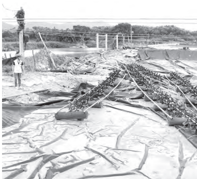
Một địa nuôi tôm bị vỡ, mất trắng của người dân thôn Hiệp Mỹ.