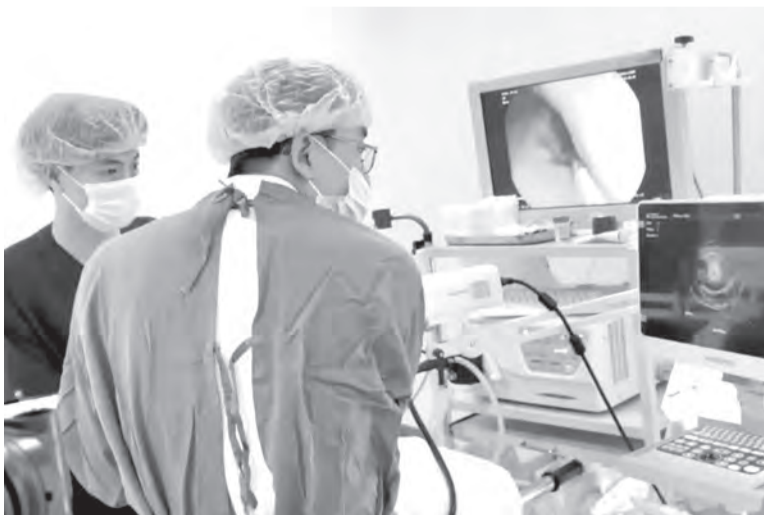
● Bác sĩ Bệnh viện 22-12 thực hiện nội soi Mini Probe cho bệnh nhân.

qua kênh làm việc của ống nội soi thông thường, mang lại hình ảnh độ phân giải cao, đảm bảo thủ thuật nhẹ nhàng, nhanh chóng. Với khả năng phát sóng siêu âm ở tần số cao (12-20 MHz), Mini Probe giúp khảo sát chính xác các tổn thương nông trong phạm vi 2 - 3cm, đặc biệt hữu ích trong việc đánh giá u dưới niêm, loại tổn thương mà các phương pháp nội soi thông thường khó xác định được nguồn gốc".