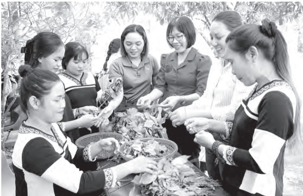
● Cán bộ, hội viên phụ nữ xã Cam Hiệp cùng nhau chuẩn bị món ăn truyền thống của đồng bào Raglai tại Ngày hội Văn hóa các dân tộc.