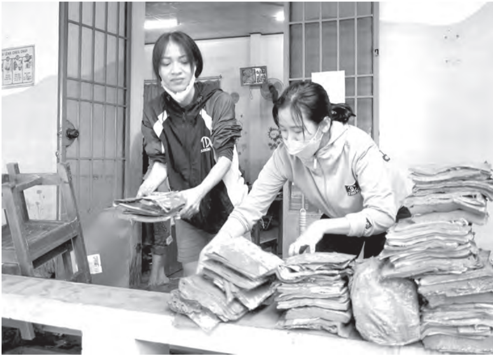
● Hầu hết sách, tài liệu tại thư viện Trường Tiểu học thị trấn Diên Khánh 2 đều bị ướt, hỏng.

Đến ngày 24-11, toàn tỉnh có 70/798 cơ sở giáo dục chưa thể cho HS đi học trở lại do thiệt hại nặng, gồm 24 trường mầm non, 22 trường tiểu học, 15 trường THCS, 7 trường THPT, 2 trường trung cấp nghề. Tổng số HS chưa đến trường là 33.570 em. Thiệt hại của ngành Giáo dục ước tính đến thời điểm này hơn 80 tỷ đồng.