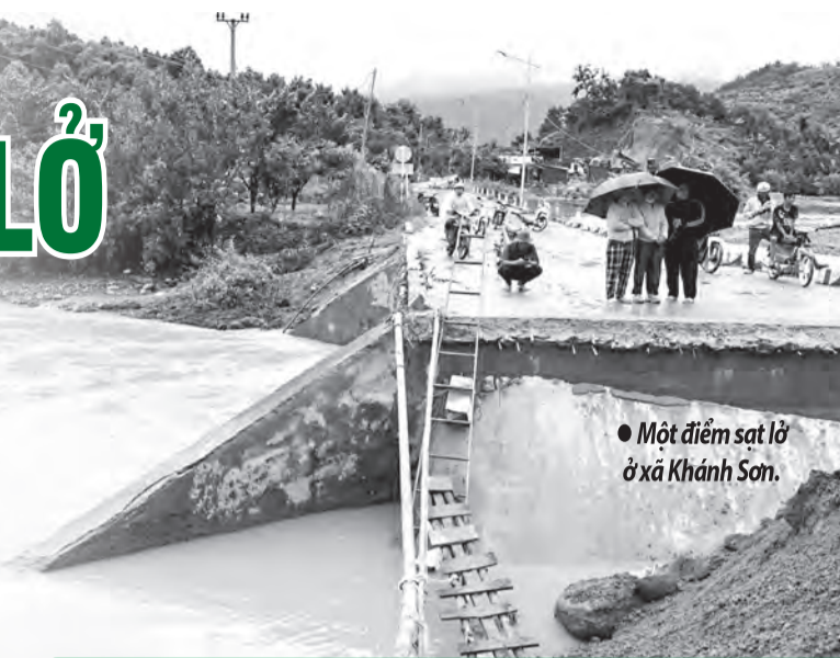
● Một điểm sạt lở ở xã Khánh Sơn.

Qua kiểm tra tình hình khắc phục hậu quả mưa lũ, sạt lở ở các xã khu vực Khánh Sơn mới đây, đồng chí Lâm Đông nhấn mạnh, những ngày tới, thời tiết còn diễn biến phức tạp, khả năng xuất hiện cơn bão mới. Do đó, các xã ở khu vực Khánh Sơn phải tiếp tục theo dõi diễn biến thời tiết để tập trung chỉ đạo ứng phó bảo đảm kịp thời, hiệu quả; đặc biệt, phải kiên quyết di dời tài sản và người dân ở vùng trũng thấp, khu vực có nguy cơ sạt lở đến nơi an toàn. Tại những khu vực có nguy cơ sạt lở cao trên tuyến Tỉnh lộ 9 và các tuyến đường liên thôn Hòn