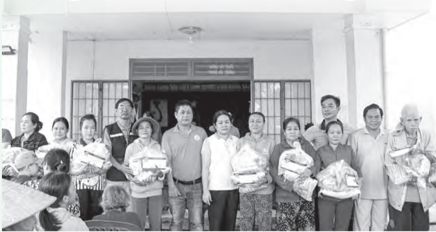
● Hội Liên hiệp Phụ nữ tỉnh và Câu lạc bộ Doanh nhân Khánh Hòa - Sài Gòn trao quà cho người dân xã Tân Định.

Trong những ngày qua, các cấp hội phụ nữ trên địa bàn tỉnh đã triển khai nhiều hoạt động thiết thực, kịp thời hỗ trợ người dân bị ảnh hưởng bởi mưa lũ. Qua đó, góp phần giúp người dân vượt qua giai đoạn khó khăn.