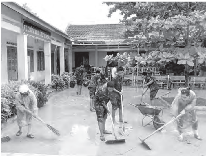
● Hỗ trợ vệ sinh tại Trường Tiểu học Diên Thọ.