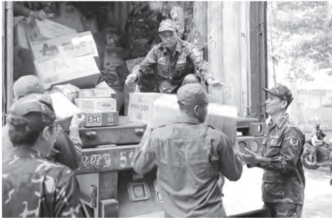
Các lực lượng tiếp nhận nhu yếu phẩm để phân bổ, vận chuyển đến các xã, phường.

Từ ngày 22 đến 24-11, Bộ Chỉ huy Quân sự tỉnh đã tổ chức tiếp nhận hơn 500 tấn hàng hóa cứu trợ do Ủy ban MTTQ Việt Nam TP. Hồ Chí Minh gửi tặng, nhằm hỗ trợ Nhân dân chịu thiệt hại nặng nề trong đợt mưa lũ vừa qua. Nguồn hàng cứu trợ gồm quần áo, chăn màn, nước uống, mì tôm, cùng một số loại vật dụng phục vụ