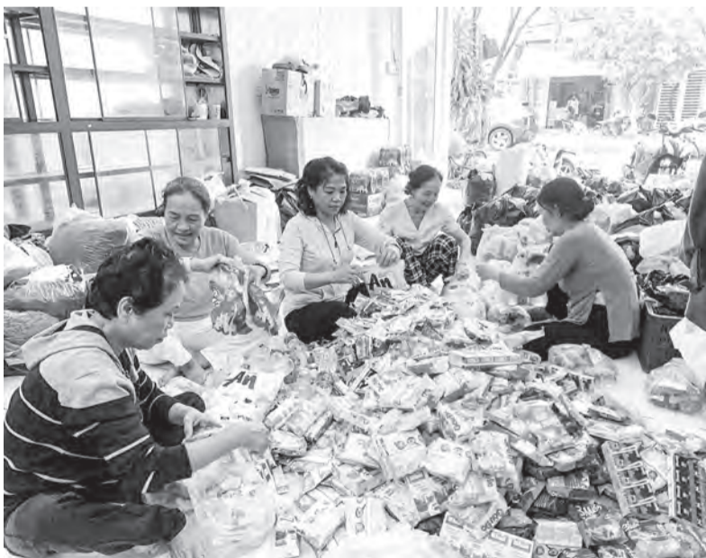
● Phụ nữ phường Nam Nha Trang đóng gói hàng hóa hỗ trợ người dân.