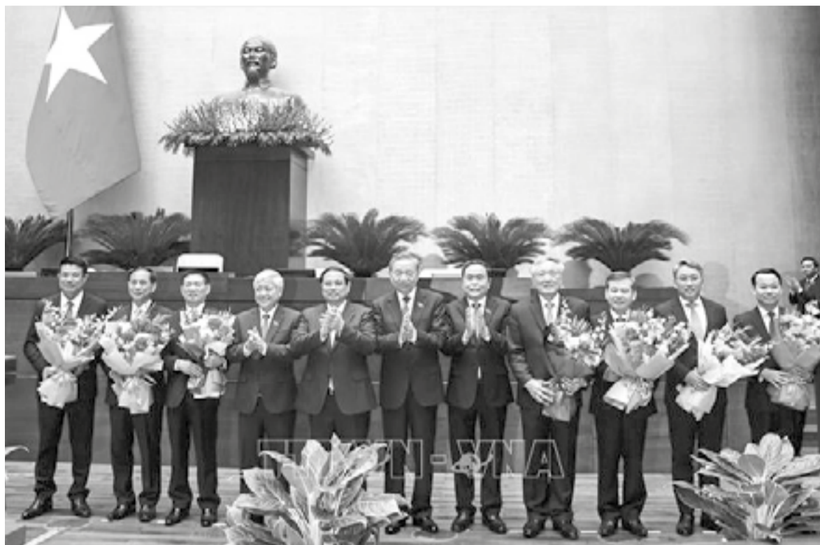
● Lãnh đạo Đảng, Nhà nước tặng hoa chúc mừng các tân Phó Thủ tướng, Bộ trưởng, Chánh án Tòa án nhân dân tối cao, Viện trưởng Viện Kiểm sát nhân dân tối cao.

Sáng 19-2, Kỳ họp bất thường lần thứ 9, Quốc hội khóa XV đã bế mạc sau 6,5 ngày làm việc nghiêm túc, dân chủ, đổi mới, khoa học, trách nhiệm cao, hoàn thành toàn bộ nội dung chương trình đề ra.