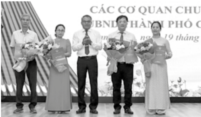
● Lãnh đạo TP. Cam Ranh trao quyết định bổ nhiệm các cán bộ lãnh đạo Văn phòng HĐND và UBND thành phố.

Tại kỳ họp, HĐND TP. Cam Ranh đã thông qua các nghị quyết về việc kết thúc hoạt động của các phòng: Y tế, Dân tộc, Kinh tế; hợp nhất Phòng Nội vụ trên cơ sở hợp nhất Phòng Nội vụ với Phòng Lao động - Thương binh và Xã hội và tiếp nhận chức năng về dân tộc của Phòng Dân tộc; tổ chức lại Văn phòng HĐND và UBND thành phố trên cơ sở tiếp nhận chức năng, nhiệm vụ của Phòng Y tế và chức năng bảo trợ xã hội, trẻ em và phòng, chống tệ nạn xã hội từ Phòng Lao động - Thương binh và Xã hội; tổ chức lại phòng Giáo dục và Đào tạo trên cơ sở tiếp nhận chức năng, nhiệm vụ về giáo dục nghề nghiệp từ Phòng Lao động - Thương binh và Xã hội; thành lập Phòng Nông nghiệp và Môi trường trên cơ sở tiếp nhận chức năng, nhiệm vụ của Phòng Tài nguyên và Môi trường, chức năng nhiệm vụ về nông nghiệp và phát triển nông thôn từ Phòng Kinh tế, chức năng, nhiệm vụ giảm nghèo từ Phòng Lao động - Thương binh và Xã hội; thành lập Phòng Kinh tế, Hạ tầng và Đô thị trên cơ sở tiếp nhận chức năng, nhiệm vụ của Phòng