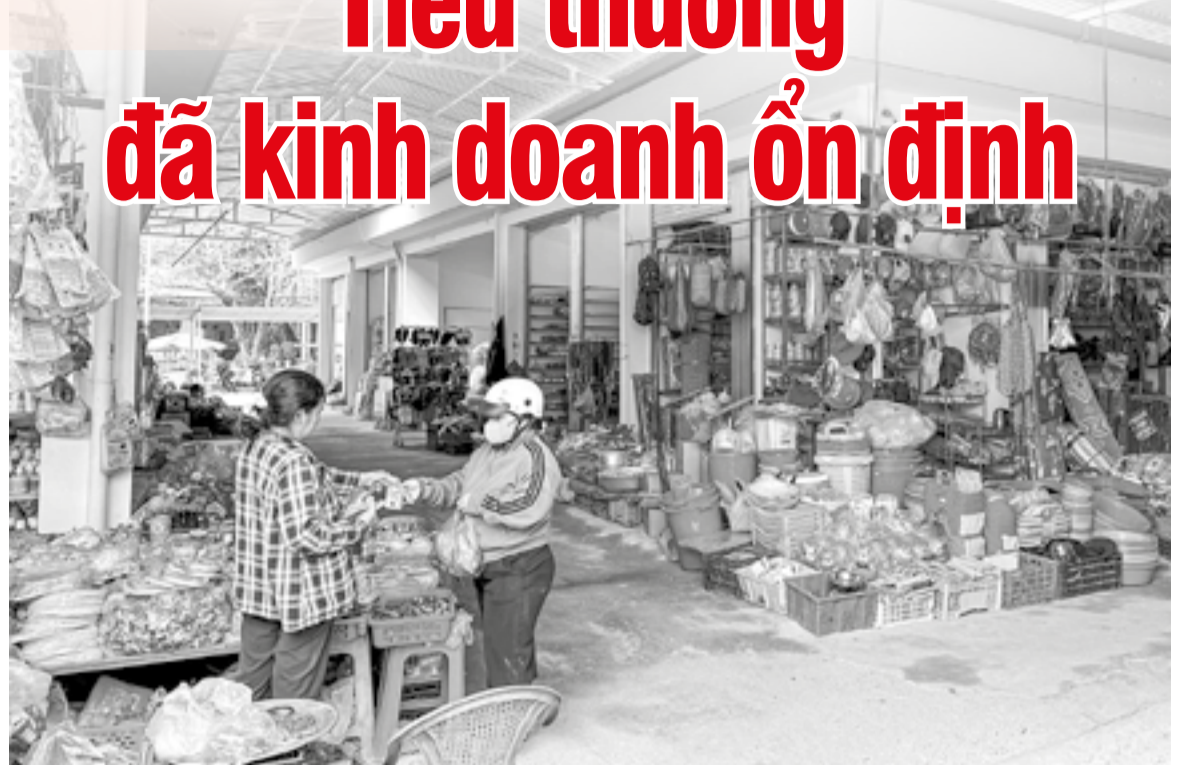
● Hoạt động kinh doanh tại chợ thị trấn Khánh Vĩnh.

thức bốc thăm theo nguyên tắc ưu tiên các tiểu thương đã kinh doanh tại chợ cũ, nếu có nhu cầu tiếp tục kinh doanh cùng ngành nghề sẽ được đăng ký kinh doanh theo khu vực ngành hàng và thực hiện bốc thăm chọn vị trí điểm kinh doanh. Sau khi đã sắp xếp xong tiểu thương cũ, tiểu thương mới sẽ được đăng ký và bố trí sắp xếp theo sơ đồ sắp xếp, bố trí khu vực kinh doanh (nếu số lượng tiểu thương mới đăng ký vượt quá số lượng điểm kinh doanh hiện có sẽ thực hiện lựa chọn theo hình thức bốc thăm).