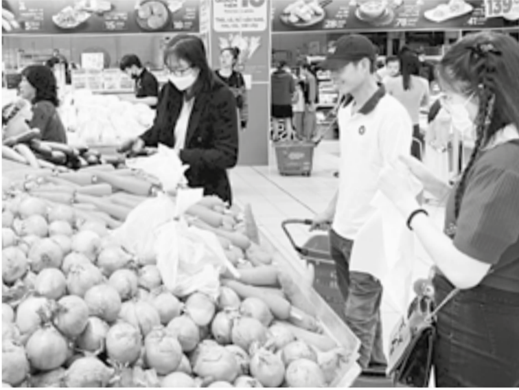
● Hoạt động kinh doanh tại một siêu thị ở TP. Nha Trang.

Bên cạnh đó, thực hiện công tác cải cách thủ tục hành chính, chuyển đổi số, ngành Thuế tỉnh đã tích cực xây dựng hệ sinh thái thuế điện tử hoàn thiện nhằm tăng trải nghiệm cho người nộp thuế (NNT), tối ưu hiệu quả