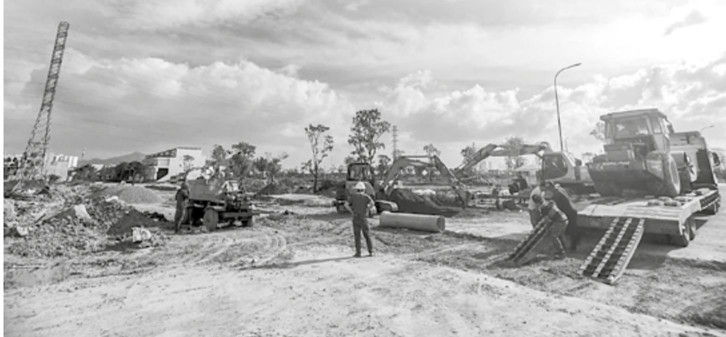
● Hiện trường thi công công trình.

Dự án Tu bổ, tôn tạo di tích Thành cổ Diên Khánh đã lựa chọn được nhà thầu và tổ chức thi công từ cuối tháng 1-2025. Đơn vị thi công đã tập kết thiết bị, tập trung nhân lực... để triển khai theo tiến độ hợp đồng. Tuy nhiên, dự án phát sinh một số khó khăn, vướng mắc, đặc biệt là công tác giải phóng mặt bằng.