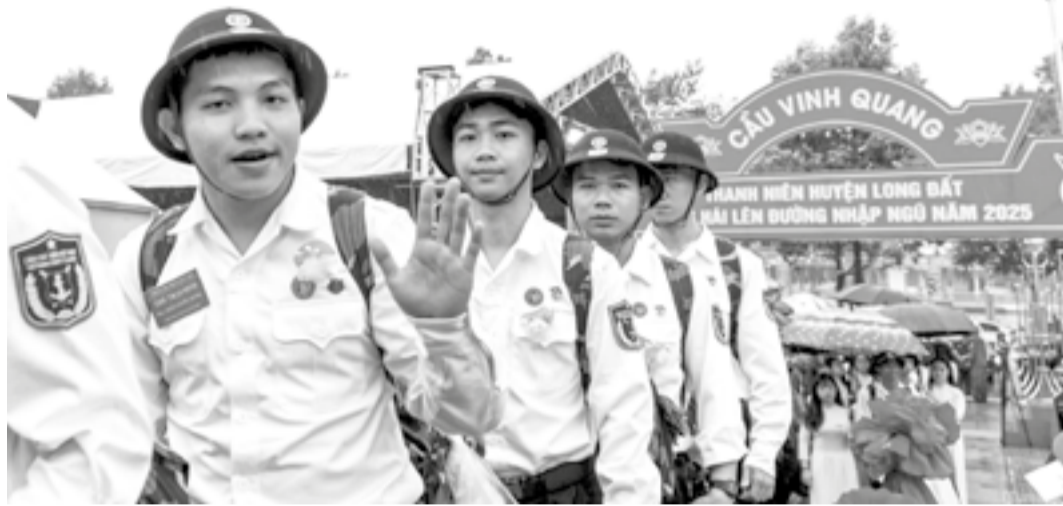
● Các chiến sĩ mới thuộc huyện Long Đất, tỉnh Bà Rịa - Vũng Tàu rạng rỡ gia nhập lực lượng Cảnh sát biển Việt Nam.

Nhiệm vụ tuyển chọn, gọi công dân nhập ngũ là nhiệm vụ quan trọng, khâu then chốt mang tính quyết định đến chất lượng đầu vào, một trong những yếu tố tạo nên sức mạnh tổng hợp của quân đội nói chung, lực lượng cảnh sát biển nói riêng. Những năm qua, Bộ Tư lệnh Vùng Cảnh sát biển 3 luôn thực hiện tốt công tác tuyển chọn, gọi công dân nhập ngũ, góp phần nâng cao chất lượng xây dựng, huấn luyện, sẵn sàng chiến đấu của đơn vị.