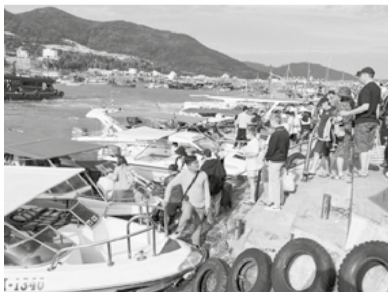
● Khách du lịch xuống tàu đi tour tham quan vịnh Nha Trang. Ảnh: X.T

Theo đại diện Cục Du lịch Quốc gia Việt Nam, kết quả tích cực mà ngành Du lịch có được trong thời gian qua là nhờ sự quan tâm chỉ đạo sát sao của Chính phủ với việc ban hành các chỉ thị, nghị quyết tạo thuận lợi cho du lịch phục hồi. Đặc biệt, chính sách thị thực thông thoáng là động lực quan trọng để thu hút khách quốc tế. Bên cạnh đó là hiệu quả đột phá của các