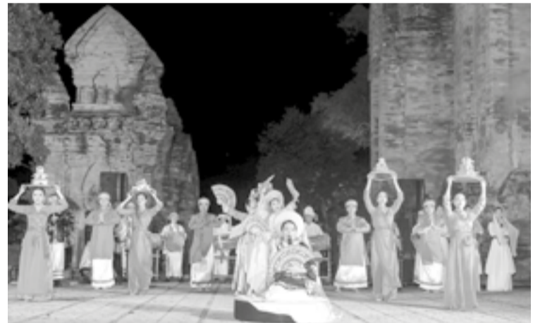
● Biểu diễn nghệ thuật phục vụ khách du lịch ở di tích quốc gia đặc biệt Tháp Bà Ponagar.

Hội thảo nhằm góp phần đẩy mạnh công tác bảo tồn, phát huy những giá trị tiềm năng của di sản văn hóa tiêu biểu, đặc sắc trên địa bàn tỉnh, gắn với phát triển du lịch bền vững trong giai đoạn hội nhập, phát triển kinh tế - xã hội của tỉnh để thực hiện thắng lợi Nghị quyết số 09 của Bộ Chính trị về xây dựng, phát triển tỉnh Khánh Hòa đến năm 2030, tầm nhìn đến năm 2045. Đây cũng là dịp để các nhà quản lý, nhà khoa học trong và ngoài nước trao đổi, đưa ra những giải pháp bảo tồn, phát huy giá trị văn hóa gắn với phát triển du lịch.