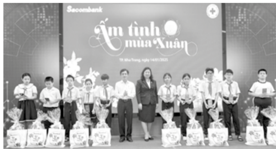
● Đại diện Ngân hàng Nhà nước Chi nhánh tỉnh Khánh Hòa và Sacombank trao tặng quà Tết cho học sinh.

Sáng 14-1, Hội Liên hiệp Phụ nữ phường Vĩnh Nguyên (TP. Nha Trang) phối hợp với Đoàn phường tổ chức chương trình văn nghệ "Mừng Đảng - mừng xuân Ất Tỵ năm 2025". Tham gia chương trình có 180 cán bộ, hội viên phụ nữ và đoàn viên, thanh niên trên địa bàn phường. Dịp này, Hội Liên hiệp Phụ nữ phường đã trao tặng 8 suất học bổng (500.000 đồng/suất) cho học sinh có hoàn cảnh khó khăn; trao 3 phương tiện sinh kế (3 triệu đồng/suất) cho phụ nữ có hoàn cảnh khó khăn và 100 suất quà (250.000 đồng/suất) cho phụ nữ mắc bệnh hiểm nghèo, khuyết tật. Tổng trị giá các phần quà 38 triệu đồng, do mạnh thường quân hỗ trợ. Bên cạnh đó, hội cũng phối hợp với Ngân hàng Thương mại Cổ phần Kiên Long phòng giao dịch Bình Tân (TP. Nha Trang) tổ chức chương trình "San sẻ yêu thương - Thêm hương ngày Tết" và tặng 50 suất quà (500.000 đồng/suất) cho phụ nữ có hoàn cảnh khó khăn.