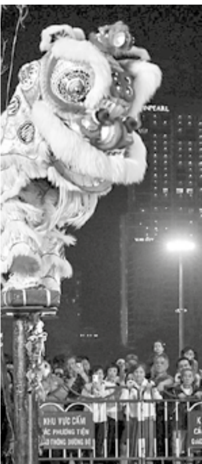
trên trụ sắt của một đội thi.