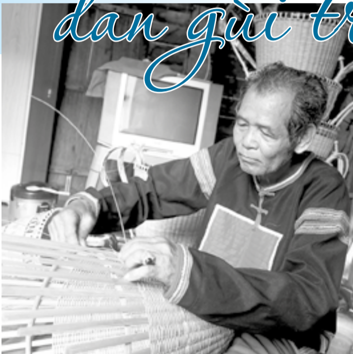
● Đan gùi đòi hỏi sự tỉ mỉ, kiên nhẫn, khéo léo.