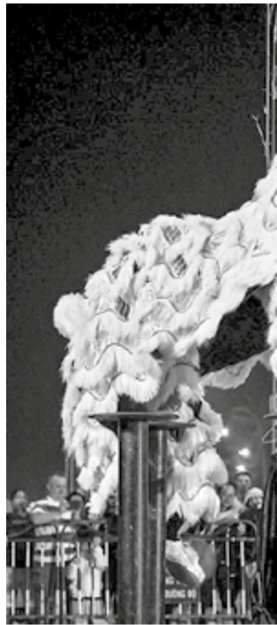
● Màn biểu diễn lân đứng

Những ngày qua, Quảng trường 2 tháng 4 (TP. Nha Trang) sôi nổi, rộn ràng hơn với hội thi Lân - sư - rồng TP. Nha Trang lần thứ 29 -