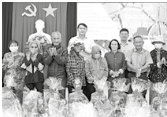
● Lãnh đạo Ban Nội chính Tỉnh ủy và Báo Khánh Hòa trao quà cho người dân.

Ngày 14-1, các đơn vị giúp đỡ xã Suối Cát, gồm: Báo Khánh Hòa (trưởng nhóm); Ban Nội chính Tỉnh ủy; Ngân hàng Đầu tư và Phát triển Việt Nam Chi nhánh Khánh Hòa; Công ty TNHH Long Sinh; Công ty Cổ phần Bảo hiểm Ngân hàng Nông nghiệp và Phát triển nông thôn Chi nhánh Khánh Hòa;