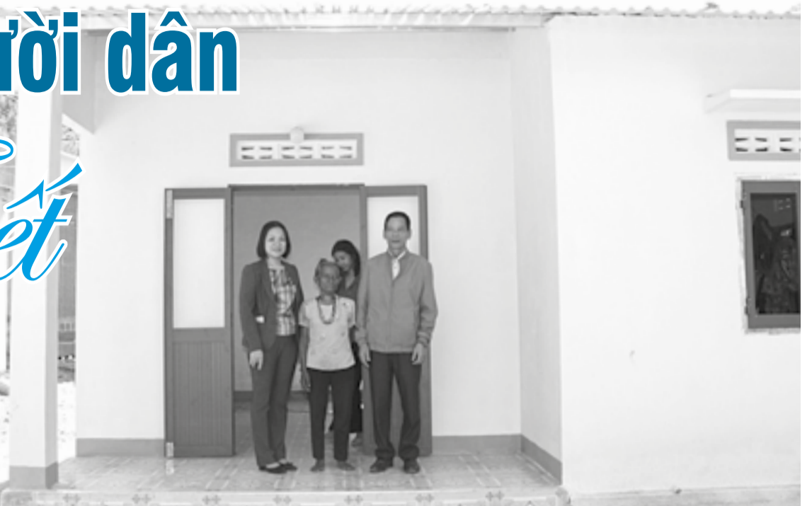
● Việc hỗ trợ sửa chữa nhà cho một số hộ dân ở thị trấn Tô Hạp (huyện Khánh Sơn) đã hoàn thành.

Thực hiện chỉ đạo của Tỉnh ủy, UBND tỉnh, UBMTTQ Việt Nam tỉnh, các cấp, ngành, địa phương đang khẩn trương triển khai hỗ trợ sửa chữa gần 800 căn nhà cho hộ nghèo, hộ cận nghèo. Với sự vào cuộc đồng bộ, quyết liệt, trách nhiệm của cả hệ thống chính trị từ tỉnh đến cơ sở, công tác sửa chữa nhà ở sẽ hoàn thành trước Tết Nguyên đán Ất Ty 2025.