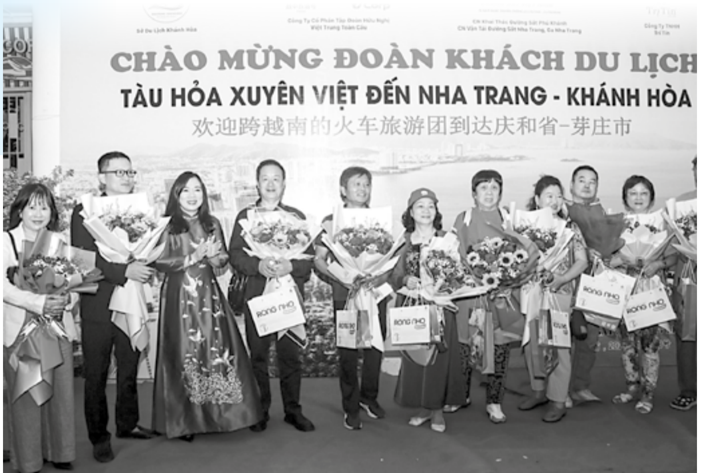
● Lãnh đạo Sở Du lịch tặng hoa chào mừng đoàn khách Trung Quốc đi tour du lịch bằng tàu hỏa đến Khánh Hòa.