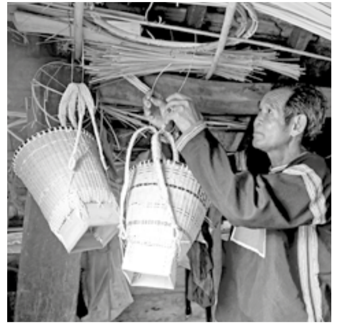
● Gùi được gác trên bếp lửa sẽ thêm cứng cáp, bền chắc.