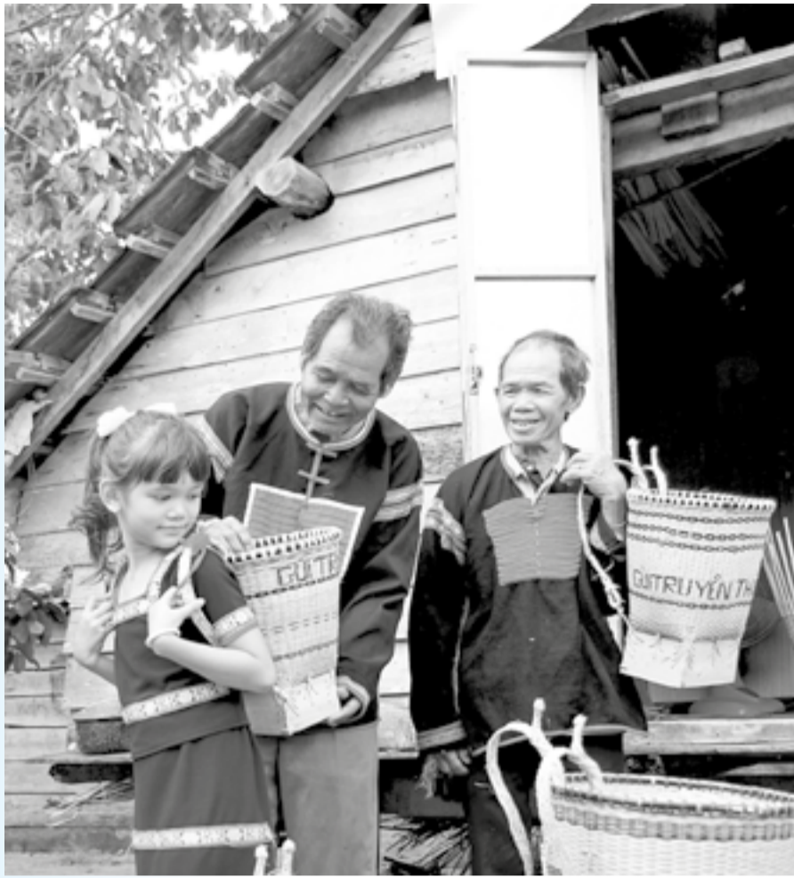
● Niềm vui khi thử chiếc gùi mới.