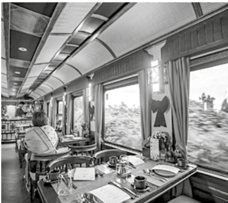
● Tàu Sjourney được thiết kế sang trọng như khách sạn 5 sao.