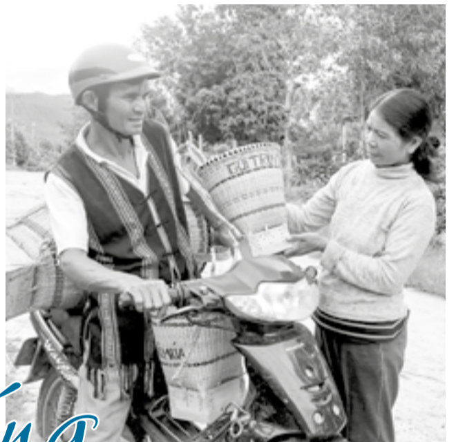
● Chiếc gùi của đồng bào Ê đê được người dân lựa chọn.