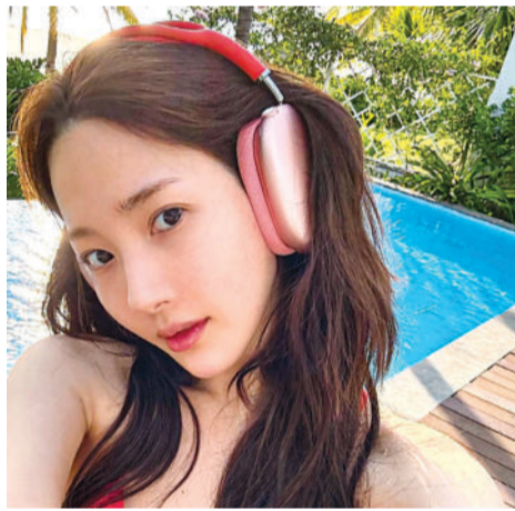
● Những hình ảnh diễn viên Park Min Young nghỉ dưỡng ở Nha Trang đã thu hút sự chú ý của khách Hàn Quốc.