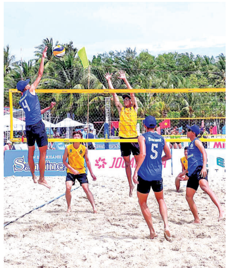
● Môn bóng chuyền bãi biển tỉnh đang gặp nhiều khó khăn sau khi doanh nghiệp ngừng tài trợ.

Bên cạnh đó, từ trước đến nay, nhờ có sự đồng hành, tài trợ của doanh nghiệp, các môn bóng chuyền trong nhà, bóng chuyền bãi biển, bóng đá futsal