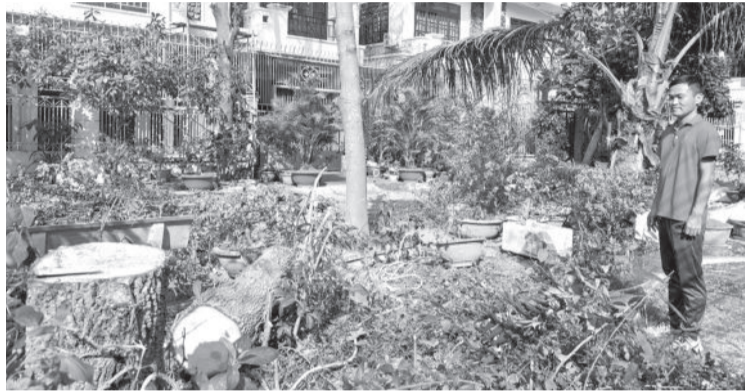
● Nhiều cây xanh tại công viên chung cư Hưng Phú bị đốn hạ.

Những ngày qua, một số cư dân chung cư Hưng Phú (phường Vinh Hải, TP. Nha Trang) phản ánh, nhiều cây xanh lớn tại khu vực công viên của chung cư bị đốn hạ, ảnh hưởng đến cảnh quan môi trường xung quanh. Tuy nhiên, Ban quản trị chung cư lại nói rằng việc đốn hạ cây xanh làm đúng quy trình.