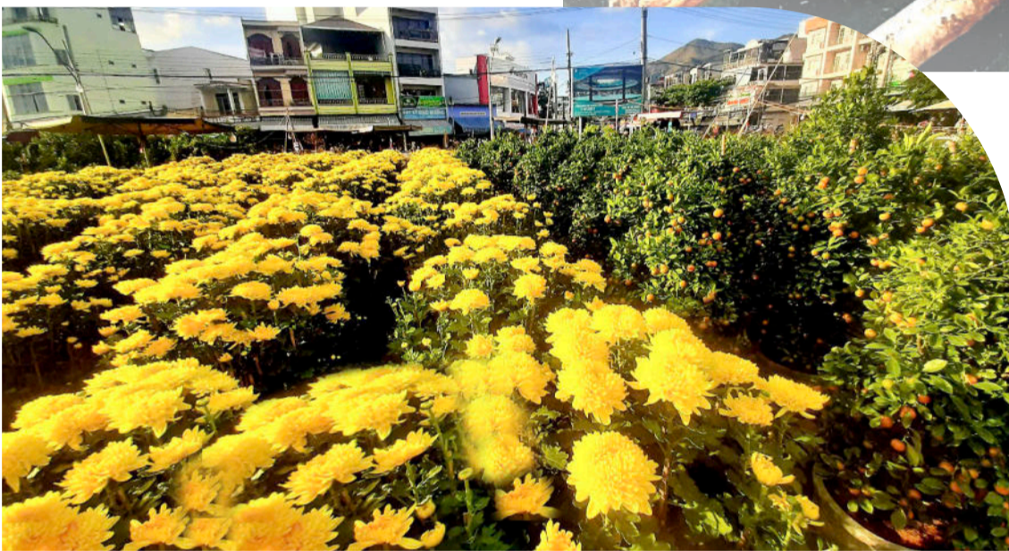
● ... hay vặt cúc vàng những chiều cuối năm khiến lòng người cũng nôn nao Tết.

Khi mùa mưa đã qua, trời bắt đầu ấm với màu nắng vàng rực như hoa cúc và những cơn gió lạnh se se là thấy Tết. Những ngày này tiết trời lạ lẫm, buổi sáng trời âm u một màu xám buồn buồn, cứ tưởng mưa sẽ rơi bất kỳ lúc nào. Nhưng rồi mặt trời cũng lên, chỉ là rất muộn, qua nửa buổi sáng mới thấy he hé một chút trời xanh và ánh mặt trời ấm áp. Cứ thế ngày mới bắt đầu, nắng rất nhạt không đủ khô áo quần mùng mền nhà ai đang hong nắng và một ngày cũng ngắn đi, chưa được bao nhiêu đã thấy buổi chiều.