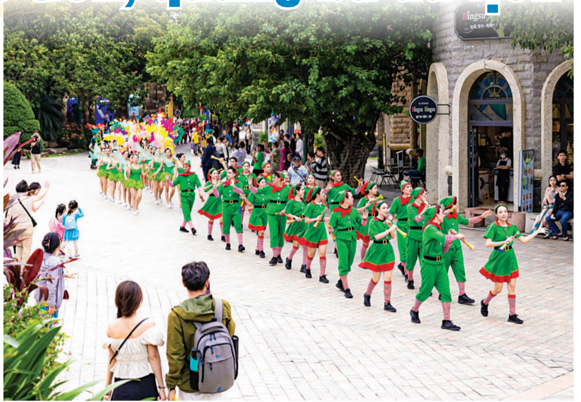
● Các vũ công VinWonders Nha Trang biểu diễn phục vụ du khách.

Để thu hút và đa dạng hóa nguồn khách quốc tế, thời gian tới, ngành Du lịch Khánh Hòa sẽ tiếp tục đổi mới công tác xúc tiến quảng bá; trong đó có việc liên kết, hợp tác với ngành Du lịch các tỉnh: Lâm Đồng, Đắk Lắk, Ninh Thuận, Phú Yên để xúc tiến, quảng bá du lịch. Hiện tại, Sở Du lịch đã tính phương án liên kết với các địa phương lân cận để tổ chức các chuyến đi xúc tiến ở nước ngoài thay vì đi đơn lẻ như hiện nay. Khách quốc tế bay đến Cam Ranh không chỉ được tận hưởng vẻ đẹp của biển xanh, cát trắng, nắng