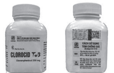
● Viên nén Clorocid TW3 (Cloramphenicol 250 mg) loại thuốc kháng sinh bị làm giả thời gian gần đây.

Sở Y tế giao Thanh tra sở phối hợp với phòng y tế các huyện, thị xã, thành phố, cơ quan chức năng tiến hành kiểm tra các cơ sở kinh doanh thuốc trên địa bàn; điều tra, xác minh thông tin và truy tìm nguồn gốc các thuốc giả nêu trên, xử lý nghiêm các tổ chức, cá nhân vi phạm. Đồng thời, tiếp tục triển khai thực hiện nghiêm Chỉ thị 17/2018 của Thủ tướng Chính phủ về tăng cường đấu tranh chống buôn lậu, gian lận thương mại, sản xuất, kinh doanh hàng giả, hàng kém chất