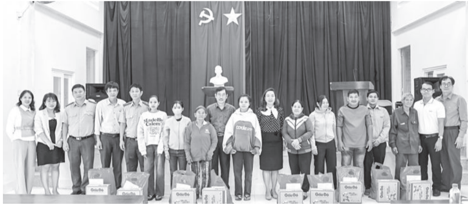
● Trao quà Tết cho các hộ dân có hoàn cảnh khó khăn ở xã Khánh Thành.

● Ngày 10-1, các đơn vị giúp đỡ xã Khánh Thành (huyện Khánh Vĩnh) do Sở Nông nghiệp và Phát triển nông thôn làm trưởng nhóm cùng các đơn vị: Chi cục Kiểm lâm tỉnh; Phân viện Thú y miền Trung; Phân viện Quy hoạch và Thiết kế nông nghiệp miền Trung; Công ty Bảo hiểm BIDV Nam Trung Bộ đã tổ chức đoàn đi thăm, chúc Tết và trao 60 phần quà gồm các nhu yếu phẩm, mỗi phần quà trị giá 400.000 đồng cho 60 hộ gia đình có hoàn cảnh khó khăn trên địa bàn xã. (H.Đ)