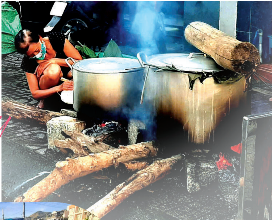
● Bát chọt bắt gập chiếc bếp lò đồ lửa...