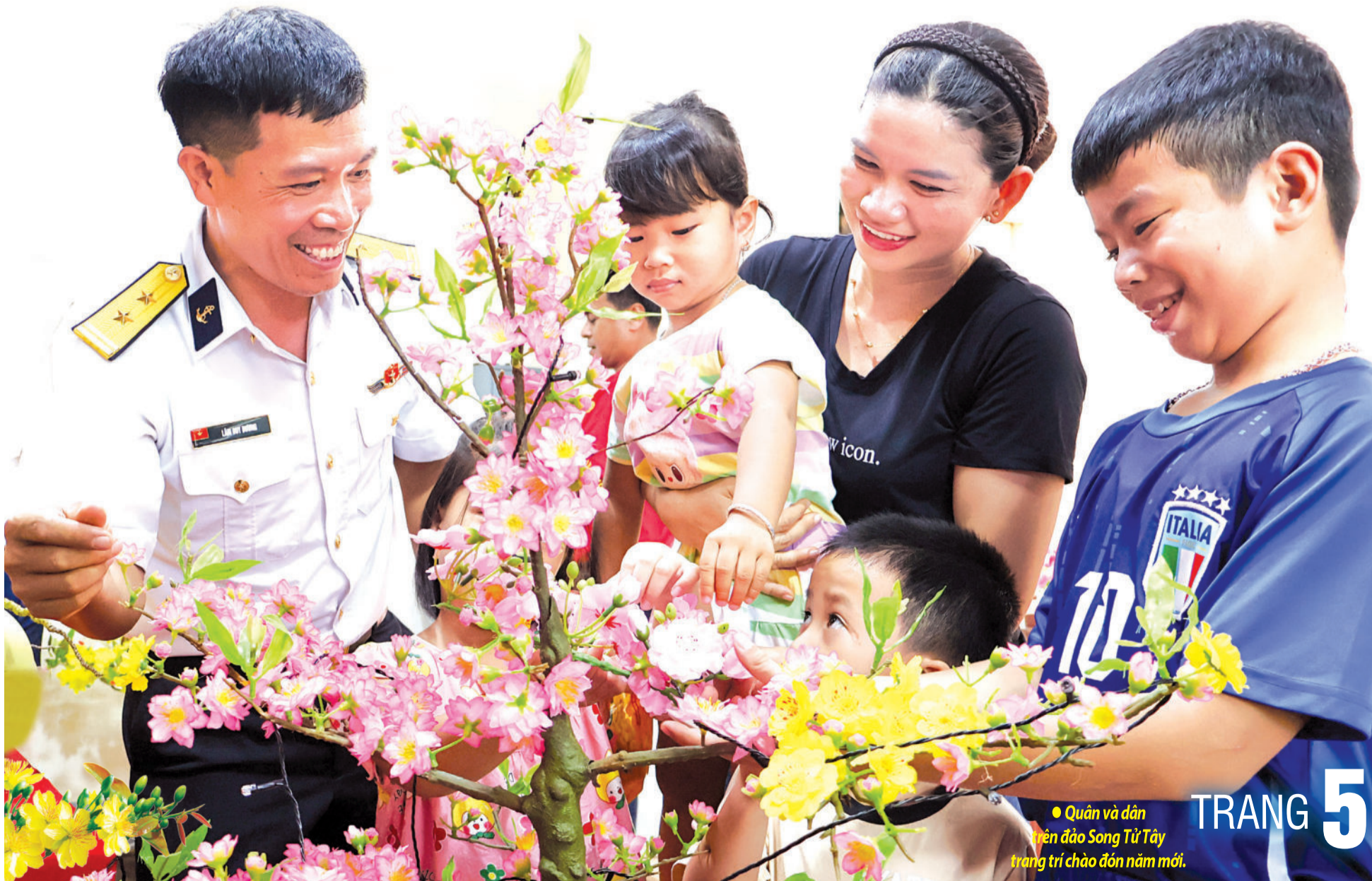
● Quân và dân trên đảo Song Tử Tây trang trí chào đón năm mới.