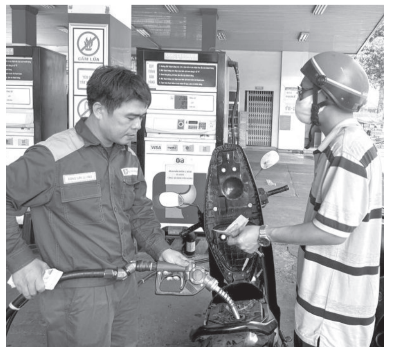
● Xăng, dầu, mỡ nhờn sẽ được giảm mức thuế bảo vệ môi trường trong năm 2025.