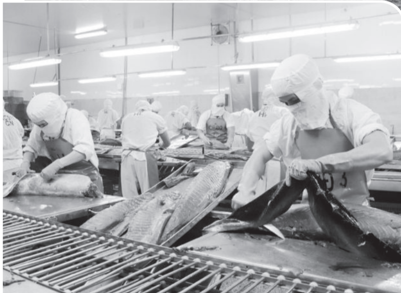
● Hoạt động chế biến thủy sản tại Công ty TNHH Hải Vương (Khu Công nghiệp Suối Dầu, huyện Cam Lâm).

doanh nghiệp để khôi phục hoạt động sản xuất, kinh doanh. Lãnh đạo tỉnh đã tập trung chỉ đạo đẩy nhanh tiến độ hoàn thành đối với các dự án xây dựng cơ sở hạ tầng các khu công nghiệp (KCN), cụm công nghiệp (CCN) đang triển khai và đẩy mạnh thu hút đầu tư thứ cấp vào các KCN, CCN đã được hoàn thiện cơ sở hạ tầng. Cùng với đó, tỉnh cũng đẩy nhanh việc khuyến khích doanh nghiệp phát triển, ứng dụng công nghệ chế biến, chế tạo thông minh để tạo bước đột phá về năng lực sản