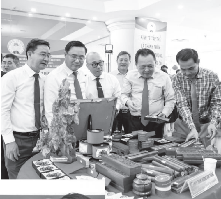
● Sản phẩm trầm hương Vạn Thắng tham gia quảng bá tại Nha Trang.

Đến với làng trầm hương thôn Phú Hội 1, xã Vạn Thắng, huyện Vạn Ninh thời điểm này, giữa hương trầm thoang thoảng như đượm vào mỗi nếp nhà, ngõ xóm, hoạt động chế tác trầm cũng trở nên sôi động phục vụ cho thị trường Tết Nguyên đán đang đến gần.