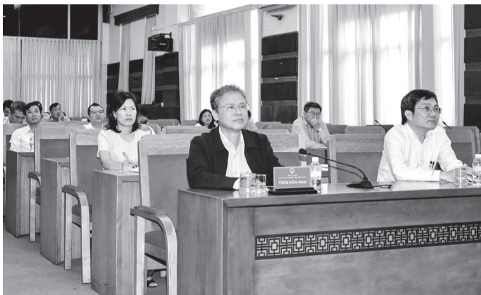
● Quang cảnh tại điểm cầu Khánh Hòa.