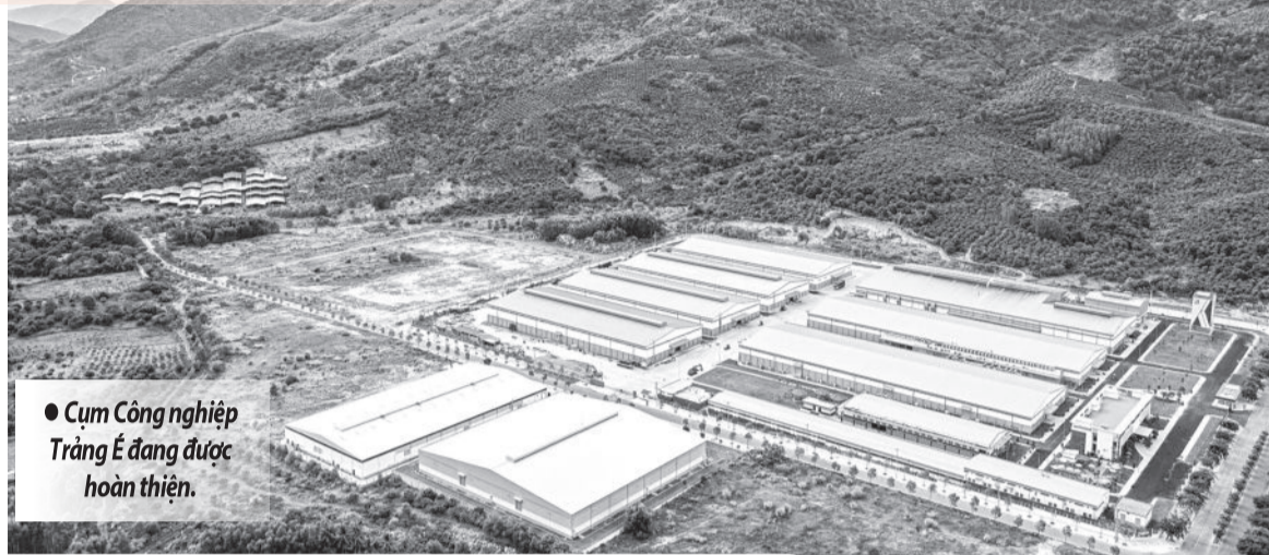
● Cụm Công nghiệp Trảng É đang được hoàn thiện.