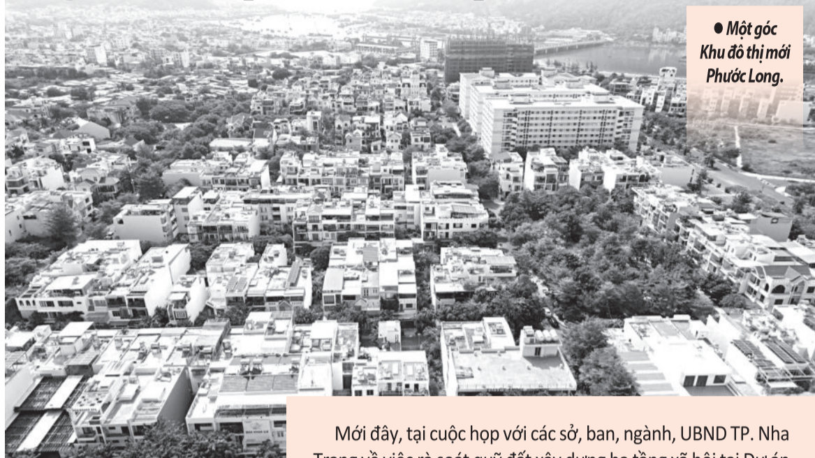
● Một góc Khu đô thị mới Phước Long.

Lãnh đạo Sở Xây dựng cho biết, đến thời điểm hiện nay, tại lô đất CC-01 đã xây dựng trụ sở Ban Quản lý Dịch vụ công ích TP. Nha Trang và cũng đã hoàn thành việc đấu tư, kết nối hạ tầng, trong đó giao lại cho cơ quan nhà nước hơn 1.300m 2 , còn lại đang bàn giao lại cho địa phương. Đối với lô đất xây dựng trụ sở văn phòng và nhà làm việc là Trụ sở Công ty Cổ phần Đầu tư phát triển nhà ở và đô thị HUD đã hoàn thành, đưa vào sử dụng. Các ô đất xây dựng nhà ở xã hội đã được chủ đầu tư hoàn thành và nghiệm thu bàn giao đưa vào sử dụng. Riêng đối với dự án chung cư thương mại đang được triển khai thi công, dự kiến hoàn thành công trình, nghiệm thu bàn giao đưa vào sử dụng trong quý IV/2025.