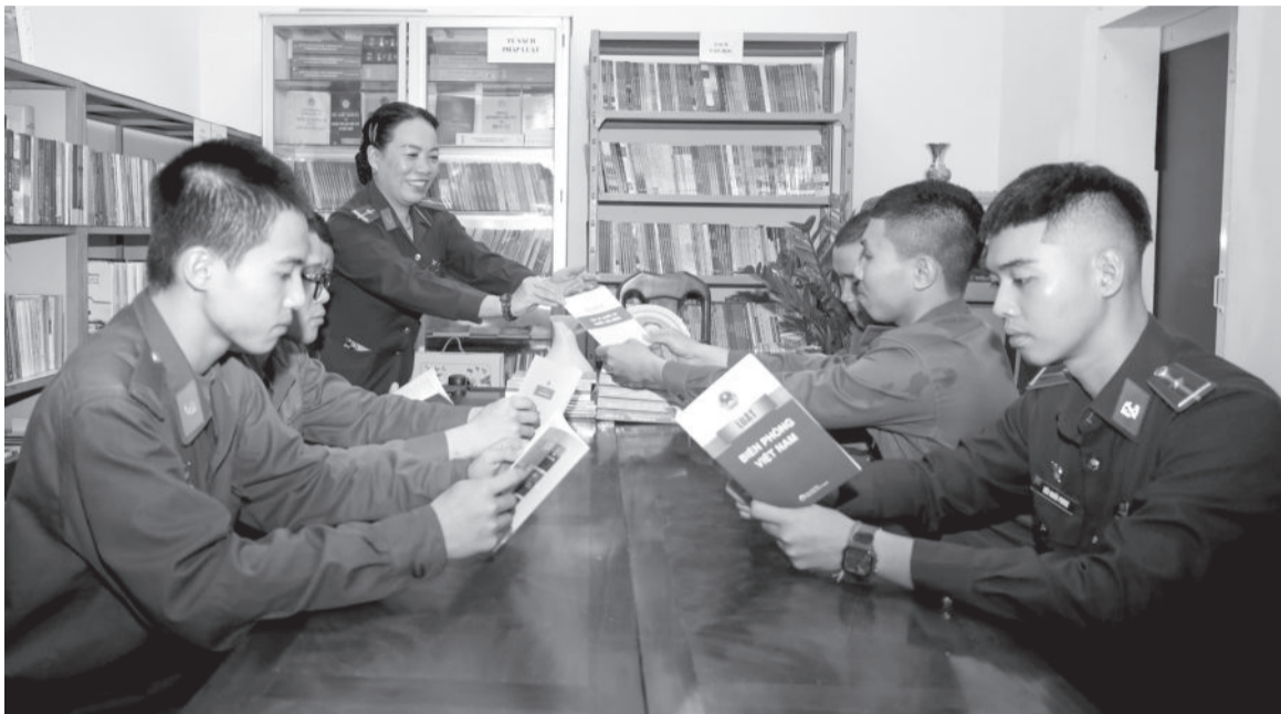
● Các chiến sĩ Bộ Chỉ huy Bộ đội Biên phòng tỉnh trong giờ đọc sách, báo, tài liệu.

Ngày 13-3-2019, Thủ tướng Chính phủ có Quyết định số 14 về xây dựng, quản lý, khai thác tủ sách pháp luật. Kết quả 5 năm thực hiện Quyết định số 14 khẳng định, tủ sách pháp luật đã góp phần đưa pháp luật vào cuộc sống. Tuy nhiên, để tủ sách pháp luật phát huy hiệu quả ở mọi cơ quan, đơn vị, địa phương, cần lựa chọn hình thức xây dựng tủ sách phù hợp với từng đối tượng, địa bàn.