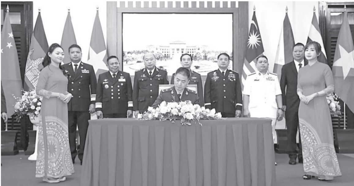
● Lãnh đạo lực lượng thực thi pháp luật trên biển các nước ghi cảm tưởng tại trụ sở Bộ Quốc phòng Việt Nam.

Diễn ra từ ngày 17 đến 21-12, chương trình giao lưu “Cảnh sát biển Việt Nam và những người bạn” lần thứ 2 năm 2024 đã khép lại, để lại những ấn tượng tốt đẹp trong lòng bạn bè quốc tế. Chương trình đã thực sự trở thành cầu nối, truyền đi thông điệp về tình đoàn kết mà Cảnh sát biển Việt Nam muốn gửi gắm tới bạn bè quốc tế; đồng thời khẳng định, Việt Nam sẵn sàng chung tay với chính phủ, nhân dân, lực lượng chức năng các nước xây dựng một vùng biển hòa bình, hữu nghị, ổn định, hợp tác và phát triển.