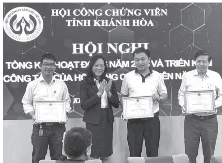
● Các tổ chức hành nghề công chứng được khen thưởng.

Năm 2025, hội tập trung vào triển khai thực hiện Luật Công chứng năm 2024, Luật Đất đai năm 2024, Luật Nhà ở, Luật Kinh doanh bất động sản và các luật khác liên quan đến hoạt động công chứng; tích cực tham gia các hoạt động, phong trào do Hiệp hội Công chứng viên Việt Nam phát động; tiếp tục củng cố, kiện toàn, nâng cao tổ chức và hoạt động của hội; giám sát việc tuân thủ pháp luật, tuân theo Quy tắc đạo đức hành nghề công chứng. Đồng thời, phối hợp tập huấn, bồi dưỡng nghiệp vụ cho hội viên; phối hợp với Sở Tư pháp tiến hành bảo trì phần mềm quản