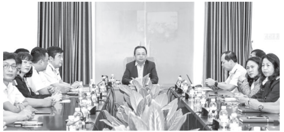
● Quang cảnh hội nghị tại điểm cầu Khánh Hòa.