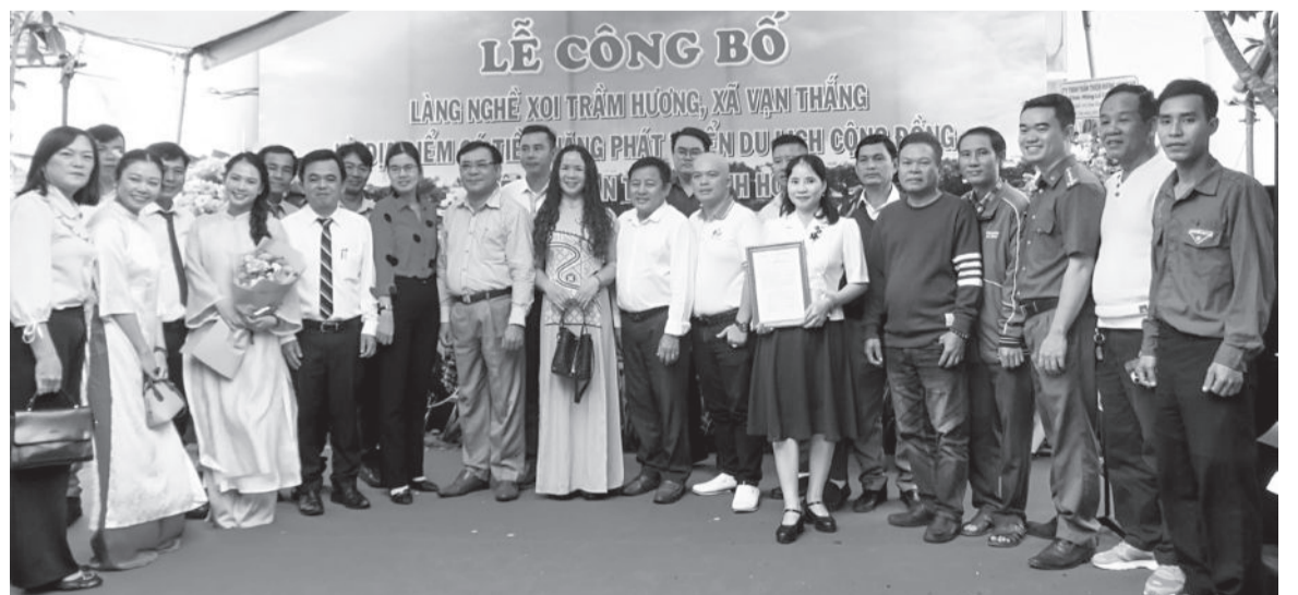
● Ra mắt Ban Quản lý du lịch cộng đồng làng nghề xoi trầm hương xã Vạn Thắng.