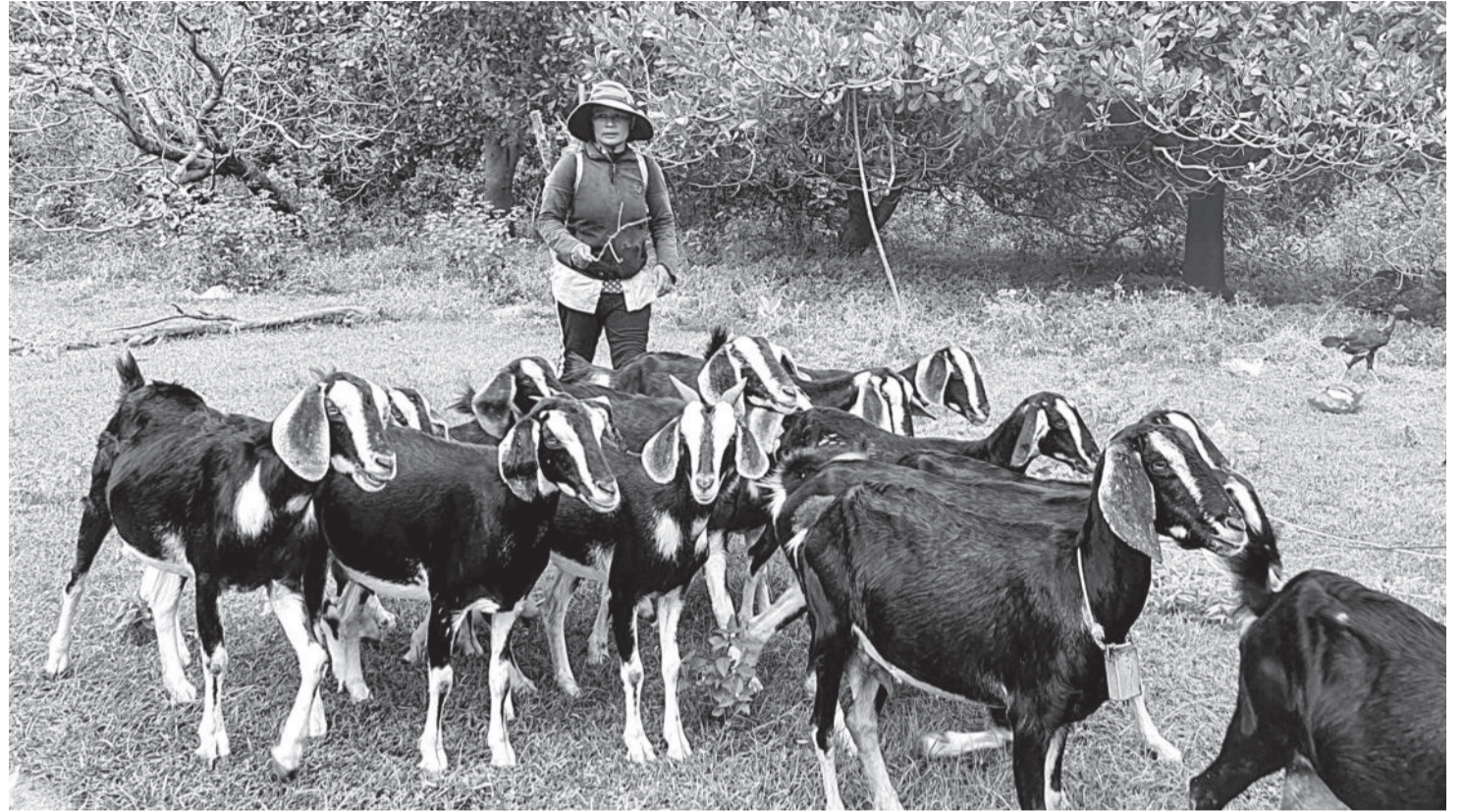
● Đàn dê của người dân xã Cam Thịnh Tây.

khăn. Từ khi được Nhà nước hỗ trợ dê giống, tôi quyết định trồng rừng trên 3 sào rẫy để có nơi chăn thả dê. Từ 3 con dê cái ban đầu, đến nay, gia đình đã có gần 30 con. Tôi đã bán 21 con dê đực, còn dê cái để lại nuôi. Dồn tiền bán dê cùng tiền tích góp được, đến cuối năm 2022, tôi vay thêm Ngân hàng Chính sách xã hội để xây dựng căn nhà kiên cố với chi phí khoảng 180 triệu đồng. Gia đình tôi có nhà mới, phấn khởi hơn nữa là đã thoát nghèo được 2 năm qua”, bà Tuyên chia sẻ.