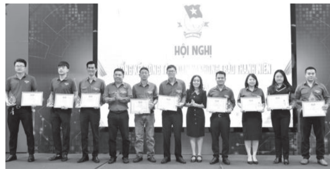
● Các đại biểu trao giấy khen của Đoàn Khối doanh nghiệp tỉnh cho các tập thể đạt thành tích xuất sắc.

Trong năm, các cơ sở đoàn đã tích cực đẩy mạnh hoạt động "Ngày Chủ nhật xanh", đồng loạt tổ chức ra quân sửa chữa và dọn vệ sinh, trồng cây xanh tạo cảnh quan tại đơn vị; đoàn khối thực hiện công trình thanh niên Thắp sáng đường quê bằng năng lượng xanh tại xã Sơn Trung, huyện Khánh Sơn với chiều dài 1km. Các cơ sở đoàn cũng triển khai nhiều hoạt động tình nguyện thiết thực như: Chi đoàn Công ty Cổ phần Cấp thoát nước Khánh Hòa tặng quà tại Trung tâm Bảo trợ xã hội huyện Khánh Sơn, Trường Mầm non Sơn Ca (huyện Khánh Sơn), Trung tâm Bảo trợ xã hội tỉnh với tổng trị giá hơn 82 triệu đồng; Đoàn cơ sở Ngân hàng Chính sách xã hội tỉnh tặng