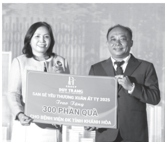
● Tặng quà cho bệnh nhân nghèo đang điều trị ở Bệnh viện Đa khoa tỉnh.