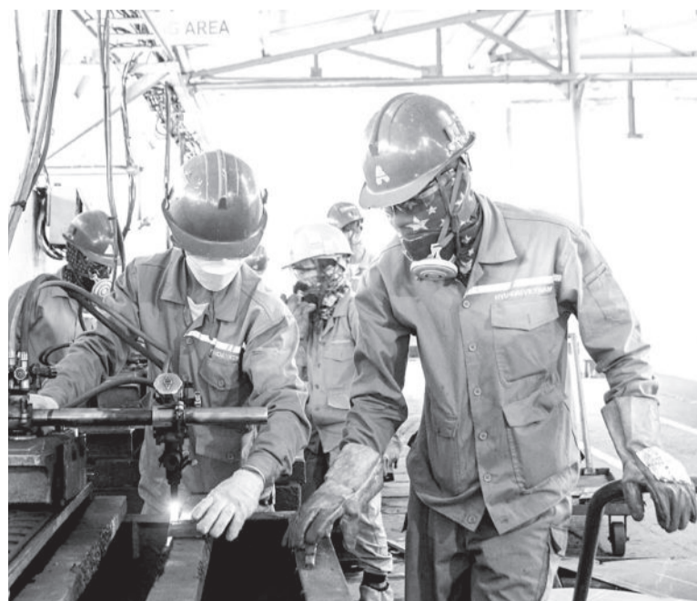
● Công nhân Công ty TNHH Đóng tàu HD Hyundai Việt Nam trong ca làm việc.

2024, hoạt động sản xuất, kinh doanh của đơn vị phát triển ổn định, dự kiến tổng doanh thu của đơn vị đạt hơn 500 tỷ đồng. Đạt được thành quả này có công sức đóng góp rất lớn của NLĐ. Do đó, chăm lo, bảo đảm quyền lợi, thu nhập cho NLĐ là trách nhiệm của doanh nghiệp. Để thay lời cảm ơn, tri ân NLĐ, vào dịp Tết, công ty đều có thưởng cho tất cả 143 công nhân. Mong rằng, NLĐ luôn tin tưởng, gắn bó và tiếp tục nỗ lực, đồng hành vì sự phát triển của công ty”.