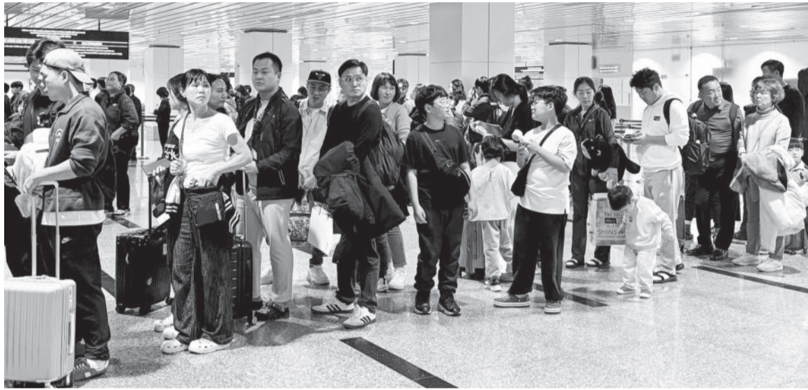
● Khách du lịch quốc tế tại Nhà ga quốc tế Cam Ranh.

Cùng với việc đề ra nhiều giải pháp linh hoạt tăng cường thu ngân sách nhà nước (NSNN), ngành Thuế tỉnh tập trung hỗ trợ, kịp thời tháo gỡ khó khăn, vướng mắc cho người nộp thuế (NNT) về chính sách, thủ tục hành chính... để NNT ổn định sản xuất kinh doanh, tạo nguồn thu bền vững. Nhờ vậy, thu NSNN năm 2024 do ngành Thuế tỉnh thực hiện đạt kết quả cao.