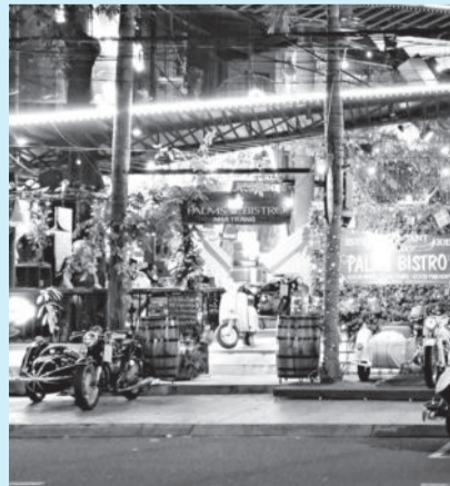
● Một quán cà phê ở đườ