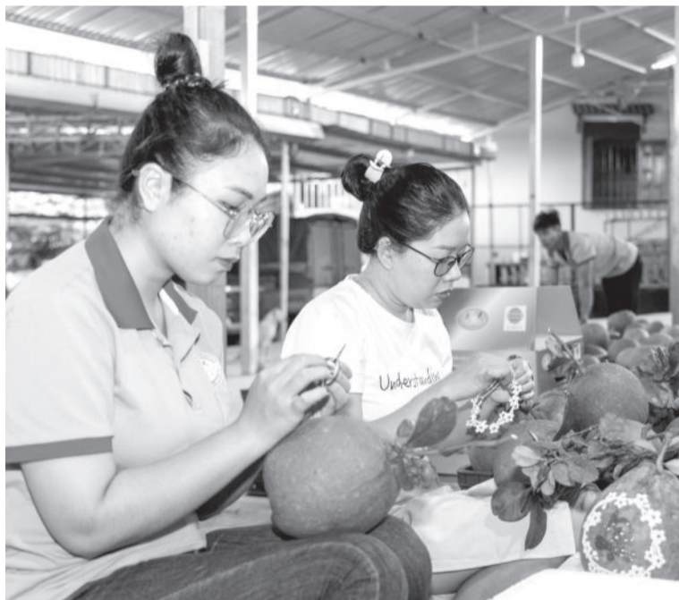
● Bưởi da xanh Khánh Vinh là một sản phẩm OCOP nổi bật.

Tại TP. Nha Trang, các sản phẩm từ yến sào từ lâu đã khẳng định được chất lượng, đa dạng trong mẫu mã, chủng loại. Trong khi đó, tại thị xã Ninh Hòa, nhiều sản phẩm đã "bước ra ánh sáng" một phần nhờ tham gia Chương trình OCOP, như: Xáo tam phân ở vùng núi Hòn Hèo nổi tiếng; rong nho vùng biển Ninh Hải đã bước ra thị trường quốc tế với hàng chục chủng loại sản phẩm; hay dưa xiêm Ninh Đa, Ninh Thọ..., các sản phẩm làm từ gà ri bản địa của Ninh Hòa đều được đánh giá cao ở chất lượng, nét đặc trưng riêng có. Còn tại vùng đất trầm hương ở Vạn Ninh, rất