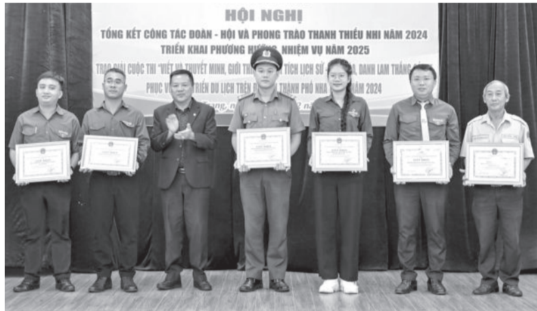
● Lãnh đạo TP. Nha Trang trao giấy khen của UBND thành phố cho các tập thể.