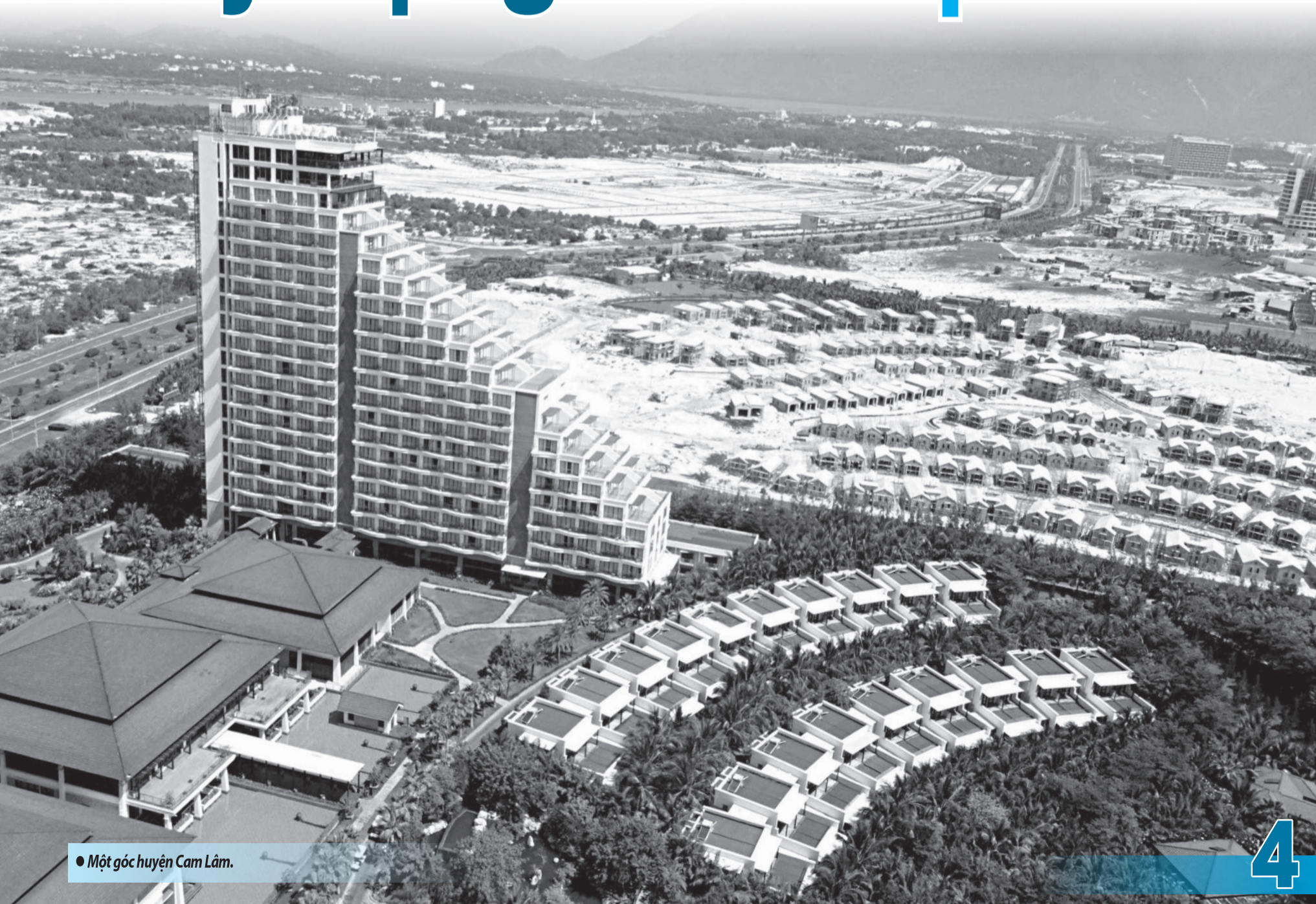
• Một góc huyện Cam Lâm.