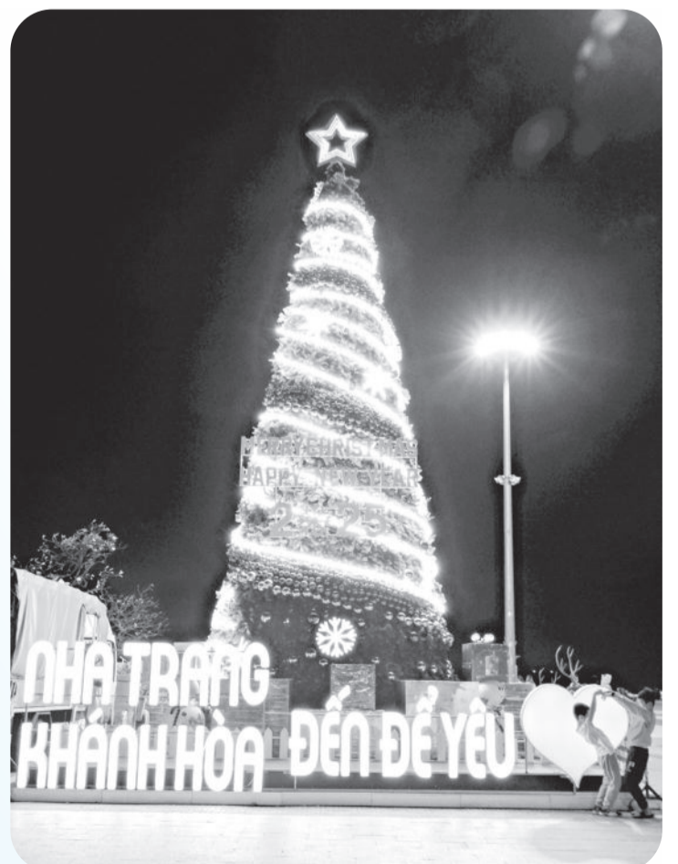
● Cây thông Noel lớn đặt tại Quảng trường 2 tháng 4 thu hút rất nhiều du khách và người dân địa phương đến check-in.

Báo Khanh Hoa thân mời các cộng tác viên, bạn đọc gửi ảnh cộng tác chuyên mục về địa chỉ email: gocanhcuocsongbkh@gmail.com.