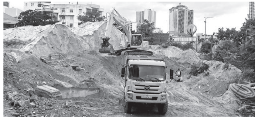
● Trong quá trình thi công Cung Văn hóa thiếu nhi tỉnh được phép khai thác, tận thu khoáng sản làm vật liệu xây dựng thông thường.

Sở Tài nguyên và Môi trường vừa có văn bản báo cáo UBND tỉnh về việc đính chính giấy phép khai thác khoáng sản trong Dự án Đầu tư xây dựng công trình Cung Văn hóa thiếu nhi tỉnh.