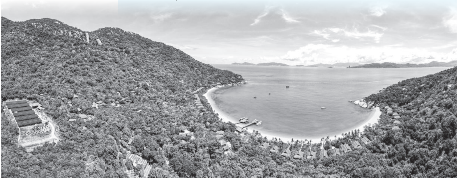
● Khu nghỉ dưỡng Six Senses Ninh Vân Bay được đầu tư xây dựng, vận hành theo xu hướng xanh, thân thiện môi trường.