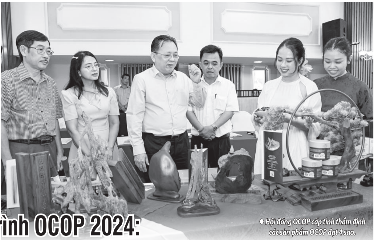
● Hội đồng OCOP cấp tỉnh thẩm định các sản phẩm OCOP đạt 4 sao.