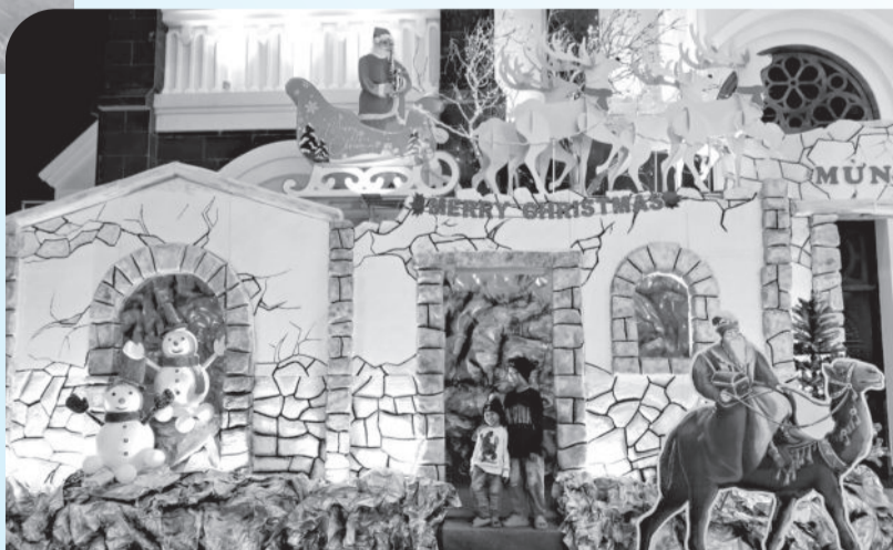
● Rực rỡ một góc đường Nguyễn Hữu Huân - Trần Nguyễn Hân.