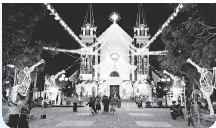
● Nhà thờ Giáo xứ Ba Làng trang trí thật lộng lẫy.