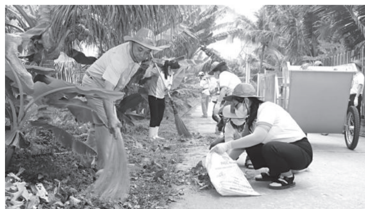
● Lãnh đạo và người lao động DT Group tham gia dọn dẹp vệ sinh đường làng thôn Đắc Lộc.

● Sáng 22-12, tại xã Vĩnh Phương, TP. Nha Trang, Công ty Cổ phần Yến sào DTNest Khánh