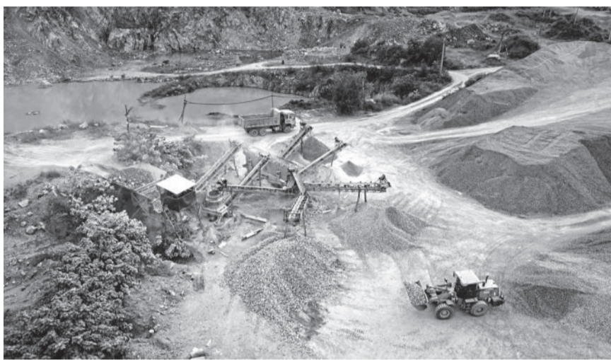
● Hoạt động khai thác tại một mỏ khoáng sản ở Diên Khánh.

công ty có phát sinh khoản nợ tiền cấp quyền khai thác khoáng sản, tiền thuê đất do nợ chây ì nhiều năm hoặc đang có vướng mắc đối với tiền thuê đất... Ngoài ra, các khoản tiền thuế được gia hạn theo Nghị định số 64/2024 của Chính phủ đã hết thời gian gia hạn trong tháng 12 (hạn nộp ngày 20-12-2024) nhưng người nộp thuế gặp khó khăn chưa kịp thời nộp vào ngân sách nhà nước... Tính đến ngày 31-12-2024, tổng số tiền nợ thuế ngành Thuế quản lý ước 1.808 tỷ đồng, tăng 28,4% so với thời điểm ngày 31-12-2023.