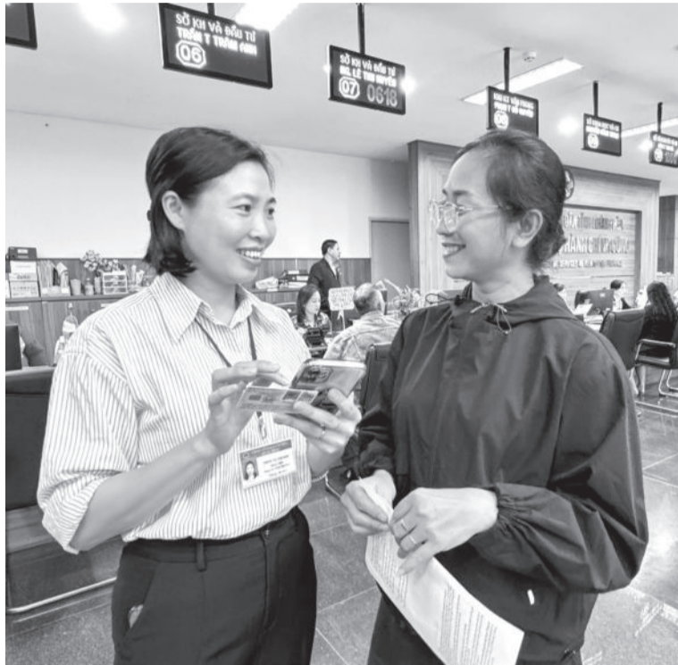
● Nhân viên Sở Tư pháp hướng dẫn người dân đăng ký cấp phiếu lý lịch tư pháp trực tuyến.

Năm 2024, công tác cải cách thủ tục hành chính (TTHC) của tỉnh đạt được những kết quả tích cực. Để tiếp tục nâng cao hiệu quả công tác này, góp phần phục vụ người dân tốt hơn, tỉnh đã kiến nghị Trung ương tháo gỡ một số vướng mắc trong quá trình thực hiện TTHC.