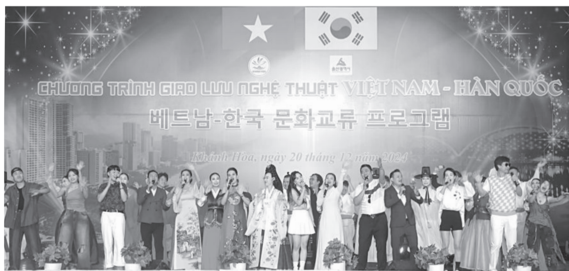
● Các nghệ sĩ của Đoàn Ca múa nhạc Hải Đăng và TP. Ulsan cùng hòa ca bài hát Việt Nam ơi!