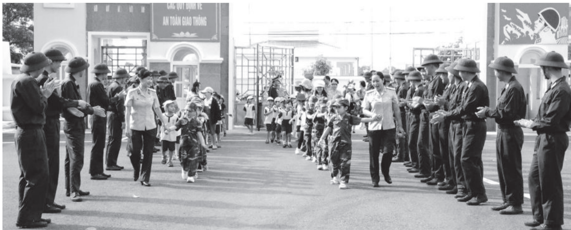
● Các cháu thiếu nhi đến thăm Sư đoàn Phòng không 377.

● Trường Tiểu học Vinh Hiệp (TP. Nha Trang) vừa tổ chức chương trình trải nghiệm "Về nguồn" tại Khu căn cứ cách mạng Đồng Bò (xã Phước Đồng, Nha Trang) cho học sinh. Tham gia chương trình, các học sinh và giáo viên đã dâng hương tại khu vực đài tưởng niệm; giao lưu ôn lại lịch sử, ý nghĩa 80 năm Ngày thành lập Quân đội nhân dân Việt Nam; giải mật thư, quét mã QR và ghép tranh tìm hiểu về Khu căn cứ cách mạng Đồng Bò; tham quan nhà truyền thống; hành quân lên gộp Mậu Thân, gộp Trạm Xá và tái hiện cảnh sơ cấp cứu của các chiến sĩ cách mạng. (Hoàng Ngân)