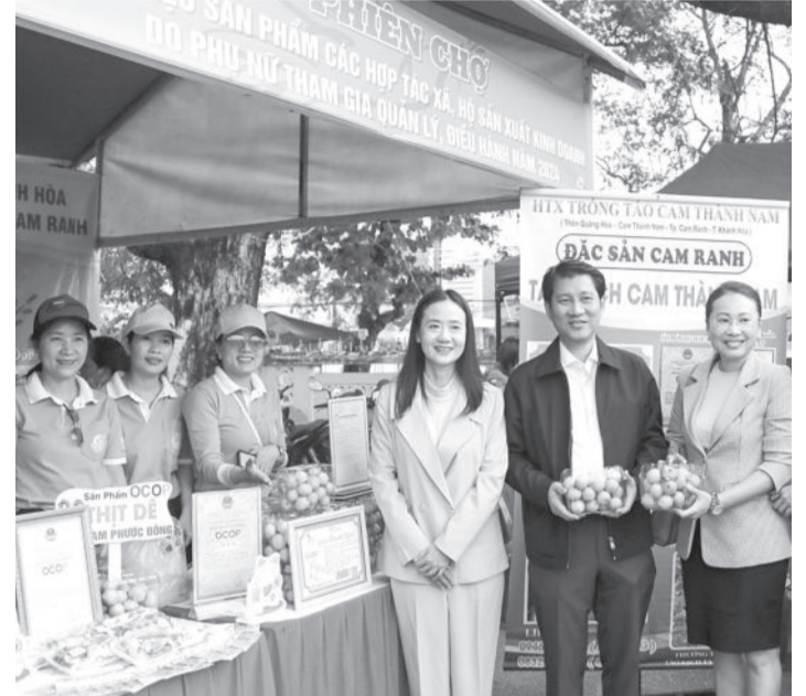
● Nhiều mặt hàng được giới thiệu tại phiên chợ.

Cuộc thi tác phẩm báo chí "Cùng giữ màu xanh của biển" lần thứ 2: