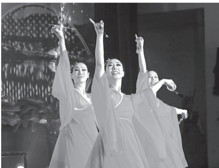
● Những vũ điệu truyền thống của đất nước Hàn Quốc.