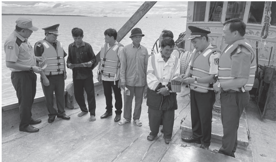
● Cán bộ, chiến sĩ làm nhiệm vụ kết hợp tuyên truyền pháp luật cho ngư dân trên biển.

Thời gian qua, Bộ Tư lệnh Vùng Cảnh sát biển 3 luôn chú trọng chỉ đạo các cơ quan, đơn vị đẩy mạnh công tác phổ biến, giáo dục pháp luật, tạo chuyển biến mạnh mẽ về ý thức chấp hành kỷ luật, thượng tôn pháp luật của cán bộ, chiến sĩ.