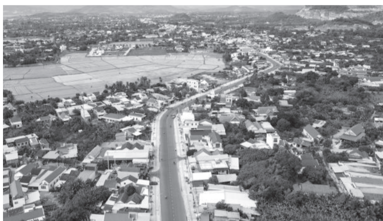
● Một góc huyện Diên Khánh.