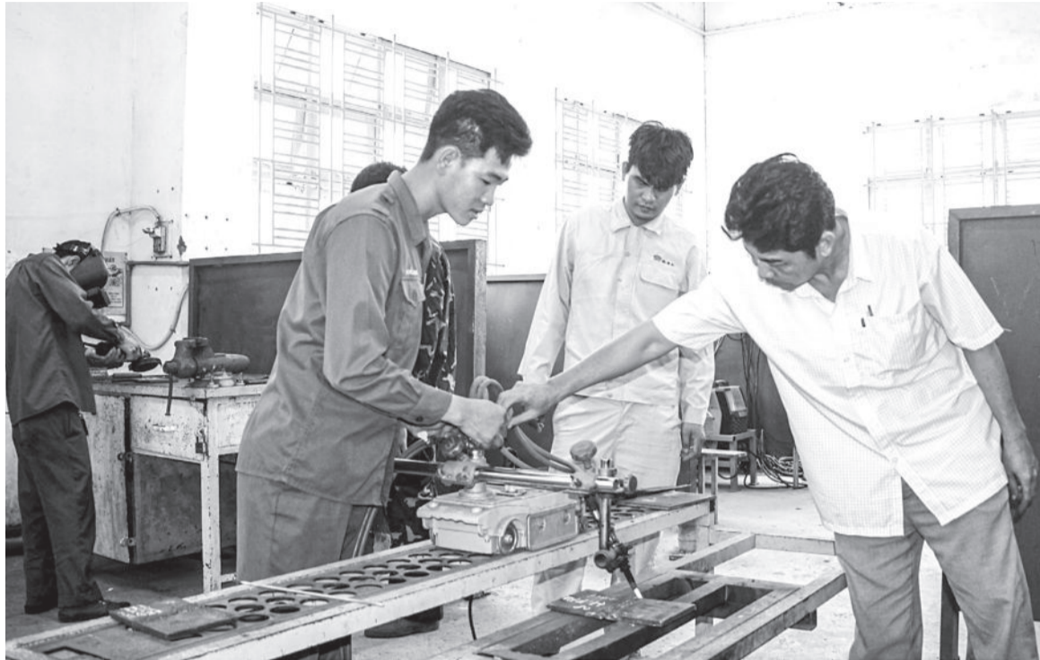
● Đào tạo nghề hàn cho lao động thị xã Ninh Hòa.

Những năm qua, cùng với chú trọng phát triển kinh tế, các huyện, thị xã, thành phố trong tỉnh luôn quan tâm triển khai thực hiện tốt các chính sách, giải pháp về lao động, người có công và xã hội. Qua đó, góp phần nâng cao chất lượng cuộc sống người dân, đảm bảo công tác an sinh xã hội trên địa bàn.