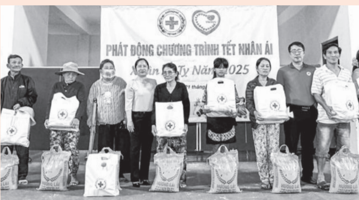
● Người dân xã Vinh Lương nhận các phần quà Tết.

● Ngày 21-12, Hội Chữ thập đỏ TP. Nha Trang tổ chức lễ phát động “Tết Nhân ái” năm