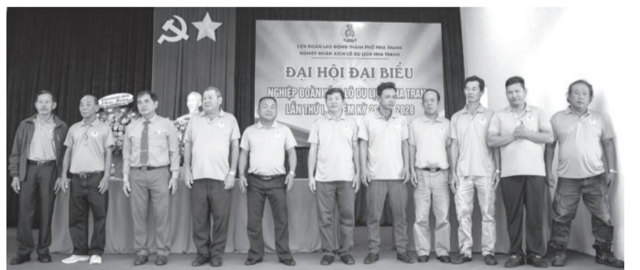
● Ra mắt Ban Chấp hành Nghiệp đoàn Xích lô du lịch Nha Trang nhiệm kỳ 2023 - 2028.

Được thành lập vào tháng 12-2023 với hơn 250 đoàn viên ban đầu, đến nay, Nghiệp đoàn Xích lô du lịch Nha Trang đã phát triển được 515 đoàn viên, chia thành 8 tổ hoạt động trên địa bàn thành phố. Được sự quan tâm hỗ trợ của Liên đoàn Lao động thành phố, trong 1 năm qua, Nghiệp đoàn Xích lô du lịch Nha Trang đã triển khai nhiều hoạt động chăm lo, bảo vệ quyền lợi đoàn viên. Trong nhiệm kỳ 2023 - 2028, Nghiệp đoàn Xích lô du lịch Nha Trang sẽ tập trung đổi mới nội dung, phương thức hoạt động, quan tâm chăm lo, bảo vệ quyền lợi chính đáng cho đoàn viên; phấn đấu 100% đoàn viên chấp hành tốt quy định của pháp luật, ứng xử có văn hóa, tự học ngoại ngữ, nghiệp vụ