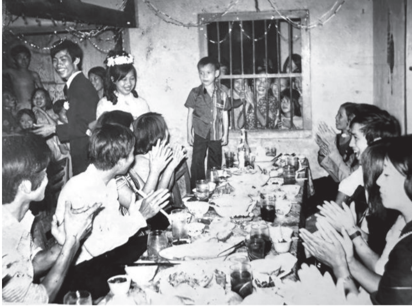
● Giúp vui trong tiệc cưới.