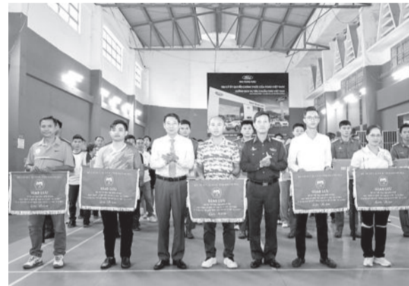
● Đồng chí Đinh Văn Thiệu và Ban tổ chức trao cờ lưu niệm cho các đoàn vận động viên.

Ngày 20-12, Bộ Chỉ huy Quân sự (CHQS) tỉnh tổ chức hoạt động giao lưu thể thao nhân dịp kỷ niệm 80 năm Ngày thành lập Quân đội nhân dân Việt Nam và 35 năm Ngày hội Quốc phòng toàn dân. Đồng chí Đinh Văn Thiệu - Phó Chủ tịch UBND tỉnh dự khai mạc.