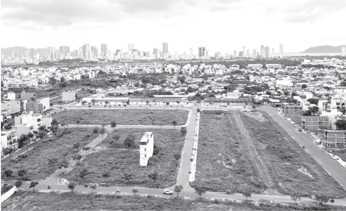
● Một góc Khu đô thị Hoàng Long.

Tiếp đến năm 2015, UBND tỉnh đã chấp thuận đầu tư Dự án Khu đô thị Hoàng Long với diện tích sử dụng gần 25,8ha. Đến năm 2023, UBND tỉnh tiếp tục chấp thuận chủ trương đầu tư đồng thời chấp nhận nhà đầu tư dự án này với tiến độ xây dựng cơ bản và đưa công trình vào hoạt động trong vòng 24 tháng kể từ thời điểm UBND