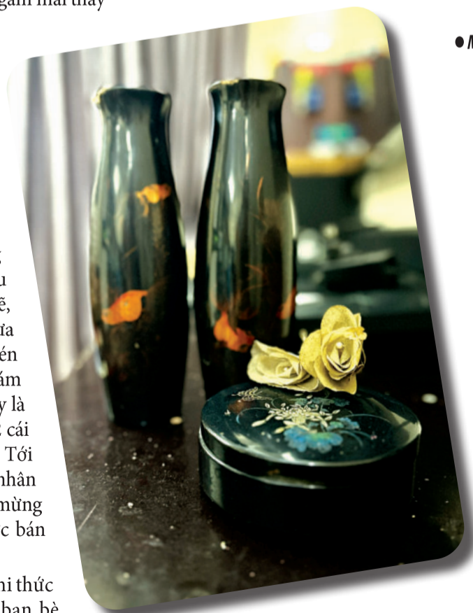
● Một trong những món quà cưới được ưa chuộng những năm 80.