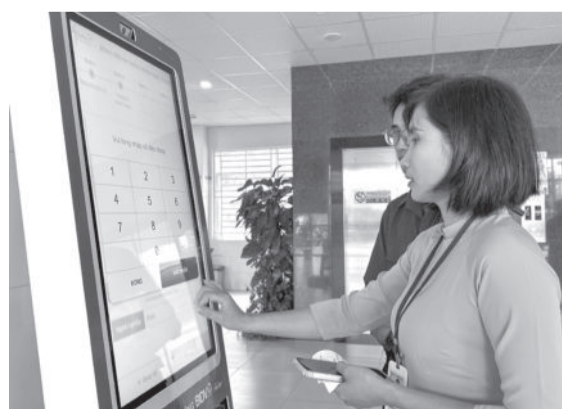
● Người dân có thể tự đăng ký khám bệnh qua kiosk.

Kiosk y tế thông minh tự phục vụ có nhiều chức năng giúp người bệnh có thể tự đăng ký khám bệnh mà không cần chờ đợi lâu như: Đăng ký khám, chữa bệnh qua xác thực thẻ căn cước công dân và nhận diện khuôn mặt; tự động liên kết thông tin bảo hiểm y tế theo số căn cước công dân; tạo tài khoản ngân hàng để thanh toán chi phí khám, chữa bệnh... Qua kiosk, các y, bác sĩ có thể chủ động tiếp nhận thông tin, theo dõi lịch sử khám bệnh của bệnh nhân nhanh chóng, dễ dàng, thuận tiện.