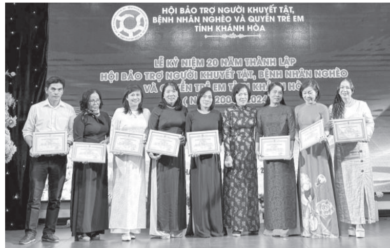
● Các cá nhân, tập thể được Hội Bảo trợ người khuyết tật, bệnh nhân nghèo và quyền trẻ em tỉnh tặng giấy khen.

Ngày 20-12, Hội Bảo trợ người khuyết tật, bệnh nhân nghèo và quyền trẻ em tỉnh tổ chức lễ kỷ niệm 20 năm thành lập (2004 - 2024) và tổng kết hoạt động hội năm 2024.