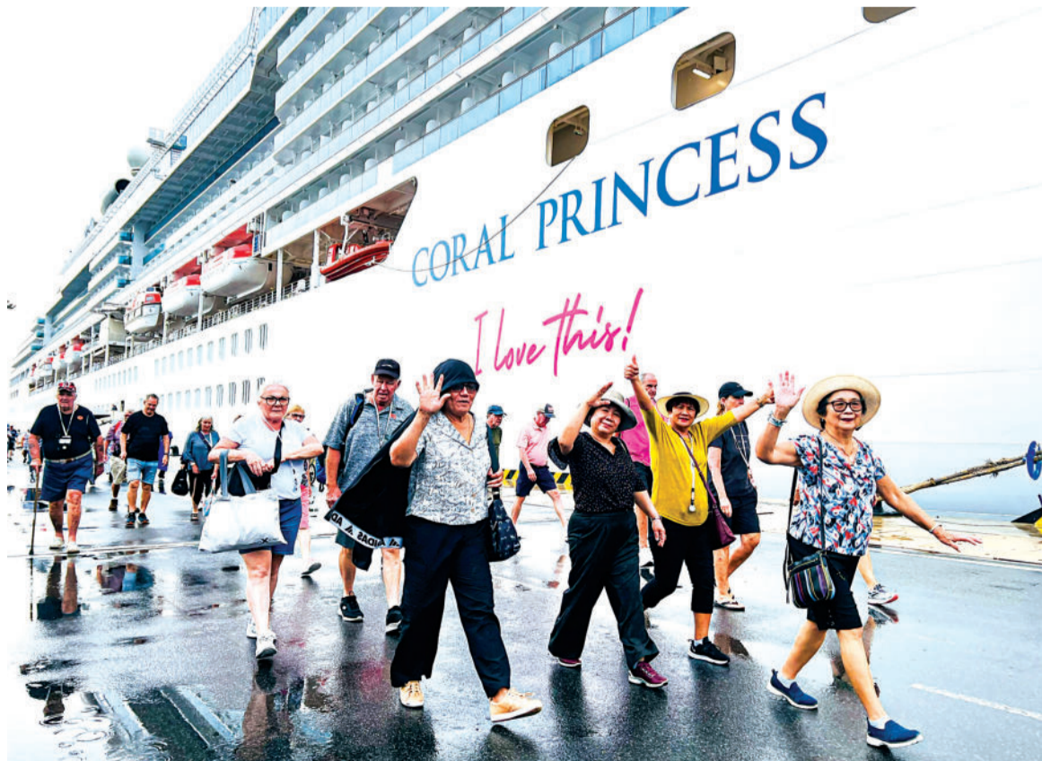
● Khách du lịch tàu biển hào hứng khi được đến Khánh Hòa.