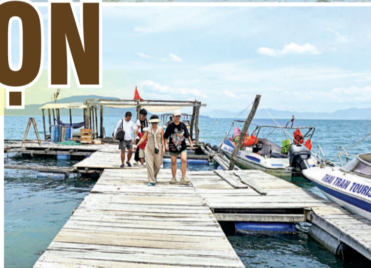
● Bến phao trái phép do Công ty TNHH Khu du lịch Luzumi lập.