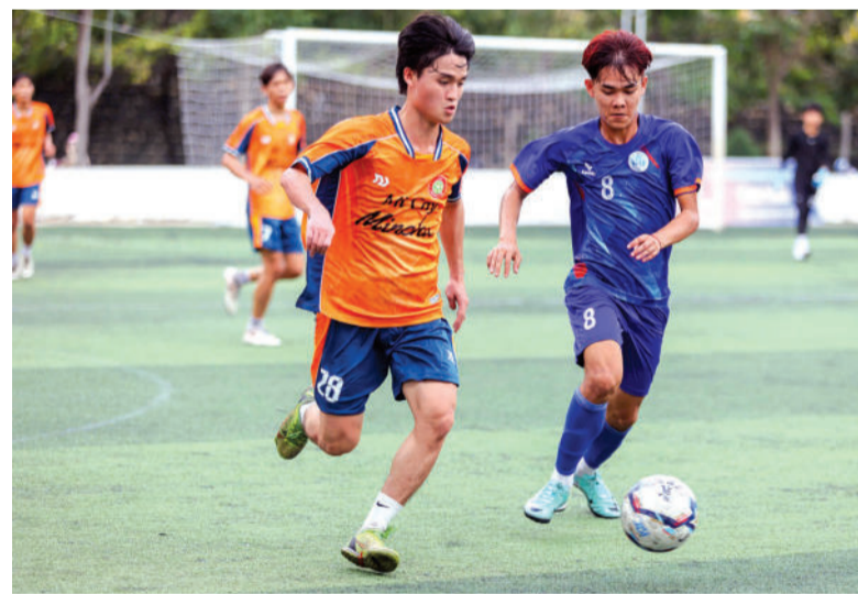
● Thi đấu giao hữu giữa đội Trường Đại học Nha Trang (áo xanh) và Trường Đại học Thái Bình Dương.

Là đơn vị chủ nhà đăng cai tổ chức các trận đấu, những ngày này, đội bóng Trường Đại học Nha Trang đang tích