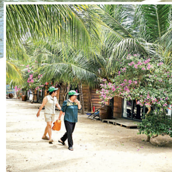
● Những căn homestay được xây dựng trái phép trên đất nông nghiệp.