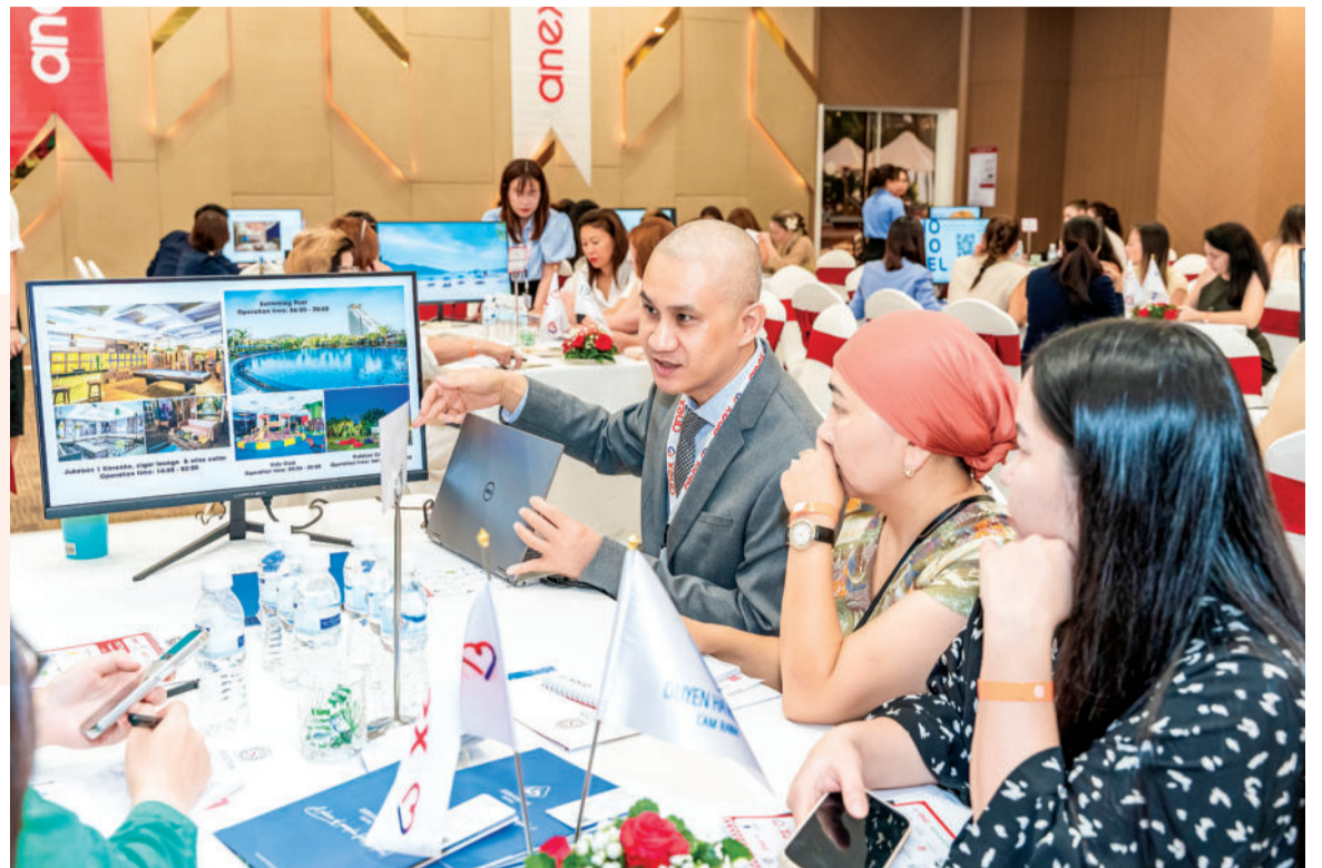
● Các đại lý du lịch Kazakhstan đến tìm hiểu du lịch Khánh Hòa.

Về tổng thể, du lịch Khánh Hòa đã có một năm thành công rực rỡ. Tuy nhiên, hoạt động du lịch của Khánh Hòa vẫn có những hạn chế nhất định. Các chuyến bay từ Nga đến Cảng hàng không quốc tế Cam Ranh chưa thể khôi phục đã làm lượng khách Nga đến Khánh Hòa khá ít. Thị trường khách Trung Quốc dần khôi phục nhưng tần suất các chuyến bay quốc tế thường lệ và các chuyến bay charter còn chưa được như kỳ vọng. Cảng Nha Trang đang sửa chữa nên nhiều chuyến tàu du lịch biển đã hủy việc ghé thăm thành phố biển... Tại cuộc họp đánh giá kết quả thực hiện Chương trình hành động ngành Du lịch tỉnh năm 2024 và phương hướng, nhiệm vụ năm 2025, đồng chí Đinh Văn Thiệu - Phó Chủ tịch UBND tỉnh, Trưởng Ban chỉ đạo phát triển du lịch tỉnh đã chỉ ra những hạn chế của du lịch xứ Trầm Hương: Thị trường khách quốc tế vẫn còn mất cân đối (lượng khách Hàn Quốc