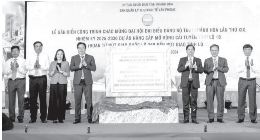
● Các đại biểu thực hiện nghi thức gắn biển Công trình chào mừng Đại hội đại biểu Đảng bộ tỉnh lần thứ XIX, nhiệm kỳ 2025 - 2030 đối với Dự án Nâng cấp mở rộng cải tuyến Tỉnh lộ 1B.

Dự án có vai trò thu hút, thúc đẩy, sử dụng hiệu quả các nguồn lực trong và ngoài nhà nước cho đầu tư phát triển kinh tế - xã hội trên địa bàn, phát triển KKT Vân Phong trở thành động lực phát triển của tỉnh