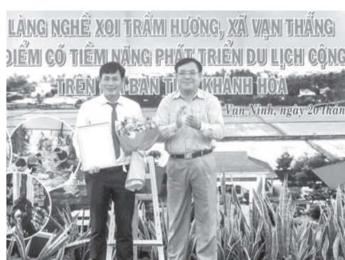
● Lãnh đạo Sở Du lịch trao quyết định công nhận làng nghề xoi trầm hương (xã Vạn Thắng) là địa điểm có tiềm năng phát triển du lịch cộng đồng.

Tại buổi lễ, lãnh đạo Sở Du lịch đã trao quyết định của UBND tỉnh về việc công nhận làng nghề xoi trầm hương (xã Vạn Thắng) là địa điểm có tiềm năng phát triển du lịch cộng đồng trên địa bàn tỉnh cho địa phương. Làng nghề xoi trầm hương ở xã Vạn Thắng có lịch sử hàng trăm năm hình thành và phát triển. Hiện nay,