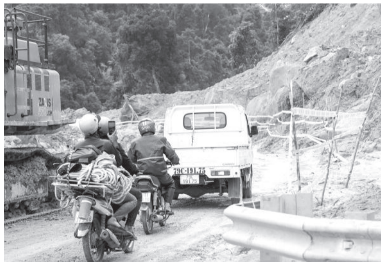
● Chiều 19-12, nhiều phương tiện từ Lâm Đồng lưu thông trên Quốc lộ 27C đi qua khu vực sạt lở.

và địa phương để xin ý kiến cho phép đóng đèo Khánh Lê thêm 1 - 2 ngày.