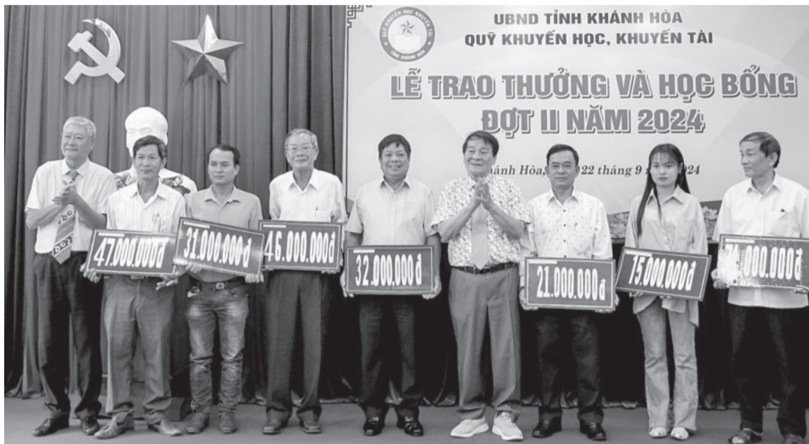
● Đại diện Hội Khuyến học tỉnh và Quỹ Khuyến học, khuyến tài Khánh Hòa trao học bổng cho hội khuyến học các địa phương để chuyển đến học sinh.

Thời gian qua, các hoạt động khuyến học, khuyến tài trong tỉnh tiếp tục được triển khai mạnh mẽ, tạo tiền đề thúc đẩy phong trào học tập suốt đời, hướng tới xây dựng xã hội học tập.