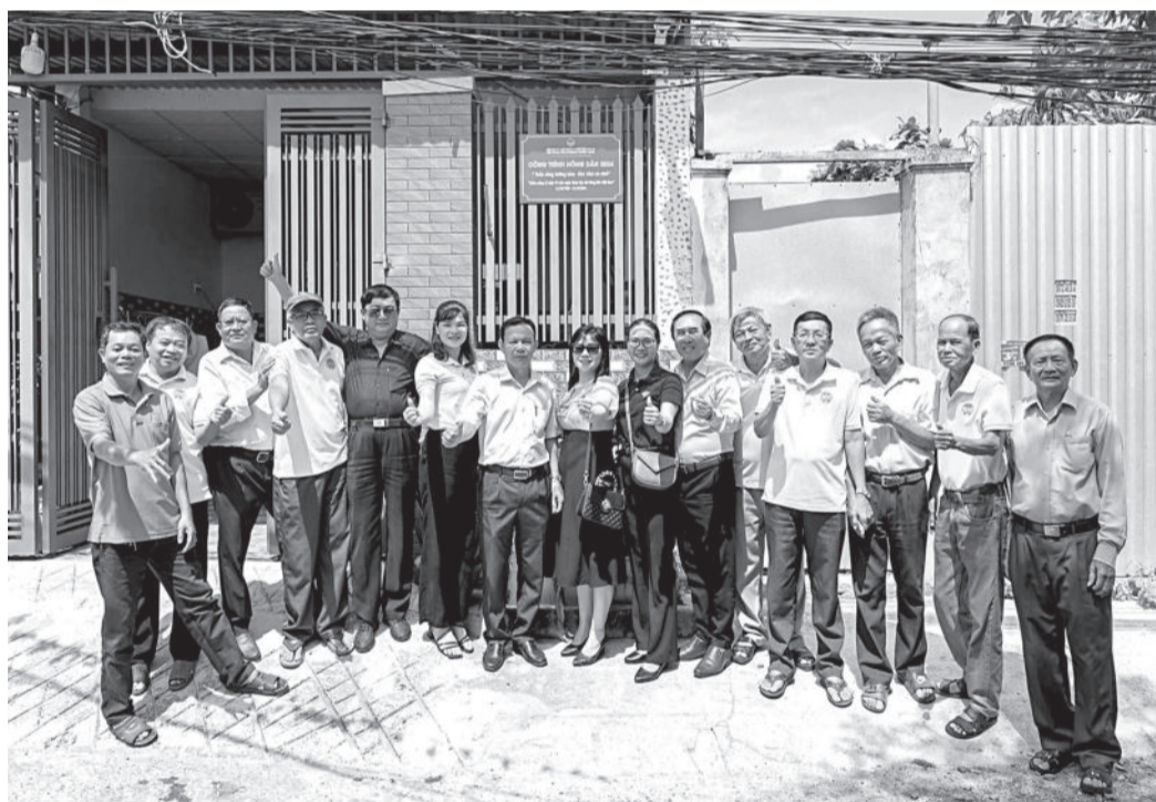
● Cán bộ, hội viên nông dân phường Phước Long thực hiện công trình thắp sáng đường hẻm.