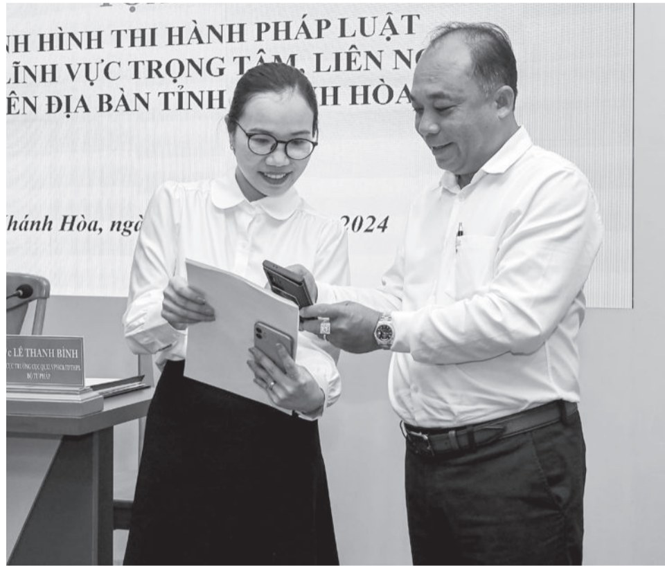
● Công chức Sở Tư pháp cung cấp mã QR để khảo sát trực tuyến về tình hình thi hành pháp luật lĩnh vực trọng tâm, liên ngành.