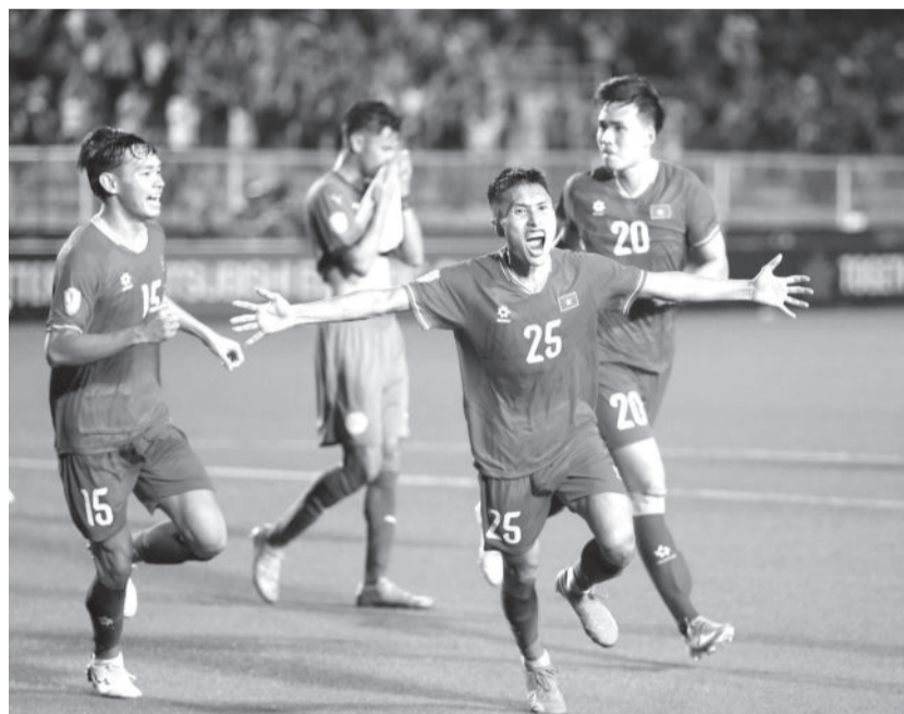
● Các cầu thủ đội tuyển Việt Nam trong trận hòa chật vật trước Philippines.

Trận hòa trước đội tuyển Philippines vào tối 18-12 trên sân khách khiến đội tuyển Việt Nam chưa thể cầm chắc chiếc vé vào bán kết ASEAN Cup 2024 và vẫn có nguy cơ bị loại ở trận đấu cuối cùng gặp Myanmar (ngày 21-12) trên sân nhà Việt Trì (Phú Thọ).