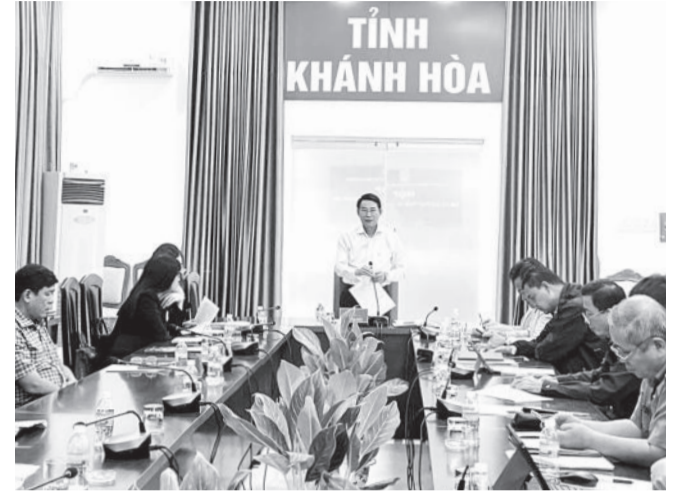
● Phó Chủ tịch UBND tỉnh Đinh Văn Thiệu phát biểu kết luận cuộc họp.

Sáng 19-12, đồng chí Đinh Văn Thiệu - Phó Chủ tịch UBND tỉnh chủ trì cuộc họp với các thành viên Ban Chỉ đạo Phát triển du lịch tỉnh về kết quả thực hiện Chương trình hành động ngành Du lịch tỉnh năm 2024 và phương hướng, nhiệm vụ năm 2025.