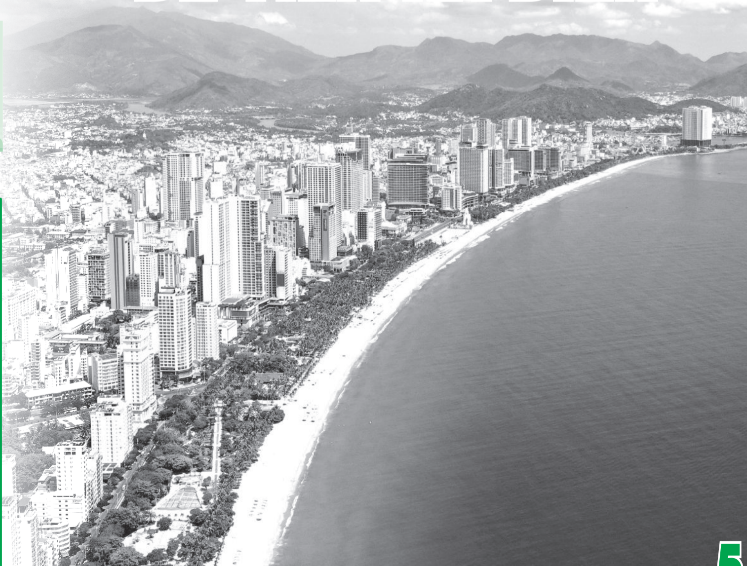
• Một góc TP. Nha Trang.