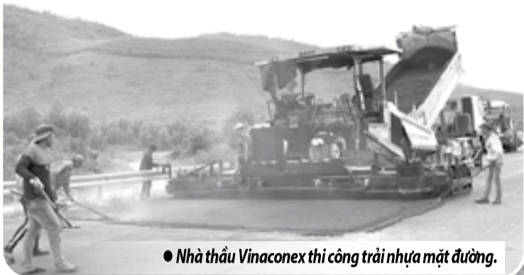
● Nhà thầu Vinaconex thi công trải nhựa mặt đường.