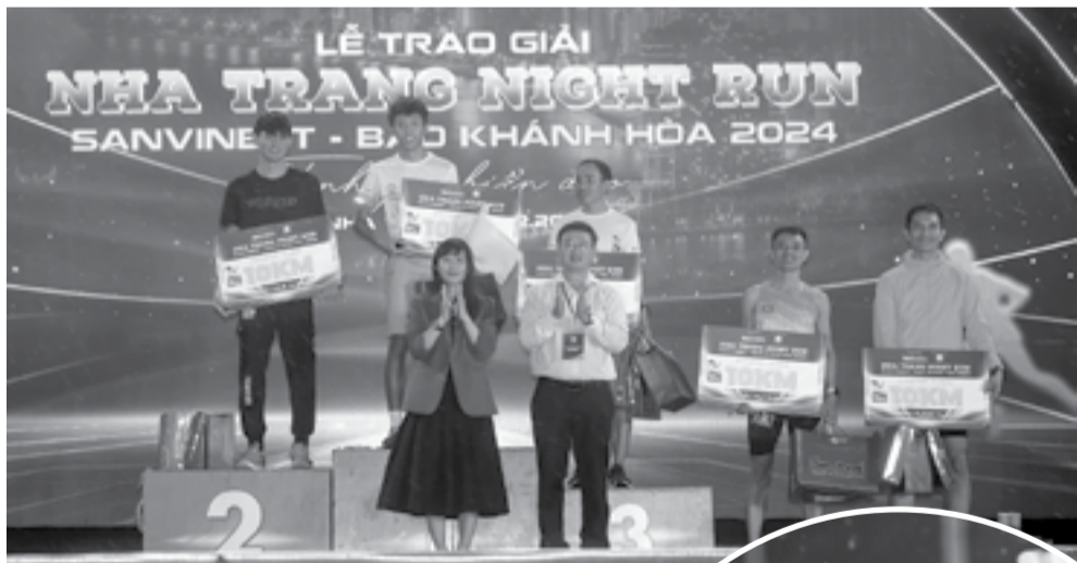
● Ban tổ chức trao giải cự ly 10km nam.