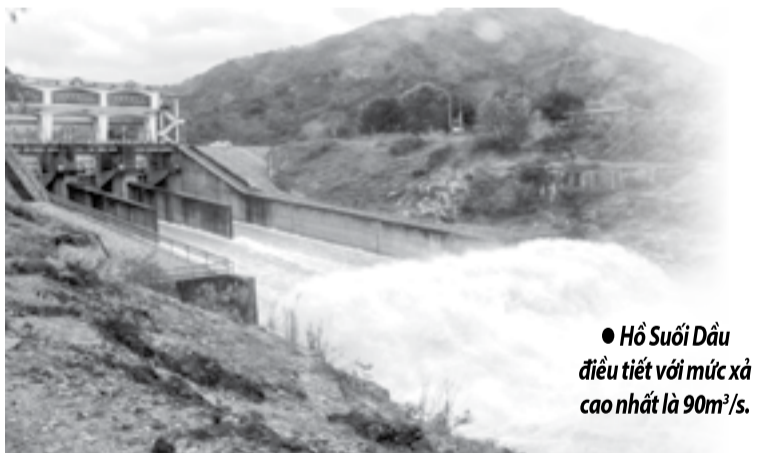
● Hồ Suối Dầu điều tiết với mức xả cao nhất là 90m 3 /s.

Theo thông báo từ Công ty TNHH Một thành viên Khai thác công trình thủy lợi Khánh Hòa, dự báo của cơ quan chuyên môn, những ngày tới trên địa bàn tỉnh tiếp tục xảy ra mưa vừa, mưa to, có nơi mưa rất to. Trong khi đó, thời điểm 7 giờ ngày 15-12, mực nước hồ Suối Dầu (huyện Cam Lâm) đang ở cao trình 41,4m, lưu lượng nước đến hồ khoảng 81m 3 /s. Mực nước được phép tích cao nhất đến ngày 31-12 của hồ chứa này là 42,5m. Do vậy, để đảm bảo an toàn công trình và hạn chế ngập lụt vùng