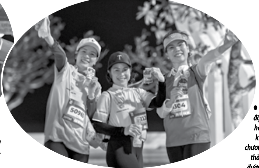
● Các vận động viên hào hứng khoe huy chương hoàn thành cự ly đường chạy.