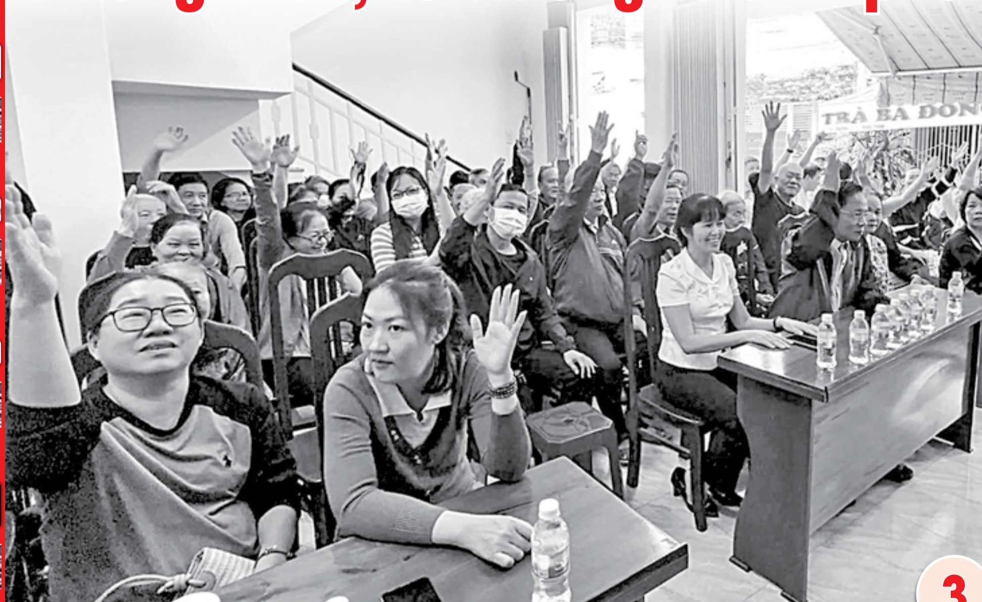
● Cử tri Tổ dân phố Lê Hồng Phong biểu quyết bầu tổ trưởng tổ dân phố.