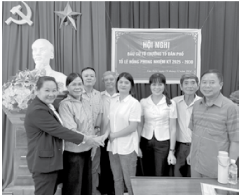
● Lãnh đạo phường Tân Tiến và cử tri chúc mừng ứng cử viên tại Tổ dân phố Lê Hồng Phong (thứ 4 từ phải qua) được đa số cử tri biểu quyết bầu.

Ngày 15-12, các cử tri đại diện hộ gia đình của 836 thôn, tổ dân phố (TDP) trên toàn tỉnh nô nức đi bầu trưởng thôn, tổ trưởng TDP nhiệm kỳ 2025 - 2030. Ghi nhận bước đầu, cuộc bầu cử đã thành công tốt đẹp.