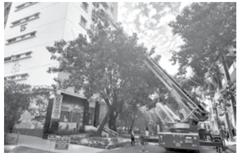
● Xe thang được điều động đến hiện trường để giải cứu nhiều người bị mắc kẹt tại các tầng của tòa nhà.

Phòng Cảnh sát phòng cháy, chữa cháy và Cứu nạn, cứu hộ (PCCC-CNCH) Công an tỉnh vừa phối hợp với Bệnh viện Đa khoa tỉnh tổ chức thực tập phương án chữa cháy và CNCH. Gần 90 người thuộc Đội chữa cháy và CNCH cơ sở; cán bộ, nhân viên cùng các y, bác sĩ Bệnh viện Đa khoa tỉnh và lực lượng chữa cháy chuyên nghiệp tham gia thực tập phương án.