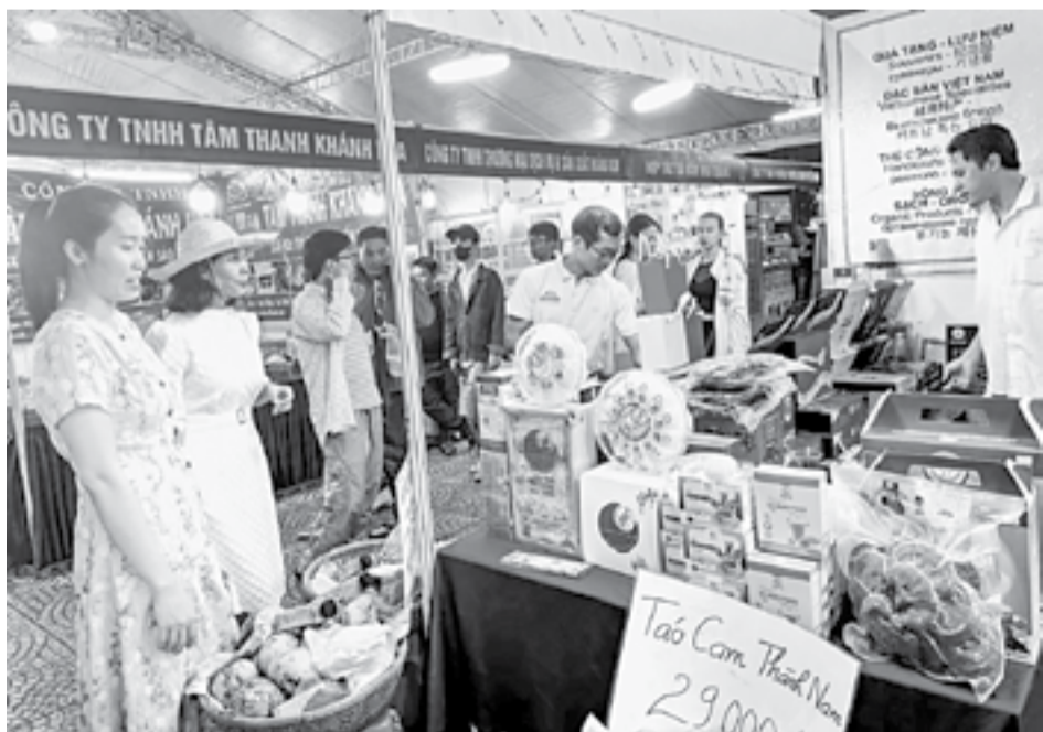
● Người dân, du khách tìm hiểu các sản phẩm đặc sản của Khánh Hòa tại hội chợ.

Sau 5 ngày diễn ra sôi nổi với nhiều hoạt động kết nối giao thương, Hội chợ Xúc tiến thương mại và kích cầu tiêu dùng tỉnh Khánh Hòa năm 2024 kết thúc vào tối 15-12. Đây là sự kiện nhằm kích cầu tiêu dùng, mua sắm dịp cuối năm, Giáng sinh năm 2024 và Tết Nguyên đán Ất Tỵ 2025 sắp đến.