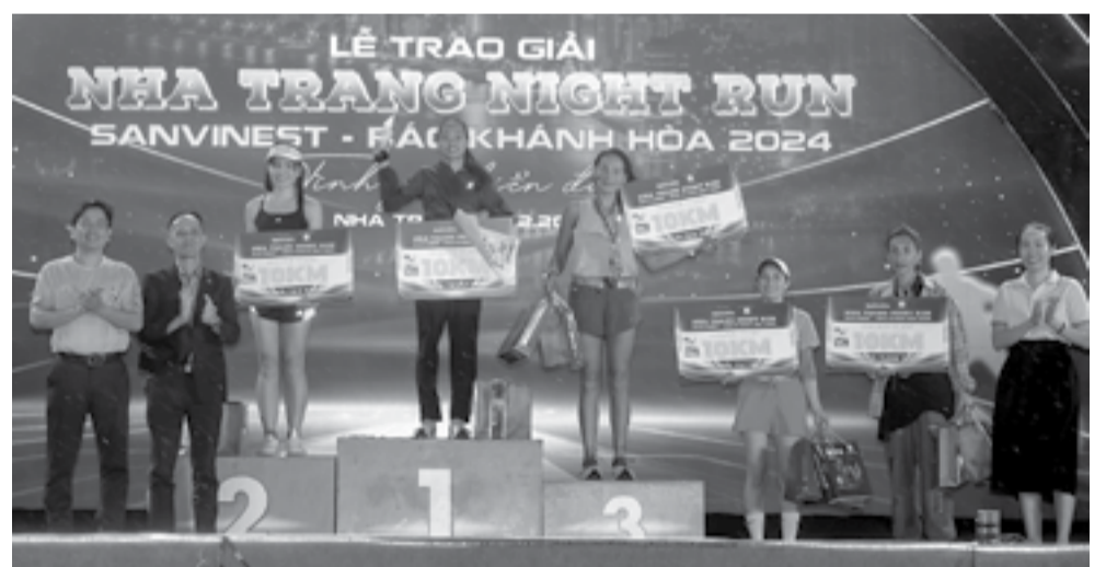
● Ban tổ chức trao giải cự ly 10km nữ.