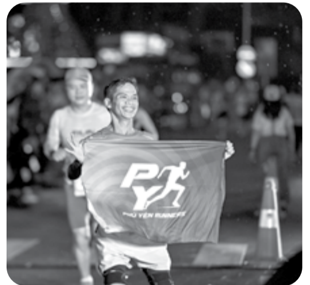
● Một vận động viên đến từ Câu lạc bộ Phú Yên runner thích thú khi tham gia giải.