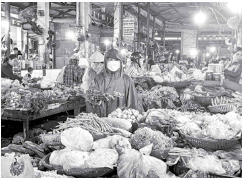
● Mưa nhiều nên rau ăn lá không được dồi dào như trước.

Thời gian gần đây, mưa lớn kéo dài đã khiến rau xanh trên địa bàn tỉnh cũng như một số tỉnh, thành bị ảnh hưởng dẫn đến nguồn cung nhiều loại rau, củ trên thị trường giảm. Do đó, giá một số loại rau xanh bán lẻ tại các chợ truyền thống trên địa bàn TP. Nha Trang tăng so với bình thường.