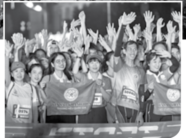
● Không khí sôi động, hấp dẫn tại giải chạy.

Thời tiết phổ biến Nha Trang thật biết chiều lòng người trong đêm thi đấu chính thức (14-12) Giải Nha Trang Night Run Sanvinest - Báo Khánh Hòa 2024 bởi trước đó 1 ngày, tại Nha Trang mưa nhiều. Ấy vậy mà khi diễn ra sự kiện giải chạy đêm lần đầu tiên ở phố biển tại Quảng trường 2 tháng 4, tiết trời Nha Trang mát dịu, kèm thêm một chút mưa phùn đã mang lại cho các runner một trải nghiệm thật sự thú vị, cảm giác thật "chill".