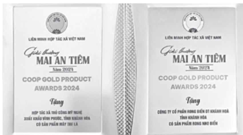
● 2 sản phẩm của Khánh Hòa được vinh danh.

Tại lễ tôn vinh 100 sản phẩm tiêu biểu của các thành viên Liên minh Hợp tác xã trên cả nước và trao Giải thưởng Mai An Tiem lần thứ nhất năm 2024 (Coop Gold Product Awards 2024) do Liên minh Hợp tác xã Việt Nam tổ chức mới đây, Khánh Hòa có 2 sản phẩm được tôn vinh. Theo đó, 2 sản phẩm của Khánh Hòa đoạt giải thưởng Mai An Tiem là rong nho biển của Công ty Cổ phần rong biển DT Khánh Hòa (TP. Nha Trang) và sản phẩm mây tre lá của Hợp tác xã thủ công mỹ nghệ xuất khẩu Vĩnh Phước (thị xã Ninh Hòa).