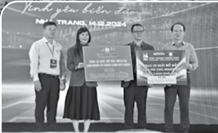
● Ban tổ chức giải và Công ty TNHH Nhà nước Một thành viên Yến sào Khánh Hòa tặng 30 suất mở mắt miễn phí cho người có hoàn cảnh khó khăn bị bệnh về mắt.