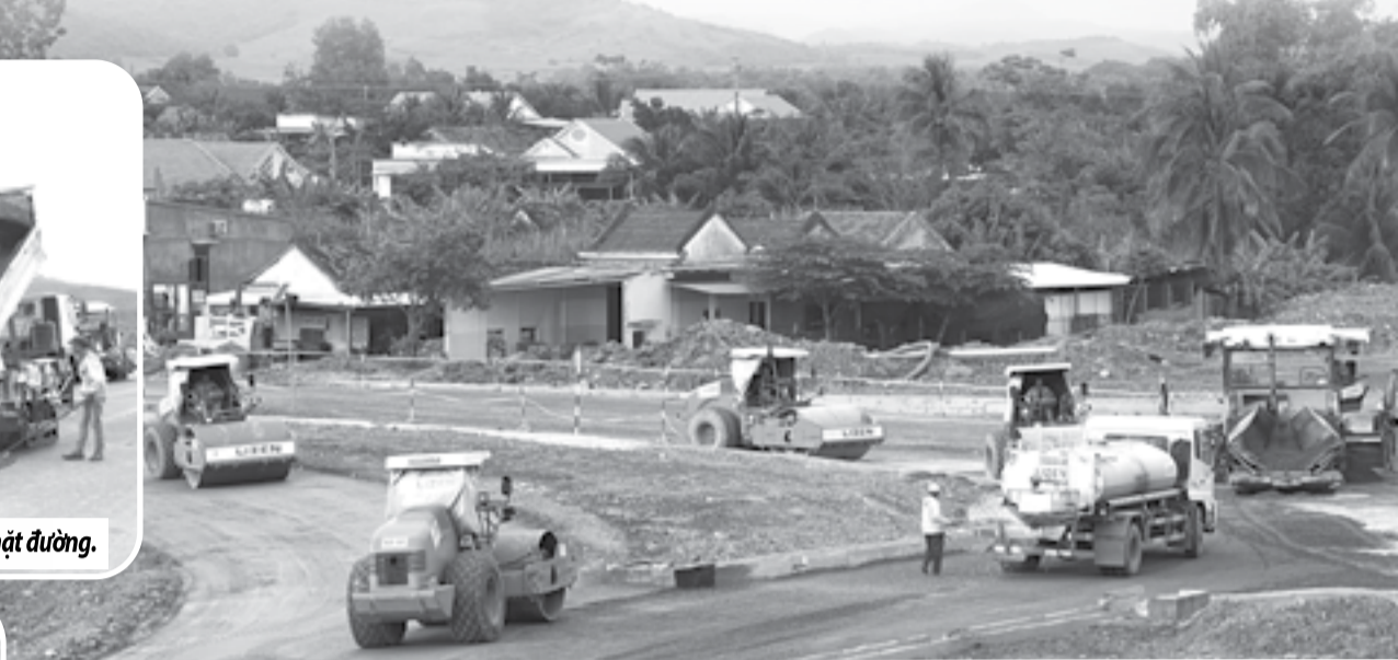
● Nhà thầu Lizen thi công đường gom tại nút giao đường bộ cao tốc đoạn Vân Phong - Nha Trang và Quốc lộ 26.