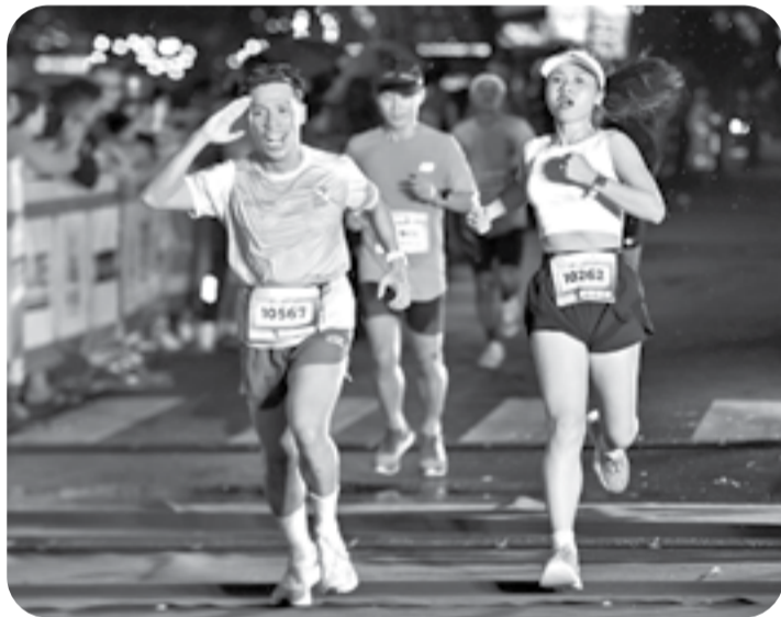
● Các vận động viên hào hứng tranh tài.