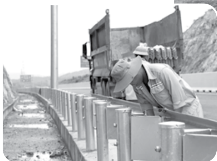
● Công nhân của nhà thầu Sơn Hải đang hoàn thiện hệ lan trên tuyến đường bộ cao tốc.