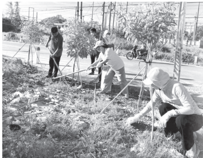
● Người dân ra quân dọn vệ sinh môi trường.