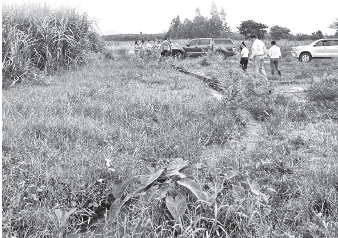
● Tuyến kênh của hệ thống mương nước sau thủy điện Ea Krong Rou bị hỏng nặng.

Qua nhiều năm đưa vào khai thác, do ảnh hưởng của các đợt mưa lũ, hệ thống kênh đã bị sạt lở, sụp gãy ở nhiều vị trí. Cụ thể, kênh chính nam có 6 vị trí bị hỏng, với tổng chiều dài hơn 200m, trong đó có một số vị trí bị hỏng nặng như: Gãy