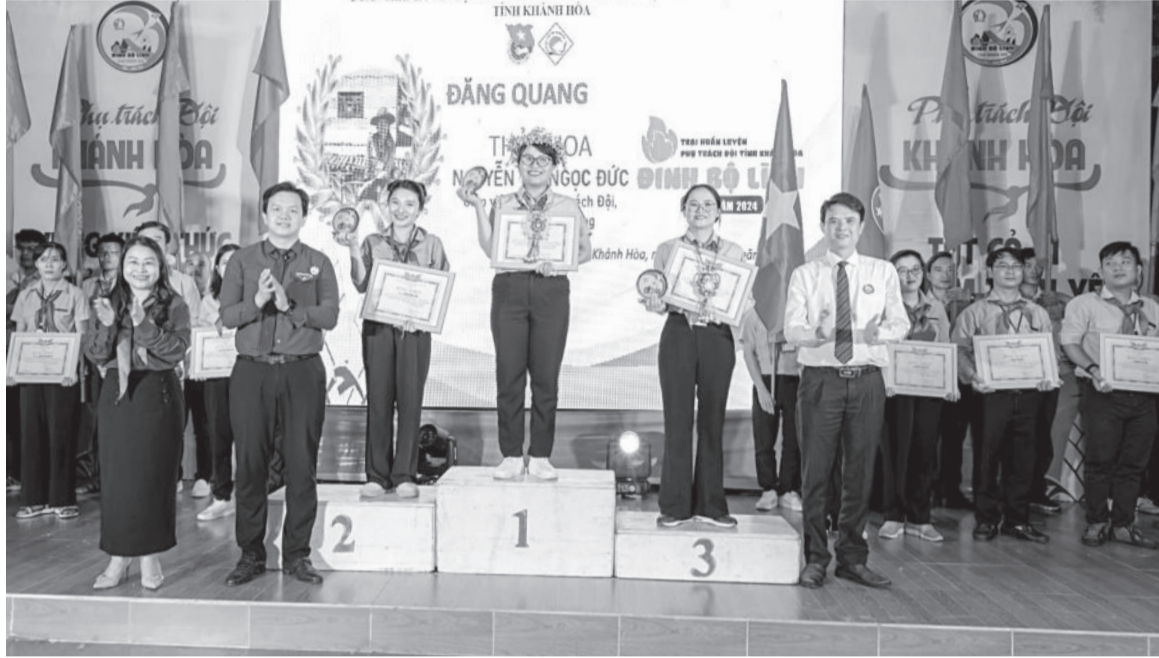
● Ban tổ chức trao danh hiệu thủ khoa, á khoa trại huấn luyện cho các trại sinh đạt thành tích cao.

Với khẩu hiệu “Phụ trách Đội Khánh Hòa vững kiến thức, giỏi kỹ năng, tất cả vì đàn em thân yêu”, trong những ngày tham gia trại huấn luyện, các trại sinh đã trải qua 9 nội dung thi, hơn 20 môn thi thành phần cùng với các chuyên đề tập huấn thú vị của các báo cáo viên đến từ Học viện Thanh