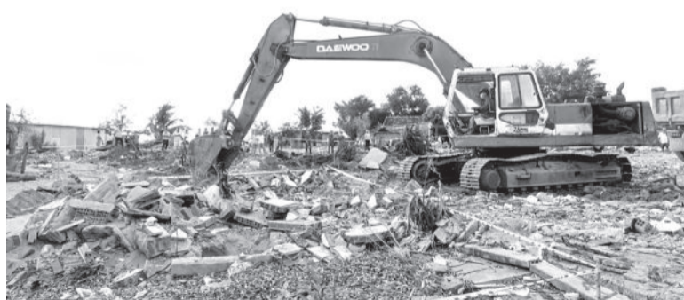
Đơn vị thi công huy động phương tiện triển khai thi công ngay sau khi nhận bàn giao mặt bằng.

Sáng 4-12, UBND thị trấn Vạn Giã (huyện Vạn Ninh) tổ chức cưỡng chế thu hồi đất thực hiện Dự án xây dựng cầu Huyện 2 và đường dẫn đối với 1 trường hợp không chấp hành bàn giao mặt bằng để triển khai dự án.