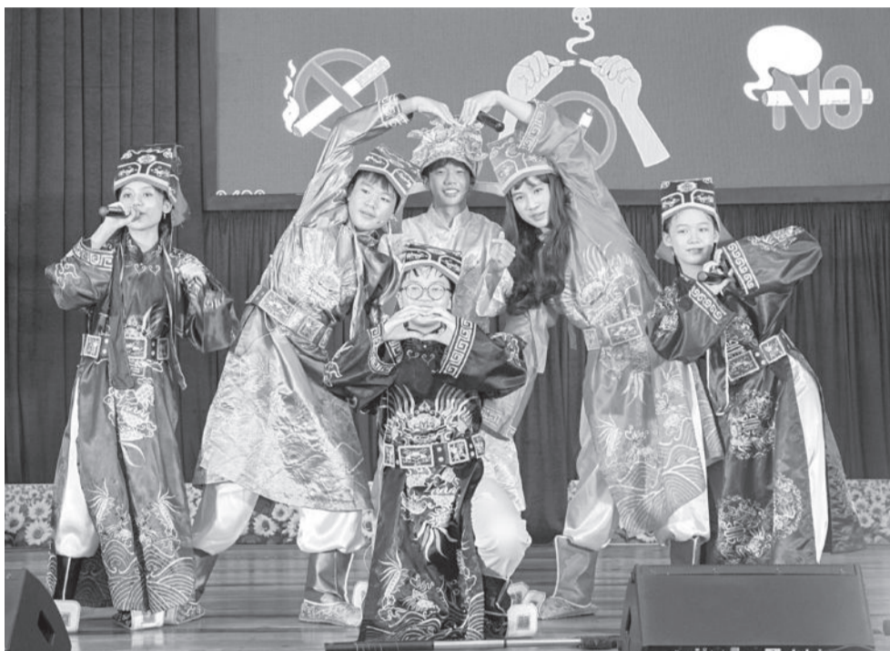
• Tiểu phẩm về tác hại của thuốc lá điện tử trong hội thi sáng kiến truyền thông “Trường học không khói thuốc”.

là các loại ma túy mới. Những hóa chất này không được kiểm soát nghiêm ngặt, dẫn đến việc sử dụng tùy tiện các hợp chất độc hại. Việc tiếp xúc với những chất này không chỉ gây tổn hại nghiêm trọng đến sức khỏe cá nhân mà còn phá hủy môi trường.