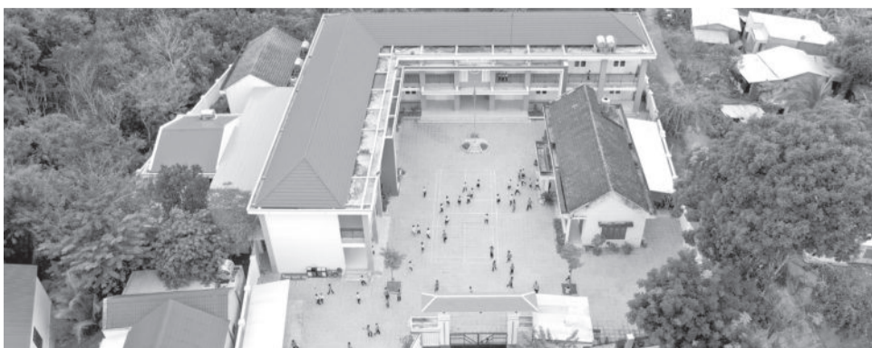
● Trường Tiểu học Khánh Nam (điểm Hòn Dù) được đầu tư xây mới nhiều hạng mục.