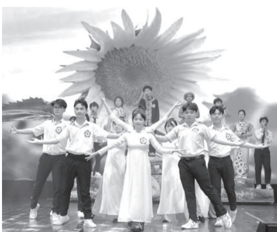
● Tiết mục tham gia hội thi.

Hội thi có sự tham gia của 42 đoàn văn nghệ với 178 tiết mục của gần 800 học sinh cấp tiểu học, THCS, THPT, đến từ 8 phòng giáo dục và đào tạo, 34 trường THPT, trung tâm giáo dục thường xuyên trong tỉnh. Các thể loại dự thi bao gồm ca (đơn ca, song ca, tam ca, tốp ca) và múa (múa đơn, múa đôi, múa ba, múa tốp), với nội dung ca ngợi tình yêu quê hương, đất nước, nhà trường, thầy cô và bạn bè; thể hiện ước mơ, tình cảm, trách nhiệm của học sinh đối với bản thân, gia đình và cộng đồng; chào mừng các