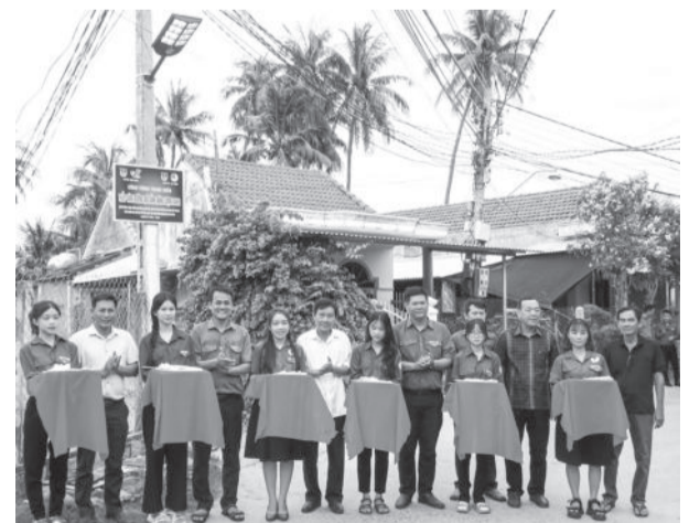
● Huyện đoàn Vạn Ninh khánh thành công trình thanh niên “Thắp sáng đường quê” tại xã Vạn Thắng.

Theo đó, các cấp bộ đoàn đã xây dựng 4 công trình thanh niên “Khu thể dục cộng đồng” với kinh phí thực hiện 340 triệu đồng; 8 công trình “Thắp sáng đường quê” với kinh phí 240 triệu đồng; xây dựng 1 tuyến đường “Sáng - xanh - sạch - đẹp - văn minh - an toàn” với kinh phí 30 triệu đồng; 11 công trình “Trường Sa trong trái tim tôi” với kinh phí 330 triệu đồng. Cùng