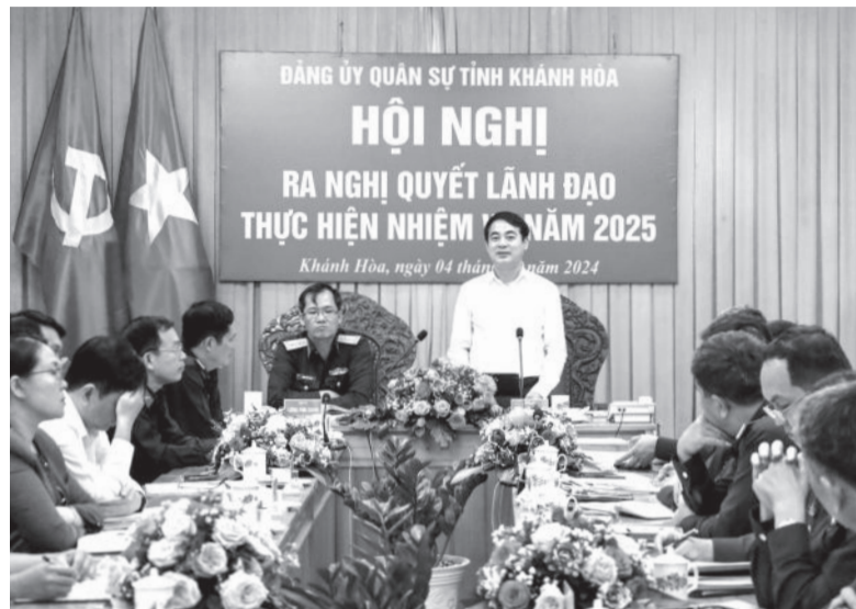
● Bí thư Tỉnh ủy Nghiêm Xuân Thành phát biểu kết luận.

Đảng ủy Quân sự tỉnh và Đảng ủy Bộ đội Biên phòng tỉnh: RA NGHỊ QUYẾT LÃNH ĐẠO THỰC HIỆN NHIỆM VỤ NĂM 2025