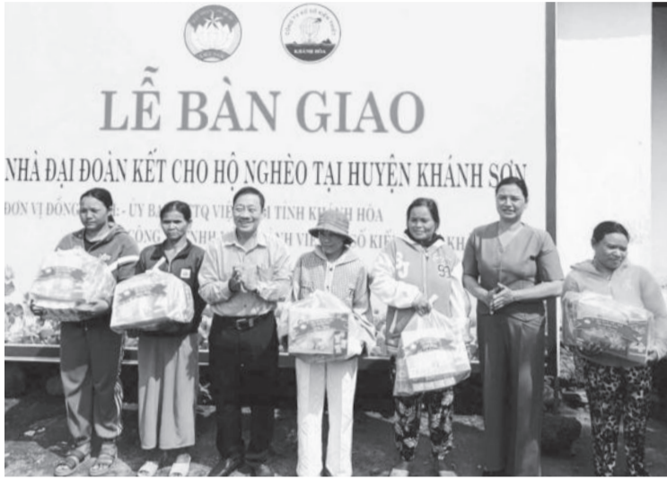
● Đại diện UBMTTQ Việt Nam tỉnh và huyện Khánh Sơn bàn giao nhà Đại đoàn kết, tặng quà cho các gia đình.