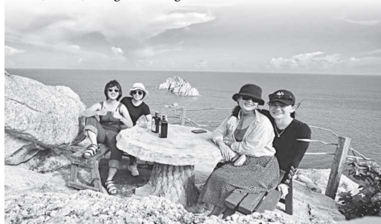
● Du khách tận hưởng không khí yên bình ở làng đảo Bích Đầm.

năng vịnh Nha Trang. Đặc biệt, ông lưu ý, phát triển du lịch cộng đồng ở Bích Đầm phải gắn với giữ nghề cá truyền thống, bảo tồn biển, đặc biệt là bảo tồn rạn san hô ở Hòn Mun; huy động nhiều nguồn lực đầu tư và cần dựa vào dân, phát huy giá trị bản địa và truyền thống. Để làm được điều này cần thành lập Tổ du lịch cộng đồng, xây dựng hoàn thiện nội quy, quy chế, ký cam kết giữa các bên liên quan để hướng đến phát