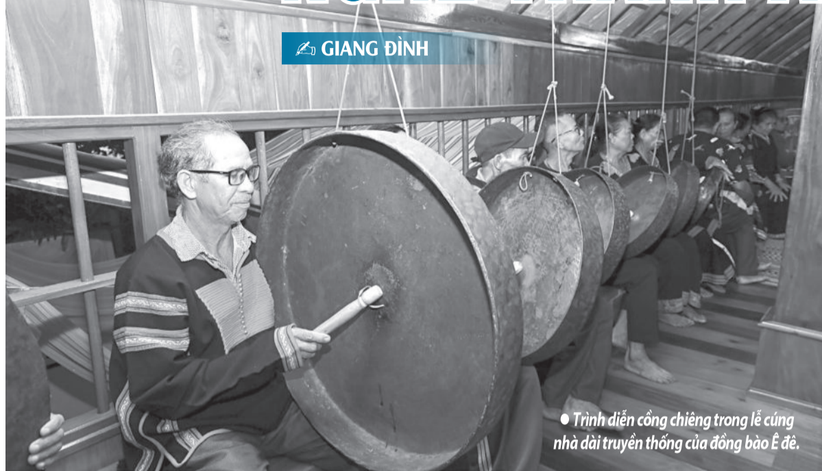
● Trình diễn công chiêng trong lễ cúng nhà dài truyền thống của đồng bào Ê đê.