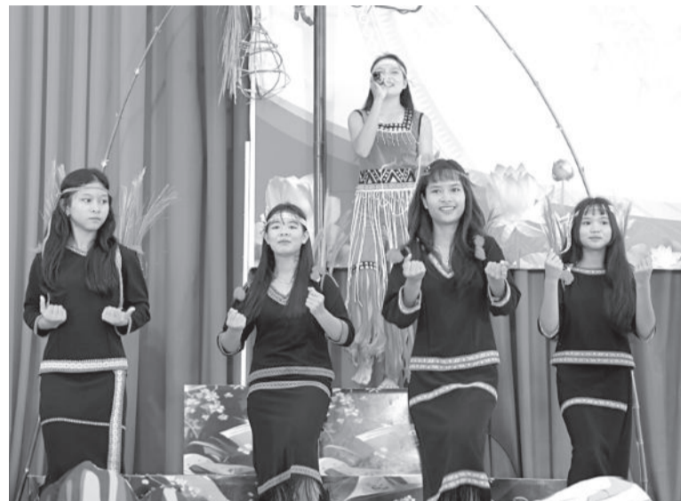
● Học sinh Trường Phổ thông Dân tộc nội trú THCS thị xã Ninh Hòa biểu diễn một tiết mục hát múa truyền thống của dân tộc Ê đê.