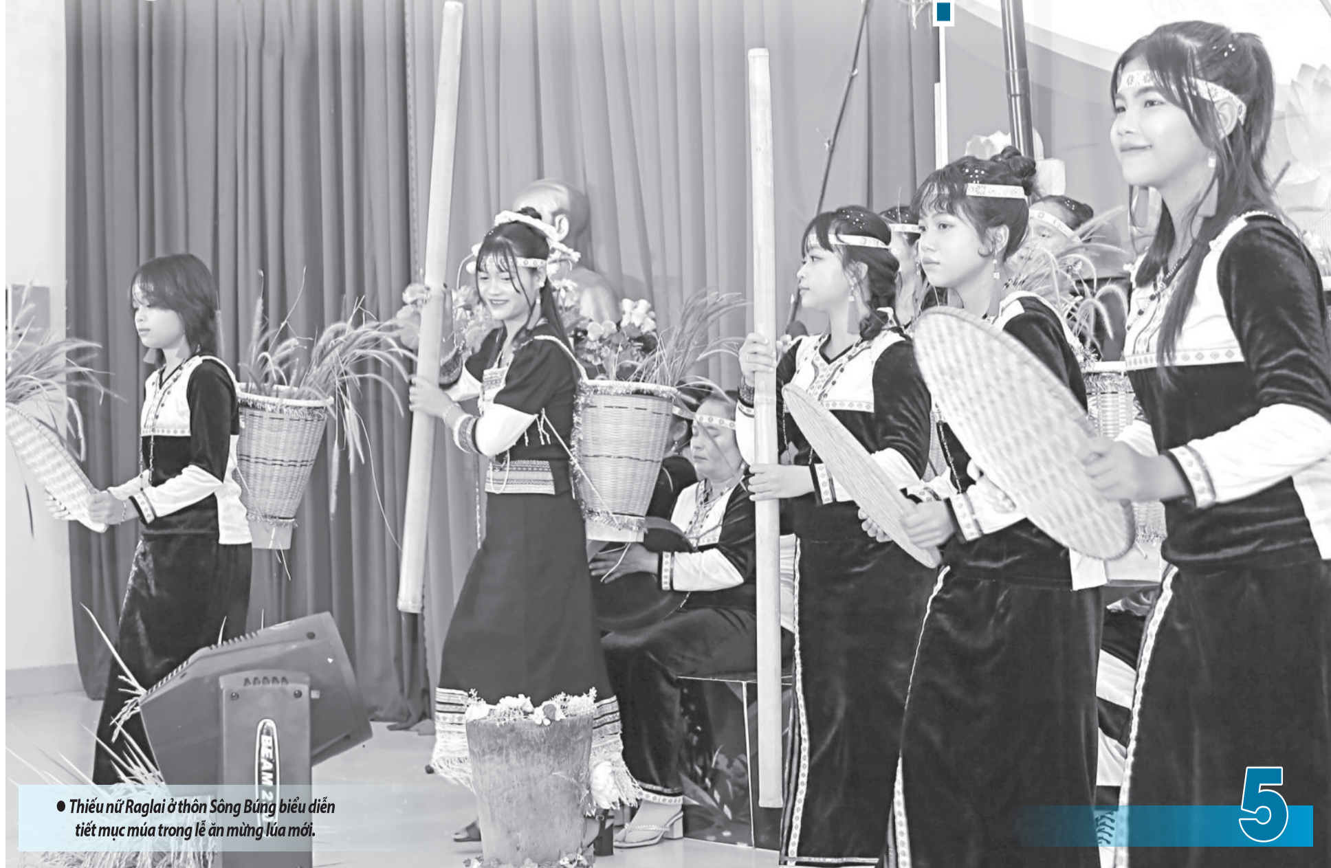
• Thiếu nữ Raglai ở thôn Sông Bung biểu diễn tiết mục múa trong lễ ăn mừng lúa mới.