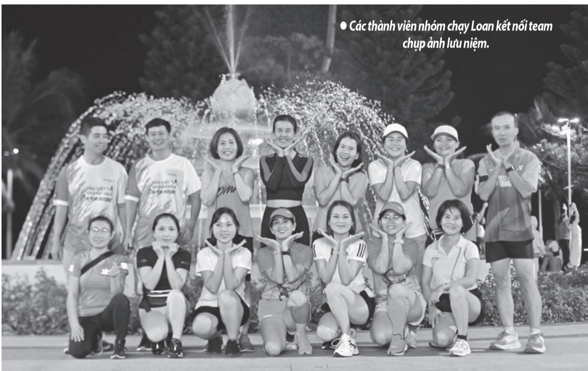
● Các thành viên nhóm chạy Loan kết nối team chụp ảnh lưu niệm.