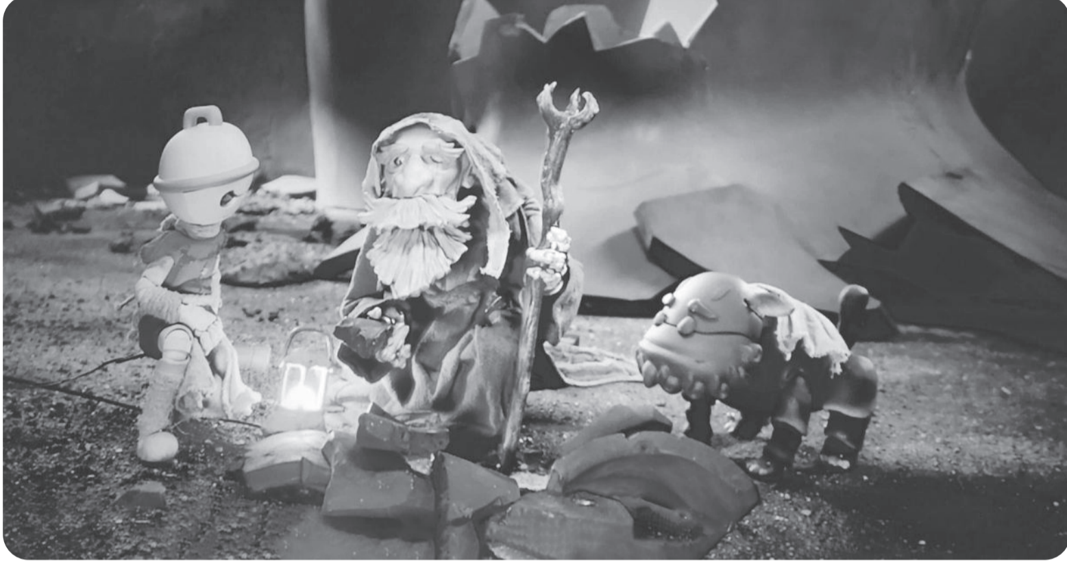
● "Chiến binh gổm" - phim hoạt hình stop motion dự kiến sẽ ra rạp trong năm 2025.

Lần đầu tiên, thị trường chứng kiến cuộc đổ bộ của 4 phim hoạt hình điện ảnh "made in Việt Nam" dự kiến ra mắt trong năm 2025. Đây có thể xem là tín hiệu mở đường cho hành trình thương mại hóa đầy tiềm năng của dòng phim này, dấu thách thức và khó khăn vẫn luôn chực chờ.