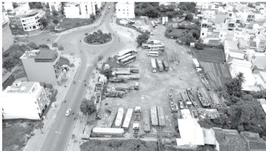
● Bãi xe tự phát gần vòng xoay đường Thích Quảng Đức (phường Phước Hải, TP. Nha Trang).

Trong báo cáo ngày 7-10, UBND TP. Nha Trang đề xuất UBND tỉnh giao UBND thành phố tổ chức quản lý và khai thác bãi đậu xe tạm tại khu đất cây xăng số 4 đường 23 tháng 10 (cạnh chùa Long Sơn) và khu đất resort Ana Mandara cũ trên đường Trần Phú. Thành phố sẽ lập và phê duyệt phương án quản lý, khai thác bãi đậu xe tạm có thời hạn, trong đó có các nội dung: Đầu tư hạ tầng từ nguồn ngân sách thành phố; giá dịch vụ trông giữ xe theo quyết định ban hành ngày 15-12-2016 của UBND tỉnh; khuyến khích thực hiện thu phí không dùng tiền mặt... Đối với các khu đất do Trung tâm Phát triển quỹ đất tỉnh quản lý,