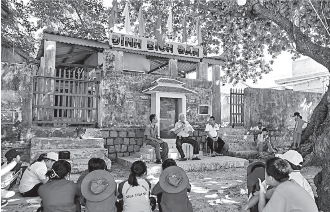
● Đình Bích Đầm - một điểm đến không thể bỏ qua đối với du khách.