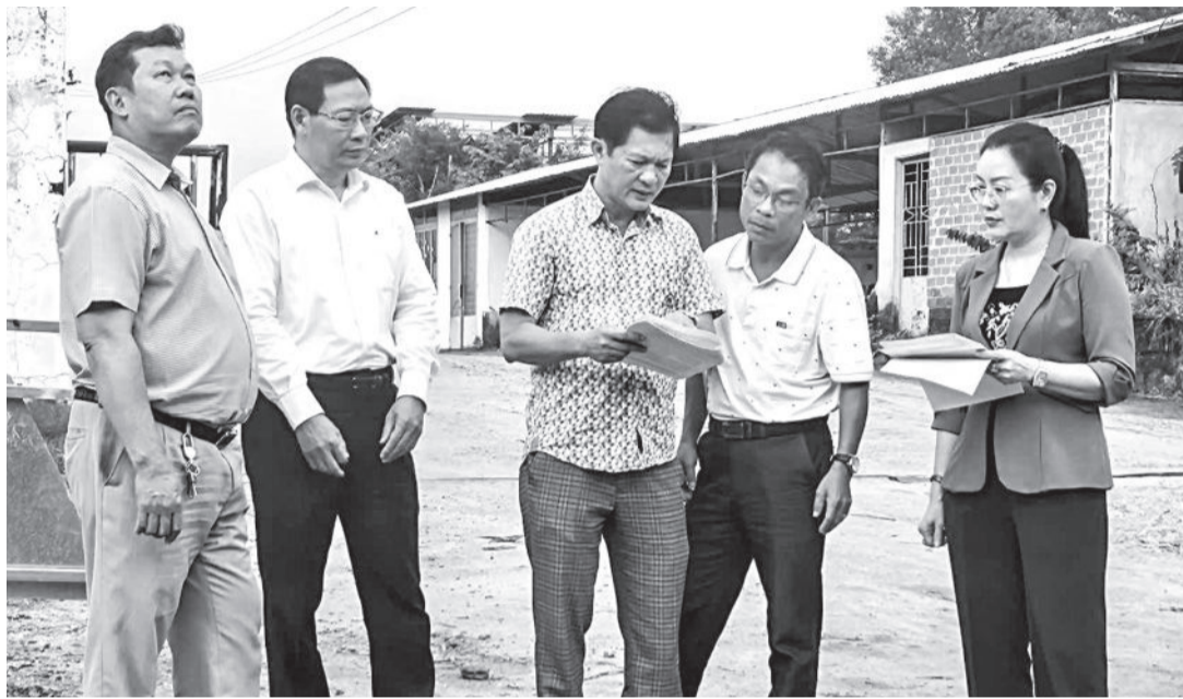
● Đoàn khảo sát việc giải quyết kiến nghị cử tri tại huyện Khánh Vĩnh.