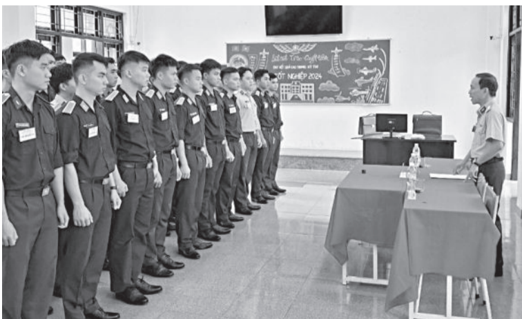
● Các học viên tham gia thi.

Các học viên đã thi các nội dung về dẫn đường và chiến thuật không quân. Nội dung thi bám sát mục tiêu, yêu cầu đào tạo, được hội đồng thi tổ chức thông qua chặt chẽ, bảo mật theo quy định. Các học viên đã có sự chuẩn bị tích cực, chủ động, tự giác ôn luyện; nắm chắc kiến thức, kỹ năng, tham gia thi đạt kết quả cao. Kết quả thi các môn, 100% đạt