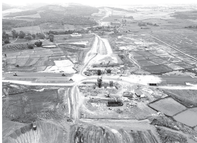
● Đoạn đầu tuyến Dự án Đường bộ cao tốc Khánh Hòa - Buôn Ma Thuột do Nhà thầu Tập đoàn Sơn Hải thi công.

một số dự án; giảm nguồn vốn Trung ương hết nhiệm vụ chi của Dự án Đường giao thông ngoài cảng trung chuyển quốc tế Vân Phong để bố trí cho các dự án khác có nhu cầu vốn. UBND tỉnh cũng cần sớm bổ sung 127,5 tỷ đồng vốn điều lệ cho Quỹ phát triển đất tỉnh từ nguồn thu tiền sử dụng đất