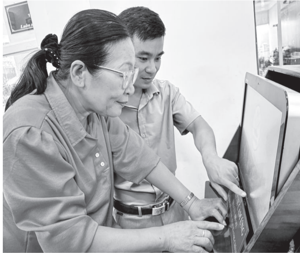
● Người dân phường Tân Tiến được hướng dẫn thực hiện thủ tục trực tuyến.