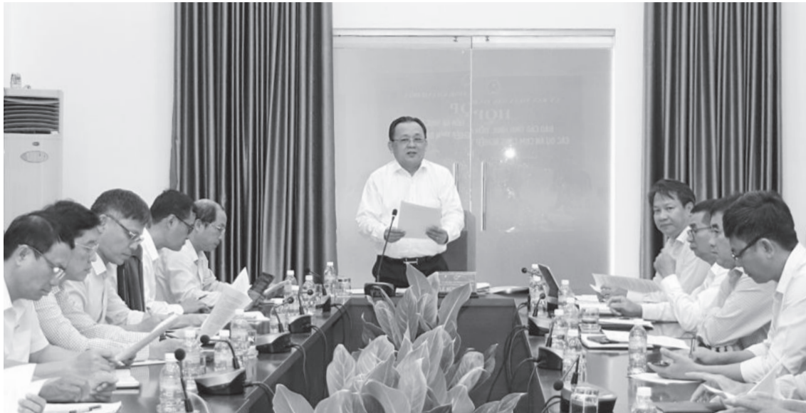
● Phó Chủ tịch Thường trực UBND tỉnh Lê Hữu Hoàng kết luận tại cuộc họp.

Chiều 2-12, đồng chí Lê Hữu Hoàng - Phó Chủ tịch Thường trực UBND tỉnh chủ trì cuộc họp với các sở, ngành, địa phương nghe báo cáo tình hình, tiến độ thực hiện các dự án cụm công nghiệp (CCN) trên địa bàn tỉnh.