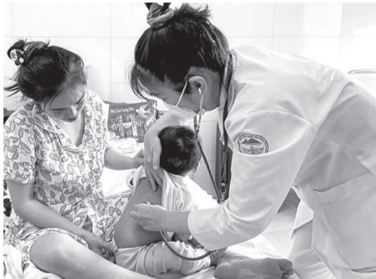
● Bác sĩ Bệnh viện Bệnh nhiệt đới tỉnh khám cho bệnh nhân mắc sởi.

Tại hội nghị trực tuyến toàn quốc về công tác phòng, chống dịch bệnh truyền nhiễm mới đây, Bộ Y tế nhận định, 11 tháng năm 2024, Việt Nam cơ bản kiểm soát được tình hình dịch bệnh truyền nhiễm. Tuy nhiên, dịch bệnh trong nước diễn biến khó lường, luôn tiềm ẩn nguy cơ xâm nhập, bùng phát, các tác nhân gây bệnh liên tục xuất hiện... Tỉnh Khánh Hòa cũng có nguy cơ rơi vào tình trạng tương tự nếu không có sự chung tay phòng bệnh từ cộng đồng.