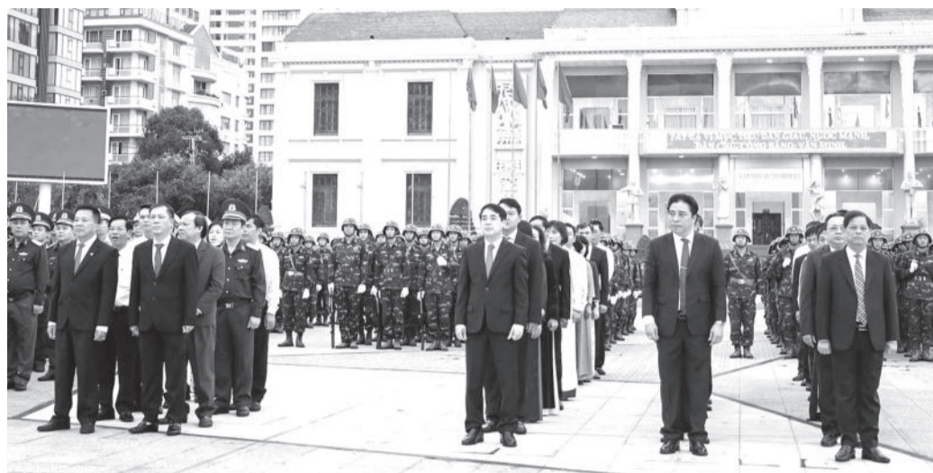
• Các đồng chí lãnh đạo tỉnh cùng các đại biểu tham dự lễ chào cờ.

LỄ CHÀO CỜ KỶ NIỆM 80 NĂM NGÀY THÀNH LẬP QUÂN ĐỘI NHÂN DÂN VIỆT NAM