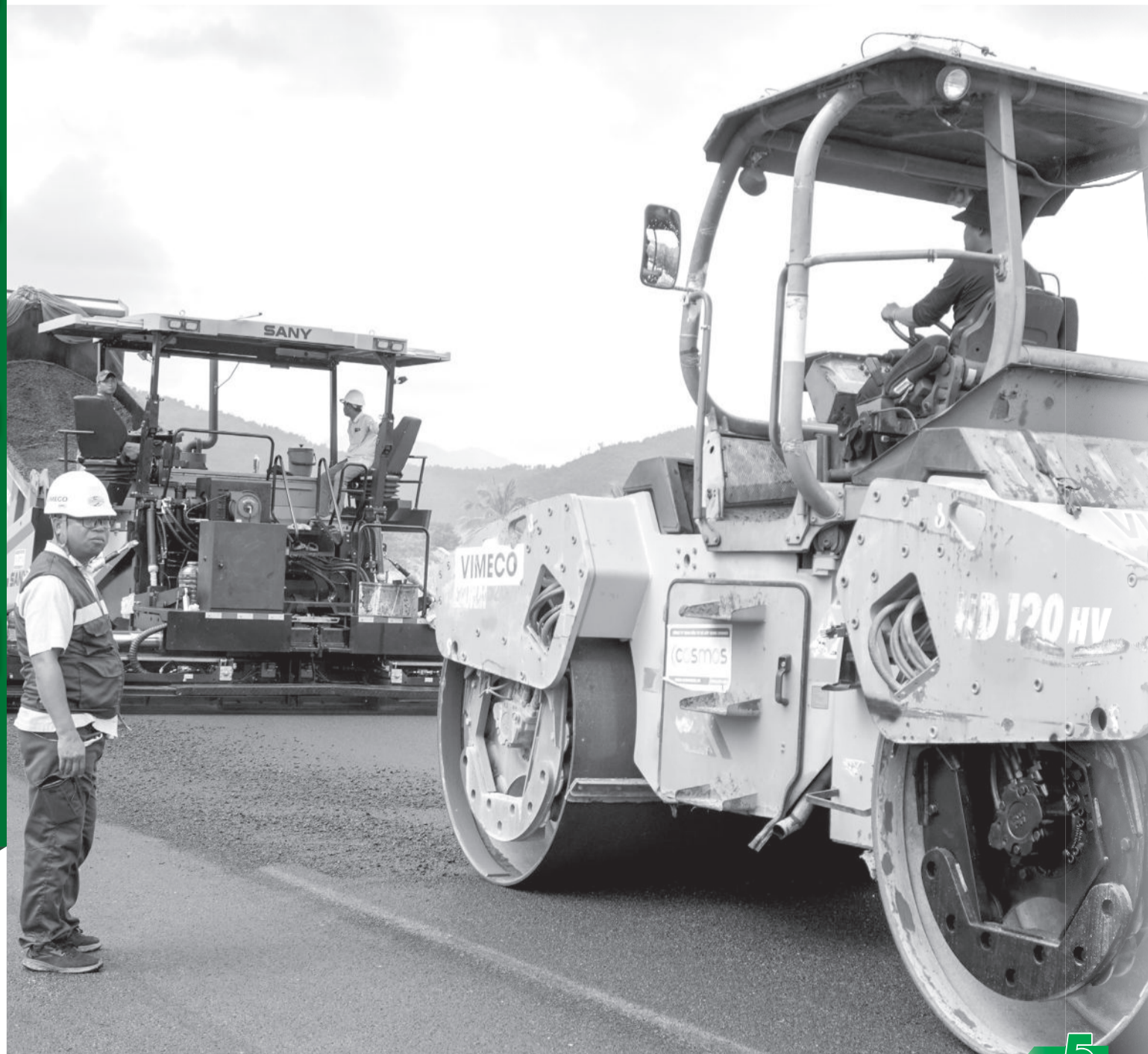
• Khảo trương thi công đường bộ cao tốc Khánh Hòa - Buôn Ma Thuột, công trình được giao nguồn vốn lớn.