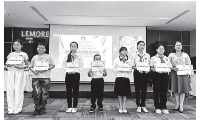
● Trao giải cá nhân cho các thí sinh.

Ngày 2-12, tại TP. Nha Trang, Chi cục Dân số - Kế hoạch hóa gia đình tỉnh tổ chức buổi truyền thông “Chung tay vì bình đẳng giới” qua tranh, với hơn 100 học sinh và một số đại biểu của các sở, ngành tham gia.