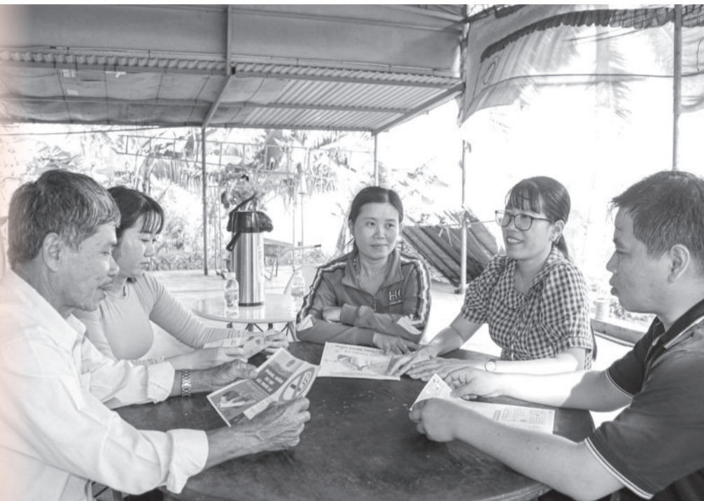
● Việc tuyên truyền để người dân bỏ thuốc lá phải thực hiện lâu dài với phương châm “mưa dầm thấm lâu”.

Với phương châm “mưa dầm thấm lâu”, các thành viên của Câu lạc bộ (CLB) “Tổ ấm không khói thuốc lá” đã tích cực tuyên truyền, nâng cao nhận thức của người dân về tác hại của thuốc lá. Nhờ đó, đã giúp nhiều người giảm hoặc từ bỏ hút thuốc lá, mang lại lợi ích về sức khỏe và kinh tế cho bản thân, gia đình và xã hội.