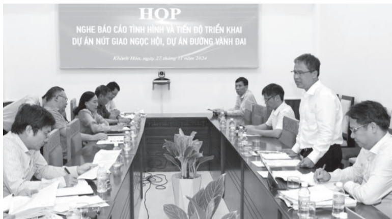
● Đồng chí Trần Hòa Nam kết luận tại cuộc họp.

Ngày 27-11, đồng chí Trần Hòa Nam - Phó Chủ tịch UBND tỉnh chủ trì cuộc họp nghe báo cáo tình hình triển khai 2 dự án Nút giao Ngọc Hội và đường Vành đai 2.