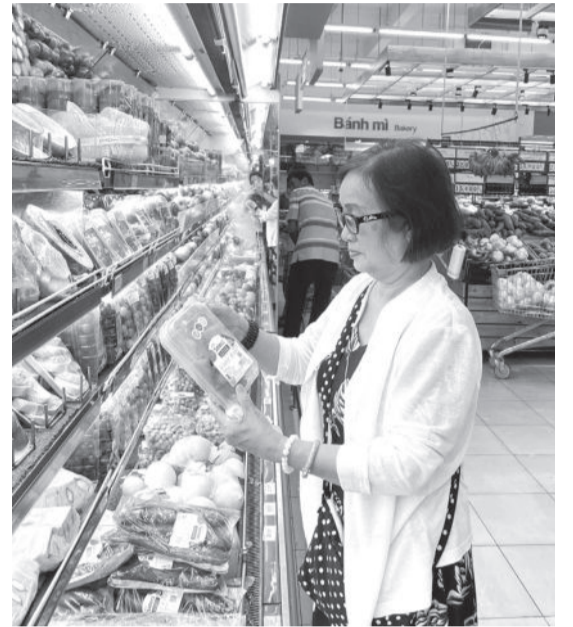
● Người dân mua hàng tại một siêu thị ở Nha Trang.

Bộ Công Thương vừa ban hành Chỉ thị số 12/2024 về việc thực hiện các giải pháp bảo đảm cân đối cung cầu, bình ổn thị trường cuối năm và dịp Tết Nguyên đán Ất Tỵ 2025.