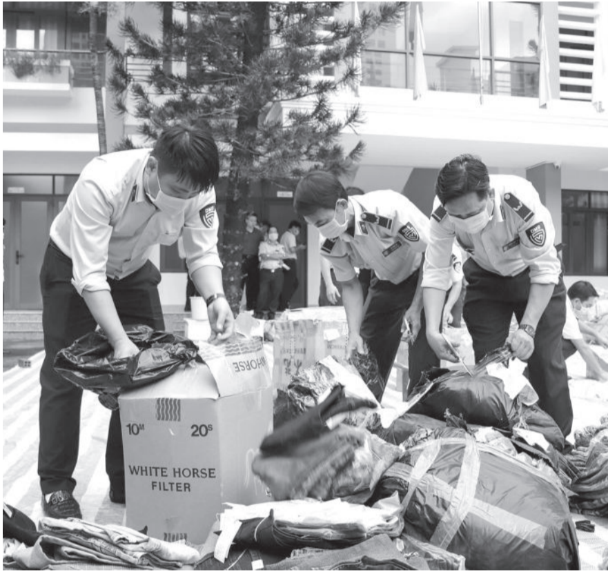
● Lực lượng quản lý thị trường tỉnh tiêu hủy hàng hóa vi phạm.

Nhằm kiểm soát tốt thị trường hàng hóa cuối năm và dịp Tết Nguyên đán, Cục Quản lý thị trường (QLTT) tỉnh đã ban hành kế hoạch cao điểm kiểm tra, kiểm soát thị trường, ngăn chặn hoạt động buôn lậu, gian lận thương mại và hàng giả, hành vi tăng giá bán bất hợp lý, gây bất ổn thị trường. Trong đó, đơn vị sẽ tập trung kiểm tra các tổ chức, cá nhân sản xuất, kinh doanh các mặt hàng thiết yếu có nhu cầu tiêu dùng cao trong dịp cuối năm và Tết Nguyên đán.