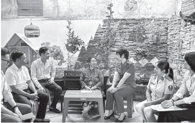
● Đại diện Ban An toàn giao thông TP. Nha Trang thăm hỏi, hỗ trợ gia đình nạn nhân bị tai nạn giao thông ở phường Vĩnh Hòa.

Ngày 27-11, đại diện Ban An toàn giao thông (ATGT) TP. Nha Trang đi thăm hỏi, hỗ trợ các nạn nhân, gia đình nạn nhân bị tai nạn