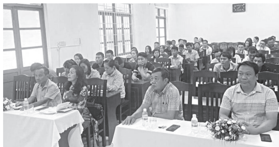
● Đại biểu và học viên dự khai mạc.