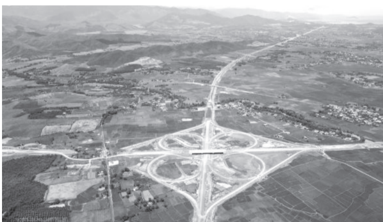
● Một đoạn đường bộ cao tốc Khánh Hòa - Buôn Ma Thuột đang được thi công.

Theo đó, các sở, ban, ngành, UBMTTQ Việt Nam tỉnh, các tổ chức chính trị - xã hội, các tổ chức xã hội, các huyện, thị xã, thành phố, doanh nghiệp và các tầng lớp nhân dân thi đua lao động sáng tạo, hoàn thành đúng tiến độ, vượt kế hoạch, đảm bảo chất lượng các công trình, dự án đường bộ cao tốc trên địa bàn tỉnh theo chỉ đạo của Ban chỉ đạo Nhà nước các công trình, dự án trọng điểm quốc gia, trọng điểm ngành Giao thông vận tải; thi đua thi công, giám sát bảo đảm chất lượng, kỹ thuật, mỹ thuật, vệ sinh môi trường, an toàn lao động, tạo cảnh quan, không gian phát triển của dự án sau khi hoàn thành; thi đua nghiên cứu, ứng dụng khoa học kỹ thuật, công nghệ thông tin,