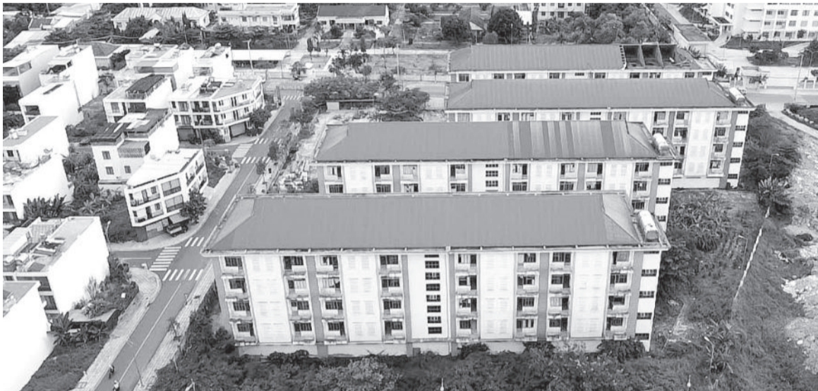
● Ký túc xá sinh viên Nha Trang bị xuống cấp trầm trọng.

Sau thời gian dài bỏ hoang, công trình ký túc xá (KTX) sinh viên (SV) Nha Trang trên đường Nguyễn Khuyến (phường Vĩnh Hải, TP. Nha Trang) đã bị xuống cấp trầm trọng. Cơ quan chức năng đã đề xuất sửa chữa công trình này để tiếp nhận SV vào ở từ năm 2025.