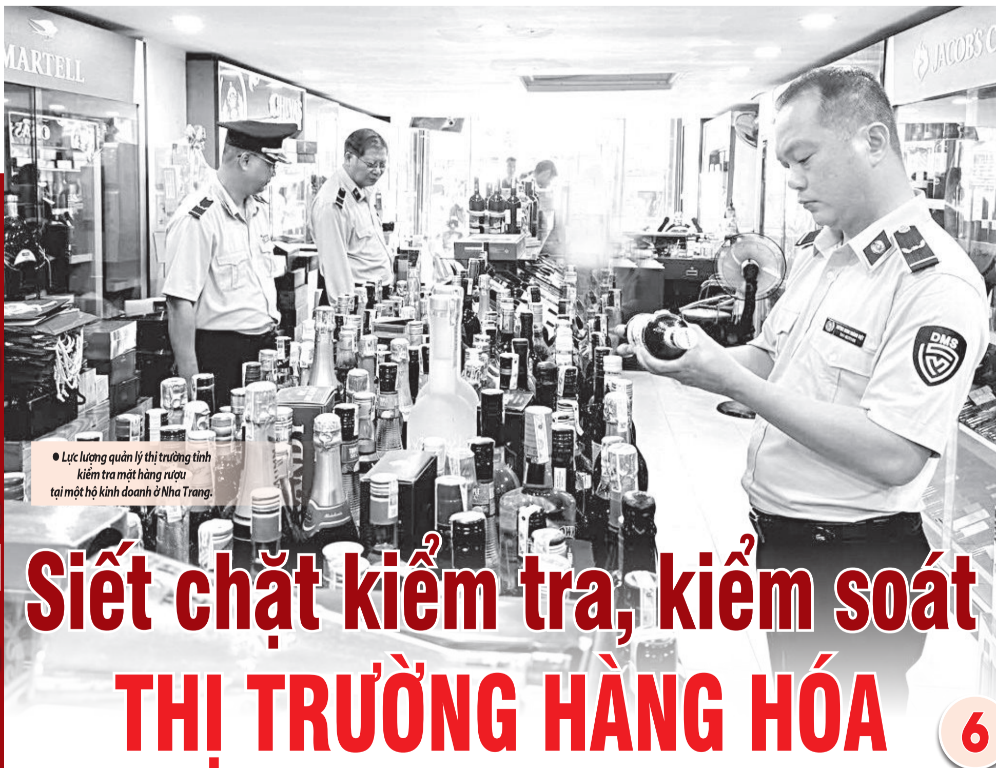
• Lực lượng quản lý thị trường tỉnh kiểm tra mặt hàng rượu tại một hộ kinh doanh ở Nha Trang.

Năm 2025, Công ty TNHH Đóng tàu HD Hyundai Việt Nam sẽ đóng mới 15 tàu, doanh thu dự kiến khoảng 743 triệu USD.