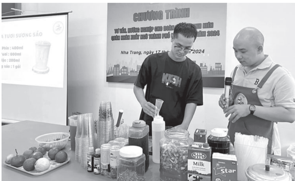
● Hướng dẫn đoàn viên, thanh niên Nha Trang thực hành pha chế đồ uống trong chương trình tư vấn hướng nghiệp, tháng 9-2024.

Ngoài ra, trên địa bàn thành phố còn có một số mô hình “Dân vận khéo” như: Tuyến đường hoa thôn Thái Thông với 300 cây hoàng yến trồng ở 3 thôn: Thái Thông 1, Thái Thông 2, Thủy Tú (xã Vĩnh Thái) được UBMTTQ Việt Nam xã huy động kinh phí từ Mặt trận và nhân dân; Tuyến đường cờ Tổ quốc ở thôn Phú Vinh 2 (xã Vĩnh Thạnh) được UBMTTQ Việt Nam xã vận động nhân rộng sang 2 thôn Phú