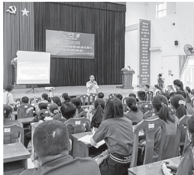
● Tuyên truyền các nội dung về an toàn giao thông cho phụ nữ, đoàn viên.

Sáng 27-11, Hội Liên hiệp Phụ nữ huyện Cam Lâm phối hợp với Huyện đoàn Cam Lâm tổ chức hội nghị tuyên truyền, phổ biến, giáo dục pháp luật về trật tự an toàn giao thông năm 2024.